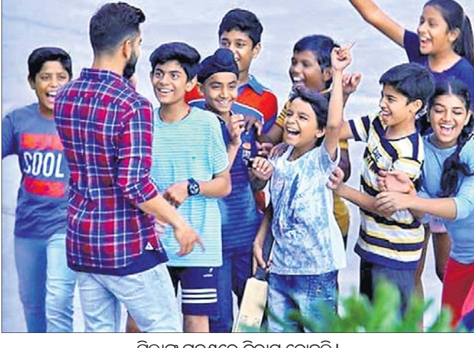
ପିଲାଙ୍କ ଗହଣରେ ବିରାଟ କୋହଲି। ଷ୍ଟେୟାର କଟ୍, ଅର୍ଥ୍ ସାଇଡ୍ ଓ ଷ୍ଟେସ୍ ଆଉଟ୍ କରି ବୋଲର ମୁଣ୍ଡ ଉପରେ ଶର୍ ମାଡୁଥିବା ଦେଖାଯାଇଛି। ଏହାପରେ କୋହଲି ବ୍ୟାଟ୍ ଧରି ଚୋଡ଼ିଥିବାବେଳେ ପିଲାମାନେ ମଧ୍ୟ ତାଙ୍କ ପଛରେ ପଶୁପାଦ୍ୟ କରିଥିଲେ। ତେବେ ଏହା ଏକ ବିଜ୍ଞାପନର ଶୁଣିତ ରହିଥିଲା ବୋଲି ଜଣାପଡ଼ିଛି। ଯେଉଁଥିରେ କୋହଲି ଓ କିଛି ଛୋଟପିଲା ଏକ ଗ୍ରହଣ କରିଥିଲେ। ପ୍ରକାଶକମାନଙ୍କୁ, ବାଂଲାଦେଶ ବିପକ୍ଷ ସାମିତ ଓଭର ସିରିଜକୁ କୋହଲିଙ୍କୁ ପିଲାଙ୍କ ସହିତ କ୍ରିକେଟ୍ ଖେଳୁଛନ୍ତି। କିନ୍ତୁ ଚିଂ-ଶୀର୍ଷ ପରିଧାନ କରି କୋହଲି