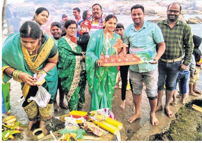
ପୁନିଗୁଡ଼ାରେ ମହିଳା ଓ ପୁରୁଷମାନେ ତୁଙ୍ଗା ଭସାଇବା ପାଇଁ ପୂଜାର୍ଚ୍ଚନା କରୁଛନ୍ତି ।

କାର୍ତ୍ତିକ ପୂର୍ଣ୍ଣିମା ଅବସରରେ ରାୟଗଡ଼ା ଜିଲ୍ଲା ଗୁଣପୁରସ୍ଥିତ ବଂଶଧାରୀ ନଦୀରେ ଶ୍ରଦ୍ଧାଳୁ ତୁଙ୍ଗା ଭସାଇଛନ୍ତି ।