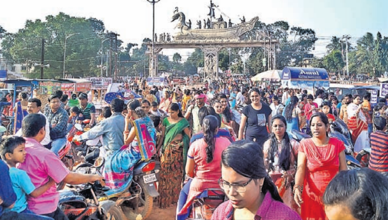
ବାଲିଯାତ୍ରାର ପ୍ରଥମ ଦିନରେ ଗହଳି।