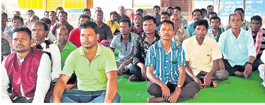
ବୈଠକରେ ଯୋଗ ଦେଇଥିବା ଚତୁର୍ଥ ଶ୍ରେଣୀ କର୍ମଚାରୀମାନେ ।

ପଞ୍ଚାୟତ କାର୍ଯ୍ୟାଳୟ ପରିସରରେ ରବିବାର ଚତୁର୍ଥଶ୍ରେଣୀ କର୍ମଚାରୀ ସଂଘର ଏକ ବୈଠକ ଅନୁଷ୍ଠିତ ହୋଇଯାଇଛି ।