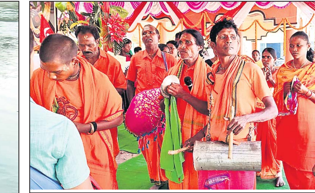
ବାଲୁକେଶ୍ୱର ମନ୍ଦିରରେ ସଂକୀର୍ତ୍ତନ କରାଯାଇଛି ।