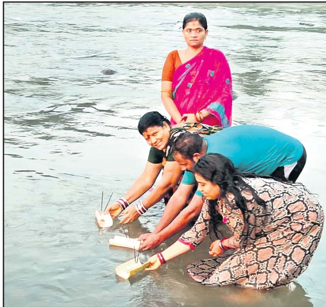
ପୁରୁଷ ଓ ମହିଳାମାନେ ନାଗାବଳୀ ନଦୀରେ ତୁଙ୍ଗା ଭସାଇଛନ୍ତି ।