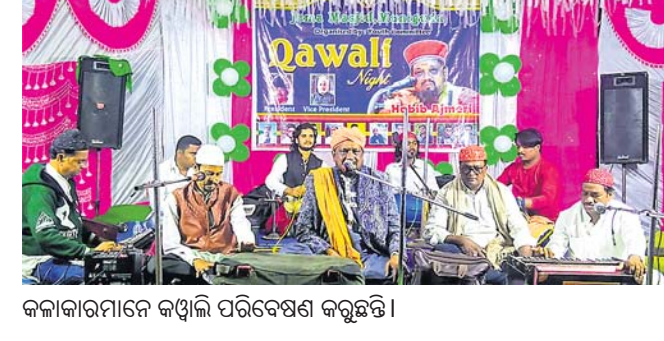
କଳାକାରମାନେ କଢ଼ାଳି ପରିବେଷଣ କରୁଛନ୍ତି ।