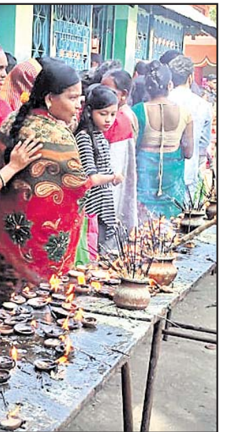
କାର୍ତ୍ତିକ ପୂର୍ଣ୍ଣିମା ଅବସରରେ ରାୟଗଡ଼ା ପିଏବିଡି ଶିବ ମନ୍ଦିରରେ ମହିଳାଙ୍କ ଭିଡ଼ ।