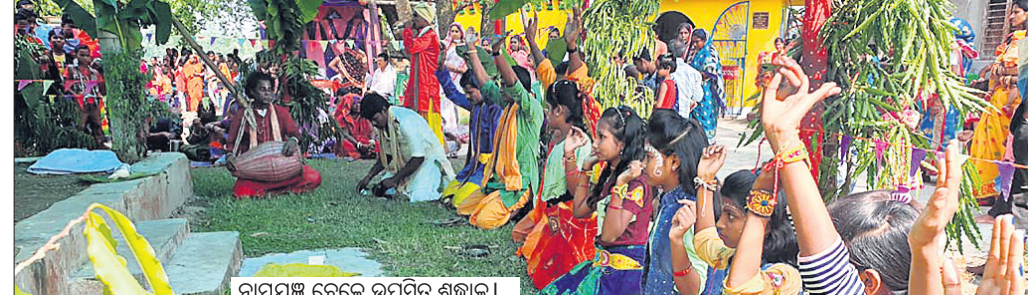
ନାମଯଜ୍ଞ ବେଳେ ଉପସ୍ଥିତ ଶ୍ରଦ୍ଧାଳୁ।

ବାଲେଶ୍ୱର ଜିଲ୍ଲା ସିପୁଲିଆର ପ୍ରସିଦ୍ଧ ଶ୍ରଦ୍ଧାଳୁ ମା’ ଭଗିଆଶୁଣୀଙ୍କ ନିକଟରେ ରାସ ପୂର୍ଣ୍ଣିମା ପାଳନ ଅବସରରେ ନାମଯଜ୍ଞ ଓ ଝାଡ଼ାପତ୍ତା ଗ୍ରାମରୁ ଆସିଥିବା ବ୍ୟକ୍ତିମାନଙ୍କୁ ନାମଯଜ୍ଞ ପ୍ରଦାନ କରାଯାଇଥିଲା।