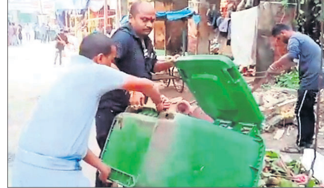
ସଂଗଠନ ଆବାସକ ଲିଡେର ମହାନ୍ତି ସଫେଇ କରୁଛନ୍ତି।

ବାରିପଦା ପୌର ପରିଷଦର ସଫେଇ କାର୍ଯ୍ୟରେ ନିୟୋଜିତ ସଫେଇ କର୍ମଚାରୀମାନେ ଦରମା ପ୍ରଦାନ ଦାବିରେ ମଙ୍ଗଳବାର ଠାରୁ କାର୍ଯ୍ୟବନ୍ଦ ଆନ୍ଦୋଳନ କରିଛନ୍ତି। ଫଳରେ ସହରର ବିଭିନ୍ନ ସ୍ଥାନରେ କୁଡ଼ କୁଡ଼ ଅଲିଆ ଆବର୍ଜନା ପଡ଼ି ରହିଛି। ଘଟଣାରେ ସମାଧାନ କର୍ମକର୍ତ୍ତାମାନେ ସଫା କରିଛନ୍ତି। ମଧ୍ୟ ସହରର ସଫେଇ ପାଇଁ ବିକଳ୍ପ ବ୍ୟବସ୍ଥା ଗ୍ରହଣ କରୁନାହାନ୍ତି। ସାମାଜିକ