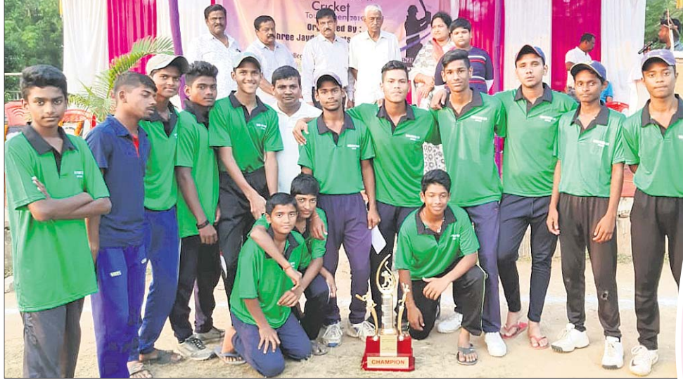
ଚୁପି ସହ ଅତିଥିକ୍ ଗହଣରେ ଚାମ୍ପିୟନ୍ ଯୁନିୟନ ସ୍କୋଟିଂ ଖେଳାଳିମାନେ।