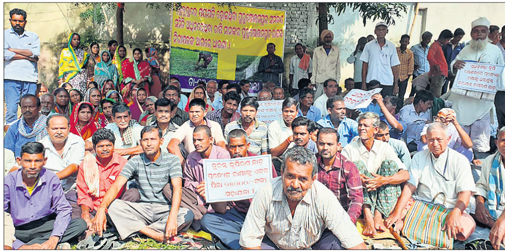
ପୁରୁଷୋତ୍ତମପୁର ଆଞ୍ଚଳିକ କାର୍ଯ୍ୟକ୍ରମ ସମ୍ବନ୍ଧରେ ଚାଷୀଙ୍କ ଗଣଧାରଣା।