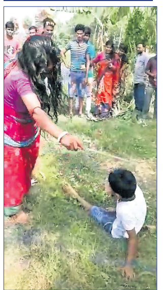
ଭୂତ ଛଡ଼ାଇବା ଲାଗି ନାବାଳକଙ୍କୁ ଧୂଆଁ ଦେବା ପରେ ଗୁଣିଆ ଦମ୍ପତି ପିଟୁଛନ୍ତି ।

ନିର୍ଯାତନା ଦେବା ଘରୋର ଏକ ଭିଡିଓ ଭାଇରାଲ ହୋଇଛି । ଏହାପରେ ପୋଲିସ୍ ଏ ନେଇ ତନାଘନା ଆରମ୍ଭ କରିଛି । ଆନାରେ କେହି କିଛି ଅଭିଯୋଗ କରି ନ ଥିଲେ ମଧ୍ୟ ନିଜିଆଡୁ ପୋଲିସ୍ ଏକ ମାମଲା ପୁସ୍ତା-୪