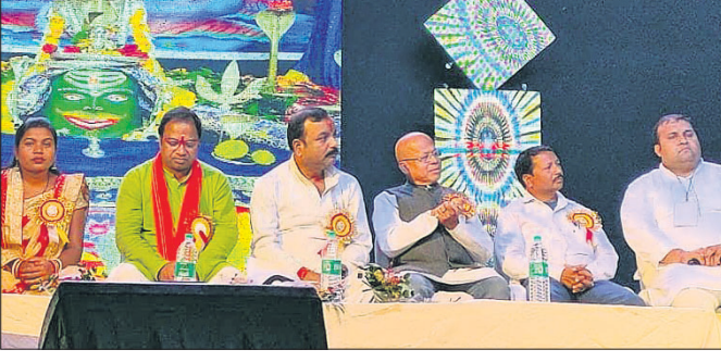
ବୋଇତ ବନ୍ଦା ଉତ୍ସବର ଉଦ୍ଘାଟନା ସମ୍ପାଦକ ଉପସ୍ଥିତ ଅତିଥି ବୃନ୍ଦ।