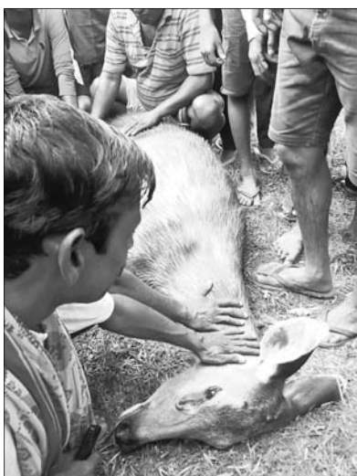
ଉଦ୍ଧାର ହୋଇଥିବା ଶମ୍ଭର।

କେନ୍ଦୁଝର ଜିଲ୍ଲା ହାତଡ଼ିହା ବ୍ଲକ କପୁଣ୍ଡି ଗ୍ରାମରୁ ଏକ ଶମ୍ଭର ଉଦ୍ଧାର ହୋଇଛି। ପ୍ରାୟ ସୂତନାରୁ ଜଣାପଡିଛି ଯେ, ଏକ ମାଛ ଶମ୍ଭର ବୁଧବାର ମଧ୍ୟାହ୍ନ ସମୟରେ ହାତଡ଼ିହା ପଞ୍ଚାୟତର କପୁଣ୍ଡି ଗାଁ ଭିତରକୁ ପଶିଆସିଥିଲା।