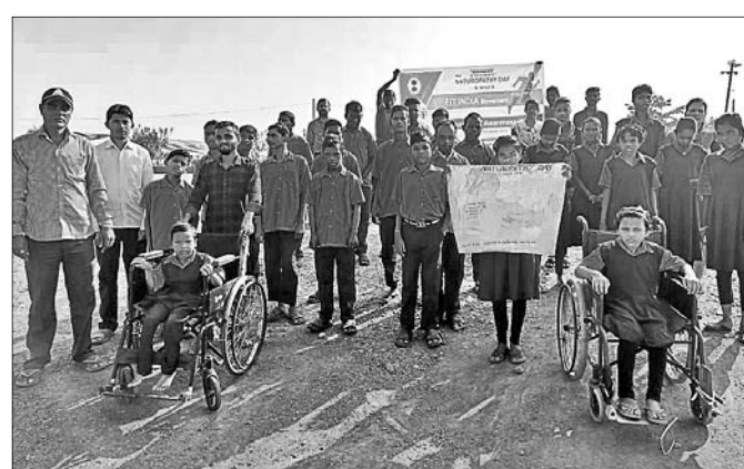
ଗ୍ରାମ ପରିକ୍ରମା କରାଯାଇଛି।

ରାଜସୂଆଁ, ୧୩।୧୧ (ଡି.ଏନ.ଏ.) କେନ୍ଦୁଝର ଜିଲ୍ଲା ସଦର ବ୍ଲକ ଅନ୍ତର୍ଗତ ରାଜସୂଆଁଠାରେ ସ୍ୱେଚ୍ଛାସେବୀ ଅନୁଷ୍ଠାନ ସଦ୍ଭାବନା ଏବଂ ସୂର୍ଯ୍ୟ ପାଠଶାଳା ଦ୍ୱାରା ପ୍ରାକୃତିକ ଚିକିତ୍ସା ସପ୍ତାହ ପାଳିତ ହୋଇଯାଇଛି।