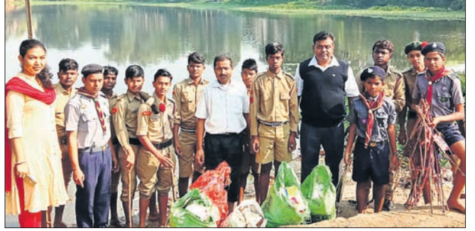
ପୁଷ୍କରିଣୀ ସଫେଇ କାର୍ଯ୍ୟକ୍ରମରେ ଉପସ୍ଥିତ ପ୍ରଧାନ ଶିକ୍ଷୟିତ୍ରୀ ଓ ଛାତ୍ରମାନେ।