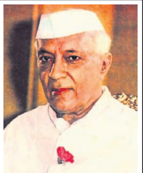
ବିଶିଷ୍ଟ ରାଷ୍ଟ୍ରନାୟକ ତଥା ଦେଶର ପ୍ରଥମ ପ୍ରଧାନମନ୍ତ୍ରୀ ଜବାହରଲାଲ ନେହେରୁଙ୍କ ଜନ୍ମଦିନରେ ଧରତ୍ରୀ ପତ୍ରିକାର ପକ୍ଷରୁ ଶ୍ରଦ୍ଧାଞ୍ଜଳି ।