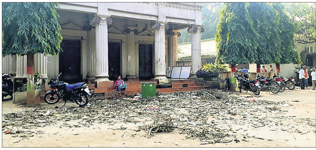
ପୌର କାର୍ଯ୍ୟାଳୟ ପରିସରରେ ପଡ଼ିଥିବା ଅଲିଆ।