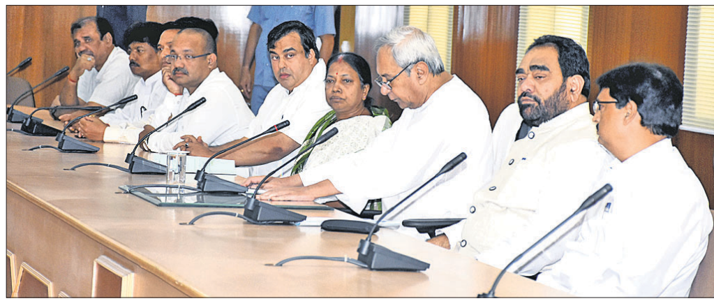
ବିଧାୟକ ଦଳ ବୈଠକରେ ବିଜେଡି ସଭାପତି ତଥା ମୁଖ୍ୟମନ୍ତ୍ରୀ ନବୀନ ପଟ୍ଟନାୟକ ଓ ଅନ୍ୟମାନେ।