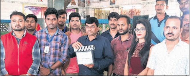
ବରୁଣେଶ୍ୱର ପୀଠରେ କଳାତ୍ମକ ପିଲ୍ଲର ଶୁଭ ମହୁରତ କରାଯାଇଛି।