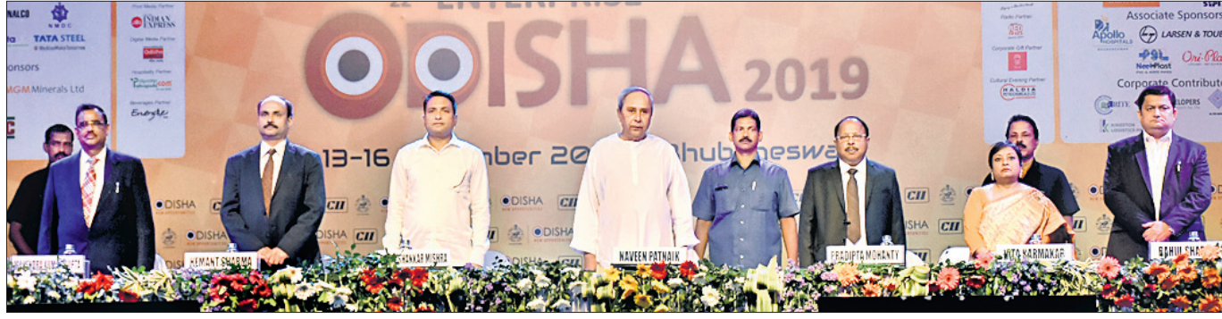
କାର୍ଯ୍ୟକ୍ରମରେ ଉପସ୍ଥିତ ମୁଖ୍ୟମନ୍ତ୍ରୀ ନବୀନ ପଟ୍ଟନାୟକ ଓ ଅନ୍ୟ ଅତିଥି।