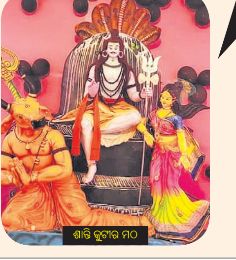
ଶାନ୍ତି କୁମାର ମଠ