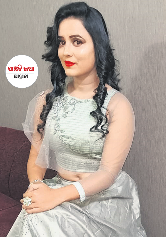
ପାଞ୍ଚଟି କଥା ଆହାର

-ଅଭିନେତ୍ରୀ ହେବାର ନିଷ୍ପତ୍ତି ନିକଟୁ କେତେ ଆତ୍ମପ୍ରେମି ଦେଖନ୍ତି ? ▶ ଆକ୍ସେସ୍ ହେବି ଆଉ ଓଡ଼ିଆ ସିନେମାରେ ଏହାକୁ କ୍ୟାରିୟର କରିବି-ମୋର ଏଭଳି ଚିନ୍ତାଧରଣେ ମୁଁ ହସ୍ତେତ୍ ପରସେକ୍ ସନ୍ତୁଷ୍ଟ। ଏବେ ତ ପାଠପଢ଼ା ଚାଲିଛି। ତେଣୁ ମୋତେ ବାଲାଟୁ କରି ଚଳିବାକୁ ପଡୁଛି। -ଅବସର ମିଳିଲେ କ'ଣ କରିବି ? ▶ ଓ ହୋ, ଅବସର ! କୁହୁନି। ବର୍ତ୍ତମାନ ମୋର ଗାଇଟ ଶିଖୁଣିଲା। ପାଠପଢ଼ା ଚାଲିଛି ପୁଣି ତା' ସହ ଆଜ୍ଞା। ପୁଣି ନିକଟୁ ଫିଲ୍ମ ରଖିବାକୁ ପ୍ରତିଦିନ ଏକ୍ସପେକ୍ଟେସନ୍ ସନ୍ତୁଷ୍ଟ। ଯେତେବେଳେ ମୋତେ ଅବସର ମିଳେ ମୁଁ ଶୋଇବାକୁ ପସନ୍ଦ କରେ। କିଛି ସମୟ ଶୋଇ ପଡିଲେ କି ଶାନ୍ତି ! ଅନ୍ୟପକ୍ଷରେ ଅବସର ମିଳିଲେ ମୁଁ ଯୁ ଟ୍ୟୁବ୍‌ରେ ଭଲ ଭଲ ମେକ‌ଅପ୍ ଷ୍ଟାଇଲ୍, ପେଣ୍ଟିଂ, ଡେମାନ୍‌ଡେଡିଲ୍ ଗେମ୍ ଦେଖିଥାଏ। ସବୁଠାରୁ ଖାସ୍ କଥା ହେଲା ସମୟ ମିଳିଲେ ମୁଁ ଲଙ୍ଗ୍ ଡ୍ରାଇଭରେ ବାହାରିଯାଏ। ଏକ୍ସିଟିଆ ରାସ୍ତାରେ ମନ ପସନ୍ଦର ଗୀତ ଶୁଣି ଗାଡି ଚଲାଇବାର ମଜା ନିଆରା। -କେବେ ମିଛ କହିଛନ୍ତି ? ▶ ଲସ୍, ମିଛ କହିବା ପିଲାଦିନେ ମୋର ଏକ ଅଭ୍ୟାସ ଥିଲା। କେଉଁଠି ଭୁଲ୍ କରିଥିବି ତାକୁ ଲୁଚାଇବାକୁ ମିଛ କହେ। ଲୁଚାଇ କିଛି ଖାଇଦେଇଥିବି, ମୋତେ ପଚାରିଲେ ମୁଁ କୁହେ-ମୁଁ ଖାଇନି କି ଜାଣିନି। ତା' ପରେ କେତେ ଥର ପରିସ୍ଥିତିର ସାମନା କରି ମିଛ କହିଛି। ହେଲେ ବଡ଼ ହେବା ପରେ ଜାଣିପାରିଲି ଯେ ମିଛ କହିବା ସବୁଠାରୁ ବଡ଼ ଭୁଲ୍। -ଏ ପର୍ଯ୍ୟନ୍ତ କିଛି ଅବସୋସ ରହିଛି କି ? ▶ ଅବସୋସ ତ ନିଶ୍ଚୟ ରହିଛି। ମୋ ଆଜ୍ଞା ଲାଜପତ୍ତୁ ନେଇ ବଡ଼ ଆଶା ରହିଛି। କେବଳ ଓଡ଼ିଆ ସିନେମା ନୁହେଁ, ହିନ୍ଦୀ କିମ୍ବା ଅନ୍ୟ ପ୍ରାନ୍ତୀୟ ଭାଷାରେ ନିର୍ମିତ ହେଉଥିବା ଚଳଚ୍ଚିତ୍ରରେ ମୋତେ ଯଦି ସେପରି ଭଲ ସୁଯୋଗ ମିଳେ ତେବେ ତାହାକୁ କେବେ ହାତେଇବା କରିବି ନାହିଁ। ମୁଁ ନିକଟୁ କେବଳ ରୋମାଣ୍ଟିକ ରୋଲ୍‌ରେ