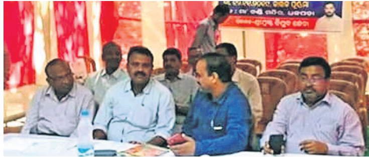
ଭୁବନ, ୧୩୧୧୧ (ଡି.ଏନ.ଏ.)

ଡେକାନାଲ ଜିଲ୍ଲା ଭୁବନ ବ୍ଲକ୍ ଧଳପଡ଼ାସ୍ଥିତ ମା' ଚଣ୍ଡୀଙ୍କ ପୀଠରେ ୮ବାର୍ଷିକ ଉତ୍ସବ ମଙ୍ଗଳବାର ଅନୁଷ୍ଠିତ ହୋଇଯାଇଛି। ଏହି ଅବସରରେ ଭାଷା ଏବଂ ପରମ୍ପରାକୁ