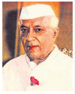
ବିଶିଷ୍ଟ ରାଷ୍ଟ୍ରନାୟକ ତଥା ଦେଶର ପ୍ରଥମ ପ୍ରଧାନମନ୍ତ୍ରୀ ଜବାହରଲାଲ ନେହେରୁଙ୍କ ଜନ୍ମଦିନରେ ଧାରତ୍ରି ପତାକା ପରିଚାର ପକ୍ଷରୁ ଶ୍ରଦ୍ଧାଞ୍ଜଳି ।