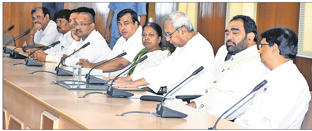
ବିଧାୟକ ଦଳ ବୈଠକରେ ବିଜେଡି ସଭାପତି ତଥା ମୁଖ୍ୟମନ୍ତ୍ରୀ ନବୀନ ପଟ୍ଟନାୟକ ଓ ଅନ୍ୟମାନେ।