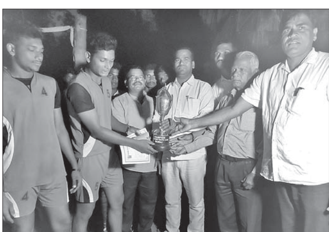
ଚାମ୍ପିୟନ ଦଳକୁ ଅତିଥି ପୁରସ୍କୃତ କରୁଛନ୍ତି।