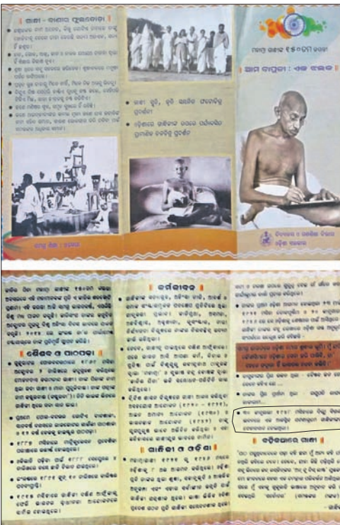
କ୍ଷାତ୍ରାହୀନତାକୁ ବ୍ୟାୟାୟାଇବା ଲିଫ୍ଲେଟ୍।

ମିଥ୍ୟା ତଥ୍ୟର ସଂଶୋଧନ ଦାବି କଲା ବୁକ୍ ସଙ୍ଗଠନ