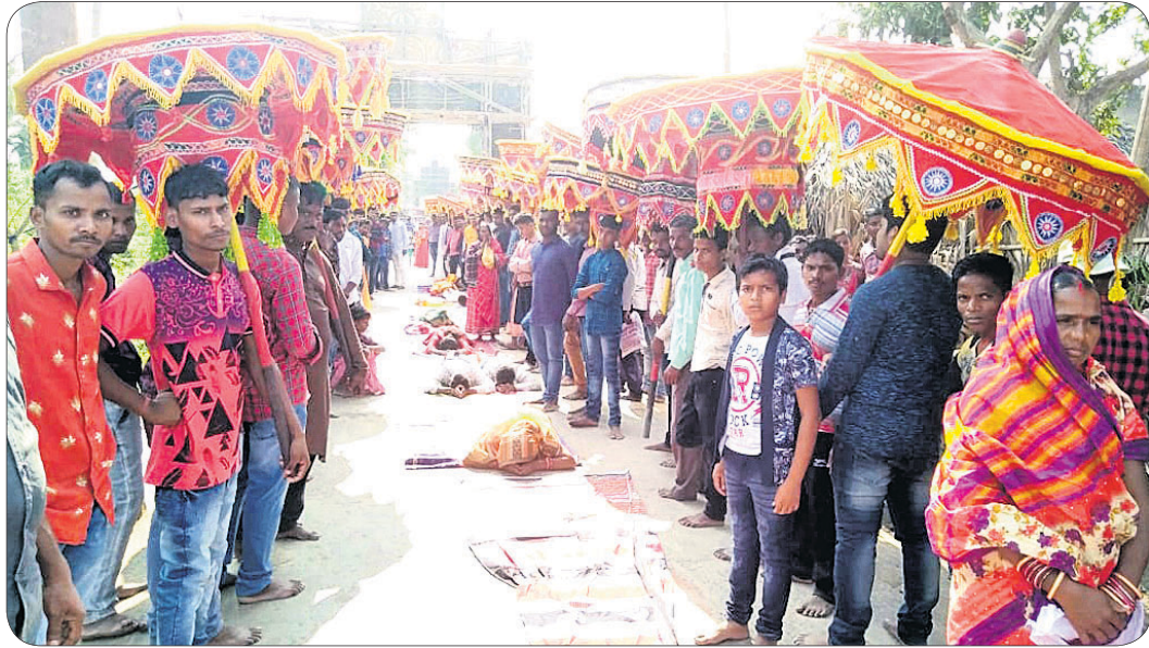
ମା'ଙ୍କ ନିକଟରେ ଭକ୍ତମାନେ ଅଧିଆ ପଡ଼ିଛନ୍ତି।

ଅନୁଗୋଳ ଜିଲ୍ଲା ବଅଁରପାଳ ବ୍ଲକ୍ ଗଡ଼ସନ୍ତାଠାରେ ଚାଲିଥିବା ମା' ଲୋଭା ଠାକୁରାଣୀଙ୍କ ଯାତ୍ରାର ଦ୍ୱିତୀୟ ଦିବସ ପ୍ରଥମ ଦିନ ପରି ମା'ଙ୍କ ଏହି ଯାତ୍ରା ଦେଖିବାକୁ ଆଖପାଖ ଅଞ୍ଚଳର ବହୁ ସଂଖ୍ୟକ ଭକ୍ତ ଭିଡ଼ ଲଗାଇଥିଲେ। ସକାଳେ ପାଠସ୍ଥଳୀରେ ମା'ଙ୍କ ଯାତ୍ରାଟି ପୂଜାର୍ଚ୍ଚନା କରାଯାଇଥିଲା। ଶ୍ରଦ୍ଧାଳୁମାନେ ଧାଡ଼ିରେ ଆସି ମା'ଙ୍କ ଦର୍ଶନ କରିଥିଲେ। ଯାତ୍ରାରେ ଶଶିହରୁ ଉର୍ଦ୍ଧ୍ୱ ଦୋକାନ ବଜାର ପଡ଼ିଛି। ମନୋହରି, ପିତ୍ତଳ ସାମଗ୍ରୀ, ପୋଷାକ ଦୋକାନ ସହ ବିଭିନ୍ନ ପ୍ରକାର ଖାଦ୍ୟ ବିକ୍ରି କରାଯାଇଛି। ବିଭିନ୍ନ ସାମଗ୍ରୀ କିଣିବା ସହ ଲୋକେ ଖାଇବା ଜିନିଷର