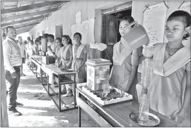
ଛାତ୍ରାଛାତ୍ରୀମାନେ ସେମାନଙ୍କ ପ୍ରକଳ୍ପ ପ୍ରଦର୍ଶନ କରୁଛନ୍ତି।