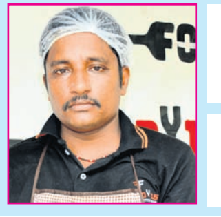
ଶ୍ରେୟ ଅର୍ଜୁନ ପ୍ରସ୍ତୁତି ବି. ଶଙ୍କର

ଡିକେନ୍: ୧ କେଜି ପିଆଜ: ୮ଟି କାକୁ: ୧୨ଟି ଦହି: ଏକ କପ୍ ରସୁଣ ପେଷ୍ଟ: ୨ ଚାମଚ୍ ବାସ୍‌ମତୀ ଚାଉଳ: ୫୦୦ ଗ୍ରାମ୍ ତେଲ: ୪ ଚାମଚ୍ ଲବଙ୍ଗ: ୭ଟି ତାଲଚିନି: ୨ ଖଣ୍ଡ ଲାଲଚି: ୫ଟି ଧନିଆ ଗୁଣ୍ଡ: ୧ ଚାମଚ୍