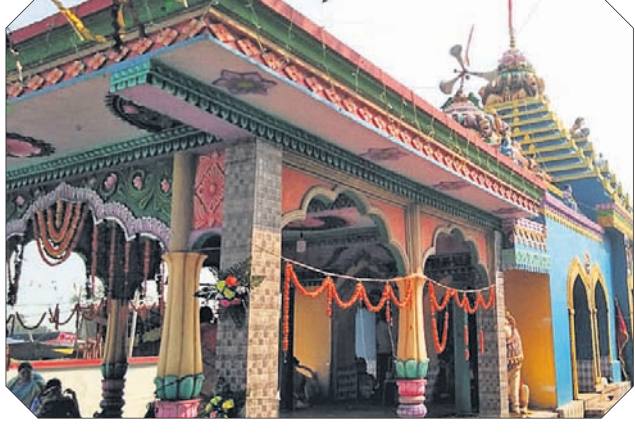
ମା' ଲୋଭା ଠାକୁରାଣୀଙ୍କ ପିଠସ୍ଥଳୀ।