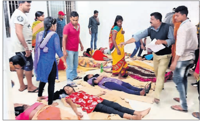
ବାଲେଶ୍ୱର ଜିଲ୍ଲା ମୁଖ୍ୟ ଡାକ୍ତରଖାନାରେ ଭର୍ତ୍ତି ହୋଇଥିବା ଅସୁସ୍ଥମାନେ ।