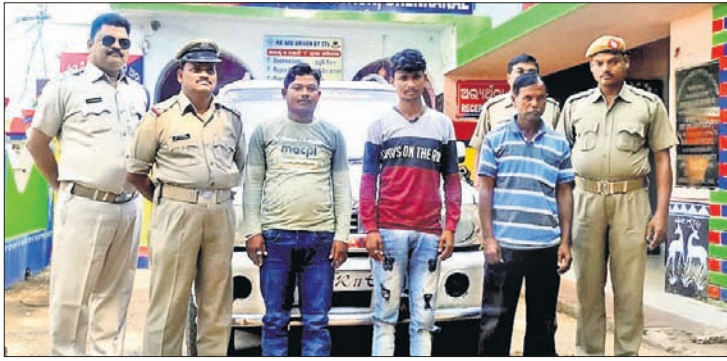
ଗୋରୁଚୋରି ର୍ୟାକେଟରେ ସମ୍ପୃକ୍ତ ଗିରଫ ଅଭିଯୁକ୍ତ।