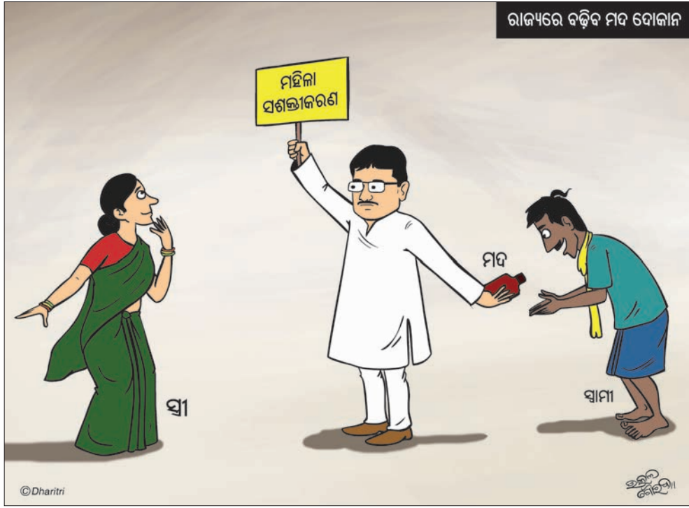
ରାଜ୍ୟରେ ବହିଷ୍କୃତ ମତ ଦେବାକାଳ