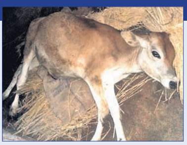
ଦେହବର୍ଷ ହେଲା ନାହାନ୍ତି ପ୍ରାଣୀଧନ ନିରୀକ୍ଷକ