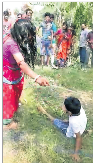
ଭୂତ ଛଡ଼ାଇବା ଲାଗି ନାବାଳକଙ୍କୁ ଧୂଆଁ ଦେବା ପରେ ଗୁଣିଆ ଦମ୍ପତି ପିଟୁଛନ୍ତି ।

ନିର୍ଯ୍ୟାତନା ଦେବା ଘଟଣାର ଏକ ଭିଡିଓ ଭାଇରାଲ ହୋଇଛି । ଏହାପରେ ପୋଲିସ୍ ଏ ନେଇ ତଦାସନା ଆରମ୍ଭ କରିଛି । ଆନାରେ କେହି କିଛି ଅଭିଯୋଗ କରି ନ ଥିଲେ ମଧ୍ୟ ନିଆଁ ଧୁଆଁ ପୋଲିସ୍ ଏକ ମାମଲା ।