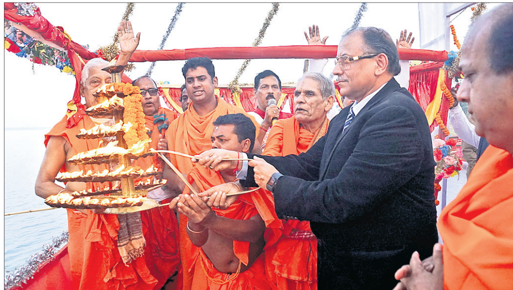
କଟକ ବାଲିଯାତ୍ରା ତଳ ପଡିଆ ମହାନଦୀ ତଟଠାରେ ବୁଧବାର ଆଳତୀ କରୁଛନ୍ତି ଓଡ଼ିଶା ହାଇକୋର୍ଟର ମୁଖ୍ୟ ବିଚାରପତି କେ.ଏସ. ଝାବେର।