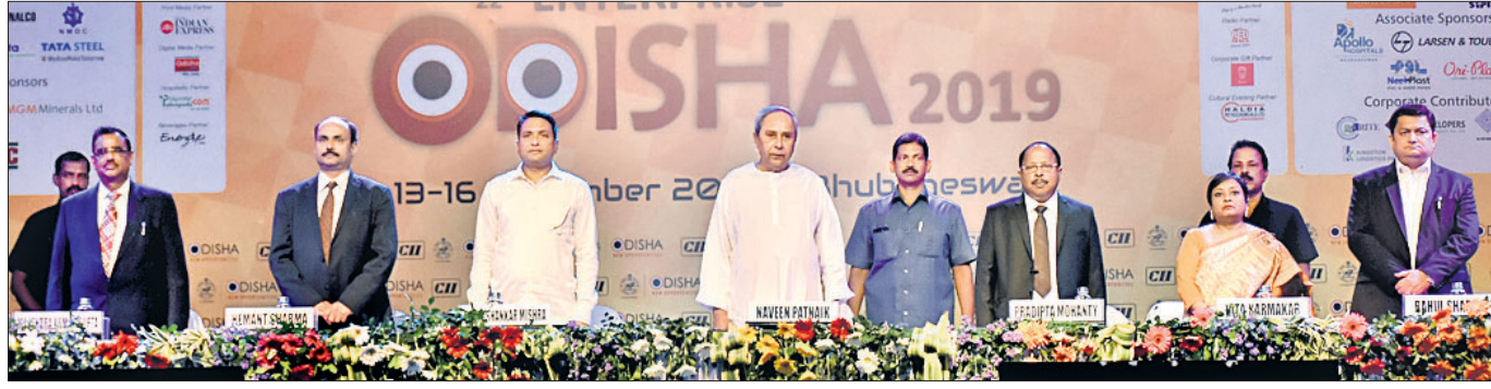
କାର୍ଯ୍ୟକ୍ରମରେ ଉପସ୍ଥିତ ମୁଖ୍ୟମନ୍ତ୍ରୀ ନବୀନ ପଟ୍ଟନାୟକ ଓ ଅନ୍ୟ ଅତିଥି।