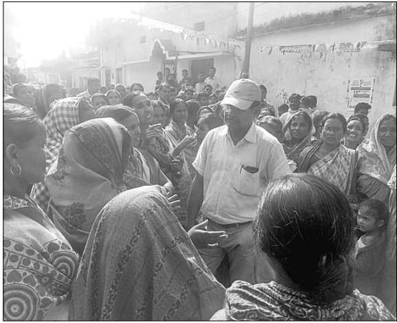
ଉପଜିଲ୍ଲାପାଳ ସମ୍ମୁଖେ ମିଶ୍ରଙ୍କୁ ପୁରପୁର ଗ୍ରାମବାସୀ ଅଟକ ରଖିଛନ୍ତି।

ଲୋକସଂହାର, ୧୪୧୧(ଡି.ଏନ.ଏ.): ବଲାଙ୍ଗୀର ଜିଲ୍ଲା ଆଗଲପୁର ବ୍ଲକ୍ ପୁରପୁର ପଞ୍ଚାୟତର ସଦର ଗାଁ ପୁରପୁରରେ ବିଭିନ୍ନ ଉନ୍ନୟନ କାମରେ ଅନିୟମିତତା ହୋଇଥିବା ନେଇ ଜିଲ୍ଲା ପ୍ରଶାସନ ନିକଟରେ ଅଭିଯୋଗ ହୋଇଥିଲା।