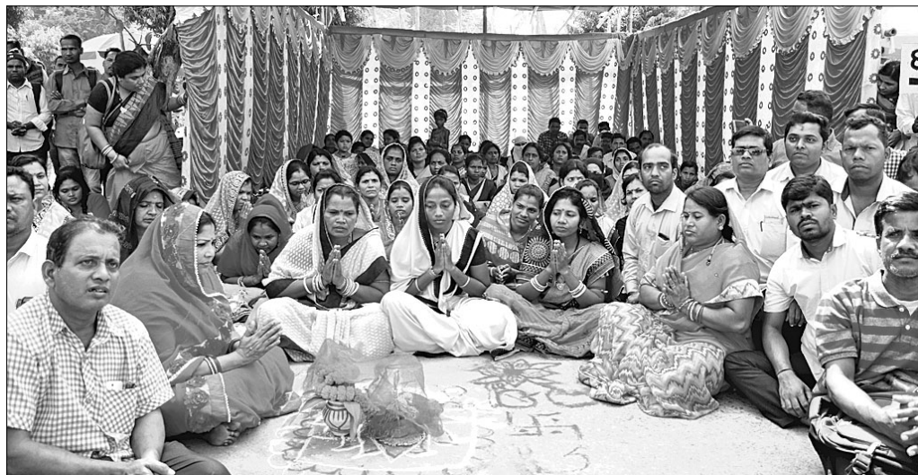
୨୦୧୨ ବ୍ୟାଞ୍ଚ ୩ ହଜାର ଅଣ ଓରିଡ଼ ଶିକ୍ଷକଙ୍କୁ ନିୟମିତ କରିବା ଦାବିରେ ପିଏମ୍‌ଫ୍‌ଓରେ ଅଭିନବ ପ୍ରତିବାଦୀ