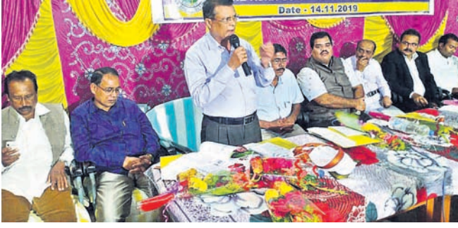
ସମବାୟ ସପ୍ତାହ କାର୍ଯ୍ୟକ୍ରମରେ ମଞ୍ଚାସୀନ ଅତିଥି ।