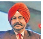
-ବି.ଏସ୍. ଧନୋଆ, ଭାରତୀୟ ବାୟୁସେନାର ପୂର୍ବତନ ମୁଖ୍ୟ

ସୁପ୍ରିମକୋର୍ଟ ରାୟ ଜାତୀୟ ନିରାପତ୍ତା ଦିଲ୍ଲୀ। ଦେଶକୁ ବିଭ୍ରାଣ କରିଥିବା କଂଗ୍ରେସ ଓ ଏହାର ନେତା ରାଷ୍ଟ୍ରୀୟ ଗାନ୍ଧୀ କ୍ଷମାପାରିବାକୁ।