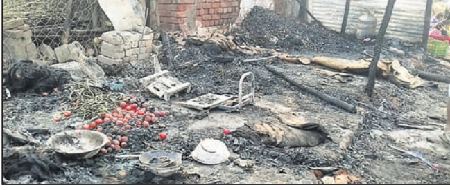
ପୋଡ଼ି ଯାଇଥିବା ଗୋଦାମ ।