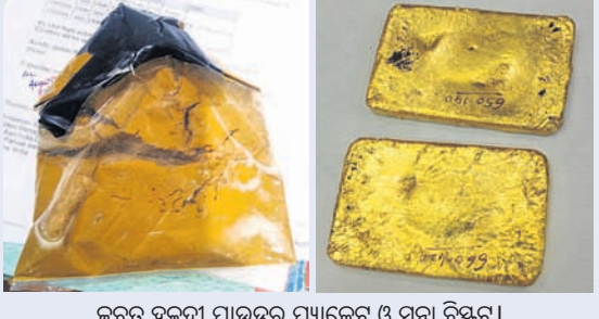
ଜବତ ହେଲା ପାଉଡ଼ର ପ୍ୟାକେଟ ଓ ସୁନା ବିଷ୍କୁଟ।