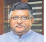
-ରବିଶଙ୍କର ପ୍ରସାଦ, ଆଇନ ଓ ଆଇଟି ମନ୍ତ୍ରୀ

ସୁପ୍ରିମକୋର୍ଟ ରାୟ ଜାତୀୟ ନିରାପତ୍ତା ଦିଲ୍ଲୀ। ଦେଶକୁ ବିଭ୍ରାଣ କରିଥିବା କଂଗ୍ରେସ ଓ ଏହାର ନେତା ରାଷ୍ଟ୍ରୀୟ ଗାନ୍ଧୀ କ୍ଷମାପାରିବାକୁ।