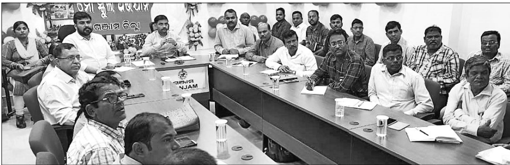
ବୈଠକରେ ଉପସ୍ଥିତ ଜିଲାପାଳ ଓ ଅନ୍ୟମାନେ ।