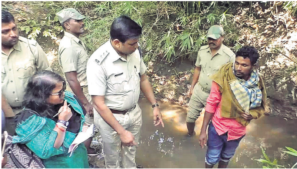
ମାଜିଷ୍ଟ୍ରେଟ୍ ଓ ପୋଲିସ୍ ଅଧିକାରୀଙ୍କ ଉପସ୍ଥିତିରେ ଅଭିଯୁକ୍ତ କଟାମୁଣ୍ଡ ପୋଡ଼ିଥିବା ସ୍ଥାନ ଦେଖାଉଛି।