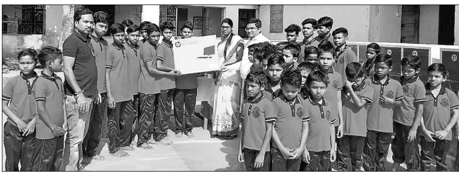
ଜିଲାପାଳଙ୍କ ସହ ପିଲାମାନେ ।