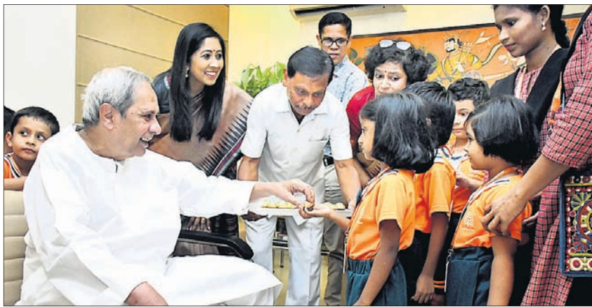
ଶିଶୁଦିବସ ଅବସରରେ କୁଟ୍ରି କୁଟ୍ରି ପିଲାଙ୍କ ଗହଣରେ ମୁଖ୍ୟମନ୍ତ୍ରୀ ନରୀନ ପଟ୍ଟନାୟକ।

ଭୁବନେଶ୍ୱର, ୧୪।୧୧(ବୁଧବେଳା) ପରେ ସନ୍ଧ୍ୟାରେ ଦି ଓଡ଼ିଆ ଟ୍ରଷ୍ଟ ଗୋଦାଳା ସ୍କୁଲର ପିଲାମାନେ ଲୋକସଭା ଭବନରେ ମୁଖ୍ୟମନ୍ତ୍ରୀଙ୍କୁ ଭେଟିଥିଲେ। ଏହି ଅବସରରେ ପିଲାମାନଙ୍କ ସହ ମୁଖ୍ୟମନ୍ତ୍ରୀ ବେଶ୍ କିଛି ସମୟ ହସଖୁସିରେ କଟାଇଥିଲେ। ପରେ ମୁଖ୍ୟମନ୍ତ୍ରୀ ସ୍କୁଲ ପକ୍ଷରୁ ପ୍ରସ୍ତୁତ 'ନିଶ୍ଚଳ ପଲ୍ଲୀ' ପୋଷ୍ଟର ଉନ୍ମୋଚନ କରିଥିଲେ। ପିଲାମାନେ ମୁଖ୍ୟମନ୍ତ୍ରୀଙ୍କୁ ଏହି ଉପଲକ୍ଷେ ପଲ୍ଲୀ ଗାଣି ଦେଇଥିଲେ।