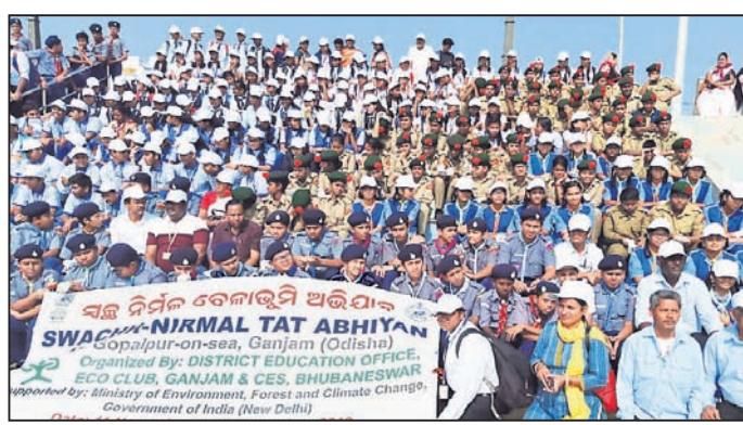
କାର୍ଯ୍ୟକ୍ରମରେ ଉପସ୍ଥିତ ଅତିଥି ଓ ଛାତ୍ରାଛାତ୍ରୀ ।