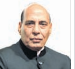
-ରାଜନାଥ ସିଂ, ପ୍ରତିରକ୍ଷାମନ୍ତ୍ରୀ

ପ୍ରଧାନମନ୍ତ୍ରୀ ନରେନ୍ଦ୍ର ମୋଦିଙ୍କୁ ଭାବପୂର୍ଣ୍ଣ ମିଳନ କରିବା ପାଇଁ ରାଷ୍ଟ୍ରୀୟ ଚୁକ୍ତିରେ ଦୁର୍ନୀତି ହୋଇଥିବା ଅଭିଯୋଗ ଅଣାଯାଇଥିଲା। କଂଗ୍ରେସ କ୍ଷମାପାରିବା ଉଚିତ।