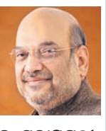
-ଅମିତ୍ ଶାହ, ସ୍ୱରାଷ୍ଟ୍ରମନ୍ତ୍ରୀ

ଭାଜପା ସରକାର ବିରୋଧରେ ଭିତ୍ତିହୀନ ଅଭିଯୋଗ ଆଣି ଅପପ୍ରଚାର ଚଳାଇଥିବା କଂଗ୍ରେସ ଓ ଏହାର ନେତାମାନଙ୍କ ପାଇଁ ସୁପ୍ରିମକୋର୍ଟ ରାୟ ଏକ ପୂର୍ଣ୍ଣଚୋଡ଼ି କରାବ। ସେମାନେ କ୍ଷମାପାରିବା ଉଚିତ। ଏହି ରାୟ ନରେନ୍ଦ୍ର ମୋଦି ସରକାରଙ୍କ ଦୁର୍ନୀତିଗୁଡ଼ିକ ଓ ସ୍ୱଳ୍ପ ବିଶ୍ୱସନାୟତର ପ୍ରମାଣ ଦେଇଛି।