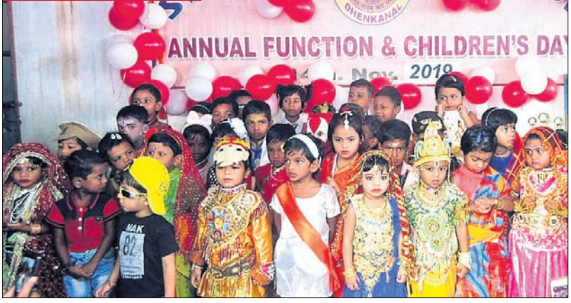
ଦେଶାନ୍ତରୀଣ ସହର ଉପକଣ୍ଠ କାଠଗଡ଼ାସ୍ଥିତ ସ୍ଫୁର୍ତ୍ତୀ ପବ୍ଲିକ୍ ସ୍କୁଲର ବାର୍ଷିକ ଉତ୍ସବ ଗୁରୁବାର ମହାସମାରୋହରେ ପାଳିତ ହୋଇଯାଇଛି। ଏହି ଅବସରରେ ଛାତ୍ରାଛାତ୍ରୀମାନେ ବିଭିନ୍ନ ବେଶରେ ସୁସଜ୍ଜିତ ହୋଇଛନ୍ତି।