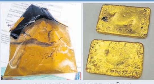
ଜବତ ହେଲା ପାଉଡର ପ୍ୟାକେଟ ଓ ସୁନା ବିଷ୍ଣୁଟ।