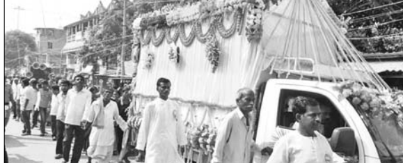
ବିଗ୍ରହକୁ ସହର ପରିକ୍ରମା କରାଯାଇଛି ।

ବାସୁଦେବପୁର, ୧୪୧୧୧(ଡି.ଏନ.ଏ.) ବାସୁଦେବପୁରସ୍ଥିତ ସର୍ବଜ୍ଞ ବିହାର ପରିସରରେ ଗୁରୁବାର ଶ୍ରୀଗ୍ରୀଠାକୁର ଅନୁକୂଳଚକ୍ର ଭବ୍ୟ ମନ୍ଦିର ଓ ବିଗ୍ରହ ପ୍ରତିଷ୍ଠା ଉତ୍ସବ ଅନିର୍ଦ୍ଦୟତ ଚକ୍ରବର୍ତ୍ତୀଙ୍କ ଦ୍ୱାରା ଅନୁଷ୍ଠିତ ହୋଇଯାଇଛି । ସକାଳେ ବେଦମାନ୍ତ୍ରଣ, ନନ୍ଦବତ, ସମବେତ ଉଷା ବିନତି, ଗ୍ରହପାଠ, ପ୍ରଣାମ ଆଦି ବିଭିନ୍ନ ଆଧ୍ୟାତ୍ମିକ କାର୍ଯ୍ୟକ୍ରମ