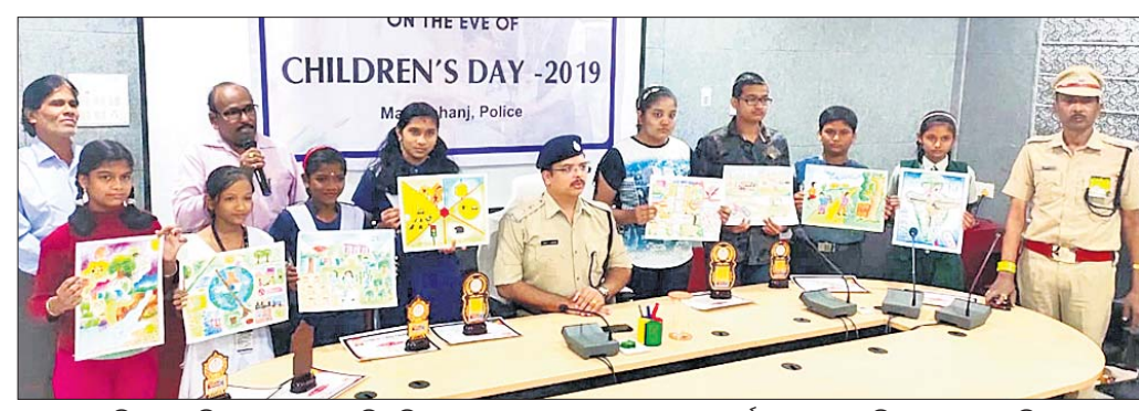
ମୟୂରଭଞ୍ଜ ଜିଲ୍ଲା ପୋଲିସ ମୁଖ୍ୟାଳୟରେ ଶିଶୁ ଦିବସରେ ସଡ଼କ ସୁରକ୍ଷା ସଚେତନତା କାର୍ଯ୍ୟକ୍ରମରେ ଏସ୍ପିଙ୍କ ସହ କୃତୀ ପ୍ରତିଯୋଗୀ।