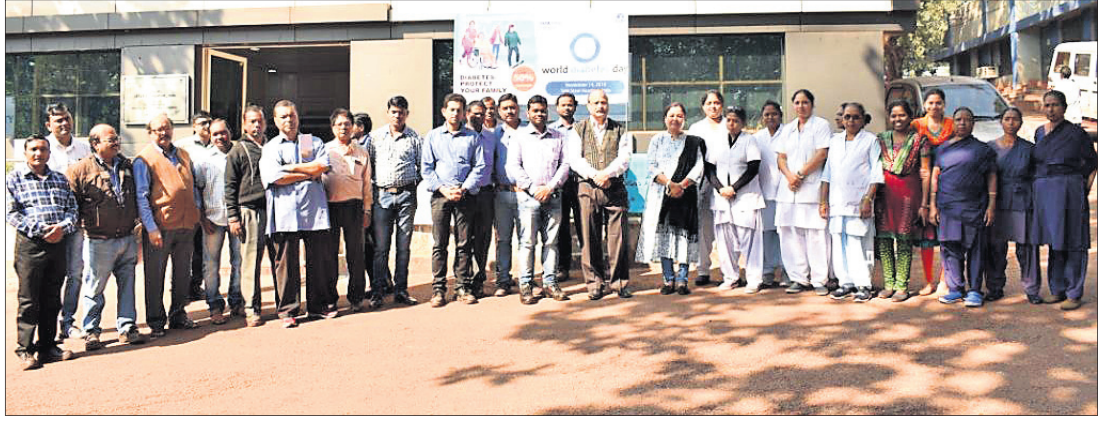
କାର୍ଯ୍ୟକ୍ରମରେ ଉପସ୍ଥିତ ଅତିଥି ଏବଂ ଅନ୍ୟ କର୍ମଚାରୀ ।