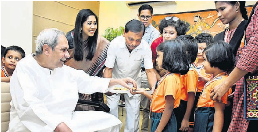
ଶିଶୁଦିବସ ଅବସରରେ କୁଟ୍ଟି କୁଟ୍ଟି ପିଲାଙ୍କ ରହଣରେ ମୁଖ୍ୟମନ୍ତ୍ରୀ ନରୀନ ପଟ୍ଟନାୟକ।

ଭୁବନେଶ୍ୱର, ୧୪।୧୧(ବୁଧବେଳା) ପରେ ସନ୍ଧ୍ୟାରେ ଦି ଓଡ଼ିଆ ଟ୍ରଷ୍ଟ ଗୋଦାଳା ସ୍କୁଲର ପିଲାମାନେ ଲୋକସଭା ଭବନରେ ମୁଖ୍ୟମନ୍ତ୍ରୀଙ୍କୁ ଭେଟିଥିଲେ। ଏହି ଅବସରରେ ପିଲାମାନଙ୍କ ସହ ମୁଖ୍ୟମନ୍ତ୍ରୀ ବେଶ୍ କିଛି ସମୟ ହସଖୁସିରେ କଟାଇଥିଲେ। ପରେ ମୁଖ୍ୟମନ୍ତ୍ରୀ ସ୍କୁଲ ପକ୍ଷରୁ ପ୍ରସ୍ତୁତ ପକ୍ଷରୁ ଆରମ୍ଭ ହେଉଥିବା 'ନିଶ୍ଚଳ ପିଲା' ପୋଷ୍ଟର ଉନ୍ମୋଚନ କରିଥିଲେ। ପିଲାମାନେ ମୁଖ୍ୟମନ୍ତ୍ରୀଙ୍କୁ ଏହି ଉପଲକ୍ଷେ ପିଲାଶିଳ୍ପ ପ୍ରଦର୍ଶନ କରିଥିଲେ।