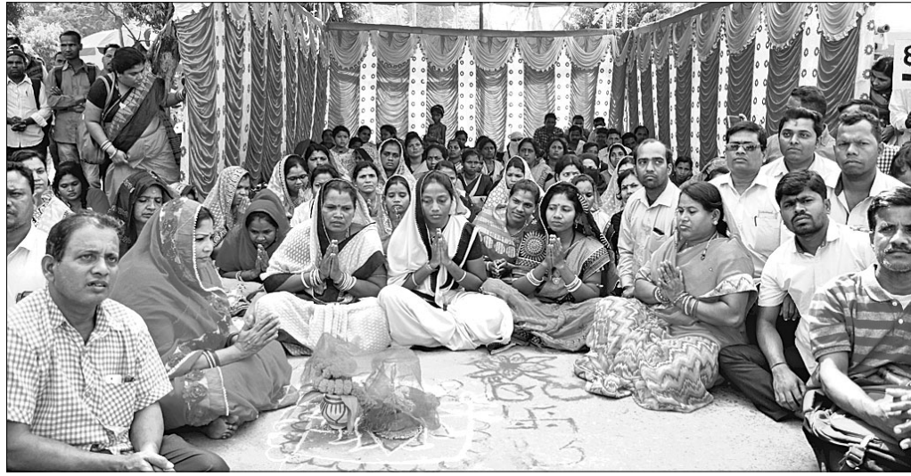
୨୦୧୨ ବ୍ୟାଞ୍ଚ ୩ ହଜାର ଅଣ ଓଡ଼ିଆ ଶିକ୍ଷକଙ୍କୁ ନିୟମିତ କରିବା ଦାବିରେ ପିଏମ୍‌ଜିଠାରେ ଅଭିନବ ପ୍ରତିବାଦୀ

ଇସ୍ତୁ ଗୋଟିଏ ମାତ୍ର ବିରୋଧୀ ଦୁଇଫାଳ। ଗତ ଅଧିବେଶନ ଭଳି ଚଳିତ ଅଧିବେଶନରେ ମଧ୍ୟ ମୁଖ୍ୟ ବିରୋଧୀ ଭାଜପା ଓ କଂଗ୍ରେସ ପୃଥକ ଜଙ୍ଗଲରେ ସରକାରଙ୍କୁ ବିରୋଧ କରୁଛନ୍ତି। କଂଗ୍ରେସ ଆଲୋଚନା କରିବାକୁ ଚାହଁବା ବେଳେ ଭାଜପା ହଇଗୋଳରେ ମାଡ଼ିଯାଇଛି। ଦୁଇ ବିରୋଧୀଙ୍କ ମଧ୍ୟରେ ତାଳମେଳ ନାହିଁ। ବିଷୟବସ୍ତୁ ସମାନ ହୋଇଥିଲେ ମଧ୍ୟ ଏକତା ଅଭାବକୁ ବିରୋଧୀ ସରକାରଙ୍କଠାରୁ କେହି ଚଳିତ ତଳସ କରିବାରେ ବିଫଳ ହେଉଛନ୍ତି। କଳିଙ୍ଗକୁ ଗୋଳି ପାଣି ସୁଧାଇବା ଭଳି ସରକାରଙ୍କୁ ମଧ୍ୟ ଏହା ବେଶ୍ ସୁଧାଇଛି। ଚଳିତ ବିଧାନସଭା ଅଧିବେଶନ ଆରମ୍ଭରୁ ଗୃହରେ ଏଭଳି ଅଭାବନୀୟ ଦୃଶ୍ୟ ଦେଖିବାକୁ ମିଳିଛି। ଅଧିବେଶନର ପ୍ରଥମ ଦିବସରେ ଉଭୟ କଂଗ୍ରେସ ଓ ଭାଜପା ପୃଥକ ମୁଲତରୀ ପ୍ରସ୍ତାବ ଦେଇଥିଲେ। କଂଗ୍ରେସ ପଞ୍ଚାୟତ ସମ୍ପ୍ରଦାୟର ଅଧିକାରୀ ସ୍ୱିଡାନ୍‌ଗାଣୀକ ରସସ୍ୟାନନ ମୃତ୍ୟୁ ଏବଂ ଭାଜପା ନାରୀ ସୁରକ୍ଷାକୁ ନେଇ ମୁଲତରୀ ପ୍ରସ୍ତାବ ଦେଇଥିଲେ। କିନ୍ତୁ ବାଚସ୍ପତି ସହାୟ ଗୃହ ନ କରିବାକୁ ଉଭୟ ଦଳ ବିଧାନସଭାରେ ହଇଗୋଳ କରି ଗୃହକୁ ଅଟଳ କରି ଦେଇଥିଲେ। ସର୍ବଦଳୀୟ