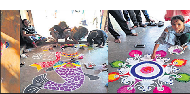
ପ୍ରତିଯୋଗୀମାନେ ଖେଳି ପକାଇଛନ୍ତି ।

ଆପେ ବଣିକ ପୁତେ ଚାଷ; ଗୋତି କରେ ସର୍ବନାଶ । ବେପାର ବଣିକରେ ପ୍ରତ୍ୟକ୍ଷ ଚକ୍ରାବଧାନ ଲୋଡ଼ା, ବ୍ୟବସାୟର ଦାୟିତ୍ୱ ନିଜେ ନ ନେଲେ ଶରୀର ସମ୍ଭାବନା ରହିଥାଏ ।