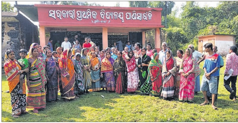
ସ୍କୁଲ ପରିସରରେ ଗ୍ରାମବାସୀ ପ୍ରତିବାଦ କରୁଛନ୍ତି ।