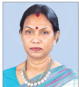
ରାଜ୍ୟ ସଭା ସଦସ୍ୟା ସରୋଜିନୀ ହେମ୍ସ। ଶିଳ୍ପର ବିକାଶ ମଧ୍ୟ ହୋଇପାରିବ। ରୋପ୍‌ୱେ ନିର୍ମାଣ ଦ୍ୱାରା ଏହା ପର୍ଯ୍ୟଟନ ମାନଚିତ୍ରରେ ସ୍ୱତନ୍ତ୍ର ସ୍ଥାନ ଅଧିକାର

ସରୋଜିନୀ ହେମ୍ସ ମତ ପ୍ରକାଶ କରିଛନ୍ତି। ଏହି ଅଭିଯୋଗକୁ ଅନୁକୂଳତା ପର୍ଯ୍ୟଟନସ୍ଥଳର ମାନ୍ୟତା ପାଇଁ ରୋପ୍‌ୱେ ନିର୍ମାଣ କରାଯିବା ଏକାନ୍ତ ଜରୁରୀ ବୋଲି ହେମ୍ସ କହିଛନ୍ତି। ଏହାର ସର୍ବେ ଏବଂ ସ୍ୱତନ୍ତ୍ର ଯୋଜନା ପ୍ରସ୍ତୁତ ନିମନ୍ତେ ସେ ପ୍ରଧାନମନ୍ତ୍ରୀଙ୍କୁ ଠିକି ଲେଖିଛନ୍ତି। ରୋପ୍‌ୱେ ନିର୍ମାଣ କରାଯିବା ଦ୍ୱାରା ବନ୍ୟଜନ୍ତୁମାନେ ପ୍ରଭାବିତ ହେବେ ନାହିଁ ଏବଂ ସବୁ ରାସ୍ତାରେ ପର୍ଯ୍ୟଟକମାନେ ଏଠାକୁ ବୁଲିବାକୁ ଆସିପାରିବେ। ଏହା ଦ୍ୱାରା ଆଦିବାସୀବନ୍ଧୁ ମୟୂରଭଞ୍ଜ ଜିଲ୍ଲାରେ ଯୁବକମାନଙ୍କ ପାଇଁ ଚାକିରୀର ନୂଆ ଉପାୟ ବାହାରିପାରିବ। ଜିଲ୍ଲାରେ ହୋଟେଲ