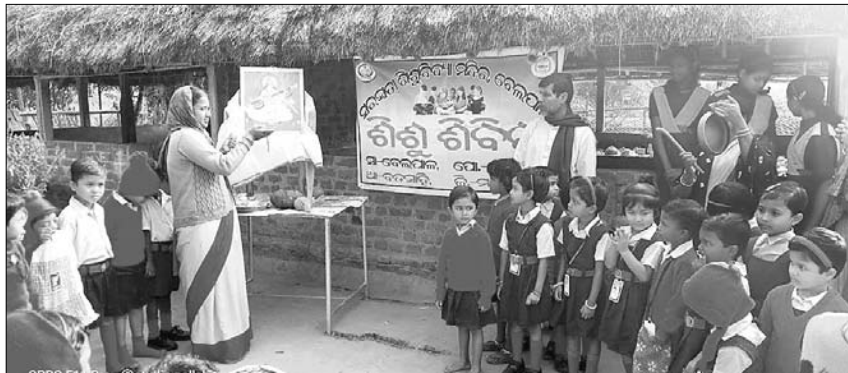
ଶିଶୁ ଶିବିରରେ ଉପସ୍ଥିତ ଛାତ୍ରଛାତ୍ରୀ।