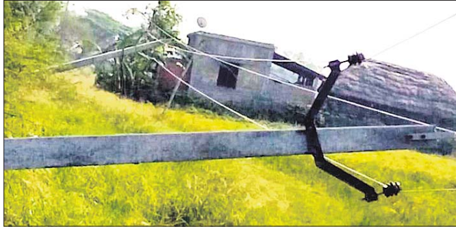
ବାହାବଳପୁରରେ ଉପୁଡ଼ି ପଡ଼ିଥିବା ବିଦ୍ୟୁତ୍ ଖୁଣ୍ଟ।

ଭଦ୍ରକ ଜିଲ୍ଲା ଡିହଡ଼ି ବ୍ଲକ୍ ଅଧୀନ ବାହାବଳପୁର ପଞ୍ଚାୟତ ନିକଟସ୍ଥ ଗ୍ରାମରେ ଥିବା ପାନୀୟଜଳ ପ୍ରକଳ୍ପ ଦୀର୍ଘ ୬ ମାସ ହେଲା ଅଟଳ ହୋଇ ପଡ଼ିଛି। ବାହାବଳପୁରରୁ ନିକଟସ୍ଥ ପ୍ରକଳ୍ପ ସହ ସଂଯୋଗ ଥିବା ୬ଟି ବିଦ୍ୟୁତ୍ ଖୁଣ୍ଟ ଉପୁଡ଼ି ପଡ଼ିଥିବାରୁ ଏକଳ ଅଟଳପଡ଼ି ଦେଖାଦେଇଛି। ଫଳରେ ଉପାନ୍ତ ଅଞ୍ଚଳର ଲୋକେ ବିଶୁଦ୍ଧ ପାନୀୟଜଳ ପାଇବାକୁ ବଞ୍ଚିତ ହେଉଛନ୍ତି। ଏହାଛଡ଼ା ଉପୁଡ଼ି ପଡ଼ି ରହିଥିବା ବିଦ୍ୟୁତ୍ ଖୁଣ୍ଟ ବିପଦସୂଚକ ଅବସ୍ଥାରେ ରହିଛି। ଏହାଦ୍ୱାରା ଧନଜୀବନ ହାନି ହେବାର ଆଶଙ୍କା ଥିବାରୁ ପାନୀୟ ଜଳ ଲୋକେ ଭୟଭୀତ ଅବସ୍ଥାରେ ରହିଛନ୍ତି।