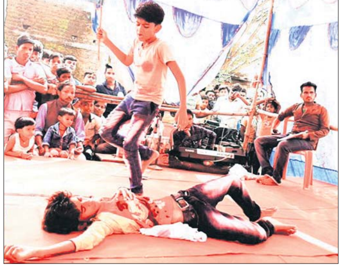
ଅଭିନୟ ଦ୍ୱାରା ଛାତ୍ରମାନେ ଦେଖି ସେବା କରିବାକୁ ସଂକଳ୍ପ ନେଉଛନ୍ତି।

ପ୍ରତିଯୋଗିତା କରାଯାଇଥିଲା। ବକ୍ତୃତା, ସଂଗୀତ, ପୁସ୍ତକୋଳ୍ପ, ନୃତ୍ୟ, ସାଧାରଣ ଜ୍ଞାନ, ମ୍ୟୁଜିକ୍ ଡ୍ରାମା ଆଦି ପ୍ରତିଯୋଗିତାରେ ଛାତ୍ରାଛାତ୍ରୀ ଭାଗ ନେଇଥିଲେ। ଅନୁଷ୍ଠାନର ମୁଖ୍ୟ ଭାଗୀଦାରୀ ସାଧୁ କାର୍ଯ୍ୟକ୍ରମରେ ସହାୟତା କରିଥିଲେ। ସେହିପରି ଗୋପବନ୍ଧୁ ଶିକ୍ଷକଙ୍କ ଆନୁଷ୍ଠାନରେ ବାଳସାହି ପ୍ରାଥମିକ ବିଦ୍ୟାଳୟ ପରିସରରେ ଅନୁଷ୍ଠିତ ଶିଶୁ ମହଳ ମେଳାରେ ମଧ୍ୟ ବିଭିନ୍ନ ପ୍ରତିଯୋଗିତା ହୋଇଥିଲା।