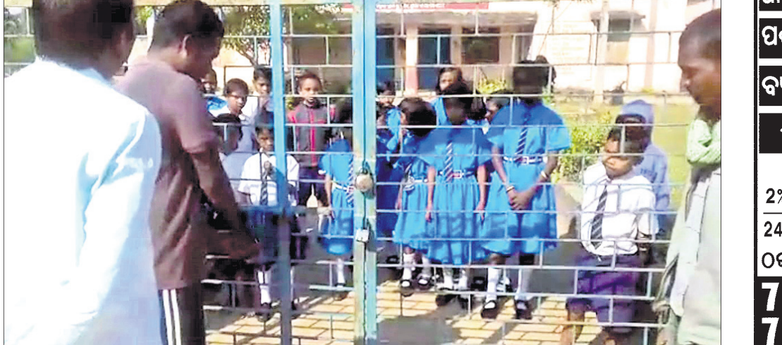
ବିଦ୍ୟାଳୟ ଫାଟକରେ ତାଲା ପକାଇଲେ ଅଭିଭାବକ ।