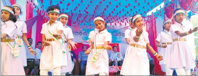
ବାଷିକ ଉତ୍ସବରେ ଛାତ୍ରମାନେ ନୃତ୍ୟ ପରିବେଷଣ କରୁଛନ୍ତି।