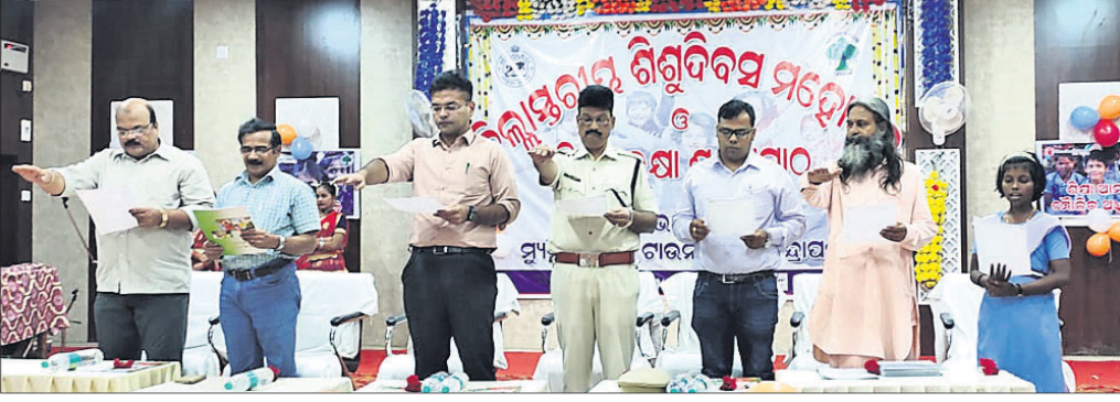
ଶିଶୁଙ୍କ ସୁରକ୍ଷା ପାଇଁ ଶପଥ ପାଠ ଅବସରରେ ଅତିଥିମାନେ।