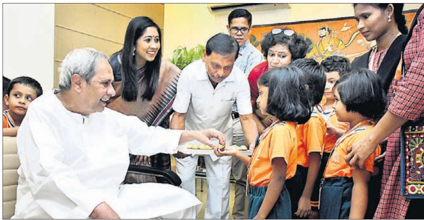
ଶିଶୁଦିବସ ଅବସରରେ କୁଟ୍ରି କୁଟ୍ରି ପିଲାଙ୍କ ରହଣରେ ମୁଖ୍ୟମନ୍ତ୍ରୀ ନରୀନ ପଟ୍ଟନାୟକ।

ଭୁବନେଶ୍ୱର, ୧୪।୧୧(ବୁଧବେଳା) ପରେ ସନ୍ଧ୍ୟାରେ ଦି ଓଡ଼ିଆ ଟ୍ରଷ୍ଟ ଗୋଦାଳା ସ୍କୁଲର ପିଲାମାନେ ଲୋକସଭା ଭବନରେ ମୁଖ୍ୟମନ୍ତ୍ରୀଙ୍କୁ ଭେଟିଥିଲେ। ଏହି ଅବସରରେ ପିଲାମାନଙ୍କ ସହ ମୁଖ୍ୟମନ୍ତ୍ରୀ ବେଶ୍ କିଛି ସମୟ ହସଖୁସିରେ କଟାଇଥିଲେ। ପରେ ମୁଖ୍ୟମନ୍ତ୍ରୀ ସ୍କୁଲ ପକ୍ଷରୁ ପ୍ରସ୍ତୁତ ପକ୍ଷରୁ ଆରମ୍ଭ ହେଉଥିବା 'ନିଶ୍ଚଳ ପିଲା' ପୋଷ୍ଟର ଉନ୍ମୋଚନ କରିଥିଲେ। ପିଲାମାନେ ମୁଖ୍ୟମନ୍ତ୍ରୀଙ୍କୁ ଏହି ଉପଲକ୍ଷେ ପିଲାଶିଳ୍ପ ପ୍ରଦର୍ଶନ କରିଥିଲେ।