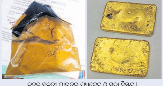
ଜବତ ହେଲା ପାଉଡର ପ୍ୟାକେଟ ଓ ସୁନା ବିଷ୍ଣୁଟ।

ଭୁବନେଶ୍ୱର, ୧୪।୧୧(ବୁଧବେଳା) ଜ୍ଞାନପୀଠର କାମ କରୁଥିବା କହିଥିଲେ। ଏଥିପାଇଁ ବିକ୍ର ପଟ୍ଟନାୟକ ଅନ୍ତର୍ଜାତୀୟ ବିମାନବନ୍ଦରରୁ ଗୁରୁବାର ପୁଣି ଜଣେ ଯାତ୍ରୀଙ୍କଠାରୁ ୧୩୧୦.୬୫୦ ଗ୍ରାମର ଦୁଇଟି ସୁନା ବିଷ୍ଣୁଟ ଜବତ କରାଯାଇଛି। ଏହି ସୁନା ବିଷ୍ଣୁଟି ୯୯ ପ୍ରତିଶତ ଶୁଦ୍ଧ ହୋଇଥିବାବେଳେ ବକାର ମୂଲ୍ୟ ୫୨ ଲକ୍ଷ ଟଙ୍କାରୁ ଉର୍ଦ୍ଧ୍ୱ ହେବ। ତେବେ ଏହାକୁ ଚାଲାଣ କରୁଥିବା କେରଳର ଜଣେ ବ୍ୟକ୍ତିଙ୍କୁ କଷ୍ଟମ ବିଭାଗ ଗିରଫ କରିଛି। ମିଳିଥିବା ସୁନା ଅନୁଯାୟୀ, ଯାତ୍ରୀ ଜଣକ ବୁଧବାର ରାତି ପ୍ରାୟ ୯ଟାରେ ଏୟାର ଏସିଆ ବିମାନ (ନଂ.ଏକ-୩୧)ରେ କାଲିକଟ୍ଟରୁ ସୁନା ବିଷ୍ଣୁଟ ଧରି ଭୁବନେଶ୍ୱର ଆସିଥିଲେ। ଏ ସମ୍ପର୍କରେ ସୂଚନା ପାଇବା ପରେ କଷ୍ଟମ ବିଭାଗର ଅଧିକାରୀମାନେ କଡ଼ା ନଜର ରଖୁଥିଲେ। ଯାତ୍ରୀ ଜଣକ ବିମାନବନ୍ଦରରୁ ବାହାରକୁ ଯାଉଥିବାବେଳେ ତାଙ୍କର ଚାଲିଚଳନ ବେଶ୍ ସନ୍ଦେହ ହୋଇଥିଲା। ତାଙ୍କୁ ଅଟକାଇ ଯାଞ୍ଚ କରାଯାଇଥିଲା। ସେ ଆଣିଥିବା ବ୍ୟାଗରେ ଏକ ହଳଦୀ ପାଉଡର ପ୍ୟାକେଟ ଭିତରେ ଦୁଇଟି ସୁନା ବିଷ୍ଣୁଟ ଥିବା ଜଣାପଡ଼ିଥିଲା। କଷ୍ଟମ ବିଭାଗ ଅଧିକାରୀମାନେ ଉକ୍ତ ସୁନା ବିଷ୍ଣୁଟକୁ ଜବତ କରିବା ସହ ଯାତ୍ରୀ ଜଣଙ୍କୁ କାର୍ଯ୍ୟାଳୟକୁ ଆଣି ପଚରାଉଚରା କରିଥିଲେ। ସେ ଜଣେ ସୁନା ମାଫିଆଙ୍କ