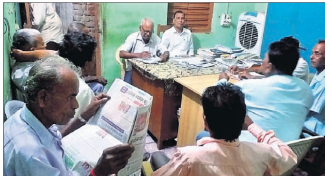
ସମବାୟ ସମିତି ବୈଠକରେ ଉପସ୍ଥିତ ସଦସ୍ୟମାନେ।

ରାଜନଗର, ୧୫୧୧ (ଡି.ଏନ.ଏ.): ରାଜନଗର ପ୍ରାଥମିକ କୃଷି ସେବା ସମବାୟ ସମିତିର ଏକ ଗୁରୁତ୍ୱପୂର୍ଣ୍ଣ ବୈଠକ ଗୁଣ୍ଡିଚାର ଅନୁଷ୍ଠିତ ହୋଇଯାଇଛି। ଏହି ବୈଠକରେ ବୁଲ୍‌ବୁଲ୍ ପ୍ରଭାବରେ ରାଜନଗର ଅଞ୍ଚଳରେ ହୋଇଥିବା କ୍ଷୟକ୍ଷତି ନେଇ ଆଲୋଚନା ହୋଇଥିଲା। ବିଶେଷକରି ରାଜନଗର, ମହାସାପୁର, ମହୁଲିଆ ପଞ୍ଚାୟତ ଅଧିକ ୧୫ଟି ଗ୍ରାମରେ ହୋଇଥିବା ଧାନ ଫସଲର ବ୍ୟାପକ କ୍ଷୟକ୍ଷତି ହୋଇଛି। ରାଜନଗର ପ୍ରାଥମିକ