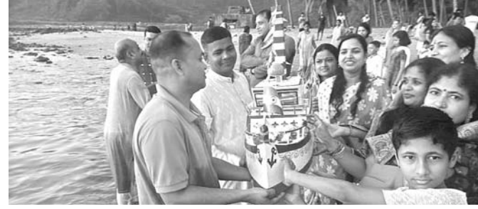
ଓଡ଼ିଆ ସମାଜ ପକ୍ଷରୁ ତାଲା ଭଙ୍ଗା ଯାଇଛି।

ମଙ୍ଗଳ ଉନ୍ନୟନ ଅଧିକାରୀଙ୍କୁ ମଧ୍ୟ ଏ ନେଇ ଅବଗତ କରାଯାଇଥିଲେ ବି ଅପରାହ୍ଣ ୨ଟା ପର୍ଯ୍ୟନ୍ତ କେହି ସ୍କୁଲରେ ପହଞ୍ଚି ନ ଥିଲେ। ଫଳରେ ଅଭିଭାବକମାନେ ସ୍କୁଲ ଗେଟକୁ ବନ୍ଦ କରି ଶିକ୍ଷୟିତ୍ରୀଙ୍କୁ ଶିକ୍ଷା ଦେବା ସମ୍ଭବ ନୁହେଁ ବୋଲି ଜଣାଇଥିଲେ।