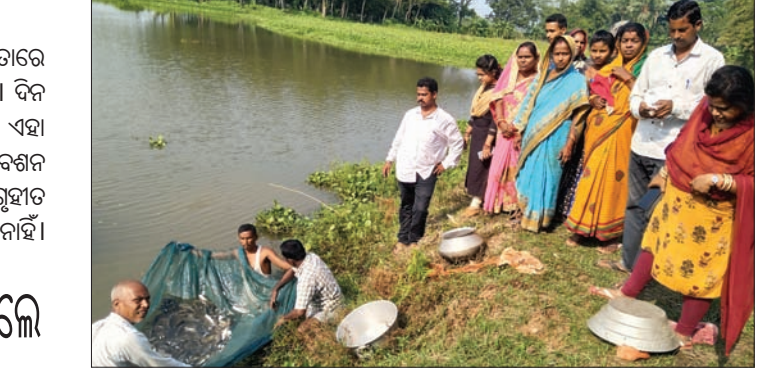
ପୋଖରୀରେ ଜାଲ ସହାୟତାରେ ଯାଆଁଳ ଛତାଯାଉଛି।

ନଭେମ୍ବର ୧୪ ତଥା ଶିଶୁ ଦିବସରେ ପୂର୍ବତନ କ୍ରିକେଟ ଚାରକା ବୀରେନ୍ଦ୍ର ସେହ୍ୱାଗ ଓଡ଼ିଶା ବୀର ଶହୀଦ ବାଜି ରାଉତଙ୍କୁ ସ୍ମରଣ କରିଛନ୍ତି। ଶିଶୁ ଦିବସ ଉପଲକ୍ଷେ ବୀରେନ୍ଦ୍ର କରିଥିବା ବୁଲେଟରେ ବାଜିଙ୍କୁ ଭାରତର କନିଷ୍ଠତମ ଶହୀଦ ବୋଲି ଉଲ୍ଲେଖ କରିଛନ୍ତି। ଦେଶର ସ୍ୱାଧୀନତା ସଂଗ୍ରାମରେ ୧୨ ବର୍ଷୀୟ ବାଜି କରିଥିବା ତ୍ୟାଗ ସର୍ବଦା ସ୍ମରଣୀୟ ହୋଇ ରହିବ ବୋଲି ସେହ୍ୱାଗ କହିଛନ୍ତି। ବୀରେନ୍ଦ୍ରଙ୍କ ଏହିପରି ଭାବବିହ୍ୱଳ ବୁଲେଟକୁ କେନ୍ଦ୍ରମନ୍ତ୍ରୀ ଧର୍ମେନ୍ଦ୍ର ପ୍ରଧାନ ମଧ୍ୟ ଚିତ୍ତକର୍ତ୍ତା କରିଛନ୍ତି। ଏହି ବୁଲେଟର ଧର୍ମେନ୍ଦ୍ର କହିଛନ୍ତି ଯେ, ଅମର ଶହୀଦ ବାଜି ରାଉତ ୧୨ ବର୍ଷ ବୟସରେ କନ୍ଦୁକୁଳି ପାଇଁ ନିଜ ଜୀବନକୁ ଉତ୍ସର୍ଗ କରିଥିଲେ। ତେଣୁ ଆଜିର ଦିନରେ ଏଭଳି ପ୍ରତିଭାକୁ ସମ୍ମାନ ଦେବାଠାରୁ ବଳି କ'ଣ ବା ଥାଇପାରେ। ଭାରତ ତଥା ଓଡ଼ିଶା ମାଟିର ଶହୀଦ ବାଜି ରାଉତ ବିଷୟରେ ବୁଲେଟ କରି ସାରା ଦୁନିଆକୁ ଜଣାଇଥିବାରୁ ବୀରେନ୍ଦ୍ରଙ୍କୁ ଧର୍ମେନ୍ଦ୍ର ଧନ୍ୟବାଦ ଦେଇଥିଲେ।