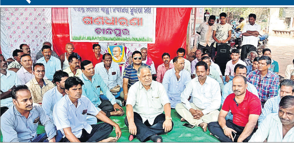
ଚିକିତ୍ସାଳୟ ସମ୍ମୁଖରେ ଧାରଣା ଦେଇଥିବା ଅଞ୍ଚଳବାସୀ।

କର୍ମଚାରୀଙ୍କ କାର୍ଯ୍ୟ ଓ ଚିକିତ୍ସାଳୟ କୋଠା ନିର୍ମାଣ କରାଯାଇଛି। ହେଲେ କାମ ଠିକ୍ ଭାବେ ହେଉ ନାହିଁ। ରୋଗୀଙ୍କୁ ଦିଆଯାଉଥିବା ଖାଦ୍ୟ ନିମ୍ନମାନର ହେଉଥିଲେ ହେଁ ପ୍ରତିକାର ନାହିଁ। ଏହା ଯଶ୍ନା ହସପିଟାଲ ହୋଇଥିଲେ ହେଁ ବରିଷ୍ଠ ଯଶ୍ନା ବିଶେଷଜ୍ଞ ନାହାନ୍ତି। ଏଠାରେ ନିରାମୟ କେନ୍ଦ୍ର ନ ଥିବାରୁ ରୋଗୀ ହସ୍ତଚ୍ଛାଦ ହେଉଛନ୍ତି। ଏହିସବୁ ସମସ୍ୟା ସମାଧାନ ନେଇ ପୂର୍ବରୁ ୧୧ଟାରେ ସ୍ୱାସ୍ଥ୍ୟକେନ୍ଦ୍ର ସମ୍ମୁଖରେ ଗଣଧାରଣା