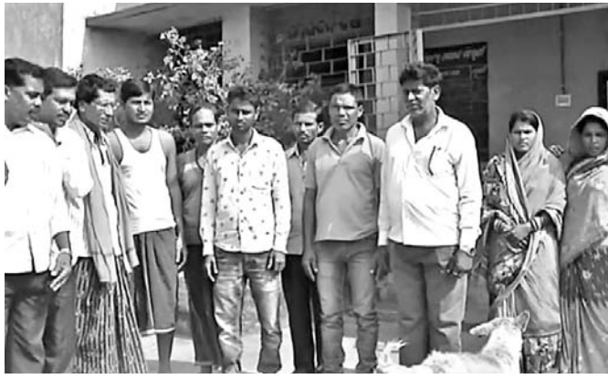
ସ୍କୁଲ ପରିସରରେ ଅଭିଭାବକମାନେ।

ପଞ୍ଚାମୁଖାଭ ରୁକ୍ଷିତ କୁଳସାହି ଆଶ୍ରମ ସ୍କୁଲରେ କଣେ ଶିକ୍ଷୟିତ୍ରୀଙ୍କ ପୁନଃ ନିଯୁକ୍ତିକୁ ବିରୋଧ କରି ଗୁରୁତ୍ୱ ଦେଇ ଅଭିଭାବକମାନେ ସ୍କୁଲରେ ତାଲା ପକାଇ ଆନ୍ଦୋଳନ କରିଛନ୍ତି। ସ୍କୁଲରେ ତାଲା ପଡ଼ି ରହିଥିବାରୁ ୫ମ ଓ ୧୦ମ ଶ୍ରେଣୀର ଅନୁସୂଚିତ ଛାତ୍ର ଓ ଛାତ୍ରୀଙ୍କୁ ଶିକ୍ଷା ଦେବା ସମ୍ଭବ ନୁହେଁ।