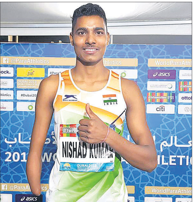
ଦୁଇଭାଗ, ୧୫୧୧୧ (ପି.ଟି.)