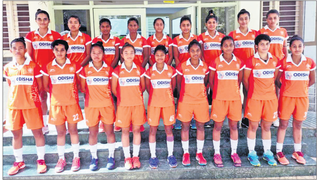
ଓଡ଼ିଶା ଟ୍ରିନିଡାଦ୍ କ୍ରିକେଟ୍ ଦଳର ପ୍ରସ୍ତୁତି ହେଉଛି ।