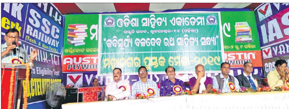
କାର୍ଯ୍ୟକ୍ରମରେ ମହାସୀନ ଅତିଥି ।

ଗଞ୍ଜାମ ଜିଲ୍ଲା ପୁସ୍ତକ ମେଳା କମିଟି ପକ୍ଷରୁ ଖଲ୍ଲିକୋଟ କଲେଜ ପତିଆରେ ଆୟୋଜିତ ମହାନଗର ପୁସ୍ତକମେଳା ଶୁକ୍ରବାର ଅଷ୍ଟମ ଦିବସରେ ପହଞ୍ଚିଛି ।