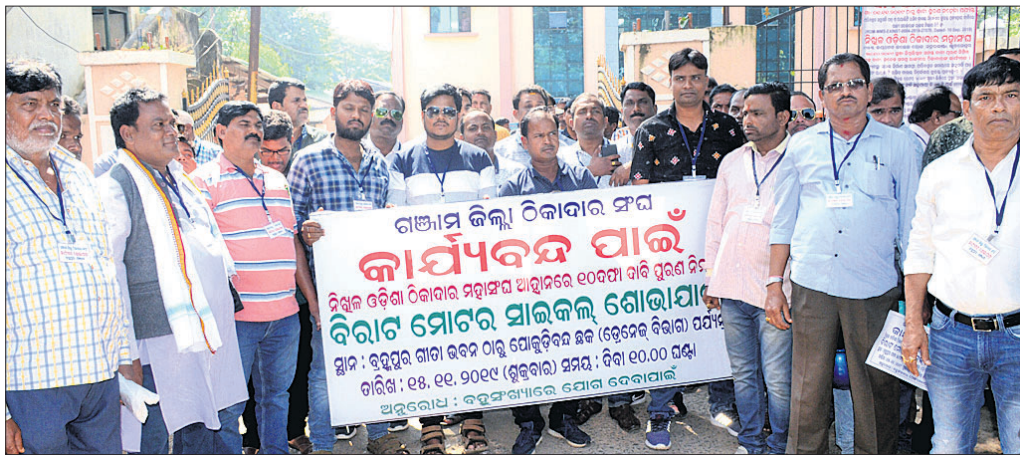
ଠିକାଦାରମାନେ ବିରୋଧ ପ୍ରଦର୍ଶନ କରୁଛନ୍ତି ।

ନିଜିଲ ଓଡ଼ିଶା ଠିକାଦାର ମହାସଂଘ ପକ୍ଷରୁ ଡକାଯାଇଥିବା କାର୍ଯ୍ୟବନ୍ଦ ଆନ୍ଦୋଳନରେ ଗଞ୍ଜାମ ଜିଲ୍ଲା ଠିକାଦାର ସଂଘ ସାମିଲ ହୋଇଛି।