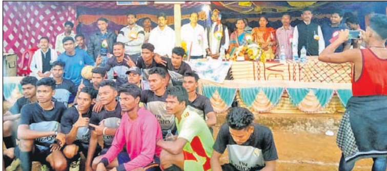
ଅତିଥିଙ୍କ ଗହଣରେ ଚାକ୍ଷିୟନ ଦଳ।

ପରିଚିଆ, ୧୫।୧୧ ଖେଳ ପଡିଆରେ ଏକସମ୍ପଦି ନେହେରୁ ସଂଘ ପକ୍ଷରୁ ଅନୁଷ୍ଠିତ ପୁରୁଷମାନଙ୍କୁ ଚୂନାମେଣ୍ଟର ପରିଚିଆ ଚଳିବ।