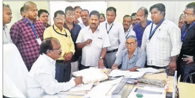
ଠିକାଦାରମାନେ ଦାବିପତ୍ର ପ୍ରଦାନ କରୁଛନ୍ତି।

କକ୍ଷମାଳ ଜିଲ୍ଲା ଠିକାଦାର ସଂଘ ପକ୍ଷରୁ ବିଭିନ୍ନ ଦାବିରେ ଶୁକ୍ରବାର ବିରୋଧ ପ୍ରଦର୍ଶନ କରାଯାଇଛି। ସଂଘ କର୍ମକର୍ତ୍ତା ଏବଂ ଠିକାଦାରମାନେ ସ୍ଥାନୀୟ ବିଜୁ କଲ୍ୟାଣମଣ୍ଡଳ ପ୍ରତି