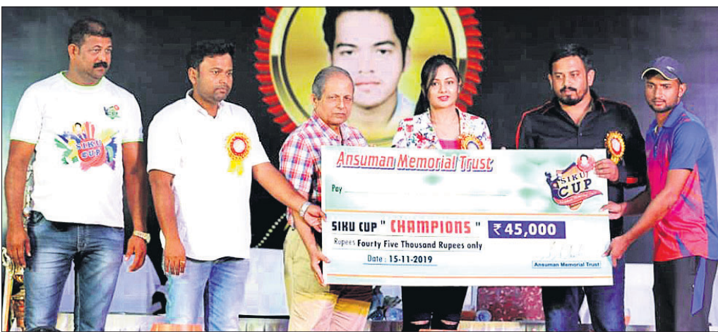
ଝାଡ଼ଖଣ୍ଡ ଯୁନିୟନ ସ୍ପୋର୍ଟ୍ ଚାମ୍ପିୟନ ଟ୍ରଫି ପ୍ରଦାନ କରୁଛନ୍ତି ।