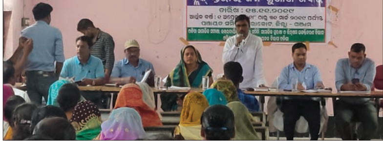
ଶିବିରରେ ଉପସ୍ଥିତ ଅତିଥିବୃନ୍ଦ ।