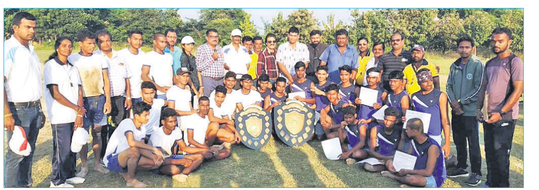
ବିଜେତା ଓ ଉପବିଜେତାଙ୍କ ସହ କ୍ରୀଡା ପରିଷଦ କର୍ମଚାରୀ ।