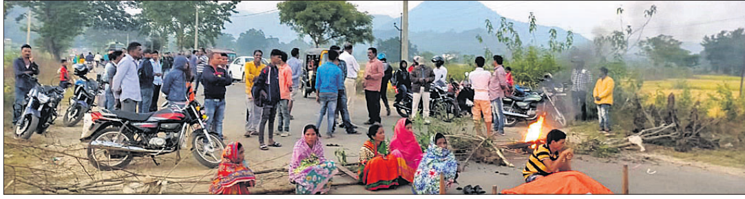
ମୃତଦେହ ରଖି କାତାୟ ରାଜପଥ ଅବରୋଧ କରାଯାଇଛି।

ଚକାପାଦ ବୁକ୍ ଶଙ୍କରାଖୋଳ ଗ୍ରାମରେ ୩୩ କେଜି ତାର ସ୍ଥାନାନ୍ତର ପାଇଁ ଖୁଣ୍ଟରେ ଚଢ଼ି ବିଦ୍ୟୁତ୍ ସଂଘର୍ଷରେ ଆଦି ଗୁରୁତର ଆହତ ହୋଇଥିବା ଶ୍ରମିକଙ୍କ ଶୁକ୍ରବାର ମୃତ୍ୟୁ ଘଟିଛି।