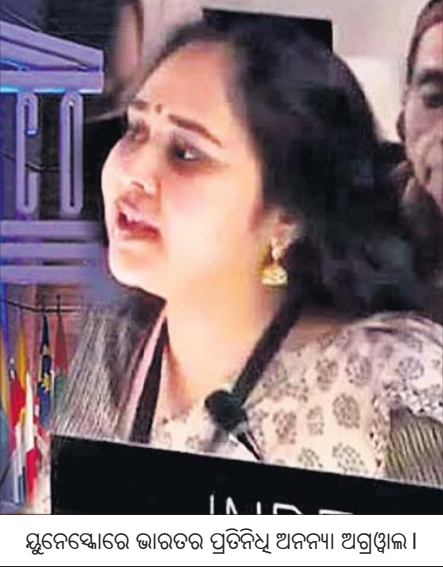
ସ୍ମୃତିକ୍ରମ ସମ୍ବନ୍ଧରେ ଆତଙ୍କବାଦ ସହ ସମ୍ପର୍କ ପାଇଁ ବିଫଳ ରାଷ୍ଟ୍ରରେ ପରିଶତ କରିଛି।

ପ୍ୟାରିସ୍, ୧୫.୧୧.୧୯ (ପି.ଟି.): ଅନ୍ତର୍ଜାତୀୟ ବ୍ୟାପାରକୁ ନେଇ ପାକିସ୍ତାନ ଅପରିପକ୍ୱ ପ୍ରତ୍ୟାହତ କରାଯାଇଥିଲା।