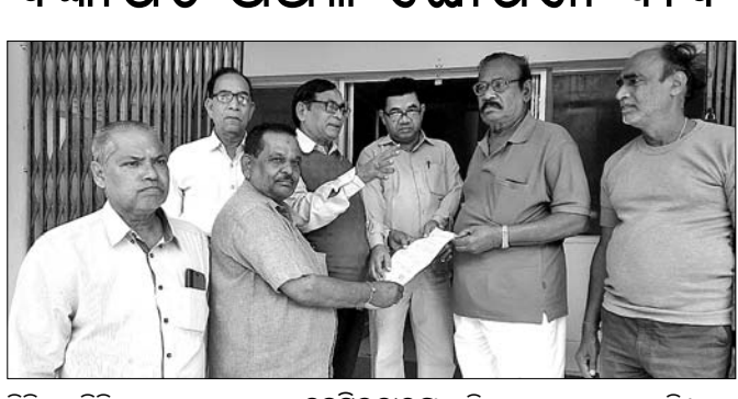
ନରସିଂହପୁର ଟାଉନକୁ ବିଜ୍ଞାପିତ ଅଞ୍ଚଳ ଘୋଷଣା ଦାବି କରୁଥିବା ବ୍ୟକ୍ତିମାନଙ୍କ ଚିତ୍ର

ନରସିଂହପୁର ଟାଉନକୁ ବିଜ୍ଞାପିତ ଅଞ୍ଚଳ ଘୋଷଣା ଦାବି କରାଯାଇଛି। ଏଥିରେ ଟ୍ରଷ୍ଟର ନିର୍ଦ୍ଦେଶକଙ୍କୁ ପ୍ରଶ୍ନ କରାଯାଇଛି।