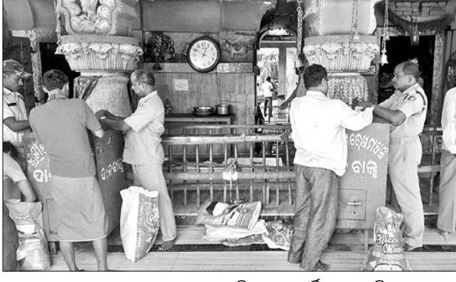
ଦାନବାନ୍ଧୁ ଟଙ୍କା ପ୍ରତିଷ୍ଠାନର କାର୍ଯ୍ୟକ୍ରମରେ ଯୋଗଦାନ କରୁଥିବା ବ୍ୟକ୍ତିମାନଙ୍କ ଚିତ୍ର

କଟକରେ ରହିଥିବା ଦାନବାନ୍ଧୁ ଟଙ୍କା ପ୍ରତିଷ୍ଠାନ ଯାକ ନିଜର କାର୍ଯ୍ୟକ୍ରମ ସମାପନ କରିବାକୁ ଚାହୁଁଛନ୍ତି। ଏଥିରେ ଶିକ୍ଷକମାନଙ୍କ ସହଯୋଗ ଲାଭ କରିବା ଉପରେ ଆଶା ରଖାଯାଇଛି।