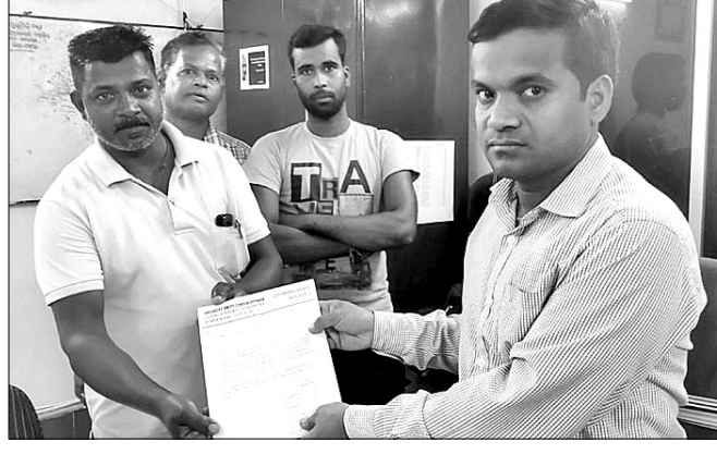
ନିଶ୍ଚିତକୋଇଲି ତହସିଲରେ କର୍ମଚାରୀଙ୍କୁ ପଦବୀ ପୂରଣ ପାଇଁ ଦାବି କରୁଥିବା ବ୍ୟକ୍ତିମାନଙ୍କ ଚିତ୍ର

ନିଶ୍ଚିତକୋଇଲି ତହସିଲରେ କର୍ମଚାରୀଙ୍କୁ ପଦବୀ ପୂରଣ ପାଇଁ ଦାବି କରାଯାଇଛି। ଏଥିରେ ଟ୍ରଷ୍ଟର ନିର୍ଦ୍ଦେଶକଙ୍କୁ ପ୍ରଶ୍ନ କରାଯାଇଛି।