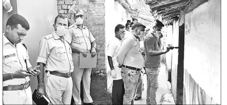
ଘଟଣାସ୍ଥଳରେ ପୋଲିସ୍ ଚଢ଼ଳ କରୁଛି ।

ସମ୍ବଲପୁର ରାଜନ ଥାନା ଅଧୀନ ପୁଲିସ୍ ଠାଣୀ ମୁସ୍ତାଫିଆ ବନ୍ଦୁକ୍ଷେତ୍ରରେ ଜଣେ ମହିଳାଙ୍କୁ ଚଷ୍ମା ଚିପି ଦ୍ରବ୍ୟ କରାଯାଇଛି। ଏକ ବନ୍ଦ ଘର ଭିତରୁ ପୋଲିସ୍ ମୃତଦେହ ଉଦ୍ଧାର କରି ବ୍ୟବହାର ପାଇଁ ପଠାଇଛି।