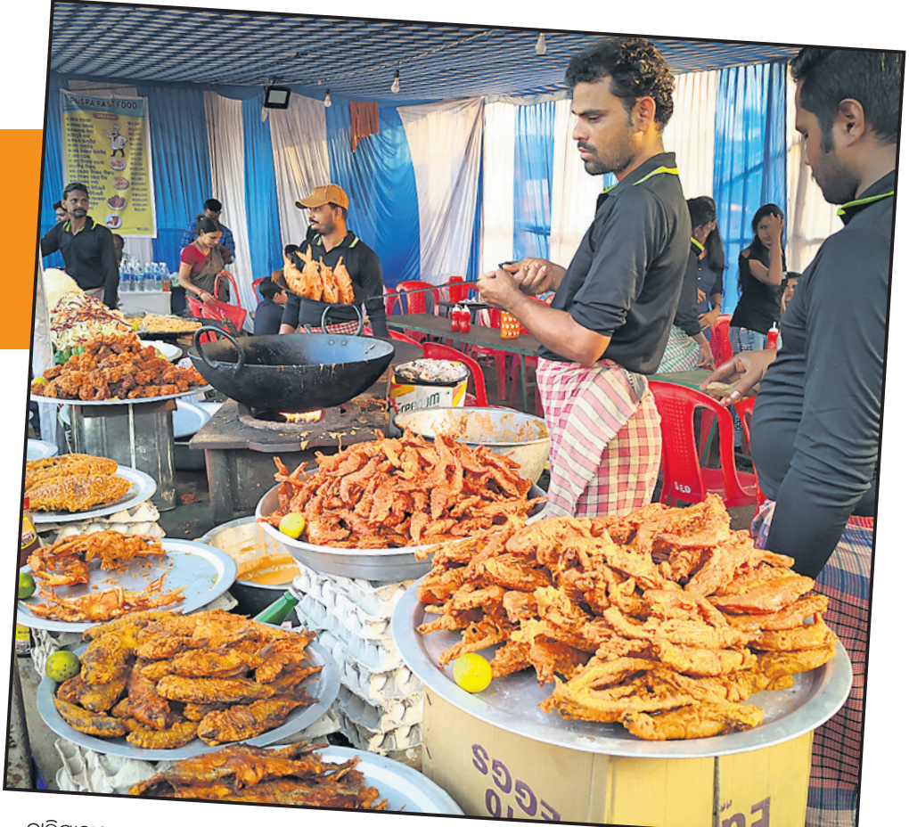
ବାଲିଯାତ୍ରାରେ ଏକ ଫାଷ୍ଟଫୁଡ୍ ସ୍ଥଳରେ ଖାଦ୍ୟ ସାମଗ୍ରୀ ସଜାଇ ରଖାଯାଇଛି।

କଟକ ଅଫିସ, ୧୫।୧୧: ଶୁକ୍ରବାର ଥିଲା ଐତିହାସିକ କଟକ ବାଲିଯାତ୍ରାର ଚତୁର୍ଥ ଦିନ। ଦିନତମାମ ପଡିଆରେ ଗହଳି ଚହଳି ଲାଗି ରହିଥିଲା। କେତେକ ଲୋକ ଦିନରେ ବାଲିଯାତ୍ରା ବୁଲି ଘରକୁ ଫେରି ଯାଇଥିଲେ। ହେଲେ ଅଧିକ ଭିଡ଼ ଦେଖିବାକୁ ମିଳିଥିଲା ସନ୍ଧ୍ୟାରେ। ବାଲିଯାତ୍ରା ମୁଖ୍ୟମନ୍ତ୍ରୀ ଆଲୋଚନାକାଳରେ ସଜାଯାଇଥିବାବେଳେ ଏହା ଦର୍ଶକଙ୍କୁ ଆକୃଷ୍ଟ କରିଥିଲା। ଶୁକ୍ରବାର ଲକ୍ଷାଧିକ ଲୋକଙ୍କ ସମାଗମ ହୋଇଥିଲା। ରାଜଗ୍ଳାନରୁ ଆସିଥିବା ବ୍ୟବସାୟୀଙ୍କ ଫାଷ୍ଟଫୁଡ୍ ସ୍ଥଳରେ ଶୁକ୍ରବାର ଭିଡ଼ ଦେଖିବାକୁ ମିଳିଥିଲା। ଏହି ସ୍ଥଳରେ ସେଗାଲ ରାଜଗ୍ଳାନ ଥାନା ୧୫୦ ଟଙ୍କା ଥିବାବେଳେ ଡାଲବଟି ଟୁରମା ୧୦୦ ଟଙ୍କା, ମୁଗଡାଲ କଚୋରି ୬୦ ଟଙ୍କା, ମିରଚି ବଡ଼ା ୫୦ ଟଙ୍କା, ପାଓଭାଜି ୬୦୦ଟଙ୍କା, ମିଳୁ ଚାଟ୍ ୬୦ ଟଙ୍କାରେ ବିକ୍ରି ହେଉଥିଲା। ଏ ନେଇ ବ୍ୟବସାୟୀ କହିଛନ୍ତି, ଦୀର୍ଘ ୧୦ ବର୍ଷ ହେବ ଆମେ ବାଲିଯାତ୍ରା ଆସୁଛୁ। ଗତବର୍ଷଠାରୁ ଏହି ବର୍ଷ ୪ ଦିନ ଭିତରେ ଭଲ ବ୍ୟବସାୟ ହୋଇଛି। ଏଠାରେ ରାଜଗ୍ଳାନୀ ଖାଦ୍ୟ ଡିଆରି ନିମନ୍ତେ ୨୦ ଜଣ କାରିଗର ଆସିଛନ୍ତି। ସେହିପରି ଅନ୍ୟ ଫାଷ୍ଟଫୁଡ୍ ସ୍ଥଳଗୁଡ଼ିକରେ ପୁପ୍, ରୋଲ୍, ଚାଓମିନ, ପନିର ମସଲା, ଚିକେନ ମସଲା, ଚିଲି ଚିକେନ ଆଦି ବିଭିନ୍ନ ପ୍ରକାର ଫାଷ୍ଟଫୁଡ୍ ବିକ୍ରି ହେଉଥିଲା। ଅନ୍ୟପକ୍ଷରେ ବାଲିଯାତ୍ରାରେ ବାରିପଦାର ମୁକ୍ତିମାସର ଚାହିଦା ଅଧିକ ରହିଥିଲା। ମୁକ୍ତିମାସ ପ୍ଲେଟ ୧୦୦ ଟଙ୍କା ଥିବାବେଳେ ମୁକ୍ତିମାସ କକ୍ଷା ୧୨୦ ଟଙ୍କାରେ ବିକ୍ରି ହେଉଥିବା ବ୍ୟବସାୟୀ କହିଛନ୍ତି।