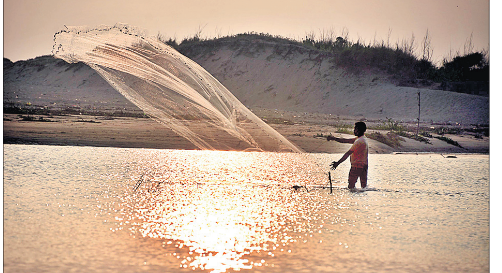
ପୁରୀ ମଙ୍ଗଳା ମୁହାଣରେ ଜଣେ ମତ୍ସ୍ୟଜୀବୀ କାଳରେ ମାଛ ଧରୁଛନ୍ତି।