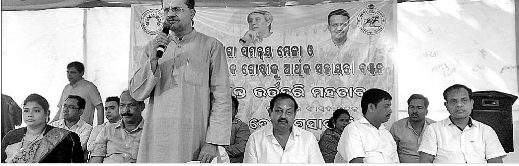
ନାରୀ ଜାଗିଲେ ଦେଶ ବଢ଼ିବ ନେଇ ଆଲୋଚନା କରୁଥିବା ବ୍ୟକ୍ତିମାନଙ୍କ ଚିତ୍ର

ନାରୀ ଜାଗିଲେ ଦେଶ ବଢ଼ିବ ନେଇ ଆଲୋଚନା କରାଯାଇଛି। ଏଥିରେ ଟ୍ରଷ୍ଟର ନିର୍ଦ୍ଦେଶକଙ୍କୁ ପ୍ରଶ୍ନ କରାଯାଇଛି।