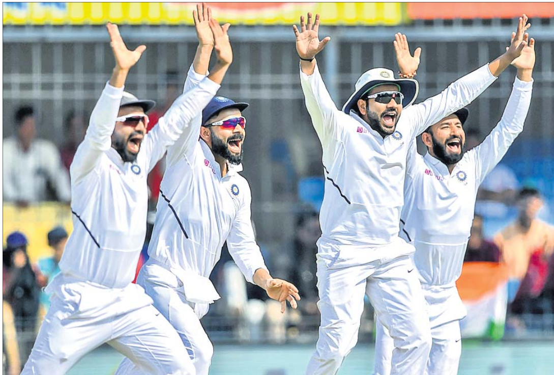
ଉଇକେଟ ପତନ ପରେ ଉଲ୍ଲାସିତ ଭାରତୀୟ ଖେଳାଳି।

ଐତିହାସିକ ଇଡେନ ଗାର୍ଡେନ୍‌ରେ ଆସନ୍ତା ୨୨ ତାରିଖରୁ ଦ୍ୱିତୀୟ ତଥା ଅନ୍ତିମ ଟେଷ୍ଟ ମ୍ୟାଚ୍ ଖେଳାଯିବ। ଏହା ଦିବାରାତ୍ରିକ ଟେଷ୍ଟ ହେବ ଓ ଭାରତ ପ୍ରଥମଥର ପାଇଁ ତେ ଆଣ୍ଡ ନାଇଟ୍ ଟେଷ୍ଟ ଖେଳିବ।