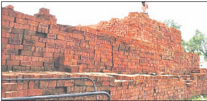
ସିଲ୍ କରାଯାଇଥିବା ଇଟାଭାଡ଼ି।

ପାଟ୍ଟପୁର ବ୍ଲକ୍ ବି.ନୁଆଗାଁର, ପମଗାଁ ଓ ଭୀମପୁରରେ ଗଢ଼ିଉଠୁଥିବା ଇଟାଭାଡ଼ିକୁ ପ୍ରତ୍ୟକ୍ଷ କମ୍ପ୍ଲେକ୍ସ ବୋର୍ଡ଼ ଓ ଗଂଜାମ ଜିଲ୍ଲାପାଳଙ୍କ ନିର୍ଦ୍ଦେଶକ୍ରମେ ପାଟ୍ଟପୁର ତହସିଲ ପକ୍ଷରୁ ସିଲ୍ କରାଯାଇଛି।