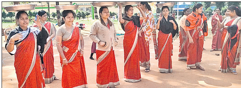
ଅଭିଭାବକ ଓ ଶିକ୍ଷୟିତ୍ରୀମାନଙ୍କ ମଧ୍ୟରେ ପ୍ରତିଯୋଗିତା।