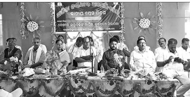
କାର୍ଯ୍ୟକ୍ରମରେ ମହାଧାନ ବିଧାୟକ ଓ ଅନ୍ୟମାନେ ।