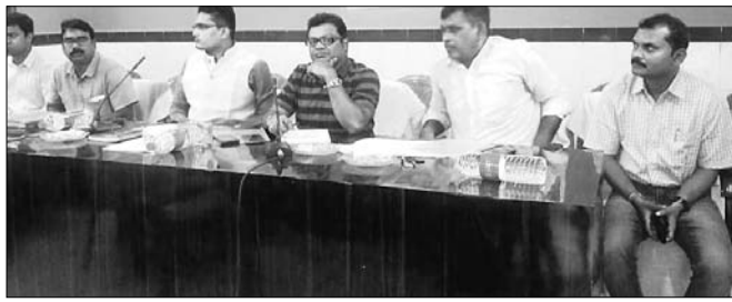
ମହାଧାନ ପ୍ରଶାସନିକ ଅଧିକାରୀ ଦ୍ୱୟ ।

ଦିଗପହଣ୍ଡିରୁ ପ୍ରଶାସନ ପକ୍ଷରୁ ଶନିବାର ଏମ୍ପ୍ଲିଏମେଣ୍ଟ ଆରଡିଏସ୍ ଓ କାର୍ଡର ଯୋଗାଣ କାର୍ଯ୍ୟକ୍ରମର ଅଗ୍ରଗତି ସମ୍ବନ୍ଧରେ ଜନଶୁଣାଣି କରାଯାଇଥିଲା ।