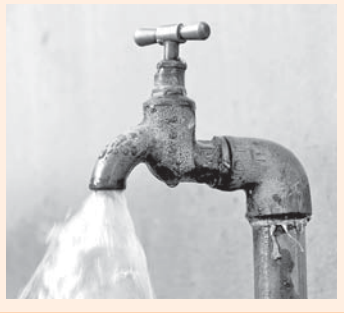
ପାନୀୟ ଜଳ ଯୋଗାଣ ସୁନିଶ୍ଚିତ କରିବା ଲାଗି କେନ୍ଦ୍ର ଖାଉଟି ବ୍ୟାପାର ମନ୍ତ୍ରାଳୟ ପକ୍ଷରୁ ଉଦ୍ୟମ ଆରମ୍ଭ ହୋଇଛି। ପ୍ରଥମ

ପର୍ଯ୍ୟାୟରେ ଦିଲ୍ଲୀର ବିଭିନ୍ନ ସ୍ଥାନରୁ ପାନୀୟ ଜଳ ନମୁନା ସଂଗ୍ରହ କରାଯାଇଥିବାବେଳେ ପରବର୍ତ୍ତୀ ପର୍ଯ୍ୟାୟରେ ୨୦ ରାଜ୍ୟର ରାଜଧାନୀକୁ ଜଳ ନମୁନା ପରୀକ୍ଷା ପାଇଁ ନିଆଯାଇଥିଲା। ବ୍ୟୁରୋ ଅଫ୍ ଇଣ୍ଡିଆନ ସ୍ଟାଣ୍ଡାର୍ଡସ୍ (ବିଆଇଏସ୍) ଦ୍ୱାରା ସ୍ଥିରୀକୃତ ମାନ ୧୦୫୦୦:୨୦୧୨ ଅନୁଯାୟୀ ସେଗୁଡ଼ିକର ପରୀକ୍ଷା କରାଯାଇଥିଲା। ସେଥିରୁ ଦିଲ୍ଲୀ ଓ ଅନ୍ୟ ୧୩ ରାଜ୍ୟ ରାଜଧାନୀର ପାଣି ପିଇବା ଯୋଗ୍ୟ ନୁହେଁ ବୋଲି ଖାଉଟି ବ୍ୟାପାର ମନ୍ତ୍ରୀ ରାମବିଳାସ ପାଣ୍ଡେ କହିଛନ୍ତି। ସେହି ରାଜଧାନୀ ସହରଗୁଡ଼ିକ ହେଲେ ଚଣ୍ଡିଗଡ଼, ଥୁରୁଭାନୁପୁରମ୍, ପାଟନା, ଭୋପାଳ, ଗୁଆହାଟୀ, ବେଙ୍ଗାଲୁରୁ, ଗାନ୍ଧୀନଗର, ଲକ୍ଷ୍ନୌ, କଟ୍ଟିପୁର, ଡେରାଡୁନ, ଚେନ୍ନାଇ ଏବଂ କୋଲକାତା। ଲୋକଙ୍କୁ ଚ୍ୟାପୁରୁ ସ୍ୱଚ୍ଛ ପାଣି ମିଳିବା ଦରକାର। ଏବେକି କେନ୍ଦ୍ର ସରକାର କି ପ୍ରକାର ସହାୟତା କରିପାରିବେ ଜଣାଇବାକୁ ପାଣ୍ଡେ ସମ୍ପୂର୍ଣ୍ଣ ରାଜ୍ୟ ସରକାରମାନଙ୍କୁ ପତ୍ର ଲେଖିଛନ୍ତି।