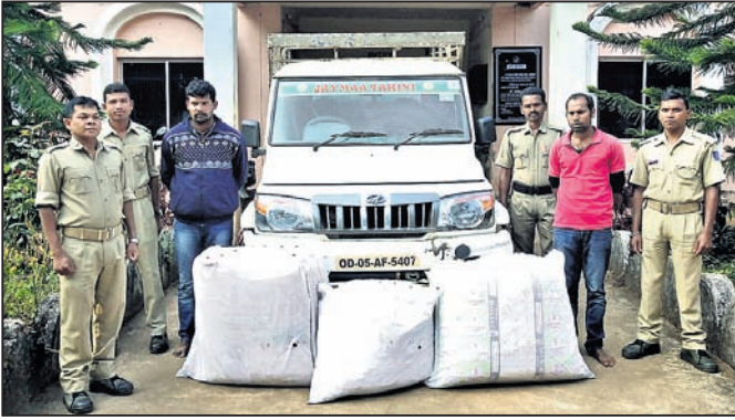
ଜବତ ଗଞ୍ଜେଇ ସହ ଗିରଫ ଅଭିଯୁକ୍ତ।