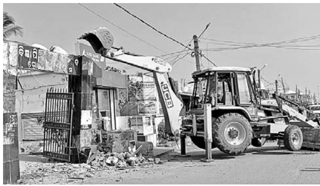
ଜବରଦଖଲ ଉଦ୍ଧେଦ କରାଯାଉଛି ।