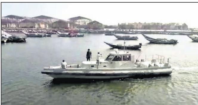
ସମୁଦ୍ରରେ ବୋର୍ଡ଼ରେ ପାଟ୍ରୋଲିଂ ଚାଲିଛି।

ଆର୍ଯ୍ୟପଲ୍ଲୀ ମେରାଇନ୍ ଥାନା ପକ୍ଷରୁ ସମୁଦ୍ରରେ ସ୍ୱତନ୍ତ୍ର ବୋର୍ଡ଼ ଦ୍ୱାରା ପାଟ୍ରୋଲିଂ ଆରମ୍ଭ ହୋଇଛି। ମେରାଇନ୍ ଥାନା ଅଧୀନରେ ଗଞ୍ଜାମ ବ୍ଲକ୍‌ର ପ୍ରଧାନାଠାକୁ ହରିପୁର ପର୍ଯ୍ୟନ୍ତ ୩୩ କି.ମି. ପର୍ଯ୍ୟନ୍ତ ସମୁଦ୍ର ମଧ୍ୟରେ ନିୟମିତ ପାଟ୍ରୋଲିଂ କରାଯିବ।