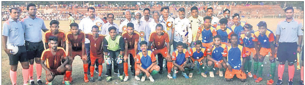
ମ୍ୟାଚ୍ ପୂର୍ବରୁ ଅଭିଭାବକ ଗହଣରେ କଳିଙ୍ଗ କ୍ଳବ୍ ଖେଳାଳି।