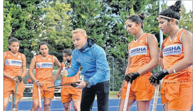
ଖେଳାଳିଙ୍କ ଗହଣରେ କୋର୍ଡିଂ ମାରିଜନେ।

ନୂଆଦିଲ୍ଲୀ, ୧୬/୧୧ (ପି.ଡି.): ଆଗାମୀ ଗୁଜିଲାଣ୍ଡ ଗସ୍ତ ଲାଗି ଭାରତୀୟ ସିନିୟର ମହିଳା ହକି ଦଳର ଏକ କୋର୍ଡିଂ କ୍ୟାମ୍ପ ଯୋଗାଣର ଉଦ୍ଦେଶ୍ୟରେ ଓଡ଼ିଶା ଗୋଲ୍ଡିଂ ଟ୍ରାୟ୍ ଲାଗି ଉପସ୍ଥାପିତ ହେବ।