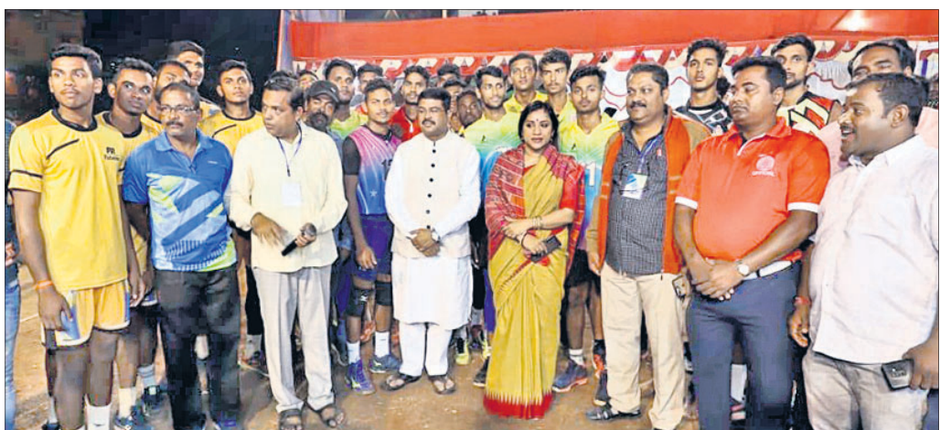
ଉପାଧିକାରୀ ଅବସରରେ ମୁଖ୍ୟ ଅତିଥିକ ସହ ଖେଳାଳି ଓ କର୍ମଚାରୀମାନେ।

କଳିଙ୍ଗ ସ୍କୋର୍ଟିଂ ଆସୋସିଏଶନ ଆନୁକୁଲ୍ୟରେ ଶନିବାର ଉପାଧିକାରୀ ବିବାହ ଉଲ୍ଲସ ଚୁର୍ନିମେଷ୍ଟ ଆରମ୍ଭ ହୋଇଛି।