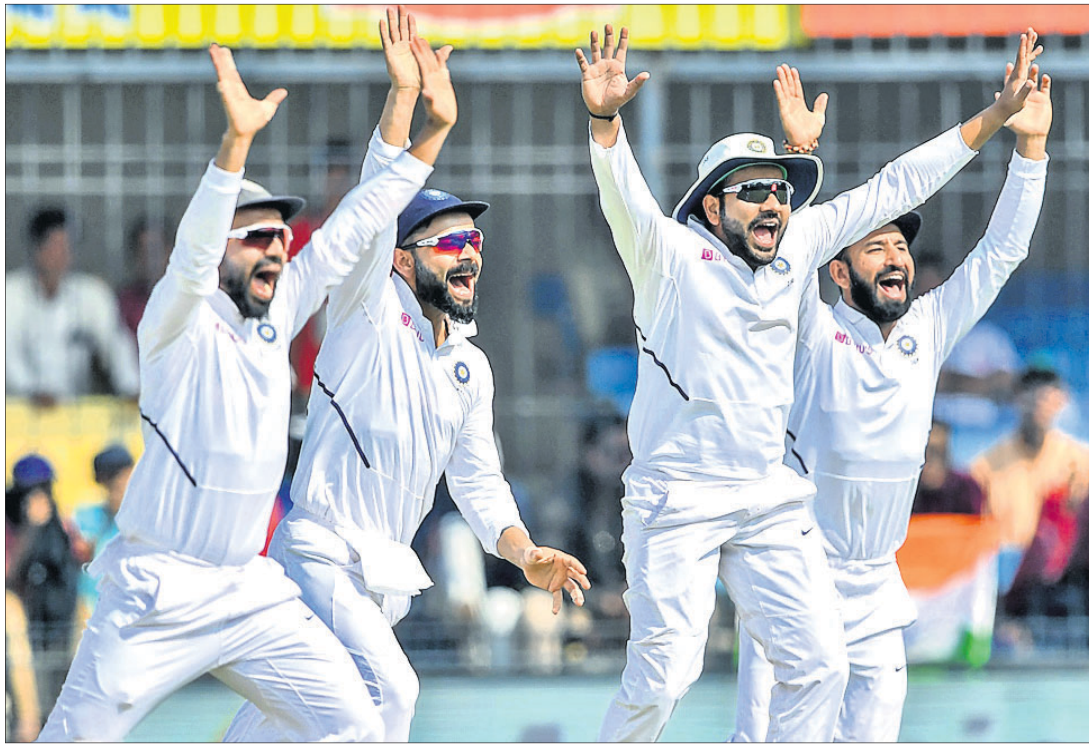
ଉଇକେଟ ପତନ ପରେ ଉତ୍ସାହରେ ଭାରତୀୟ ଖେଳାଳି।