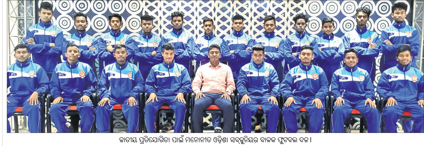
କାତୀୟ ପ୍ରତିଯୋଗିତା ପାଇଁ ମନୋନୀତ ଓଡ଼ିଶା ସର୍ବଭୂମିକାରୀ ବାଳକ ଫୁଟବଲ୍ ଦଳ।

ମିଲିଟାରୀ, ୧୬/୧୧ (ଏଏଫ୍ପି): ଇଣ୍ଡିଆନ ମିଲିଟାରୀ କୋର୍ଟ୍ ଆଣ୍ଡେନିଓ କୋର୍ଟ୍ ପୋଲିସ୍ ସୁରକ୍ଷା ଯୋଗାଇ ଦିଆଯାଇଛି। ତାଙ୍କ ଯୋଗେ ତାଙ୍କ ନିକଟକୁ ଏକ ଗୁଳି ସହ ଧମକପୂର୍ଣ୍ଣ ଚିଠି ଆସିଛି।