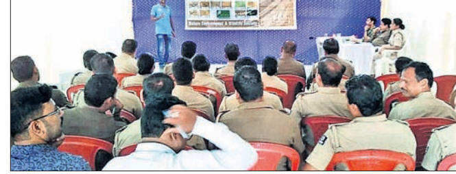
କାର୍ଯ୍ୟକ୍ରମରେ ଅତିଥିଙ୍କ ସହ ବନ କର୍ମଚାରୀ।