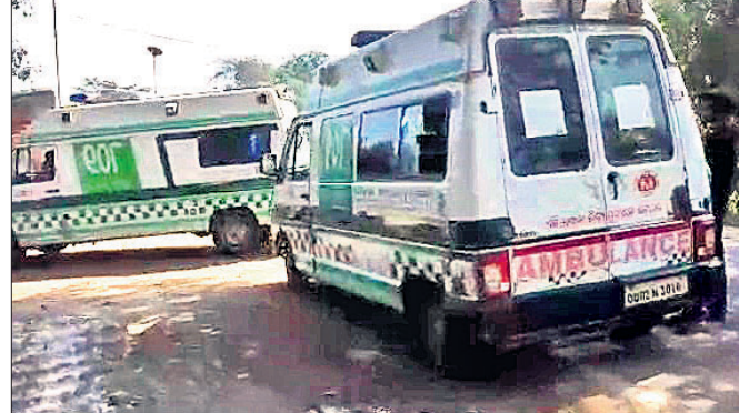
ଖରାପ ହୋଇପଡ଼ିଥିବା ଆତ୍ମହତ୍ୟା।

ଛକଠାରେ କୌଣସି କାରଣରୁ ଗାଡ଼ିଟି ପରେ ଆସିଥିଲା। ଉଭୟ ମା' ଓ ଶିଶୁ ଖରାପ ହୋଇଯିବାକୁ ଆଉ ଆଗକୁ ସେଥିରେ ଭୁବନେଶ୍ୱର ଯାଇଥିଲେ। ଯାଇପାରି ନ ଥିଲା। ପରେ ଯୋଗାଯୋଗ କରିବାକୁ ଆଉ ଏକ ଆତ୍ମହତ୍ୟା ଅଧିକାରୀ