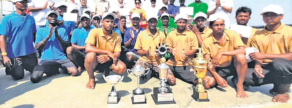
ଆଇଏନ୍ଏସ୍ ଚିଲିକା ପକ୍ଷରୁ ଅନୁଷ୍ଠିତ ନୌଚାଳନା ପ୍ରତିଯୋଗିତା ପରେ ଅତିଥିକ ଗହଣରେ କୃତୀ ମହାଧାରଣୀ।

କାତମରା ଓ ଆହୁଲା ଦୁଇ ପର୍ଯ୍ୟାୟରେ ନୌଚାଳନା ପ୍ରତିଯୋଗିତା ହୋଇଥିଲା। ଆହୁଲାରେ ୧୦ ଓ କାତମରାରେ ୯ଟି ଦଳ ଅଂଶଗ୍ରହଣ କରିଥିଲେ। ପ୍ରତି ଦଳରେ ଜଣେ ଦଳପତିଙ୍କ ସହ ୬ଜଣ ପ୍ରତିଯୋଗୀ ଭାଗ ନେଇଥିଲେ। ଚିଲିକା କେଟିଠାରେ ସ୍ଥାନୀୟ ମହାଧାରଣୀଙ୍କୁ ନେଇ ନୌଚାଳନା ପ୍ରତିଯୋଗିତା ଅନୁଷ୍ଠିତ ହୋଇଥିଲା। କତମରା ସହ ପ୍ରତିଯୋଗିତା ଉନ୍ମୋଚନ କରିଥିଲେ।