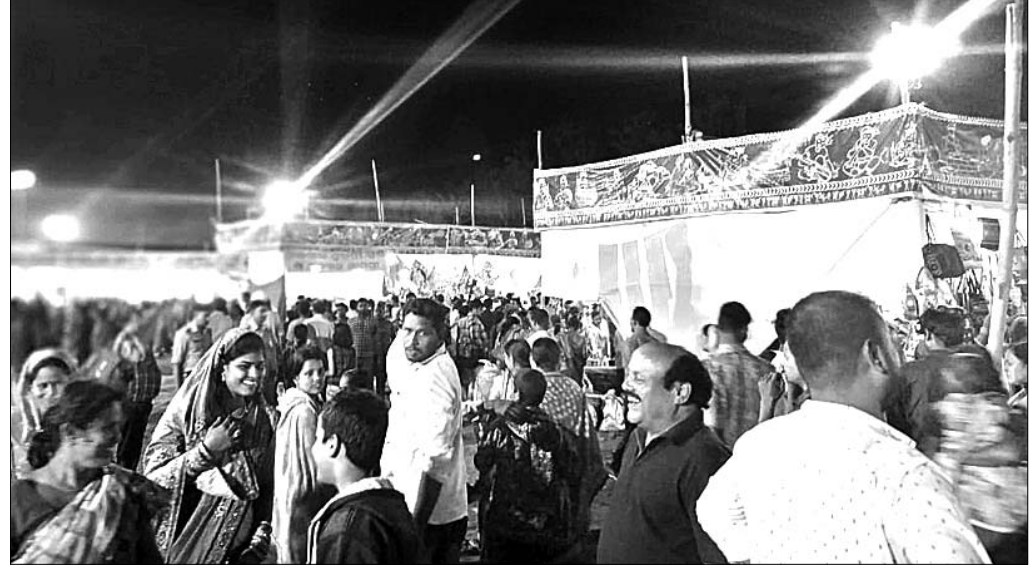
ବାଲିଆପୁରରେ ରବିବାର ସନ୍ଧ୍ୟାରେ ହୋଇଥିବା ଜନଗହଳି।