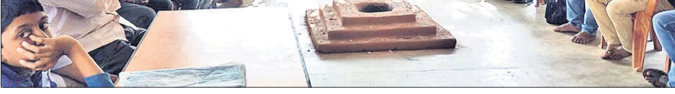
କର୍ମଶାଳାରେ ଅତିଥିଙ୍କ ସହ ଅନ୍ୟମାନେ।