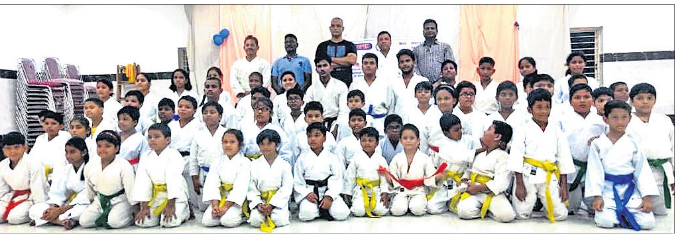
ଉତ୍କଳ କରାଟେ ସ୍କୁଲ କଟକ ଶାଖା ବେଲ୍ ଟେଷ୍ଟ ପରୀକ୍ଷାରେ ଉତ୍ତୀର୍ଣ୍ଣ କରାଟେକାମାନେ।

ଅଫ୍ ବି ମ୍ୟାଚ୍ ବିବେଚିତ ହୋଇଥିଲେ। ପଛରେ ବ୍ୟାଟିଂ କରିଥିବା ଖେଳାଳିଙ୍କୁ କେସ୍‌ରକ ଫ୍ଲିଲ୍‌ସ୍‌ ୩, ଜାହାନ ହୋଲ୍‌ରୁ ଓ କିମୋ ପଲ୍ ୨ଟି ଲେଖାଏ ଉଇକେଟ ହାସଲ କରିଥିଲେ। ଜବାବରେ ଖେଳାଳିଙ୍କୁ ୮ ଉଇକେଟ ହରାଇ ୧୦୬ ରନରେ ସାମିତ ରହି ମ୍ୟାଚ୍ ହାତଛଡ଼ା କରିଥିଲା। ଏଥି ସହିତ ୨ ମ୍ୟାଚ୍ ବିଶିଷ୍ଟ ଏହି ସିରିଜ୍ ଏବେ ୧-୧ ସମତାପରେ ପହଞ୍ଚିଛି। ମାତ୍ର ୧୧ ରନ ବେଳେ ମୁଲ୍ୟବାନ ୫ ଉଇକେଟ ଅଭିଆତ କରିଥିବା ଜନତ ପ୍ଲେୟାର