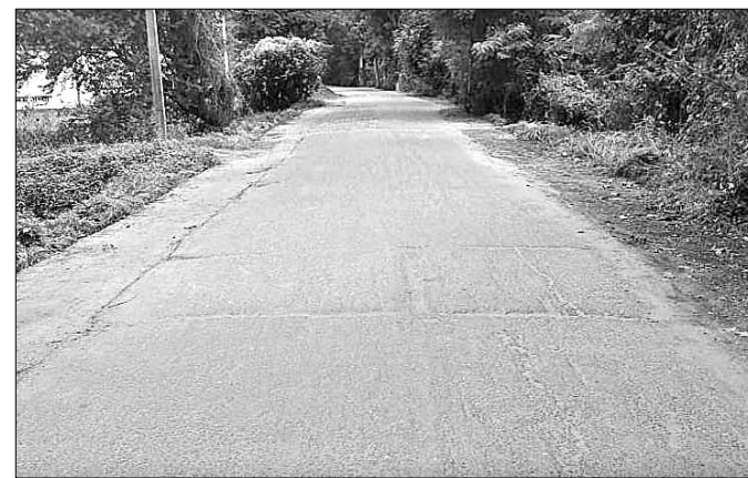
ରାସ୍ତା ସଫେଇ କରାଯାଇଛି।