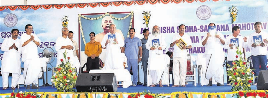
ନିଖୁଣ ଓଡ଼ିଶା 'ସୁଧା ସର୍ବନା' ମହୋତ୍ସବରେ ଅତିଥିମାନେ ସ୍ମରଣିକା 'ତର୍ପଣ' କୁ ଉନ୍ମୋଚନ କରୁଛନ୍ତି।