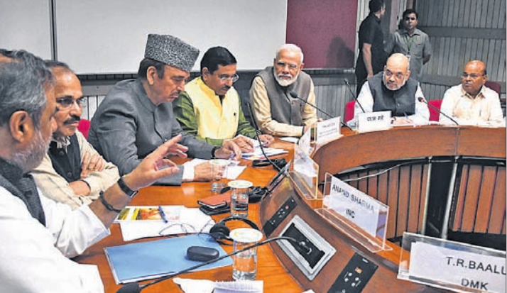
କେନ୍ଦ୍ର ସରକାରଙ୍କ ପକ୍ଷରୁ ରବିବାର ଆହୁତ ସର୍ବକାର୍ଯ୍ୟକ ବିଠକ।

ସର୍ବକାର୍ଯ୍ୟକ ବିଠକରେ ପାରୁକଙ୍କ ଅଟକ ପ୍ରସଙ୍ଗ ଉଠାଇଲେ ବିରୋଧୀ