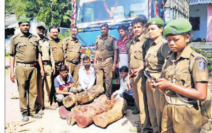
ଜବତ ବୁକ୍, ଚନ୍ଦନ କାଠ ସହ ଗିରଫ ଅଭିଯୁକ୍ତ।

ରାୟଗଡ଼(ଗଜପତି)/ପାରଳାଖେପୁଣ୍ଡି, ୧୭।୧୧(ଡି.ଏନ୍.ଏ./ସ୍ୱ.ପ୍ର.)