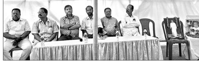
ସ୍ମୃତିସଭାରେ ଯୋଗ ଦେଇଥିବା ଅତିଥି।

ଦୃଷ୍ଟି ଦିଆଯାଇନାହିଁ। ପରେ କ'ଣ ପାଇଁ ଆଉଥରେ ସଫା କରିବାକୁ କୁହାଯିବ। ପୂର୍ତ୍ତନାୟୋଗୀ, ବର୍ଷାପରେ ଗାଁ ଗହଳି ରାସ୍ତାର ଉଭୟ ପାର୍ଶ୍ୱ ଘାସ ଓ ବିଭିନ୍ନ ଲତା ମାଡି ଯାଇଥାଏ। ରାସ୍ତାର ଓହାର କରି ଯିବା ସହିତ ଦୁଇ ପାର୍ଶ୍ୱ ଗହଳିଆ ହୋଇଥିବାରୁ ବିଭିନ୍ନ ସର୍ବାସୁପ ବ୍ୟବସାୟ ପାଇଁ ସୁବିଧା ପାଇଥାନ୍ତି। ଏପରି କି ରାସ୍ତା ଅଣ ଓହାରିଆ ହେବା ସହିତ ସାଧାରଣ ଯିବା ଆସିବାରେ ଅସୁବିଧା ସୃଷ୍ଟି ହୋଇଥାଏ। ଲୋକେ ଦୁର୍ଘଟଣାରେ ସମ୍ପୂର୍ଣ୍ଣ ହୋଇଥାନ୍ତି। ତେଣୁ ଜନସାଧାରଣଙ୍କ ନିରାପତ୍ତାକୁ ଦୃଷ୍ଟିରେ ରଖି ପୂର୍ଣ୍ଣ ବିଭାଗ ପକ୍ଷରୁ ରାସ୍ତାର ଉଭୟ ପାର୍ଶ୍ୱ ସଫେଇ କରାଯିବା ପାଇଁ ବ୍ୟବସ୍ଥା ରହିଛି।