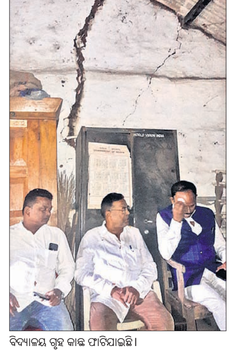
ବିଦ୍ୟାଳୟ ଗୃହ କାଢ଼ି ଫାଟିଯାଇଛି।

ରଖପୁର ବ୍ଲକ୍ କାର୍ଯ୍ୟାଳୟଠାରୁ ୫କିମି ଦୂରରେ ରହିଛି ବଳଭଦ୍ରପୁର ଉଚ୍ଚ ବିଦ୍ୟାଳୟ। ଏଠାରେ ନବମ ଓ ଦଶମ ଶ୍ରେଣୀରେ ୬୦ ଛାତ୍ରୀଛାତ୍ର ଅଧ୍ୟୟନରତ। ତେବେ ଫାଟା କାଢ଼ି ଓ ଭଙ୍ଗା ଶ୍ରେଣୀଗୁଡ଼ିରେ ପିଲାମାନେ ବିପଦସଙ୍କୁଳ ଅବସ୍ଥାରେ ପଢ଼ୁଥିବା ଦେଖାଯାଇଛି। ଏ ନେଇ ଗ୍ରାମବାସୀ, ଅଭିଭାବକ ଓ ସ୍କୁଲ କର୍ତ୍ତୃପକ୍ଷ ବିଭିନ୍ନ ସମୟରେ ଜିଲ୍ଲାପାଳ, ବ୍ଲକ୍ ଓ ଜିଲ୍ଲା ଶିକ୍ଷା ଅଧିକାରୀଙ୍କୁ ଅବଗତ କରାଇଥିଲେ ମଧ୍ୟ ସୁଫଳ ମିଳିନା। ସୂଚନାଯୋଗ୍ୟ ୧୯୮୯ ମସିହାରେ ବଳଭଦ୍ରପୁର ପଞ୍ଚାୟତରେ ବଳଭଦ୍ରପୁର ଉଚ୍ଚ ବିଦ୍ୟାଳୟ ସ୍ଥାପିତ ହୋଇଥିଲା। ଗାଁ ଲୋକେ ଚାହା କରି ମିଳିତ ଭାବେ ହାଇସ୍କୁଲ ନିର୍ମାଣ କରିଥିଲେ। ସେ ସମୟରେ ଜଣା ଓ ପଥରରେ ମାଟି ଯୋଡ଼େଇ କରି ବିଦ୍ୟାଳୟ ଘର ନିର୍ମାଣ ହୋଇଥିଲା। ୨୦୦୪ ମସିହାରେ ଏହି ବିଦ୍ୟାଳୟ