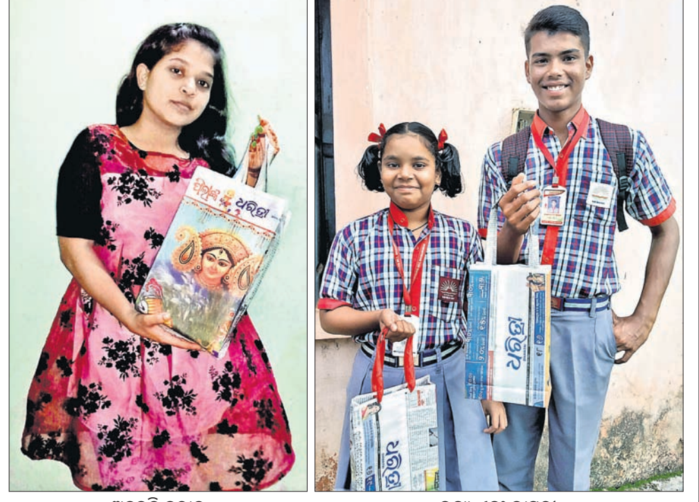
ଅନୁଭୂତି ବରାଳ ଭବ୍ୟ ଏବଂ ଭାସ୍ୱତୀ

ଆପଣଙ୍କ ଫଟୋ ଏଠାରେ ସ୍ଥାନିତ ପାଇଁ ପଠାକୁ plasticfreeodishadht@gmail.com ପୁରସ୍କାର ଜିତିବାକୁ ଯୋଗ୍ୟ ହେବା ପାଇଁ ଆପଣଙ୍କ ଫଟୋ ସହ ପଠାକୁ ନାମ, ଠିକଣା ଓ ମୋବାଇଲ ଫୋନ୍ ନମ୍ବର