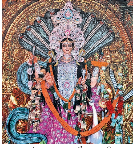
ମଞ୍ଚପରେ ମା'ମନସାଙ୍କ ମୂର୍ତ୍ତି ପୂଜା ପାଉଛି। ମାନସିକଧାରୀମାନେ ଗୋଟିଏ ତରଳରେ ଶିଶୁ, ମହିଳା ଓ ଅନ୍ୟ ତରଳରେ ମାନସିକ

ମହାନଦୀପଡ଼ା ବ୍ଲକ ଅଧୀନ ରାମନଗର ପଞ୍ଚାୟତର ଗ୍ରାମପଞ୍ଚାୟତ ପକ୍ଷରୁ ମହାନଦୀ ତଟରେ ରବିବାରଠାରୁ ଅକାଳ ବୋଧନ ମା' ମନସାଙ୍କ ପୂଜା ଆରମ୍ଭ ହୋଇଛି। ୫ ଦିନ ଧରି ଏହି ପୂଜାସଭା ଅନୁଷ୍ଠିତ ହେବ। କାହିଁ କେଉଁ ଅଂଳରୁ ମହାନଦୀ ତଟରେ ପୂଜା ପାଳି ଆସୁଥିବା ମା'ମନସାଙ୍କ ନିକଟରେ ମାନସିକ ରଖି ପୂଜାର୍ଚ୍ଚନା କଲେ ପରିବାରର ମଙ୍ଗଳ ହୋଇଥାଏ ଓ ସମସ୍ତଙ୍କୁ ସୁସ୍ଥ ଜୀବନ ଯାପନ କରିବେ ବୋଲି ଲୋକଶ୍ରୁତି ରହିଛି। ଗ୍ରାମର କେତେକ ମୂରବୀ କୁହନ୍ତି, ୧୯୯୭ ନଭେମ୍ବର ୧୭ ତାରିଖରେ ଗ୍ରାମରେ ଭୁଲଦିନ ମଧ୍ୟରେ ୫ ଜଣ ସାପ କାମୁଡ଼ାରେ ମୃତ୍ୟୁବରଣ କରିଥିଲେ। ତେବେ ଗ୍ରାମର ମୂରବାମାନେ ପଞ୍ଚତଙ୍କ ପରାମର୍ଶ କ୍ରମେ