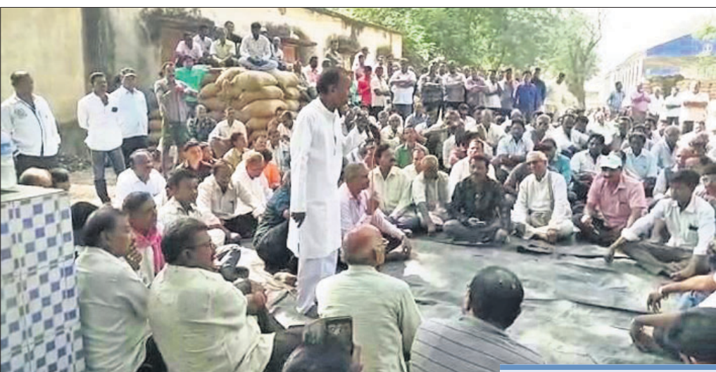
ଗୋଡ଼ଜାଗରେ ଅନୁଷ୍ଠିତ ଚାଷୀ ସମାବେଶ ।