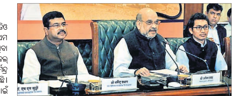
ଶାତକାଳୀନ-ଗ୍ରେଡ୍ ଡିଜେଲ୍ ଯୋଗାଣର ଶୁଭାରମ୍ଭ ଅବସରରେ ଉପସ୍ଥିତ କେନ୍ଦ୍ରମନ୍ତ୍ରୀ ଅମିତ ଶାହ, ଧର୍ମେନ୍ଦ୍ର ପ୍ରଧାନ

କେନ୍ଦ୍ର ଗୃହମନ୍ତ୍ରୀ ଅମିତ ଶାହଙ୍କ ଦ୍ୱାରା ଭିଡ଼ିଓ କନଫରେନ୍ସ ମାଧ୍ୟମରେ ଲଦାଖର ପ୍ରଥମ ଆଇଓସିଲ୍ ଦ୍ୱାରା ତିଆରି ହୋଇଥିବା ସ୍ୱତନ୍ତ୍ର ଶାତକାଳୀନ-ଗ୍ରେଡ୍ ଡିଜେଲ୍ ଯୋଗାଣର ଶୁଭାରମ୍ଭ କେନ୍ଦ୍ରମନ୍ତ୍ରୀ ଧର୍ମେନ୍ଦ୍ର ପ୍ରଧାନଙ୍କ ଉପସ୍ଥିତିରେ ହୋଇଯାଇଛି।