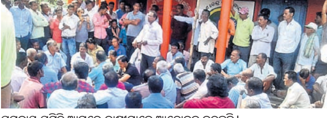
ସମବାୟ ସମିତି ଆଗରେ ଚାଷୀମାନେ ଆନ୍ଦୋଳନ କରୁଛନ୍ତି।

ରାଜକନିକା, ୧୭/୧୧ (ଡି.ଏନ୍.ଏ.) ନେଉଥିବା ଚାଷୀମାନେ ଅଭିଯୋଗ କରିଥିଲେ। ଖବରପାଳ ବ୍ୟାଙ୍କ ପରିଚାଳକ ଆନ୍ଦୋଳନସ୍ଥଳରେ ପହଞ୍ଚି ଚାଷୀଙ୍କଠାରୁ ବରଖାସ୍ତ୍ର ଗ୍ରହଣ କରିଥିଲେ। ଏଥିସହ ଚାଷୀଙ୍କୁ ନ୍ୟାୟ ପ୍ରଦାନ କରାଯିବ ବୋଲି ପ୍ରତିଶ୍ରୁତି ଦେବା ପରେ ଆନ୍ଦୋଳନ ପ୍ରତ୍ୟାହତ ହୋଇଥିଲା। ଏ ସମ୍ପର୍କରେ ସମ୍ପାଦକ ମିଶ୍ରଙ୍କୁ ଯୋଗାଯୋଗ କରିବାରେ, ବହୁଚାଷୀଙ୍କ ଆକାର୍ତ୍ତତା ପାଖରେ ନ ଥିବାରୁ ଚାଷୀଙ୍କ ବାମା ଚଳ ହେଉ କି ରଣ ଛାଡ଼ ହେଉ ସେ ବାବଦ ଉଠାଇ ନିଜ ଆତ୍ମସାଧୁ କରୁଥିବା ବେଳେ ଚାଷୀଙ୍କୁ ଧମକାଉଥିବା ଚାଷୀମାନେ ଅଭିଯୋଗ କରି ଆନ୍ଦୋଳନ କରିଥିଲେ। ସେହିପରି କୌଣସି ପ୍ରାକୃତିକ ବିପର୍ଯ୍ୟୟ ପରେ ଚାଷୀଙ୍କୁ ସହାୟତା ପ୍ରଦାନ ହେଉ କି ରଣ ପ୍ରଦାନ ହେଉ ସମ୍ପାଦକ ପିପି