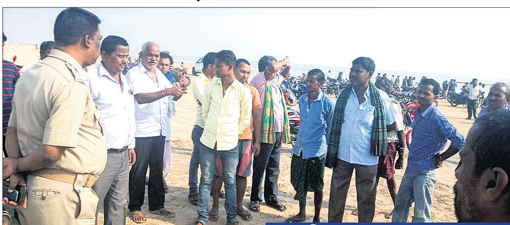
ବେଳାଭୂମିରେ ଲୋକମାନେ ଖୋଜାଖୋଜି କରୁଛନ୍ତି।