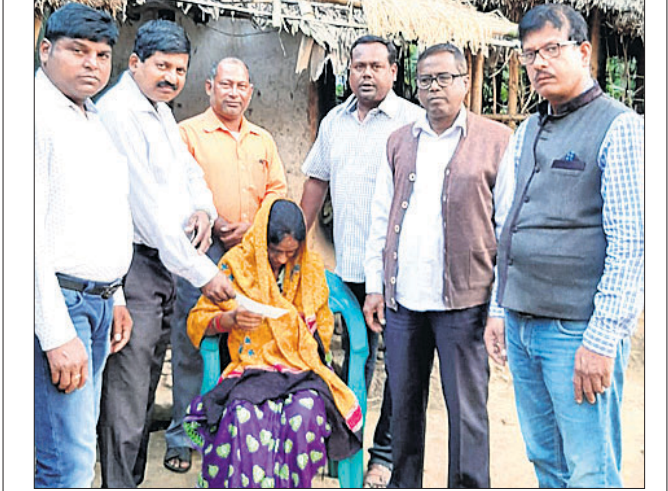
ପଞ୍ଚସଖାର ସଦସ୍ୟମାନେ ମହିଳାଙ୍କୁ ଚେକ ପ୍ରଦାନ କରୁଛନ୍ତି।

ବିଜ୍ଞାନପୁର, ୧୮।୧୧ (ଡି.ଏନ.ଏ) ଅଧୁନା ସମାଜରେ କିଏ କୁଖରେ ପଡିଥିଲେ ଅନାମରେ ମୁହଁ ମୋତି ଚାଲିଯାଇଥିବାବେଳେ ପଞ୍ଚସଖା ସଂଗଠନ ମାନବିକତାର ନିର୍ଦ୍ଦେଶ ପାଳିଛି।