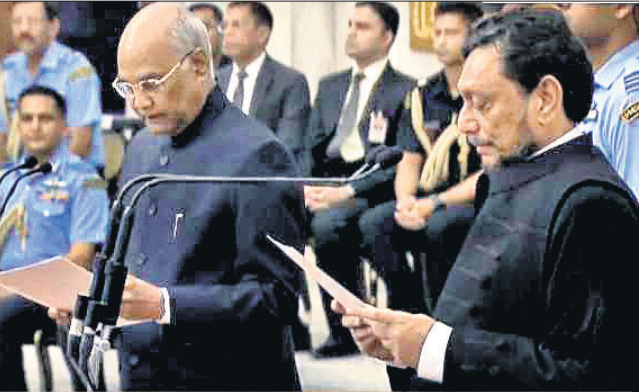
ସିଜେଆଇ ଜଷ୍ଟିସ୍ ବୋର୍ଡ଼େକୁ ରାଷ୍ଟ୍ରପତି ରାମନାଥ କୋବିନ୍ଦ ଶପଥପାଠ କରାଇଛନ୍ତି ।

ଭାରତର ୪୭ତମ ପ୍ରଧାନ ବିଚାରପତି (ସିଜେଆଇ) ଭାବେ ଜଷ୍ଟିସ୍ ଶରଦ୍ ଅରବିନ୍ଦ ବୋର୍ଡ଼େ ସୋମବାର ଶପଥ ଗ୍ରହଣ କରିଛନ୍ତି । ରାଷ୍ଟ୍ରପତି ଭବନର ଦରବାର ହଲ୍‌ରେ ଅନୁଷ୍ଠିତ ଏକ ନିରୀକ୍ଷଣ ଉତ୍ସବରେ ରାଷ୍ଟ୍ରପତି ରାମନାଥ କୋବିନ୍ଦ ତାଙ୍କୁ ଶପଥ ପାଠ କରାଇଥିଲେ । ଜଷ୍ଟିସ୍ ବୋର୍ଡ଼େ ଶୁଭରକ୍ଷା ନାମରେ ଇଂଲଣ୍ଡରେ ଶପଥ ନେଇଥିଲେ । ଜଷ୍ଟିସ୍ ରଞ୍ଜନ ଗୋରୋଲଙ୍କ ଉତ୍ତରାଧିକାରୀ ଭାବେ ୬୩ ବର୍ଷୀୟ ବୋର୍ଡ଼େ ପୂର୍ବରୁ ୧୯୮୩ ଏଠାରେ କାର୍ଯ୍ୟଭାର ଗ୍ରହଣ କରିଛନ୍ତି । ସେ ଏହି ପଦବୀରେ ୨୦୨୧ ଏପ୍ରିଲ ୨୩ ପର୍ଯ୍ୟନ୍ତ ଅର୍ଥାତ୍ ୧୭ ମାସରୁ ଜଷ୍ଟିସ୍ ସମୟ ରହିବେ । ଶପଥ ନେବା ପରେ ଜଷ୍ଟିସ୍ ବୋର୍ଡ଼େ ତାଙ୍କ ମାଆଙ୍କ ପାଦ ଛୁଇଁ ଆଶୀର୍ବାଦ ନେଇଥିଲେ । ତାଙ୍କ ମାଆଙ୍କୁ ଷ୍ଟେସନରେ ରାଷ୍ଟ୍ରପତି ଭବନକୁ ଅଣାଯାଇଥିଲା । ଶପଥ ଗ୍ରହଣ ଉତ୍ସବରେ ଉପରାଷ୍ଟ୍ରପତି ଏମ୍. ଭେଙ୍କାୟା ନାଇଡୁ, ପ୍ରଧାନମନ୍ତ୍ରୀ ନରେନ୍ଦ୍ର ମୋଦି ଓ ଅନେକ ବରିଷ୍ଠ ମନ୍ତ୍ରୀ ଉପସ୍ଥିତ ଥିଲେ । ଏହାବ୍ୟତୀତ ପୂର୍ବତନ ଉପରାଷ୍ଟ୍ରପତି ହରିଦ ଅନ୍ଦୟାରା ଏବଂ ପୂର୍ବତନ ପ୍ରଧାନମନ୍ତ୍ରୀ ମନମୋହନ ସିଂ, ପୂର୍ବତନ ପ୍ରଧାନ ବିଚାରପତି ଆର୍.ଏମ୍. ଲୋଧା, ଟି.ଏସ୍. ଠାକୁର ଏବଂ ଜେ.ଏସ୍. କେହର ପ୍ରମୁଖ ଉତ୍ସବରେ ଯୋଗଦେଇଥିଲେ । ନବନିଯୁକ୍ତ ସିଜେଆଇ ମଞ୍ଚରେ କାମାଜକା ବିଚାରପତି ତ୍ରିଆନ ସାଇକେସ୍ ଏବଂ