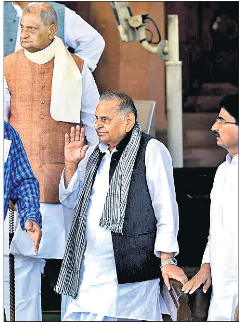
ଏମ୍ପିର ପ୍ରତିଷ୍ଠାତା ମୁଲାଇମ୍ ସିଂ ଯାଦବ ପାର୍ଲିମେଣ୍ଟ ପରିସରରେ ।