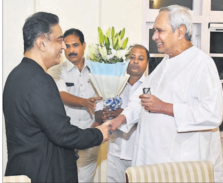
ନବୀନ ନିବାସରେ ମୁଖ୍ୟମନ୍ତ୍ରୀଙ୍କୁ ଭେଟିବା ଅବସରରେ ଏମ୍‌ଏନ୍‌ଏମ୍ ନେତା କମଳ ହାସନ।