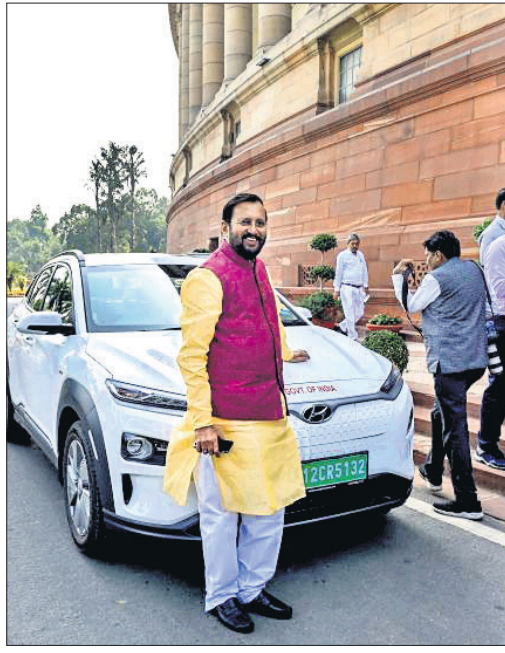
ପାର୍ଲିମେଣ୍ଟକୁ ଇ-କାରରେ ଆସିଛନ୍ତି ମନ୍ତ୍ରୀ ପ୍ରକାଶ ଲାଭତେକର ।