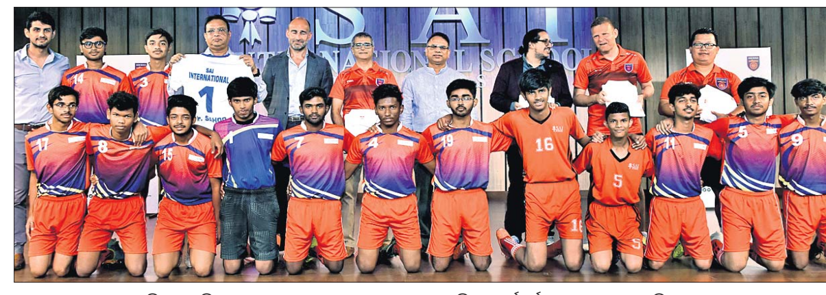
ଓଡ଼ିଶା ଏଫ୍.ସିର ଗ୍ରାସ୍‌ରୁର୍ ପ୍ରୋଗ୍ରାମ ଆରମ୍ଭ ଅବସରରେ ଅତିଥି ଓ କର୍ମଚାରୀଙ୍କ ସହ ଖେଳାଳିମାନେ।

ଇଣ୍ଡରନିଆଗନାଲ ରେସିଡେନ୍ସିଆଲ ସହକାରୀତା କରିବା ସହିତ ରାଜିନୀମା ସାକ୍ଷରୀକରଣ, ଛାତ୍ରାଛାତ୍ରୀଙ୍କ ଖେଳିବାର କ୍ଷମତା ଏବଂ ସେମାନଙ୍କୁ ଠିକ୍ ମାର୍ଗରେ ପରିଚାଳନା ଦ୍ୱାରା ସମ୍ପୂର୍ଣ୍ଣ ବିକାଶ କରାଇ ଜଣେ ପେସାଦାର ଖେଳାଳି ଭାବେ ଗଢ଼ିତୋଳିବା ଏହାର ମୂଳ ଲକ୍ଷ୍ୟ। ସାଲ ଇଣ୍ଡରନିଆଗନାଲ ସ୍କୁଲ ଓ ସାଲ