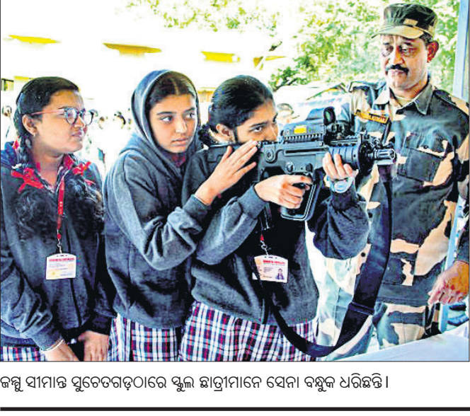
କଳ୍ପ ସାମାଜ ସ୍ମୃତେତରଢ଼ଠାରେ ସୁଲ ଛାତ୍ରମାନେ ସେନା ବନ୍ଧୁକ ଧରିଛନ୍ତି ।

ପ୍ରସ୍ତାନ ପଥକୁ ସାମୟିକ ଭାବେ ବନ୍ଦ କରିଦିଆଯାଇଥିଲା । ସେହିପରି ଉତ୍ତମ ଭବନ ଓ ପଟେଲ ଚୌକୀରେ ଟ୍ରେକ୍ସ ରହିବାକୁ ଦିଆଯାଇ ନ ଥିଲା । ହସ୍ତେଲ୍ ଦେଇ ବୁଦ୍ଧି ପ୍ରତ୍ୟାହାର ସାଙ୍ଗକୁ ଅନ୍ୟ କେତେକ ଦାବି ନେଇ ବିଶ୍ଵବିଦ୍ୟାଳୟ ପରିସରରେ ଛାତ୍ରଛାତ୍ରୀ ଗା ସପ୍ତାହ ହେଲେ ବିକ୍ଷୋଭ କରିବା ସହ ପାର୍ଲିମେଣ୍ଟର ଦୃଷ୍ଟି ଆକର୍ଷଣ ପାଇଁ ସୋମବାର ଶୋଭାଯାତ୍ରାରେ ବାହାରିଥିଲେ । ସରକାର ଦେହବୁଦ୍ଧି ପ୍ରତ୍ୟାହାର ନ କରିବା ପର୍ଯ୍ୟନ୍ତ ଆଲୋଚନାକୁ ଓହରିବେ ନାହିଁ ବୋଲି ଛାତ୍ରଛାତ୍ରୀ କହିଛନ୍ତି ।