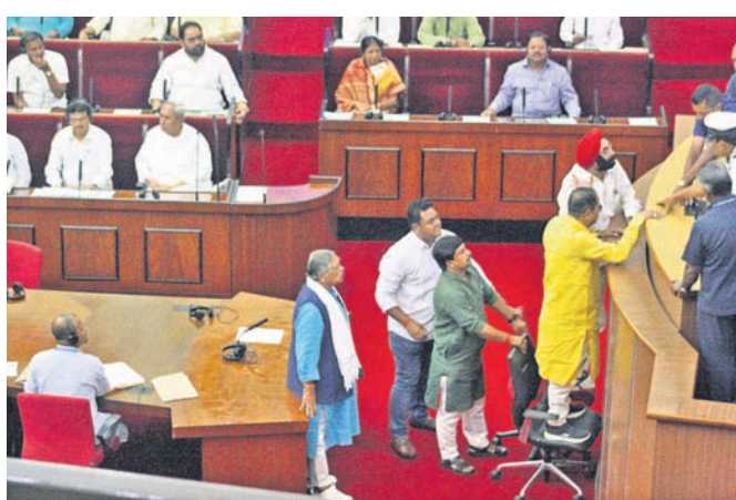
କଂଗ୍ରେସ ସଦସ୍ୟମାନେ ବାରମ୍ବାର ଟୋକନକୁ ଯାଚ ହୋଇଛନ୍ତି।

ଧାନ କିଣା ପାଇଁ ରାଜ୍ୟସ୍ତରୀୟ ଟୋକନ ବ୍ୟବସ୍ଥାକୁ ନେଇ ବରଗଡ଼, ସୋନପୁର, ସମ୍ବଲପୁର, ବଲାଙ୍ଗୀର ଆଦି ଜିଲ୍ଲାରେ ଚାଷୀମାନେ ଆନ୍ଦୋଳନକୁ ଉଲ୍ଲାସିତ। ଚାଷୀଙ୍କ ଠାରୁ ଧାନ କିଣା ଯାଉ ନାହିଁ। ନଭେମ୍ବର ୧୫ରୁ ଧାନ କିଣା ହେବା କଥା, ୩ ଦିନ ହେଲାଣି ଧାନ କିଣାଯାଇ ନାହିଁ। ମଣ୍ଡି ଖୋଲିବା ଆଗରୁ ଦଲାଲ ଓ ମିଳମାଲିକ ଚାଷୀଙ୍କ ଠାରୁ କର୍ମ ଦାମରେ ଧାନ କିଣି ନେଉଥିବା ଅଭିଯୋଗ ହୋଇଛି। ବିଭିନ୍ନ ଜିଲ୍ଲାରେ ଚାଷୀ ଆନ୍ଦୋଳନ ଜାରି ରଖୁଥିବାବେଳେ ଯୋଗଦାନ ବିଧାନସଭାରେ ଗୃହ କାର୍ଯ୍ୟ ଆରମ୍ଭ ହେବା ମାତ୍ରେ କଂଗ୍ରେସ ସଦସ୍ୟମାନେ ଧାନ କିଣାକୁ ନେଇ ପ୍ରବଳ ହୋଇଛନ୍ତି।