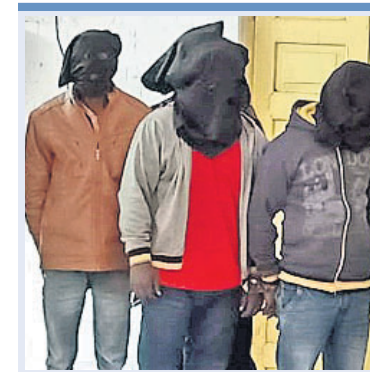
ଗିରଫ ପିଏଲ୍‌ଏଫ୍‌ଆଇ ସଦସ୍ୟ ଓ ଜବତ ସାମଗ୍ରୀ।

ଭୁବନେଶ୍ୱର ପୋଲିସ୍ ଯୋଗଦାନ ୪ ପିଏଲ୍‌ଏଫ୍‌ଆଇ ସଦସ୍ୟଙ୍କୁ ଗିରଫ କରିଛି। ସେମାନଙ୍କଠାରୁ ଦେଶୀ ପିସ୍ତୁଲ, ୨ ଗୁଳି, ୨ ମୋବାଇଲ୍ ଫୋନ୍, ଗୋଟିଏ ବାଇକ୍ ସହ ନଗଦ ୩୦୦ଟଙ୍କାର ଟଙ୍କା ଜବତ କରାଯାଇଛି। ସମସ୍ତ ଅଭିଯୁକ୍ତଙ୍କୁ କୋର୍ଟ ଚାଲାଣ କରାଯାଇଥିଲା। ଜାମିନ ନାମାଣ୍ଡରେ ହେବାରୁ ସମସ୍ତଙ୍କୁ କେଲ ହାକତକୁ ପଠାଇ ଦିଆଯାଇଛି।