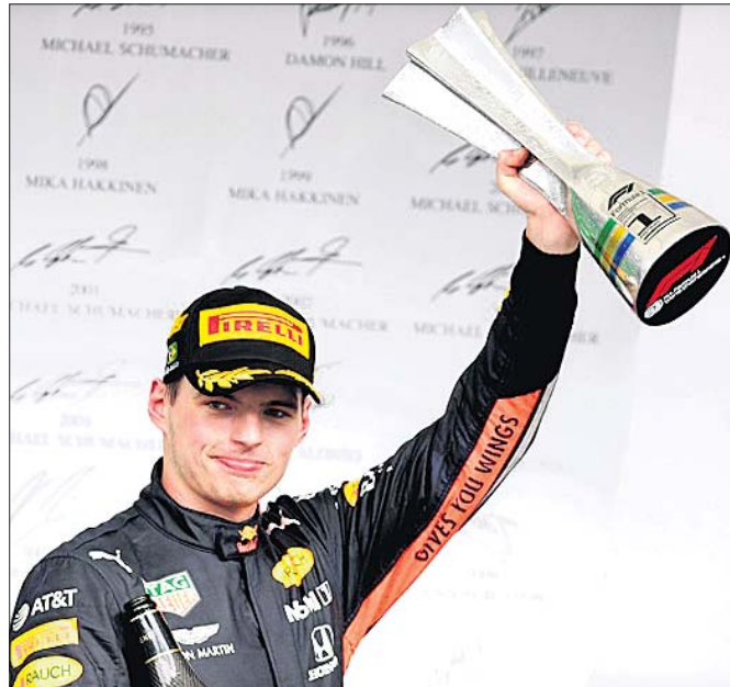
ଡ୍ରାଫ୍ଟ୍ ସହ ମାକ୍ ଭର୍ଷ୍ଟାପେନ।

ରେଡ୍ ବୁଲ୍ଡ୍ ବ୍ରାଜିଲର ମାକ୍ ଭର୍ଷ୍ଟାପେନ ଏଠାରେ ଅନୁଷ୍ଠିତ ବ୍ରାଜିଲିଆନ୍ ଗ୍ରାଁ ପ୍ରି ଫର୍ମୁଲା ଓଏ୍ ରେସ୍ରେ ଚାମ୍ପିୟନ ହୋଇଛନ୍ତି। ଭର୍ଷ୍ଟାପେନଙ୍କ କ୍ୟାରିୟରରେ ଏହା ମୋଟ୍ ୮ମ ଫର୍ମୁଲା ଓଏ୍ ଟାଇଟଲ୍ ବିଜୟ ଥିଲା। ଏହି ରେସ୍ରେ ଫେରାଟାର ଉଭୟ ବ୍ରାଜିଲର ସେବାଷ୍ଟିଆନ ଭେଟେଲ୍ ଓ ଚାର୍ଲସ୍ ଲେକ୍ଲିୟରଙ୍କ ମଧ୍ୟରେ ଦୁର୍ଦ୍ଦିବ୍ୟ ଘଟିବା ସବୁଠାରୁ ଚର୍ଚ୍ଚା ବିଷୟ ରହିଥିଲା। ଏହାପରେ ଉଭୟ ଭେଟେଲ୍ ଓ ଚାର୍ଲସ୍ ରେସ୍କୁ