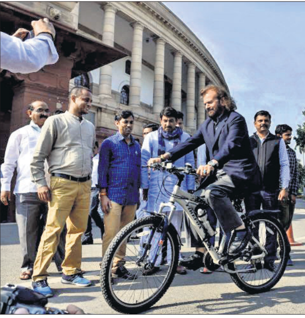
ସାଇକେଲରେ ଭାଜପା ଏମ୍ପି ହୁଏରାଜ ହୁଏ ।