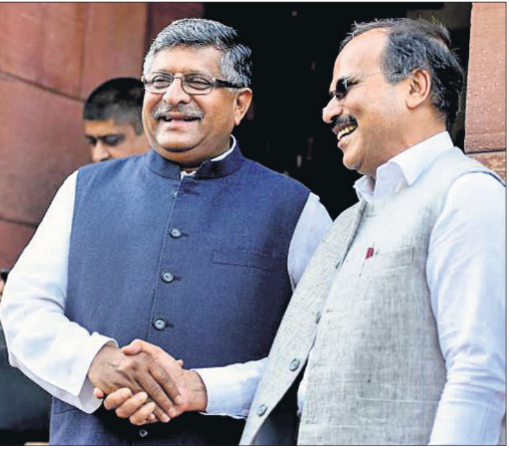
ଅଧିବେଶନ ପୂର୍ବରୁ କଂଗ୍ରେସ ନେତା ଅଧୀରଞ୍ଜନ ଚୌଧୁରୀଙ୍କ ସହ ଆଇନମନ୍ତ୍ରୀ ରବିଶଙ୍କର ପ୍ରସାଦ ।