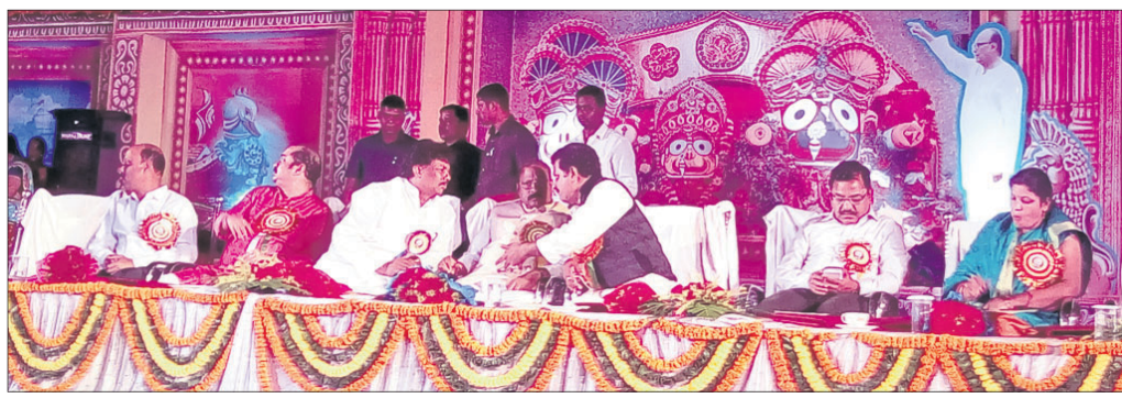
ବାଲିଯାତ୍ରା ଉଦ୍‌ଯାପନା ଉତ୍ସବରେ ଯୋଗଦେଇଥିବା ଅତିଥି।

ପାରାଦୀପ କଳିଙ୍ଗ ବାଲିଯାତ୍ରା ମହୋତ୍ସବ ଯୋଗ୍ୟତା ଉଦ୍‌ଯାପିତ ହୋଇଯାଇଛି। ଉଦ୍‌ଯାପନା ସନ୍ଧ୍ୟାରେ ପୁଷ୍ୟ ଅତିଥିଭାବେ ରାଜ୍ୟ ମନ୍ତ୍ରୀ ସୁଦାମା ମାଣି ଯୋଗ ଦେଇଥିଲେ।