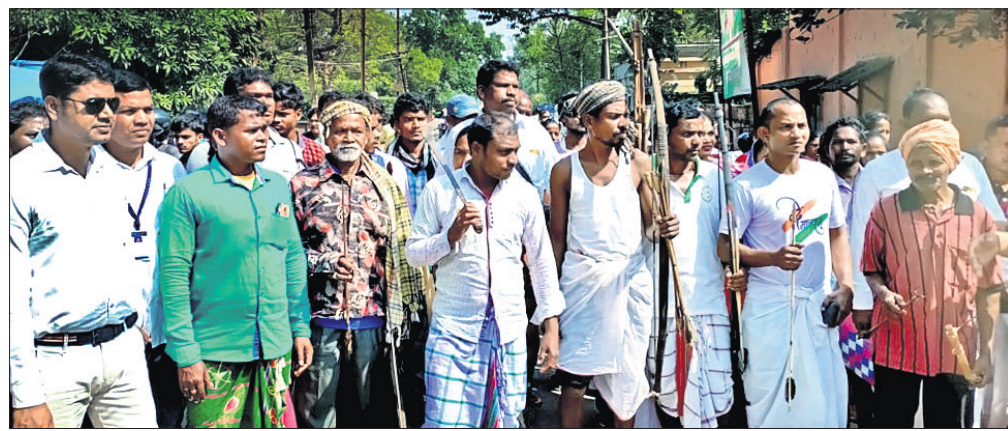
ଖଣି ଅଞ୍ଚଳ ସୂଚକ ମଞ୍ଚ ସଦସ୍ୟମାନେ ଅସ୍ତ୍ରଶସ୍ତ୍ର ଧରି ବିକ୍ଷୋଭ ପ୍ରଦର୍ଶନ କରୁଛନ୍ତି।

ଯାଜପୁର ଜିଲ୍ଲା ଖଣିଜ ପଦାର୍ଥ ପ୍ରତିଷ୍ଠାନ (ଡିଏମ୍ଏଫ୍) ପାଣିର ଦୁରୁପଯୋଗ ହେଉଛି। ୪୯୫୮ ମାସ ହେଲା ଡିଏମ୍ଏଫ୍ ପ୍ରତିଷ୍ଠା ହୋଇଛି। ଏଯାବତ୍ ଏହି ପାଣିର ଶତାଧିକ କୋଟି ଟଙ୍କା ଗଠିତ ଥିଲେ ମଧ୍ୟ ଆଦିବାସୀ ବହୁଳ ଖଣି ଅଞ୍ଚଳବାସୀଙ୍କ ମୌଳିକ ସମସ୍ୟା ସମାଧାନ ଦିଗରେ ଜିଲ୍ଲା ପ୍ରଶାସନର ଆନ୍ତରିକତା ଥିଲାଭଳି ମନେ ହେଉନାହିଁ। ଗତ ୬ମାସରୁ ଅଧିକ ସମୟ ହେଲା ଡିଏମ୍ଏଫ୍ ବିନିଯୋଗ ସଂକ୍ରାନ୍ତୀୟ ଅଧିକାଂଶ କିମ୍ବା ବୈଦିକ ଅନୁଷ୍ଠାନ ନ ହେବା ପ୍ରଶାସନିକ ଅବହେଳାର ଚରମ ନିଦର୍ଶନ। ଅନୁପକ୍ଷରେ ଜିଲ୍ଲା ପ୍ରଶାସନ ସମ୍ଭାଷଣରେ ଡିଏମ୍ଏଫ୍ ପାଣି ଖଣି ଅଞ୍ଚଳରୁ ଦୂରଦୂରାନ୍ତରେ ବିନିଯୋଗ ଭାବେ ବିନିଯୋଗ କରାଯାଇଛି ବୋଲି ଖଣି ଅଞ୍ଚଳ ସୂଚକ ମଞ୍ଚ ପକ୍ଷରୁ ଅଭିଯୋଗ ହୋଇଛି। ଏହି ମର୍ମରେ ସୋମବାର ମଞ୍ଚର ଶତାଧିକ ମହିଳା ଓ ପୁରୁଷ ଚାକ୍ ପାରମ୍ପରିକ ଅସ୍ତ୍ରଶସ୍ତ୍ର ଧରି ବ୍ୟାସନଗର ଗୋପବନ୍ଧୁ ହକ୍ସଲୁ ମୁନିସିପାଲିଟିରେ ପହଞ୍ଚି ବିକ୍ଷୋଭ ପ୍ରଦର୍ଶନ କରିଥିଲେ। ଏହାପରେ ଭାରପ୍ରାପ୍ତ ଜିଲ୍ଲାପାଳ ମିହିର ପ୍ରସାଦ ମହାନ୍ତିଙ୍କ ଏକ ସ୍ମାରକପତ୍ର