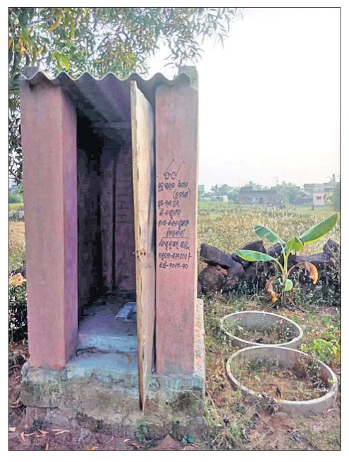
ଅଧ୍ୟାପକରିଆ ହୋଇ ପଡ଼ିରହିଥିବା ଏକ ପାଇଖାନା ।

ନୟାଗଡ଼ ଜିଲ୍ଲା ରଣପୁର ବ୍ଲକ୍ କନ୍ଦନୟାଗଡ଼ ପଞ୍ଚାୟତରେ ସ୍ୱଚ୍ଛ ଭାରତ ମିଶନରେ ନିର୍ମାଣ ହେଉଥିବା ପାଇଖାନା ଦୁର୍ନୀତିର ଗତ ୬ ତାରିଖରେ ତଦନ୍ତ ହୋଇଥିଲା । ହେଲେ ୩ ଖାର୍ତ୍ତରେ ତଦନ୍ତ ହୋଇଥିବାବେଳେ ୧୦ ଖାର୍ତ୍ତକୁ ବାଦ୍ ଦିଆଯାଇଥିବା ବେଳେ ଗତ ୧୧ତାରିଖରେ ଜିଲ୍ଲାପାଳଙ୍କ ଅଭିଯୋଗ ଶୁଣାଣିରେ ସ୍ଥାନୀୟ ବାସିନ୍ଦା ଫୋରା ଦେଇଛନ୍ତି । ଅଭିଯୋଗ ଅନୁସାରେ ସ୍ୱଚ୍ଛ ଭାରତ ମିଶନରେ ନିର୍ମାଣ ହେଉଥିବା ପାଇଖାନା ପାଇଁ ୧୨ ହଜାର ଟଙ୍କା ଅନୁଦାନ ମିଳୁଛି । ତେବେ ଏଥିପାଇଁ ୩ରୁ ୪ହଜାର ଟଙ୍କା ପିସି ଦେବାକୁ ପଡ଼ୁଛି । ପିସି ଦେଇଥିବା ହିତାଧିକାରୀ ବିଲ୍ ପାଇ ସାରିଲେଣି । ଯେଉଁମାନେ ପିସି ଦେଉନାହାନ୍ତି ସେମାନେ ପାଇଖାନା ନିର୍ମାଣ ପରେ ବି ସରକାରୀ ଅନୁଦାନ ପାଇନାହାନ୍ତି । କନ୍ଦନୟାଗଡ଼ରେ ପ୍ରାୟ