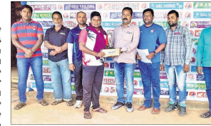
ମ୍ୟାଚରେ ବିଜେତା ଦଳକୁ ପୁରସ୍କାର ପ୍ରଦାନ କରାଯାଇଛି।

ରାଜ୍ୟସ୍ତରୀୟ ୬ଷ୍ଠ ବାର୍ଷିକ ସଞ୍ଚିତ ମେମୋରିଆଲ କ୍ରିକେଟ ଚୁର୍ଣ୍ଣାମେଣ୍ଟ ସୋମବାର ପ୍ରଥମ ସେମିଫାଇନାଲ ଖେଳ ଅନୁଷ୍ଠିତ ହୋଇଛି। ବଡ଼ତଣା ବ୍ଲକ ବୁଲ୍‌କରନଗର ପାଟଣା ଖେଳ ପଡିଆଠାରେ ମା' ତାରିଣୀ ସ୍ପୋର୍ଟ୍ କ୍ଲବ ଆନୁକୁଲ୍ୟରେ ଅନୁଷ୍ଠିତ ପ୍ରଥମ ସେମିଫାଇନାଲ କୁଭେନାଲ କ୍ରିକେଟ କ୍ଲବ କଟକ ଓ ସୋଲାର କ୍ରିକେଟ କ୍ଲବ କଟକ ମଧ୍ୟରେ ହୋଇଥିଲା।