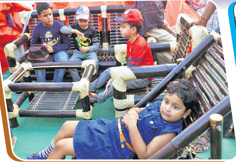
ପଲ୍ଲିଶ୍ରୀ ମେଳାରେ ବାଉଁଶ ତିଆରି ଯୋଡ଼ାରେ ପିଲାମାନେ ବସିଛନ୍ତି।