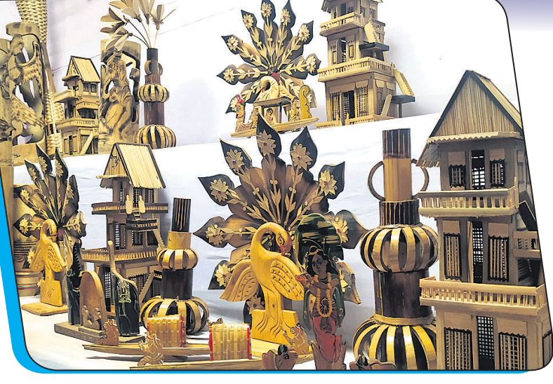
ପଲ୍ଲିଶ୍ରୀ ମେଳାରେ ବିକ୍ରି ପାଇଁ ରଖାଯାଇଥିବା ବାଉଁଶ ତିଆରି ହସ୍ତଶିଳ୍ପ ସାମଗ୍ରୀ।