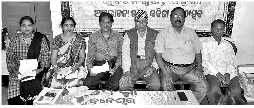
ରାଜଧାନୀ କଳା ସଂସଦରେ ଭାଷା ସଂସ୍କୃତି ସମାଜ ପକ୍ଷରୁ ଅନୁଷ୍ଠିତ ଆଲୋଚନାଚକ୍ରରେ ଉପସ୍ଥିତ ଅତିଥି ।

ବାଲିପାଟଣା, ୧୮।୧୧(ଡି.ଏନ୍.ଏ.): ଶିକ୍ଷୟିତ୍ରୀଙ୍କୁ ଅସଦାଚରଣ ଅଭିଯୋଗରେ ବାଲିପାଟଣା ଥାନା ପୋଲିସ୍ ଯୋଗଦାନ କଲେ ଅଭିଯୁକ୍ତ ଗିରଫ କରି କୋର୍ଟ ଚାଲାଇ ଦେଇଛି ।