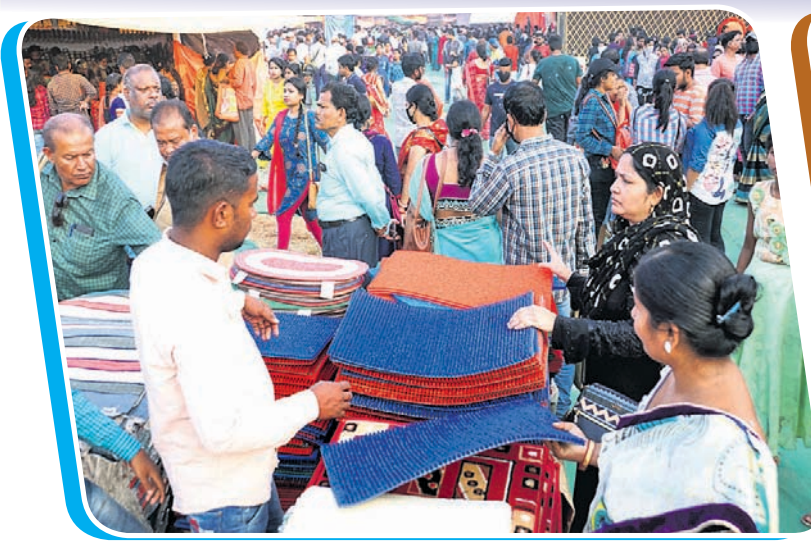
ବାଲିଯାତ୍ରା ପଲ୍ଲିଶ୍ରୀ ମେଳାରେ ମହିଳାମାନେ କାର୍ପେଟ କିଣୁଛନ୍ତି।