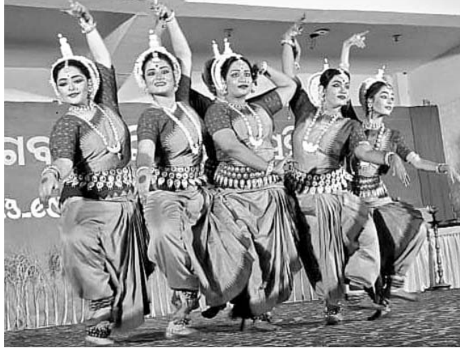
କାର୍ଯ୍ୟକ୍ରମରେ ନବ ପ୍ରତିଭାର କଳାକାରମାନେ ଓଡ଼ିଶା ନୃତ୍ୟ ପରିବେଷଣ କରୁଛନ୍ତି।

ଗୋବଂଶ ବିକାଶରେ ଦେଶର ସ୍ୱାର୍ଥ ନିହିତ। ଗୋବର ଓ ଗୋପ୍ରସ୍ତର ଚୈବିକ କୃଷି ଓ ପଞ୍ଚଗବ୍ୟ ଔଷଧ ପ୍ରସ୍ତୁତି କରାଯାଇପାରିବ।