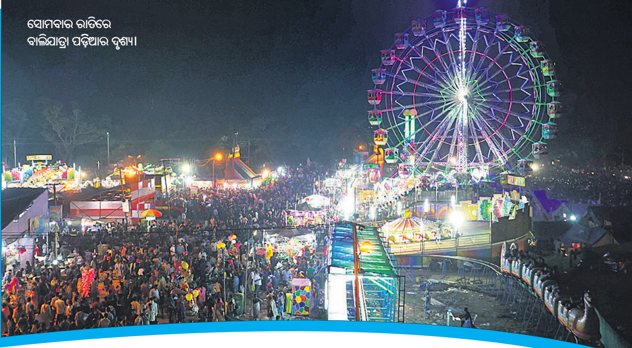
ସୋମବାର ରାତିରେ ବାଲିଯାତ୍ରା ପଡ଼ିଆର ଦୃଶ୍ୟ।