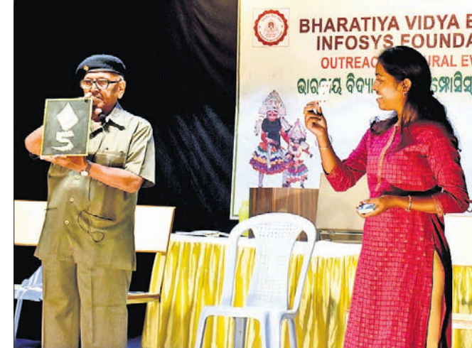
ପ୍ରାଚୀନ ଯାଦୁକରୀ ବିଦ୍ୟାର ନିଜ ରହିଛି। କିନ୍ତୁ ବର୍ତ୍ତମାନ ଏହି ବିଦ୍ୟା ଏବେ ଲୁପ୍ତପ୍ରାୟ ଅବସ୍ଥାରେ ପହଞ୍ଚିଥିଲେ ମଧ୍ୟ କେତେଜଣ ବଞ୍ଚାଇ ରଖିବାରେ ସମର୍ଥ ହୋଇଛନ୍ତି। ସେମାନଙ୍କ ମଧ୍ୟରୁ ଅଗ୍ରଣୀୟ। ତାଙ୍କର ଯାଦୁକରୀ ଯୋଗଦାନ ଭାରତୀୟ ବିଦ୍ୟାଭବନରେ ଉପସ୍ଥିତ ସମସ୍ତ ଦର୍ଶକଙ୍କୁ ଚଳିତ କରିଦେଇଥିଲା। ସେ ଆଖି ଖୋଲୁ କି ଖବରକାଗଜକୁ ଚିରି ପୁଣି ଥରେ ଯୋଡ଼ିବା, ୨୫ଜଣ ଚଳିଆ ନୋଟ୍‌ସ