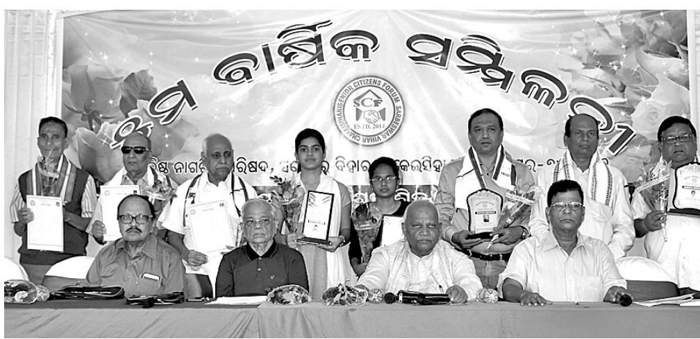
ମଞ୍ଜୁଶ୍ୟର ଇଣ୍ଡଷ୍ଟ୍ରିଆଲ ଡ୍ରିଟ୍ ଲା ଫିଏଷ୍ଟା କଲ୍ୟାଣ ମଣ୍ଡପରେ ଯୋଗଦାନ ସିନିୟର ସିଡିଏନ ଫୋରମ ଚକେଇସିଆଣି ପକ୍ଷରୁ ଅନୁଷ୍ଠିତ ୫ମ ବାର୍ଷିକ ସମ୍ମିଳନୀରେ ଉପସ୍ଥିତ ଅତିଥିଙ୍କ ଉଦ୍‌ଘାଟନ ସମ୍ବନ୍ଧିତ ବ୍ୟକ୍ତିଚିତ୍ରମାନେ ।

ବାଲିଅନ୍ତା କୁଳ ଅନ୍ତର୍ଗତ ସରକ୍ଷଣା ପଞ୍ଚାୟତର ଡିଜିଟାଲ ସ୍ଥାନରେ ଥିବା ପାଠ୍ୟ ପ୍ରକଳ୍ପକୁ ଉଦ୍‌ଘାଟନ କରାଯାଇଛି ।