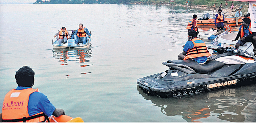
ବାଲିଯାତ୍ରାର ଚଳପଡ଼ିଆ ମହାନଦୀ ଘାଟରେ ନୌବିହାର।