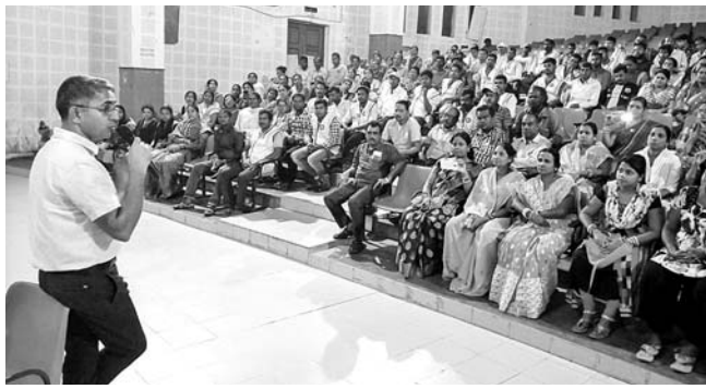
ଗଭର୍ନରଙ୍କ ପରିସରରେ ଆୟୋଜିତ ବୈଠକରେ ଜିଲାପାଳ ସୂଚନା ଦେଉଛନ୍ତି।

ପର୍ଯ୍ୟଟନ ସହର ପୁରୀକୁ ପ୍ରତ୍ୟହ ଦେଶ ବିଦେଶର ପର୍ଯ୍ୟଟକ ଏବଂ ଶ୍ରଦ୍ଧାଳୁ ଆସୁଛନ୍ତି। ତେଣୁ ସହରକୁ ଆହୁରି ସ୍ୱଚ୍ଛ ଓ ପରିଷ୍କାର ରଖିବା ଲାଗି ପ୍ରଶାସନ ପକ୍ଷରୁ ବିଭିନ୍ନ ପଦକ୍ଷେପ ନିଆଯାଉଛି।