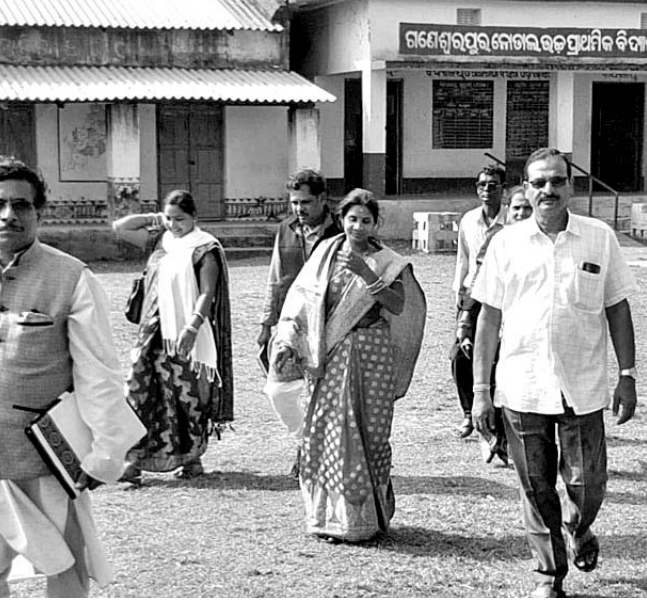
ଜିଲାପରିଷଦ ଷ୍ଟାଫ୍ କମିଟିର ସଭ୍ୟମାନେ ଏକ ସ୍ଥଳ ପରିଦର୍ଶନ କରୁଛନ୍ତି।

ପ୍ରସ୍ତୁତ କରିଥିବା ଅଭିଯୋଗ ହେଉଛି। ଏ ନେଇ ଏବେ ସବୁ କ୍ଷେତ୍ରରେ ଅଧିକାଂଶ ପରିସ୍ଥିତି ଉପୁଜିଲାଣି।