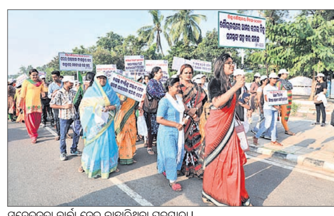
ସଚେତନତା ବାର୍ତ୍ତା ନେଇ ବାହାରିଥିବା ପଦଯାତ୍ରା।