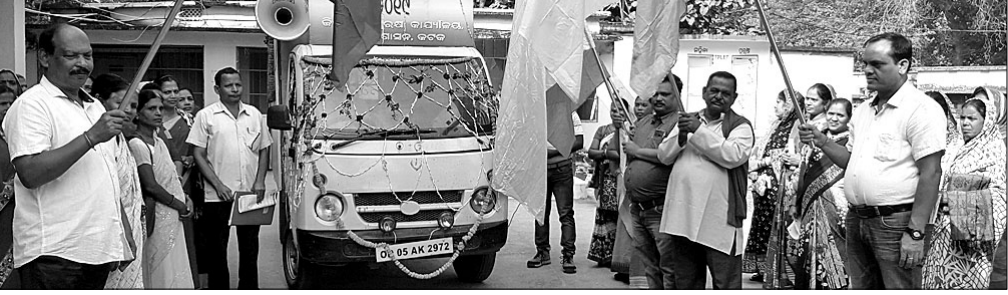
ନରସିଂହପୁରରେ ସଚେତନତା ରଥକୁ ଶୁଭାରମ୍ଭ କରାଯାଇଛି ।

ପରେ କୋର୍ଟ ମାଧ୍ୟମରେ ଅର୍ଥ ପ୍ରଦାନ କରି ପୋଷ୍ୟ ସନ୍ତାନ ଗ୍ରହଣ କରାଯାଇପାରିବ ବୋଲି ସଚେତନତା ରଥ ଛାଡ଼ିଆରେ ଲୋକଙ୍କୁ ଜୁହାଯାଇଥିଲା । ଏହି କାର୍ଯ୍ୟକ୍ରମରେ ନିଜଗଡ଼, କାକୁଡ଼ିଆ, ପାଇକପଡାପାଟଣା, ପାର୍ବତୀପୁର, ଆଇଁସିଆ, ନିମସାହି ଅଞ୍ଚଳର ଅଜ୍ଞାନଘାଟି କର୍ମୀ ଓ ସାମାଜିକ କର୍ମୀମାନେ ସହଯୋଗ କରିଥିଲେ । ସୂଚନାଯୋଗ୍ୟ, ଗତ ୨ ଦିନ ତଳେ କଟକ ଜିଲ୍ଲାପାଳଙ୍କ ଦ୍ୱାରା ଏହି ରଥକୁ ଉଦ୍ଘାଟନ କରାଯାଇଥିଲା ।