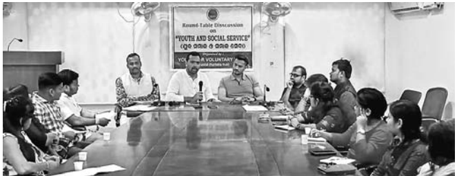
ଆଲୋଚନାଚକ୍ରରେ ଉପସ୍ଥିତ ସଂଗଠନର କର୍ମକର୍ତ୍ତା ଓ ଅନ୍ୟମାନେ ।