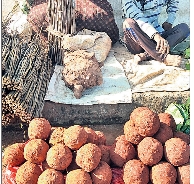
ଆଦିବାସୀ ସମ୍ପ୍ରଦାୟର ଲୋକେ ମାଟି ଘରକୁ ଲିପିବା ସହ ରଜେଇବା ପାଇଁ ଏହି ମାଟିକୁ ବ୍ୟବହାର କରିଥାନ୍ତି । ଏହାର ମୂଲ୍ୟ ଗୋଟିଏକ ୨୦ ଟଙ୍କା । ବିଶେଷ କରି ଅଷ୍ଟମୀ ସମୟରେ ଏହା ବେଶି ମିଳିଥାଏ ।

ଆନନ୍ଦପୁର / ହାଟଡିହା, ୨୦୧୯ (ସ.ପ୍ର./ଡି.ଏନ.ଏ.)- ଆନନ୍ଦପୁର ଥାନା ଅନ୍ତର୍ଗତ ଶିବନାରାୟଣପୁରଠାରେ ପାଣ୍ଡାରିକର ଦୁର୍ଘଟଣାଗ୍ରସ୍ତ ହୋଇଥିବାରୁ ଦିନସ୍ୱାଦିତରେ ନାମକ ଜଣେ ଚାଷୀ ଗୁରୁତର ଅହତ ହୋଇଥିବା ସୂଚନା ମିଳିଛି ।