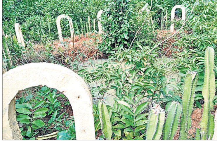
କୂଅ ଚାରିପଟେ କରାଯାଇଥିବା ସବୁଜ ବାଡ଼।

ସେମାନଙ୍କ ଶାବକ ଖସିପଡ଼ୁଛନ୍ତି। ଏପରି ଦୁର୍ଘଟଣା ଏହାପରେ କୂଅ ଚାରିପଟେ ସବୁଜ ବାଡ଼ ଘେରାବନ୍ଦୀ କରାଯାଇଛି। ବନ୍ୟପ୍ରାଣୀଙ୍କ ଜୀବନ ପ୍ରତି ବିପଦ ସୃଷ୍ଟି କରୁଥିବା କୂଅଚୂଳିକ ସମ୍ପର୍କରେ ଅନୁଷ୍ଠାନ ପକ୍ଷରୁ ଆବଶ୍ୟକ ବନ୍ୟପ୍ରାଣୀ ଗ୍ରନ୍ଥକୁ ସବିଶେଷ ଚିନ୍ତା ପ୍ରଦାନ କରାଯାଇଥିଲା। ଏହାପରେ ଗ୍ରନ୍ଥ ପଢ଼ି ସବୁଜ ବାଡ଼ ଘେରାବନ୍ଦୀ ପାଇଁ ଆର୍ଥିକ ଅନୁଦାନ ଦିଆଯାଇଥିଲା। ପ୍ରତି କୂଅ ନିକଟରେ ସୂଚନା ପତ୍ରକ ସହ ସାବଧାନତା ଚିହ୍ନ ଲଗାଯାଇଛି। ଏ