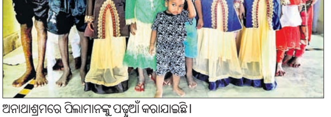
ଅନାଥାଶ୍ରମରେ ପିଲାମାନଙ୍କୁ ପଢ଼ୁଆଁ କରାଯାଇଛି ।

ଆନନ୍ଦପୁର/ସିଦ୍ଧପୁରା, ୨୦୧୯ (ସ.ପ୍ର./ଡି.ଏନ.ଏ.) ଯଦିପୁରା ଠାରେ ଥିବା ଅନାଥ ଆଶ୍ରମ "ସେଲଫ ରିଥାଲାଇଜେସନ୍ କାର୍ଯ୍ୟକ୍ରମ" ପକ୍ଷରୁ ପ୍ରଥମାଷ୍ଟମୀ ପାଳନ କରାଯାଇଛି ।