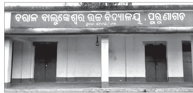
ନ ଥିବା ପିଲାମାନଙ୍କ ପୁରୁଷା ବିପଦ ହେଉଛି । ଅଧ୍ୟାୟିକ ବ୍ୟକ୍ତିମାନେ ଅବାଧ ...