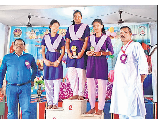
ଅତିଥିଙ୍କ ଗହଣରେ କୃତା ପ୍ରତିଯୋଗୀମାନେ।