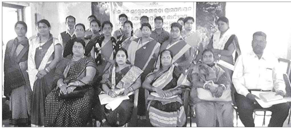
ତାଲିମ କାର୍ଯ୍ୟକ୍ରମରେ ଯୋଗ ଦେଇଥିବା ପ୍ରତିନିଧିମାନେ ।