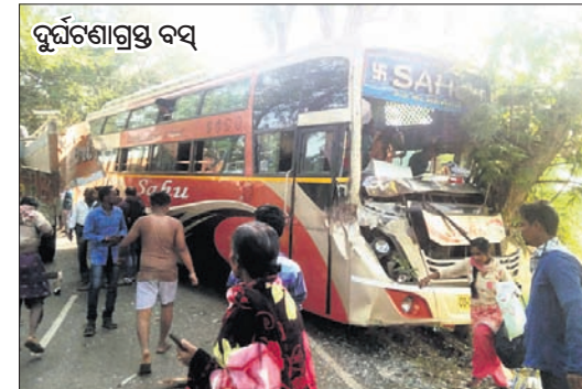
ଯାତ୍ରୀବାହୀ ବସ୍ (ଓଡିଂ ୧୯୩-୪୪୪୫) ବାଲେଶ୍ୱରରୁ ଯାତ୍ରୀ ନେଇ ଉଦ୍ଧାର ଅଭିମୁଖେ ଯାଉଥିବା ବେଳେ ଏହି ଦୁର୍ଘଟଣା ଘଟିଛି।

ବାଲେଶ୍ୱର ଜିଲ୍ଲା ନାଳଗିରି ବରହମପୁର ଥାନା ଅଧୀନ ୧୯୯ ନଂ. ରାଜ୍ୟ ରାଜପଥ ପାର୍ଶ୍ୱରେ ଚେଲିପାଳ ଆଶ୍ରମ ନିକଟରେ ଗୁରୁବାର ପୂର୍ବାହ୍ନ ସାଢ଼େ ୯ଟାରେ ଏକ ଘରୋଇ ବସ୍ ଦୁର୍ଘଟଣାଗ୍ରସ୍ତ ହୋଇଛି। ବିପରୀତ ଦିଗରୁ ଆସୁଥିବା ଏକ ଟ୍ରକ୍ ଅତିକ୍ରମ କଲା ବେଳେ ବସ୍ରେ ଟ୍ରକ୍ ଡାଳା ବାଜିବାକୁ ଏହା ଭାରସାମ୍ୟ ହରାଇ ରାସ୍ତା ପାର୍ଶ୍ୱ ଗଛରେ ପିଟି ହୋଇଯାଇଥିଲା। ଏଥିରେ ୧୫ ଯାତ୍ରୀ ଆହତ ହୋଇଛନ୍ତି। ୫ ଜଣଙ୍କ ଅବସ୍ଥା ଗୁରୁତର ରହିଛି। ଆହତଙ୍କୁ ଉଦ୍ଧାର କରି ଡାକ୍ତରଖାନାରେ ଭର୍ତ୍ତି କରାଯାଇଛି। ଘଟଣାସ୍ଥଳରେ କିଛି ସମୟ ଉତ୍ତେଜନା ଲାଗି ରହିଥିଲା। ବରହମପୁର ପୋଲିସ ପହଞ୍ଚି ପରିସ୍ଥିତିକୁ ଆୟତ୍ତ କରିଥିଲା। ପୋଲିସ ସୂଚନା ଅନୁଯାୟୀ, ସାହୁ ଆଣ୍ଡ ସାହୁ ନାମକ