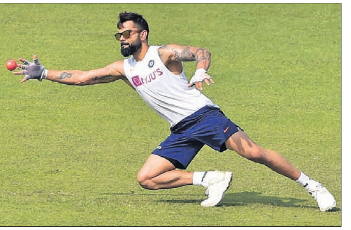
ଅଭ୍ୟାସ ସେସନରେ ବିରାଟ କୋହଲି

କୋଲକାତା, ୨୧।୧୧(ପି.ଟି.) ଏଫିଆସିଏ ଇଂଲେଣ୍ଡରେ ଚାଳିଥିବା ଟେଷ୍ଟ୍ ଟୁର ଦ୍ୱାରା ଇଂଲେଣ୍ଡରେ ପ୍ରଥମ ଦିବାରାତ୍ର ଟେଷ୍ଟ୍ କ୍ରୀଡ଼ା ପ୍ରସାରିବାକୁ ଅପେକ୍ଷା କରାଯାଇଛି। ଇଂଲେଣ୍ଡରେ ପ୍ରଥମ ଦିବାରାତ୍ର ଟେଷ୍ଟ୍ ଟୁର କ୍ରୀଡ଼ା ପ୍ରସାରିବାକୁ ଅପେକ୍ଷା କରାଯାଇଛି। ଇଂଲେଣ୍ଡରେ ପ୍ରଥମ ଦିବାରାତ୍ର ଟେଷ୍ଟ୍ ଟୁର କ୍ରୀଡ଼ା ପ୍ରସାରିବାକୁ ଅପେକ୍ଷା କରାଯାଇଛି।