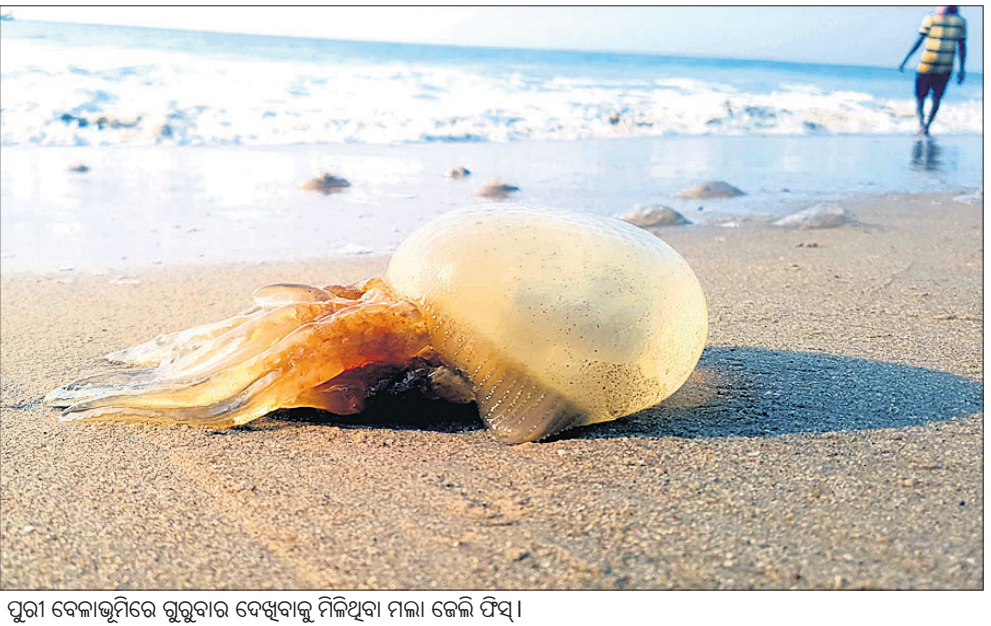
ପୁରୀ ବେଳାଭୂମିରେ ଗୁରୁବାର ଦେଖିବାକୁ ମିଳିଥିବା ମଲା ଜେଲି ଫିସ୍।