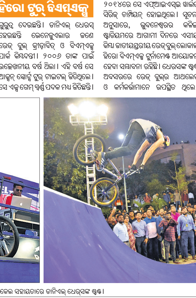
ସାଲକେଲ୍ ସହାୟତାରେ ତାମିଲ୍‌ଧୂର୍ ଧୈର୍ଯ୍ୟ ଷ୍ଟେସ୍।

ଧୈର୍ଯ୍ୟ ଷ୍ଟେସ୍‌ରେ ଦର୍ଶକ ଉତ୍ସାହିତ ହେଉଛନ୍ତି। ଦର୍ଶକମାନେ ଉତ୍ସାହରେ ପୂର୍ଣ୍ଣ ଅଟେ।