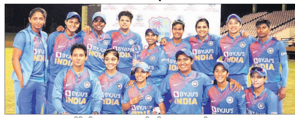
ସିରିଜ୍‌ର ପରେ ଭାରତୀୟ ମହିଳା କ୍ରିକେଟ୍ ଦଳର ଘୋଷଣା କରାଯାଇଛି।

ଘୋଷଣା କରାଯାଇଛି। ଦଳର ଅଧିନାୟକ ଭାବେ ବିରାଟ କୋହଲି ଘୋଷଣା କରାଯାଇଛି। ଦଳର ଅଧିନାୟକ ଭାବେ ବିରାଟ କୋହଲି ଘୋଷଣା କରାଯାଇଛି।