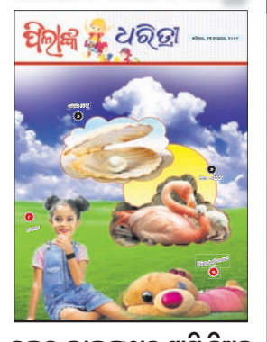
ହଜର ଭାଇଙ୍କଠାରୁ ପାଠି ନିଅନ୍ତୁ

ଆପଣଙ୍କ ଏହି ନିପି ସହିତ ପାଇବେ ପିଲାଙ୍କ ଧରିତ୍ରୀ