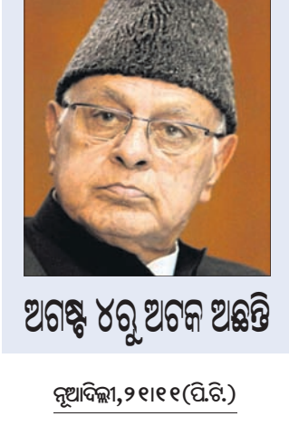
ଅଗଷ୍ଟ ୪ରୁ ଅଟକ ଅଛନ୍ତି

ମୁମ୍ବାଇ/ନୂଆଦିଲ୍ଲୀ, ୨୧/୧୧: ମହାରାଷ୍ଟ୍ରରେ ଶିବସେନା ନେତୃତ୍ୱରେ ସରକାର ଗଠନ ପାଇଁ ଉଦ୍ୟମ ଜାରି ରହିଛି । ନୂଆଦିଲ୍ଲୀରେ ଗୁରୁବାର କଂଗ୍ରେସ-ଏନ୍‌ସିପି ପକ୍ଷରୁ ଏନେଇ ସମସ୍ତ ପ୍ରସଙ୍ଗରେ ଆଲୋଚନା ଶେଷ ହୋଇଛି । ମୁମ୍ବାଇରେ ଶୁକ୍ରବାର ପୁଣି ଶିବସେନା ସହ ବୈଠକ ହେବ । ଏଥିରେ ସରକାର ଗଠନ ସମ୍ପର୍କିତ ସମସ୍ତ ବିଷୟ ନେଇ ଆଲୋଚନା କରାଯିବ ବୋଲି ବରିଷ୍ଠ କଂଗ୍ରେସ ନେତା ତଥା ପୂର୍ବତନ ମୁଖ୍ୟମନ୍ତ୍ରୀ ପୁଣ୍ଡାଲିକା ରଜନ ନାମ 'ମହା ବିକାଶ ଆପଡ଼ି' ରଖାଯିବ ବୋଲି ଜଣାପଡ଼ିଛି । ଏହା ପୂର୍ବରୁ ଉଦ୍ଧବ ଠାକ୍‌ରେଙ୍କ ଦଳ ଏହି ମେଣ୍ଡର ଦଳ କଂଗ୍ରେସ ଅଧୀନରେ ଧରି ନିଆଯାଇଛି । ସେପ୍ଟେମ୍ବର ୧୭ରେ ସରକାର ତାଙ୍କ ବିରୋଧରେ ଘିଷ୍ଟ ସଂଗ୍ରହ କରିଥିଲେ । ପ୍ରତିରକ୍ଷାମନ୍ତ୍ରୀ ରାଜନାଥ ନାମ 'ମହା ଶିବ ଆପଡ଼ି' ରଖିବା ପାଇଁ ଚାହୁଁଥିଲେ, ଯାହାକୁ କଂଗ୍ରେସ-ଏନ୍‌ସିପି ପକ୍ଷରୁ ପ୍ରତ୍ୟାଖ୍ୟାନ କରାଯାଇଛି ।