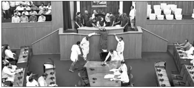
ରାଜ୍ୟ ଓ ବିପର୍ଯ୍ୟୟ ପରିଚାଳନା ବିଭାଗ ପାଇଁ ୨୦୧୯-୨୦ ଆର୍ଥିକ ବର୍ଷର ଅତିରିକ୍ତ ବେତନ ଟଙ୍କା କୋଟି ୮୭ ଲକ୍ଷ ୫୦ ହଜାର ଟଙ୍କାର ବ୍ୟୟବରାଦ