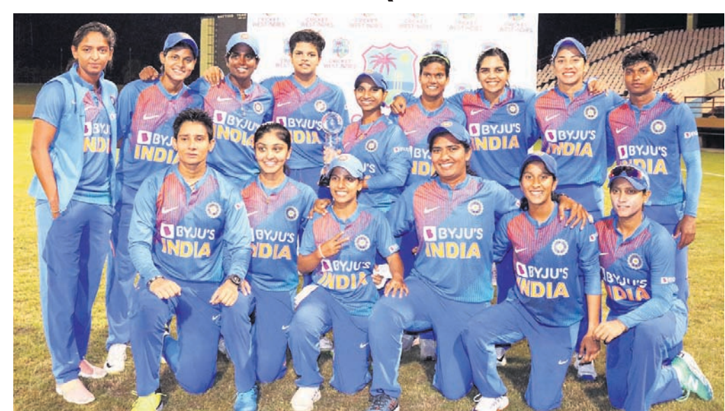
ସିରିଜ୍ ବିଜୟ ପରେ ଭାରତୀୟ ମହିଳା କ୍ରିକେଟ୍ ଦଳର ଖେଳାଳିମାନେ।

ପ୍ରଥମ ଦିନ ପ୍ରଥମ ଦିନରେ ଭାରତୀୟ ଦଳ ୪୨ ରନର ଅର୍ଦ୍ଧଶତକ ପାଇଁ ଖେଳି ପ୍ୟାଭିଲିଟି ଫେରିଥିଲା। ଉଭୟ ଦଳ ଭାରତୀୟ ଦଳ ଟି ୨୦ ମ୍ୟାଚ୍ (ଡିସେମ୍ବର ୨) ଓ ହାଇଦ୍ରାବାଦ (୧୧)ରେ ଖେଳିବ। ସେହିପରି ୩ଟି ଦିନିକିଆ ମ୍ୟାଚ୍ରେ ଚେନାଇ, ବିଶାଖାପାଟଣା ଓ କଟକରେ ଡିସେମ୍ବର ୧୫, ୧୮ ଓ ୨୨ରେ ଅନୁଷ୍ଠିତ ହେବ।