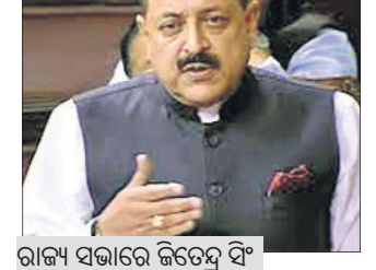
କେନ୍ଦ୍ର ସରକାରଙ୍କ ବିଭିନ୍ନ ବିଭାଗରେ ପାଖାପାଖି ୭ ଲକ୍ଷ ପଦବୀ ଖାଲିପଡିଥିବା ରାଜ୍ୟ ସଭାରେ କେନ୍ଦ୍ରମନ୍ତ୍ରୀ ଜିତେନ୍ଦ୍ର ସିଂ କହିଛନ୍ତି । ଗତବର୍ଷ ମାର୍ଚ୍ଚ ୧ ରୁ ଡିସେମ୍ବର ୧୨ ପର୍ଯ୍ୟନ୍ତ ଖାଲି ୬ ଲକ୍ଷ ୮୩ ହଜାର ୮୨୩ ପଦବୀ ଖାଲି ରହିଛି । ସେଥିପ୍ରତି ଗୁରୁତ୍ୱ ଦେଇ ୫,୨୫,୨୮୯ ପଦବୀ ଖାଲି ଥିବାବେଳେ ଗୁରୁତ୍ୱ ଦି'ରେ ୮୯,୨୩୩ ଏବଂ ଗୁରୁତ୍ୱ ବି'ରେ ୧୯,୮୯୭ ପଦବୀ ଖାଲି ରହିଥିବା କାର୍ଯ୍ୟ ବିଭାଗ ମୁଖ୍ୟମନ୍ତ୍ରୀ କହିଥିଲେ । ଚଳିତ ଆର୍ଥିକ ବର୍ଷରେ ୧,୦୫,୩୩୮ ପଦବୀ ପୂରଣ ଲାଗି ଷ୍ଟାଫ୍ ସିଲେକ୍ସନ କମିଶନ (ଏସ୍‌ଏସ୍‌ସି) ନିଯୁକ୍ତ ପ୍ରକ୍ରିୟା ସହ ଆରମ୍ଭ କରିଛନ୍ତି । ୨୦୧୭-୧୮ରେ ବିଭିନ୍ନ ଗୁରୁତ୍ୱ ବି ଏବଂ ଲେଭେଲ୍-୧ର ୧,୨୭,୫୨୩ ପଦବୀ ଲାଗି ରେକର୍ଡିଂ ନିଯୁକ୍ତ ବୋର୍ଡ (ଆର୍‌ଆର୍‌ବି) ଏବଂ ରେକର୍ଡିଂ କାର୍ଯ୍ୟ କରାଯାଇଥିଲା ।

ମାନିକା/ଲୋହାରଦ୍ୱାରା, ୨୧/୧୧ (ପି.ଟି.) କଂଗ୍ରେସ ଅଯୋଧ୍ୟା ରାୟକୁ ପ୍ରତିପକ୍ଷରେ ଅଟକାଇଥିଲା ଓ କଂଗ୍ରେସ-ଏନ୍‌ସିପି ପ୍ରସଙ୍ଗକୁ ଝୁଲାଇ ରଖିଥିଲା ବୋଲି ଗୁରୁବାର ଭାଗ୍ୟରାଞ୍ଜି ଥାନା ଅଧିକାରୀ ଶାହ ସମାଲୋଚନା କରିଛନ୍ତି । ଝାଡ଼ଖଣ୍ଡ ବିଧାନସଭା ନିର୍ବାଚନ ପ୍ରଦାନରେ ଯାଇ ଶାହ ମାନିକା ଓ ଲୋହାରଦ୍ୱାରା ସଭାରେ କହିଛନ୍ତି, ଅଯୋଧ୍ୟାରେ ରାମମନ୍ଦିର ନିର୍ମାଣ ହେଉ ବୋଲି ସମସ୍ତେ ଚାହୁଁଥିବାବେଳେ କଂଗ୍ରେସ ଏହି ମାମଲାକୁ ଅଟକାଇ ଦେଇଥିଲା । କଂଗ୍ରେସ ଯୋଗୁ ବହୁ ବର୍ଷ ଧରି ଅଯୋଧ୍ୟା ରାୟ ଆସି ନ ଥିଲା । ସାମ୍ପାଦନିକ ଡାକ୍ତା ଅନୁସାରେ ଆମେ ଏହାର ସମାଧାନ ଚାହୁଁଥିଲୁ । ଏବେ