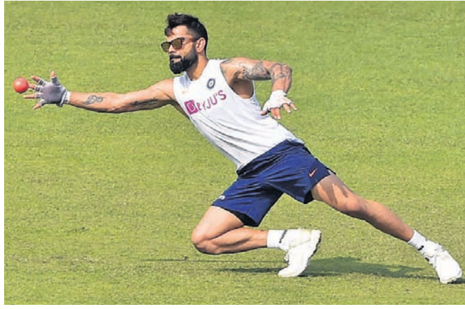
ଅଭ୍ୟାସ ସେସନରେ ବିରାଟ କୋହଲି