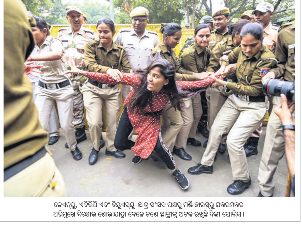
କେନ୍ଦ୍ରୀୟ ଏସିଆ ଏବଂ ଡିପ୍‌ଥମ୍‌ସ୍ତ୍ର ଛାତ୍ର ସଂଘ ପକ୍ଷରୁ ମହିଳା ହାତଗୋଡ଼ ଯନ୍ତ୍ରଣାପତ୍ର ଅଭିମୁଖେ ବିରୋଧୀ ଶୋଭାଯାତ୍ରା ବେଳେ ଜଣେ ଛାତ୍ରଙ୍କୁ ଅଟକ ରଖି ଦିଆଯାଇଥିଲା ।

ଅନୁମତି ଦେବା ଭଳି ଦସ୍ତାବିଜ ନ ଥିଲା । ଏହି ମୁଦତାମୁଦକମାନେ ଏଜେକ୍ସନାକୁ ଜଣାଇଛନ୍ତି । ୨୫ ଲକ୍ଷ ଟଙ୍କା ଦେବା ପରେ ବିଭିନ୍ନ ସୀମା ଦେଇ ଆମେରିକାରେ ପ୍ରବେଶ କରିଥିଲେ । ଆମେରିକାରୁ ବେଆଇନ ପ୍ରବାସୀଙ୍କୁ ବିଦା କରିବା ପାଇଁ ଟ୍ରମ୍ ପ୍ରଶାସନ ନିଷ୍ପତ୍ତି ନେବା ପରେ ଭାରତୀୟ ଦୂତାବାସ ସେମାନଙ୍କୁ ଚିହ୍ନଟ କରିଥିଲା । ଶରଣାର୍ଥୀ ଶିବିରରେ ରଖାଯାଇ ସେମାନଙ୍କୁ ଜରୁରୀ ପ୍ରମାଣପତ୍ର ଜରିଆରେ ଭାରତକୁ ପଠାଯାଇଥିବା ଜଣେ ଆପ୍ରବାସନ ଅଧିକାରୀ ସୂଚନା ଦେଇଛନ୍ତି । ଯେଉଁ ଏଜେକ୍ସନାକୁ ଏମାନେ ଯୋଗା ଅଙ୍କର ଅର୍ଥ ଦେଇ ଆମେରିକା ଯାଇଥିଲେ, ସେମାନଙ୍କୁ ଏହା ନିରୁଦ୍ଧାରୀ । ତେବେ ସେମାନଙ୍କୁ ଠାବ କରାଯିବ ବୋଲି କୁହାଯାଇଛି । ଆମେରିକାରୁ ଭାରତକୁ ଏହା ହେଉଛି ଏହି ଧରଣର ଦ୍ୱିତୀୟ ପ୍ରତ୍ୟେକ । ଅକ୍ଟୋବର ୧୮ରେ ୩୧୧ ଭାରତୀୟଙ୍କୁ ପ୍ରତ୍ୟେକ କରାଯାଇଥିଲା ।