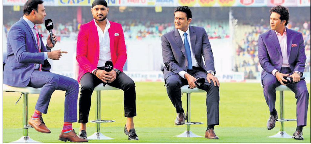
ଭିକିଏସ୍ ଲକ୍ଷ୍ମଣ, ହରଭଜନ ସିଂ, ଅନିଲ କୁମ୍ଭଲେ ଓ ସଚିନ ତେନ୍ଦୁଲକର

ଭାରତୀୟ କିନ୍ଦଦତ୍ତା କ୍ରିକେଟରମାନେ ପିଙ୍କ ବଲ୍ ଟେଷ୍ଟ୍ ଆରମ୍ଭ ଅବସରରେ ପୂର୍ବରୁ ଗୌରବମୟ ସ୍ମୃତି ଚାରଣ କରିଥିଲେ। ଶୁକ୍ରବାର ସଚିନ ତେନ୍ଦୁଲକର ଓ ଅନିଲ କୁମ୍ଭଲେ ପୂର୍ବରୁ ଉଲ୍ଲେଖନୀୟ ପ୍ରଦର୍ଶନ କଥା ମନେ ପକାଇଥିଲେ। ଏ ନେଇ ପ୍ରଥମ ଦିବସର ଲକ୍ଷ୍ ଟ୍ରେକ୍ରେ ଏକ ସ୍ୱତନ୍ତ୍ର କାର୍ଯ୍ୟକ୍ରମ ଆୟୋଜନ ହୋଇଥିଲା। ଏଥିରେ ସଚିନଙ୍କ ସମେତ ଭିକିଏସ୍ ଲକ୍ଷ୍ମଣ, କୁମ୍ଭଲେ, ହରଭଜନ ସିଂ ପ୍ରମୁଖ ଯୋଗଦେଇଥିଲେ। ବିଶ୍ୱ ପ୍ରସିଦ୍ଧ ଏହି ଏତିହାସିକ ଷ୍ଟିଭିୟନସ୍ ଉପର ହାସିନୁଲ ହୋସେନ ଉଲ୍ଲେଖନୀୟ ସଫଳତା ସମ୍ପର୍କରେ ଏମାନେ ଆଲୋଚନା କରିଥିଲେ। ଫ୍ରେଣ୍ଡ୍ସ ଓ ଆନି କ୍ଲବ୍ ହିଲୋ କଫ୍ ଫାଇନାଲ୍ ଓ ଅଷ୍ଟ୍ରେଲିଆ ବିପକ୍ଷ ୨୦୦୧ ଟେଷ୍ଟ୍ ସଂକ୍ରାନ୍ତରେ ଆଲୋଚନା କରାଯାଇଥିଲା। ସମସ୍ତେ ଅଧିନାୟକ ତଥା ବିସିଆଇ ସଭାପତି ସୌରଭ ଗାଲୁଲିଙ୍କୁ କହିଥିଲେ। ଫାଇନାଲ୍ ଅନ ହୋଇ ମଧ୍ୟ ଏହି ଭାଗାବୀରି ବଳରେ ଭାରତ ହରଭଜନ ଓ ସଚିନଙ୍କ ବୋଲି ସହାୟତାରେ ଭାରତ ଅଷ୍ଟ୍ରେଲିଆକୁ ହରାଇଥିଲା। ହରଭଜନ ମଧ୍ୟ ଏହି ମ୍ୟାଚ୍ରେ ଭାରତ ପାଇଁ ପ୍ରଥମ ଟେଷ୍ଟ୍ ହାତ୍ରିକ୍ ଅର୍ଜନ କରିଥିଲେ ଓ ମୋଟ ୧୩ ରନରେ ଅତିଥି ଭାବେ କଣ୍ଟରିବ୍ୟୁଟିୟନ୍ ଦେଇଥିଲେ। ହରଭଜନଙ୍କ ହାତ୍ରିକ୍ ପରେ ମ୍ୟାଚ୍ ମୋଡ଼ ବଦଳିଯାଇଥିଲା ବୋଲି ସଚିନ କହିଛନ୍ତି। ଇଡେନରେ ଏହି ପରିବେଶ ମୋଡ଼ ୧୫ ବର୍ଷ ତଳକୁ ନେଇଯାଇଛି ବୋଲି ହରଭଜନ କହିଛନ୍ତି। ଗାଲୁଲିଙ୍କୁ ପ୍ରଶଂସା କରି ହରଭଜନ କହିଛନ୍ତି ଯେ, ୧୦୦କଣ ଅଧିନାୟକ ନେତୃତ୍ୱରେ ଖେଳିବାକୁ ପଡ଼ିଲେ ମଧ୍ୟ ସେ ସବୁବେଳେ ମୋର ଅଧିନାୟକ ହୋଇ ରହିଥିବେ। ମୋହାଲିରେ ହରଭଜନଙ୍କୁ ପ୍ରଥମେ ଭେଟିଥିଲି ବୋଲି ସଚିନ କହିଛନ୍ତି। ସେ ଜଣେ ଭଲ ସିନର ଓ ଭଲ ବୁସ୍କା ପକାଉଛନ୍ତି ବୋଲି ଶୁଣିବାକୁ ପାଇଥିଲି ବୋଲି ସେ କହିଥିଲେ।