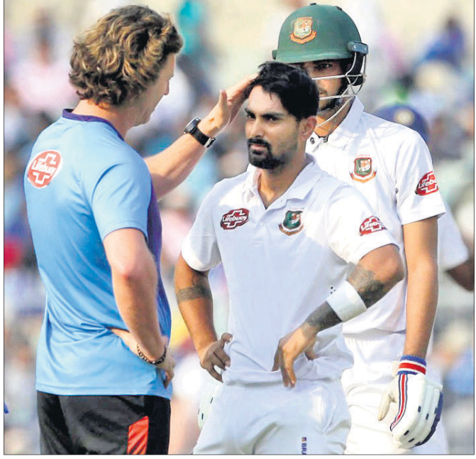
ଲିଟନ ବାସ ଆହତ ହେବା ପରେ ବାଁଲାଦେଶ ଫିଲ୍ଡିଂ ଟାକ୍ ସାହାଯ୍ୟରେ ବୁଲୁଛନ୍ତି।

ଇଡେନ ଗାଡେନରେ ଆରମ୍ଭ ହୋଇଥିବା ଦିବରାତ୍ର କ୍ରିକେଟ ଟେଷ୍ଟ୍ରେ ରେକର୍ଡର ଅଧିକାରୀ ହୋଇଛନ୍ତି ଚିନ୍ ଇଣ୍ଡିଆ ଅଧିନାୟକ ବିରାଟ କୋହଲି। ସେ ଅଧିନାୟକଭାବେ ଟେଷ୍ଟ୍ରେ ୫୦୦୦ ରନ ପୁରଣ କରିବାରେ ତୃତୀୟ ସାଧକ ହୋଇଛନ୍ତି। କ୍ୟାରିୟର ୮୨୭ଟି ଇନିଂସରେ ସେ ଏହି ମାଇଲ୍ସ୍ଟୋନ୍ ଖର୍ଚ୍ଚ କରିଛନ୍ତି। ସେ ୬୫୭ଟି ଇନିଂସରେ ୪୦୦୦ ରନ ପୁରଣ କରି ମଧ୍ୟ ରେକର୍ଡର ଅଧିକାରୀ ଥିଲେ। ଅନ୍ତର୍ଜାତୀୟ କ୍ରିକେଟରେ ୬୫ ଅଧିନାୟକଭାବେ ସେ ୫୦୦୦ ରନର ମ୍ୟାକ୍ ମିଲ୍ସ୍ ଏତିହାସିକ ରେକର୍ଡ ଅଧିକାରୀ ଭାବେ ରହିଛନ୍ତି। ଅଷ୍ଟ୍ରେଲିଆର ପୂର୍ବଦିନ ଅଧିନାୟକ ରିକ୍ ପଣ୍ଡ ୯୬ ଇନିଂସରେ ୪୦୦୦ ରନ ପୁରଣ କରିଥିଲେ। ସେହିପରି ଫ୍ରେଣ୍ଡ୍ସ ଓ ଆନି କ୍ଲବ୍ ଲକ୍ଷ୍ମଣ ୧୦୬, ଦକ୍ଷିଣ ଆଫ୍ରିକାର ଗ୍ରେଗ୍ ବ୍ଲିସ୍ ୧୧୦, ଅଷ୍ଟ୍ରେଲିଆର ଆଲାନ ବର୍ଡର ୧୧୬ ଓ ନ୍ୟୁଜିଲ୍ୟାଣ୍ଡର କ୍ଲେମେଣ୍ଟ ଫ୍ରେନ୍ସି ୧୩୦ ଇନିଂସରେ ୪୦୦୦ ରନ ପୁରଣ କରିଛନ୍ତି।