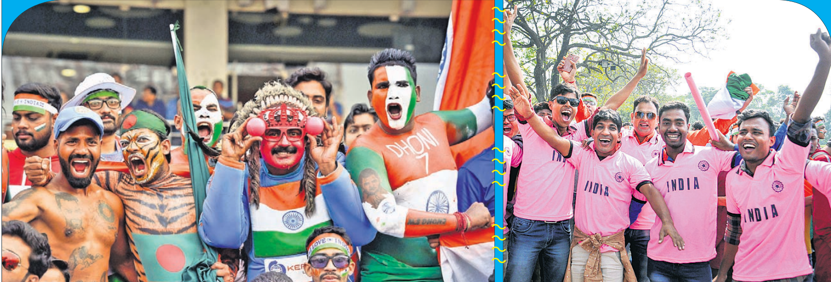
ଇଡେନ ଗାଡେବୁରେ ଆରମ୍ଭ ହୋଇଥିବା ଟେଷ୍ଟ୍ରେ ପ୍ରଥମ ଦିବସରେ ଉଲ୍ଲେଖିତ ଦର୍ଶକ।

ଭାରତୀୟ କିନ୍ଦଦତ୍ତା କ୍ରିକେଟରମାନେ ପିଙ୍କ ବଲ୍ ଟେଷ୍ଟ୍ ଆରମ୍ଭ ଅବସରରେ ପୂର୍ବରୁ ଗୌରବମୟ ସ୍ମୃତି ଚାରଣ କରିଥିଲେ। ଶୁକ୍ରବାର ସଚିନ ତେନ୍ଦୁଲକର ଓ ଅନିଲ କୁମ୍ଭଲେ ପୂର୍ବରୁ ଉଲ୍ଲେଖନୀୟ ପ୍ରଦର୍ଶନ କଥା ମନେ ପକାଇଥିଲେ। ଏ ନେଇ ପ୍ରଥମ ଦିବସର ଲକ୍ଷ୍ ଟ୍ରେକ୍ରେ ଏକ ସ୍ୱତନ୍ତ୍ର କାର୍ଯ୍ୟକ୍ରମ ଆୟୋଜନ ହୋଇଥିଲା। ଏଥିରେ ସଚିନଙ୍କ ସମେତ ଭିକିଏସ୍ ଲକ୍ଷ୍ମଣ, କୁମ୍ଭଲେ, ହରଭଜନ ସିଂ ପ୍ରମୁଖ ଯୋଗଦେଇଥିଲେ। ବିଶ୍ୱ ପ୍ରସିଦ୍ଧ ଏହି ଏତିହାସିକ ଷ୍ଟିଭିୟନସ୍ ଉପର ହାସିନୁଲ ହୋସେନ ଉଲ୍ଲେଖନୀୟ ସଫଳତା ସମ୍ପର୍କରେ ଏମାନେ ଆଲୋଚନା କରିଥିଲେ। ଫ୍ରେଣ୍ଡ୍ସ ଓ ଆନି କ୍ଲବ୍ ହିଲୋ କଫ୍ ଫାଇନାଲ୍ ଓ ଅଷ୍ଟ୍ରେଲିଆ ବିପକ୍ଷ ୨୦୦୧ ଟେଷ୍ଟ୍ ସଂକ୍ରାନ୍ତରେ ଆଲୋଚନା କରାଯାଇଥିଲା। ସମସ୍ତେ ଅଧିନାୟକ ତଥା ବିସିଆଇ ସଭାପତି ସୌରଭ ଗାଲୁଲିଙ୍କୁ କହିଥିଲେ। ଫାଇନାଲ୍ ଅନ ହୋଇ ମଧ୍ୟ ଏହି ଭାଗାବୀରି ବଳରେ ଭାରତ ହରଭଜନ ଓ ସଚିନଙ୍କ ବୋଲି ସହାୟତାରେ ଭାରତ ଅଷ୍ଟ୍ରେଲିଆକୁ ହରାଇଥିଲା। ହରଭଜନ ମଧ୍ୟ ଏହି ମ୍ୟାଚ୍ରେ ଭାରତ ପାଇଁ ପ୍ରଥମ ଟେଷ୍ଟ୍ ହାତ୍ରିକ୍ ଅର୍ଜନ କରିଥିଲେ ଓ ମୋଟ ୧୩ ରନରେ ଅତିଥି ଭାବେ କଣ୍ଟରିବ୍ୟୁଟିୟନ୍ ଦେଇଥିଲେ। ହରଭଜନଙ୍କ ହାତ୍ରିକ୍ ପରେ ମ୍ୟାଚ୍ ମୋଡ଼ ବଦଳିଯାଇଥିଲା ବୋଲି ସଚିନ କହିଛନ୍ତି। ଇଡେନରେ ଏହି ପରିବେଶ ମୋଡ଼ ୧୫ ବର୍ଷ ତଳକୁ ନେଇଯାଇଛି ବୋଲି ହରଭଜନ କହିଛନ୍ତି। ଗାଲୁଲିଙ୍କୁ ପ୍ରଶଂସା କରି ହରଭଜନ କହିଛନ୍ତି ଯେ, ୧୦୦କଣ ଅଧିନାୟକ ନେତୃତ୍ୱରେ ଖେଳିବାକୁ ପଡ଼ିଲେ ମଧ୍ୟ ସେ ସବୁବେଳେ ମୋର ଅଧିନାୟକ ହୋଇ ରହିଥିବେ। ମୋହାଲିରେ ହରଭଜନଙ୍କୁ ପ୍ରଥମେ ଭେଟିଥିଲି ବୋଲି ସଚିନ କହିଛନ୍ତି। ସେ ଜଣେ ଭଲ ସିନର ଓ ଭଲ ବୁସ୍କା ପକାଉଛନ୍ତି ବୋଲି ଶୁଣିବାକୁ ପାଇଥିଲି ବୋଲି ସେ କହିଥିଲେ।