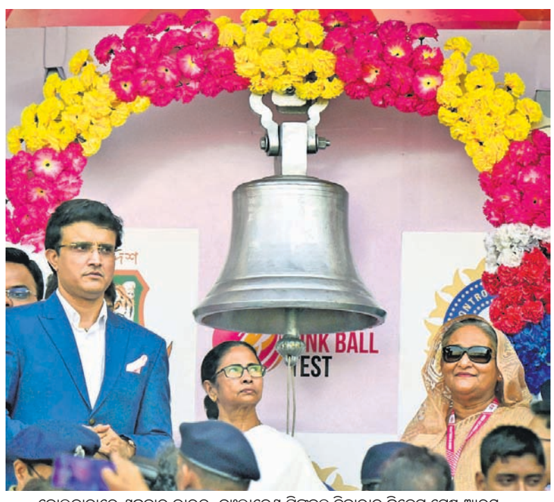
କୋଲକାତାରେ ଶୁକ୍ରବାର ଭାରତ-ବାଂଲାଦେଶ ପିକ୍‌ବଲ୍ ଦିବାରାତ୍ର କ୍ରିକେଟ ଟେଷ୍ଟ ଆରମ୍ଭ ଅବସରରେ ବିସିଆଇ ସଭାପତି ସୌରଭ ଗାଙ୍ଗୁଲି, ପଶ୍ଚିମବଙ୍ଗ ମୁଖ୍ୟମନ୍ତ୍ରୀ ମମତା ବାନାର୍ଜୀ ଓ ବାଂଲାଦେଶ ପ୍ରଧାନମନ୍ତ୍ରୀ ଶେଖ୍ ହାସିନା।