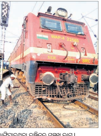
ଭାଙ୍ଗିଯାଇଥିବା ଇଞ୍ଜିନର ସମ୍ପୂର୍ଣ୍ଣ ଭାଗ।