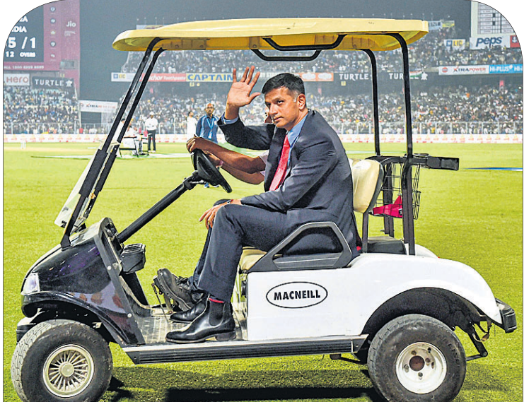
ଗ୍ରାଣ୍ଡ ପ୍ୟାରେଡ୍ ଅବସରରେ ରାହୁଲ ଡ୍ରାଭିଡ୍