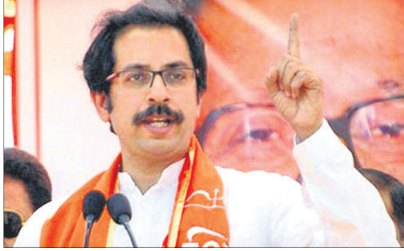
ଶିବସେନା ମୁଖ୍ୟ ଉଦ୍ଧବ ଠାକରେ ।

ମହାରାଷ୍ଟ୍ର ବିଧାନସଭା ନିର୍ବାଚନ ଶେଷ ହେବାର ମାସକ ପରେ ଅତୁଆ ଛିଡ଼ିଛି। ଶିବସେନା, ଜାତୀୟତାବାଦୀ କଂଗ୍ରେସ ପାର୍ଟି (ଏନ୍‌ସିପି) ଏବଂ କଂଗ୍ରେସ ମେଣ୍ଡର ସରକାର ଖୁବ୍‌ଶୀଘ୍ର ଗଠନ କରାଯିବ। ଶିବସେନା ଅଧକ୍ଷ ଉଦ୍ଧବ ଠାକରେ ମୁଖ୍ୟମନ୍ତ୍ରୀ ହେବେ। ଏନ୍‌ସିପି ମୁଖ୍ୟ ଶରଦ୍ ପାଠାଣ ଶୁକ୍ରବାର ସଭ୍ୟାରେ ଏହି ଘୋଷଣା କରିବା ପରେ ରାଷ୍ଟ୍ରପତି ଶାସନାଧୀନ ମହାରାଷ୍ଟ୍ରରେ ରାଜନୈତିକ ସଙ୍କଟ ଦୂରହେବା ଆଶା କରାଯାଉଛି। ତିନିଦଳର ନେତାମାନେ ଖୁବ୍‌ଶୀଘ୍ର ରାଜ୍ୟପାଳ ଭଗତ ସିଂ କୋଶିୟାରୀଙ୍କୁ ଭେଟି ସରକାର ଗଢ଼ିବା ଲାଗି ଦାବି କରାଯାଇଛି। ଏଥିଲାଗି ରାଜ୍ୟପାଳ ଦିଲ୍ଲୀ ଗସ୍ତ ବାତିଲ କରିଦେଇଥିବା ଜଣାପଡ଼ିଛି।