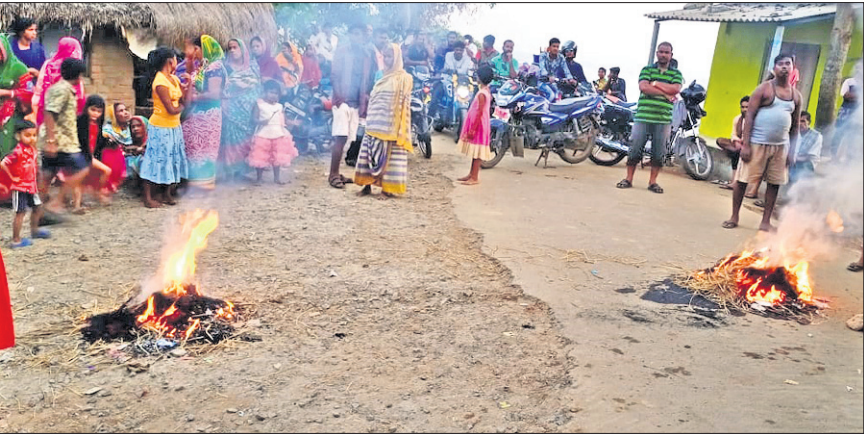
ଲୁଣାନଦୀ ବନ୍ଧ ନିକଟରେ ଦଧିପୁର ଗ୍ରାମବାସୀ ରାସ୍ତାଠାରେ ରାସ୍ତାଠାରେ କରୁଛନ୍ତି ।