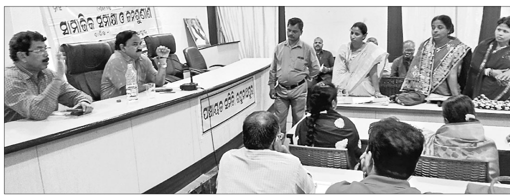
ଏଡିଏମ୍ ଅଧିକାରୀଙ୍କ ସହ ଆଲୋଚନା କରୁଛନ୍ତି।

ରଘୁନାଥପୁର ବ୍ଲକ୍ ସଭାକକ୍ଷରେ ମହାତ୍ମା ଗାନ୍ଧୀ କାଠାୟ ଗ୍ରାମୀଣ ନିରୀକ୍ଷିତ କର୍ମ ନିମ୍ନ୍ନ ହୋଇଥିବା, ସାମାଜିକ ସମୀକ୍ଷା ଓ ଜନଶୁଣାଣି ବୈଠକ ଶୁକ୍ରବାର ଅନୁଷ୍ଠିତ ହୋଇଯାଇଛି। ଏଥିରେ ପିଲିଓ (ଗ୍ରାମ ପଞ୍ଚାୟତ କାର୍ଯ୍ୟନିର୍ବାହୀ ଅଧିକାରୀ)ଙ୍କ ଅନୁପସ୍ଥିତ ନେଇ ଏଡିଏମ୍ ସଚିବାନସ ସାହୁ ଦିରକ୍ତି ପ୍ରକାଶ କରିଥିଲେ। ଏହାଛଡ଼ା ଗ୍ରାମୀଣକ୍ଷେତ୍ରରେ ପାଇବାକୁ ଥିବା ସାମାଜିକ ସୁରକ୍ଷା ଭଣ୍ଡା ତଥା ଅନ୍ୟାନ୍ୟ ତଥ୍ୟ ସମ୍ପର୍କରେ ତଦନ୍ତ କରିବାକୁ ସରକାରଙ୍କ ପକ୍ଷରୁ ଅର୍ଥ ଖର୍ଚ୍ଚ କରାଯାଇଛି। ହେଲେ ଏହାର ବାସ୍ତବ ଚିତ୍ର ମିଳିବାରେ ବ୍ୟତିକ୍ରମ ପରିଲକ୍ଷିତ ହେଉଛି। ଯେଉଁ କର୍ମଚାରୀମାନେ ପଞ୍ଚାୟତସଭାରେ ଉତ୍ତରଦାୟୀ ପାଇଁ କାର୍ଯ୍ୟ କରୁଛନ୍ତି ସେମାନେ କାଣ୍ଡିଗୁଣି ତଥା ବିଭିନ୍ନ କାରଣ ଦର୍ଶାଇ ଅନୁପସ୍ଥିତ ରହିବା ଦୁର୍ଭାଗ୍ୟଜନକ ବୋଲି ଏଡିଏମ୍ ସାହୁ ଜନଶୁଣାଣି ବୈଠକରେ କହିଥିଲେ। ପଞ୍ଚାୟତସଭାରେ ପିଲିଓ, ଜିଆରଏସ୍ ଥାଇ ସୁଦ୍ଧା ବ୍ଲକ୍ ସୋସାଇଟି ଅତିର୍ ଅଧିକାରୀଙ୍କ ତତ୍ପରତାପାତ୍ରରେ ଭିଲେଜ୍ ରିସର୍ଚ୍ ପର୍ଯ୍ୟନ୍ତ