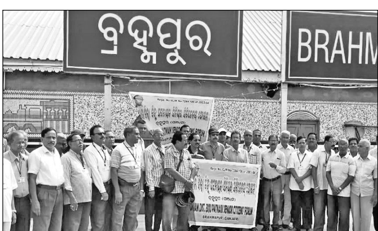
ବାବିପତ୍ର ପ୍ରଦାନ କରିବାକୁ ଆସିଥିବା ସଂଗଠନର ସଦସ୍ୟମାନେ ।

ଗଣମାନ ଜିଲ୍ଲା ବିଜୁ ପଟ୍ଟନାୟକ ସିନିୟର ସିରିଜେନ୍ ଫୋରମ୍ ତରଫରୁ ବିଭିନ୍ନ ଦାବି ସମ୍ପର୍କରେ ମଙ୍ଗଳବାର ଷ୍ଟେଶନ୍ ମ୍ୟାନେଜରଙ୍କ ମାଧ୍ୟମରେ କେନ୍ଦ୍ର ରେଳମନ୍ତ୍ରାଳୟ ଉଦ୍ଦେଶ୍ୟରେ ପ୍ରଦାନ କରାଯାଇଛି।