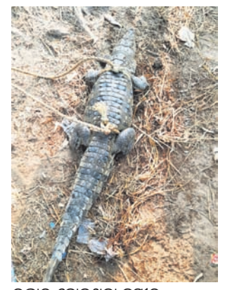
ଉଦ୍ଧାର ହୋଇଥିବା କୁମ୍ଭୀର