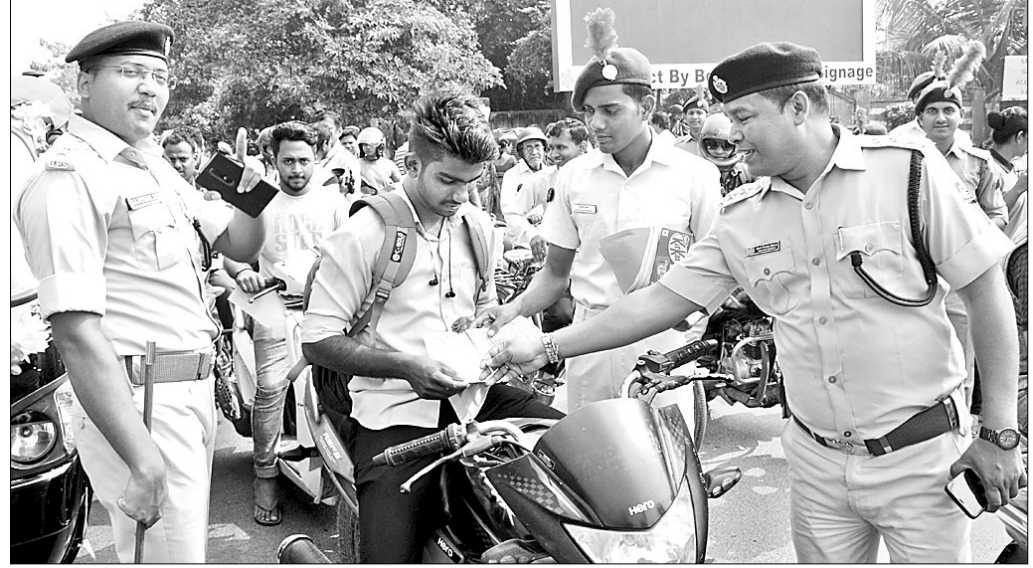
ଜଣେ ବାଇକ୍ ଚାଳକଙ୍କୁ ଗୋଲାପ ଏବଂ ଲିଫ୍‌ଲେଟ୍ ପ୍ରଦାନ କରାଯାଇଛି।

ବ୍ରହ୍ମପୁର ଅଫିସ, ୨୭।୧୧ କିଛି ମାସର ନିୟମ କୋହଳ ପରେ ଡିସେମ୍ବର ପହିଲାକୁ ପୁଣି ଥରେ ଗ୍ରାଫିକ ନିୟମ କଡ଼ାକଡ଼ି ପାଳନ କରାଯିବ। ଏହାକୁ ନେଇ ଏବେଠାରୁ ସାଧାରଣରେ ଭୟ ସୃଷ୍ଟି ହୋଇଛି। ତେବେ ଲୋକମାନଙ୍କୁ ଗ୍ରାଫିକ ନିୟମ ମାନିଥିଲେ, ଯଥା ହେଲେମେଟ୍ ପିନ୍ଧିଥିଲେ, ସେମାନଙ୍କୁ ଚକୋଲେଟ୍ ମଧ୍ୟ କାର୍ଯ୍ୟକ୍ରମ ଆୟୋଜିତ ହେଉଛି।