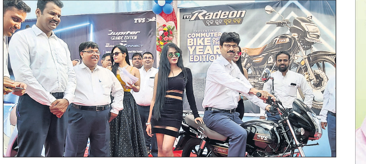
ଜାତୀୟ ସର୍ଭିସ ପ୍ରଦାନକାରୀ ଭାବେ ଯୋଗଦେଇ ଉଦ୍‌ଘାଟନ କରୁଛନ୍ତି।

ଭାରତର ଅଗ୍ରଣୀ ଦୁଇ ଓ ଟିଭି ଟିଭିଆ ଯାନ ନିର୍ମାତା ଟିଭିଏସ୍ ମୋଟର କମ୍ପାନୀ ପକ୍ଷରୁ ବୁଧବାର ଭଞ୍ଜନଗର ବାଇପାସ ରୋଡ ବିଜୁ ପଟ୍ଟନାୟକ ହଲରେ ନୂଆ ଟିଭିଏସ୍ ପାଳ ଟିଭିଏସ୍ ଉଦ୍‌ଘାଟିତ ହୋଇଯାଇଛି। ଏହାକୁ ଜାତୀୟ ସର୍ଭିସ ପ୍ରଦାନକାରୀ ଭାବେ ଯୋଗଦେଇ ଉଦ୍‌ଘାଟନ କରିଥିଲେ। ଏହି ଅବସରରେ ସେ କହିଥିଲେ, ଗ୍ରାହକଙ୍କୁ ସଦାବେଳେ ଉତ୍କଳମାନର ସେବା ଯୋଗାଇ ଦେବା କମ୍ପାନୀର ମୂଳ ଲକ୍ଷ୍ୟ। ଏହି ନୂଆ ଟିଭିଏସ୍ ଉଦ୍‌ଘାଟନ ବୃତ୍ତା ଓଡ଼ିଶାରେ ଟିଭିଏସ୍ ମୋଟର କମ୍ପାନୀର ଚତୁର୍ଥ ପଦକ୍ଷେପ ସଂଖ୍ୟା ୩୪କୁ ବୃଦ୍ଧି ପାଇଛି। ୧୬୦ଟି ସ୍ୱାକ୍ଷରପ୍ରାପ୍ତ ଟିଭିଏସ୍ ଓଡ଼ିଶାରେ ଅଛି। ପ୍ରଦୁଷଣ କିଛି କମ୍ ହେବ ସେହିଭଳି ଯାନ କମ୍ପାନୀ ପକ୍ଷରୁ ନିର୍ମାଣ କରାଯାଇଛି। ଆନ୍ତର୍ଜାତିକ ଅଭିଯୋଗ ପୂର୍ଣ୍ଣ କଲାଭଳି ଉତ୍କଳ ପ୍ରସ୍ତୁତ କରୁଥିବାରୁ ଆମେ ଗର୍ବିତ। ପୃଥିବୀର ୬୦ଟି ଦେଶରେ ଥିବା