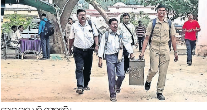
ଭୋଟ ବାଙ୍କୁ ଧରି ଫେରୁଛନ୍ତି।

ଛତ୍ରପୁର, ୨୭।୧୧ (ଡି.ଏନ୍.ଏ.)- ଛତ୍ରପୁର ବ୍ଲକ୍ ୧୯ ନଂ. ଜୋନ୍ ଜିଲ୍ଲା ପରିଷଦ ସଭ୍ୟ ପାଇଁ ବୁଧବାର ହୋଇଥିବା ଉପନିର୍ବାଚନ ଶେଷ ହୋଇଛି। ଜିଲ୍ଲା ପରିଷଦ ସଭ୍ୟ ପାଇଁ ୬ ପଞ୍ଚାୟତର ୯୬ ବୁଥରେ ଭୋଟ ଭୋଗର ଥିବା ବେଳେ ୧୭ହଜାର ୧୯୭ ଜଣ ଭୋଟର ମତଦାନ କରିଛନ୍ତି। ଯାହାକି ୪୬.୮୩ ପ୍ରତିଶତ। ଭୋଟ ଗ୍ରହଣ ପରେ ବାଙ୍କୁଗୁଡ଼ିକୁ ଛତ୍ରପୁର କୋଟ୍ରେ ପଞ୍ଚାୟତ ସମିତିସଭ୍ୟ ପଦବୀ ପାଇଁ ୫୦୨୬ ଭୋଟର ରହିଥିବା ବେଳେ ୨୬୯୧ ଭୋଟର (୫୩.୫୪ ପ୍ରତିଶତ) ଭୋଟ ଦେଇଥିବା ବେଳେ ପୋଲସରା ବ୍ଲକ୍ ବର୍ଦ୍ଧିନୀ ପଞ୍ଚାୟତ ସମିତିସଭ୍ୟ ପଦବୀ ପାଇଁ ୩୪୪୩ ଗୋଷ୍ଠୀ ହେବ। ଏହି ପଦବୀ ପାଇଁ ବିଜେଡି, ଭାଜପା, କଂଗ୍ରେସ ଓ ସିପିଆଇ ପ୍ରାର୍ଥକ ମଧ୍ୟରେ ପ୍ରତିଦ୍ୱନ୍ଦିତା ହୋଇଛି।