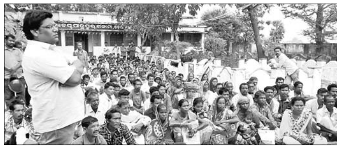
ଧାରଣାରେ ବସିଥିବା ତିନି ଶତଗ୍ରୁପ।

ଅତେତ ହୋଇପଡିଥିବାବେଳେ ତାଙ୍କୁ ନେତୃକାଳ ନିଆଯାଇଥିଲା। ସନ୍ଧ୍ୟା ଭଗବାନ ବେତରା ଧାରଣାକୁ ନେଇ