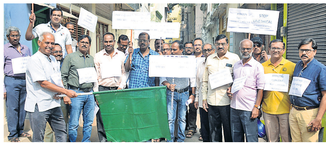
ଚାନ୍ଦର କାର୍ଯ୍ୟକ୍ରମରୁ ଶୋଭାଯାତ୍ରା ବାହାରିଛି ।

ଅନ୍ତର୍ଜାତୀୟ ବ୍ୟବସାୟ ବା ଇ-କମର୍ସ ଯୋଗୁ ବ୍ରହ୍ମପୁରର ବ୍ୟବସାୟୀଙ୍କ ବ୍ୟାପକ କ୍ଷତି ହେଉଛି । କେବଳ ବ୍ରହ୍ମପୁର ସହରରେ ଦୈନିକ ୪୦ ପ୍ରତିଶତ କମ୍ ବ୍ୟବସାୟ ହେଉଛି । ପରିସ୍ଥିତି ଏମିତି ହେଲାଣି କର୍ମଚାରୀଙ୍କୁ ବରମା ଦେବା କଷ୍ଟ ହୋଇପଡ଼ିଛି । ଅନ୍ୟପଟେ କେବଳ ବ୍ୟବସାୟୀ ନୁହଁ, ଅନ୍ତର୍ଜାତୀୟ ବ୍ୟବସାୟ ଯୋଗୁ ସରକାର ମଧ୍ୟ ରାଜସ୍ୱ କ୍ଷତି ସହ୍ୟ କରୁଛନ୍ତି । ଏହାର ପ୍ରତିବାଦରେ ରୁଧିରୀ ଗଞ୍ଜାମ ଚାନ୍ଦର ଅଫିସ୍ କମର୍ସ ପକ୍ଷରୁ ପ୍ରଧାନମନ୍ତ୍ରୀଙ୍କ ଉଦ୍ଦେଶ୍ୟରେ ଦାବିପତ୍ର ପ୍ରଦାନ କରାଯାଇଛି । ସକାଳେ ଚାନ୍ଦର ଅଫିସ୍ କମର୍ସ କମିଶନରୀଙ୍କୁ ସାହିତ୍ୟିକ କାର୍ଯ୍ୟକ୍ରମରେ ବନ୍ଧୁ ସଂଖ୍ୟାରେ ବ୍ୟବସାୟୀ ଏକତ୍ରିତ ହୋଇଥିଲେ । ସେଠାରୁ ଏକ ବାକ୍ସ ଶୋଭାଯାତ୍ରାରେ ବ୍ରହ୍ମପୁର ଉପଜିଲ୍ଲାପାଳଙ୍କ କାର୍ଯ୍ୟକ୍ରମରେ ପହଞ୍ଚିଥିଲେ । ଶୋଭାଯାତ୍ରା ବେଳେ ବ୍ୟବସାୟୀମାନେ ଇ-କମର୍ସ ବିରୋଧରେ ଘୋଷଣା ଦେଇଥିଲେ ।