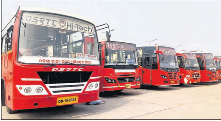
ହଳଦିଆପଦର ବସ୍ ଷ୍ଟାଣ୍ଡରେ ରହିଥିବା ଓଏସଆରଟିସି ବସ୍ ।

■ ଆରମ୍ଭ ହେଲା ସ୍ୱତନ୍ତ୍ର ବସ୍ ଚଳାଚଳ ■ ନିଷ୍ପତ୍ତିରେ ଅଟଳ ପ୍ରଶାସନ, ବସ୍ ମାଲିକ