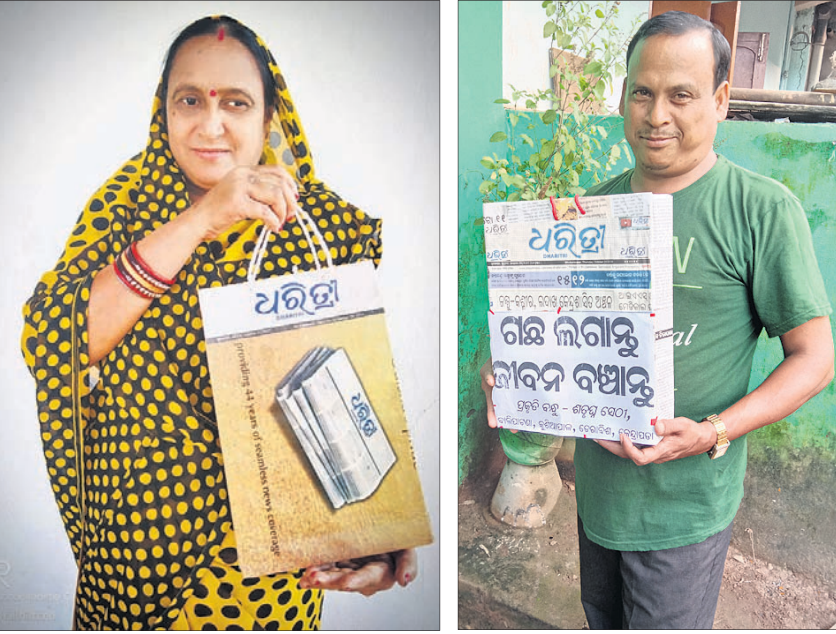
ମଧୁକୋଷ୍ଠା ପରିଡ଼ା ଶତ୍ରୁଘ୍ନ ସେଠୀ

ଆପଣଙ୍କ ଫଟୋ ଏଠାରେ ସ୍ଥାନିତ ପାଇଁ ପଠାନ୍ତୁ plasticfreeodishadht@gmail.com