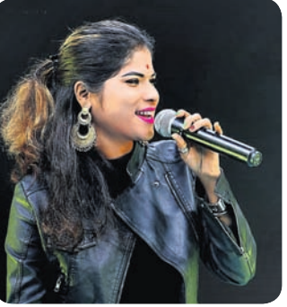
ପ୍ରଭାବିତ କରିଛି। କେବଳ ଓଡ଼ିଆ ନୁହେଁ ସମ୍ବଲପୁରୀ ଗୀତ ପରିବେଷଣ କରି ସେ

ସାଉଁଟିଛନ୍ତି ପ୍ରଶଂସା। କଟକରେ ଜନ୍ମିତା ଏହି ଗାୟିକା ଏବଂ ହିନ୍ଦୁସ୍ଥାନ ଭୋକାଲରେ ତୃତୀୟ ବର୍ଷ ଛାତ୍ରୀ। ପ୍ରଥମେ ଅକେଷ୍ଟ୍ରା ଚା'ପରେ ଇଭେଣ୍ଟ ଶୋ' ଏବଂ ଇକନ ସମାରୋହରେ ସଙ୍ଗୀତ ପରିବେଷଣ କରି ଯେଉଁ ଅଭିଜ୍ଞତା ଅର୍ଜନ କରିଥିଲେ ତାହା ତାଙ୍କ ପାଇଁ ବେଶ୍ ପ୍ରେରଣାଦାୟକ ହୋଇଛି। ନିକଟରେ ତାଙ୍କର 'ଦିୟରଫୁଲି' ଆଲବମକୁ ଶ୍ରୋତା ଗ୍ରହଣ କରିଛନ୍ତି। ଭୁବୁ ଏବେ ନବଗଠିତ ଅପେରା ସୂର୍ଯ୍ୟମନ୍ଦିରର ମେଲୋଡି ସୁନ୍ଦରରେ ଯୋଗ ଦେଇଛନ୍ତି। 'ଶ୍ରୋତାଙ୍କ ସମ୍ମୁଖରେ ଗୀତ ପରିବେଷଣ କରିବା ଏତେ ସହଜ ନୁହେଁ। ହେଲେ ନିଜର ଆତ୍ମବିଶ୍ଵାସ ବଳରେ ସୁଁ ସେମାନଙ୍କୁ ଶତ ପ୍ରତିଶତ ଏଣ୍ଟରଟେନମେଣ୍ଟ ଦେବାକୁ ଚେଷ୍ଟା କରେ। ସଙ୍ଗୀତ ମୋ ଜୀବନ। ଏହାକୁ ଛାଡ଼ି ସୁଁ କିଛିପାରିବି ନାହିଁ ବୋଲି କହନ୍ତି ମେଲୋଡି କୁଇନ୍ ଭାବରେ ପରିଚିତା ଭୁବୁ।