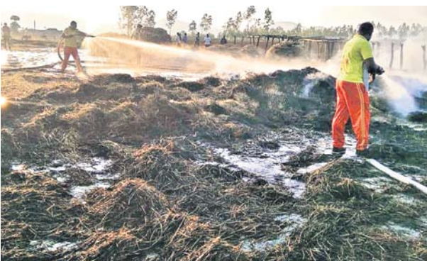
ଗିଲି ଗ୍ରାମରେ ଚାଷୀମାନେ ଗଦା କରିଥିବା ଧାନ, ମାଣ୍ଡିଆ, ସୁଆଁ ପୋତିଯାଇଛି।

ଯାଞ୍ଚ ବେଳେ ସମାଧାନକ କମିଶନରେ ୫୭ ହଜାର ୧୮୯.୮୭ ଟଙ୍କା ରହିଥିଲା।