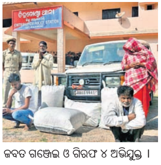
ଜବତ ଗଞ୍ଜେଇ ଓ ଗିରଫ ୪ ଅଭିଯୁକ୍ତ ।

ରାତି ୧୧ଟାରେ ପାଟ୍ରୋଲିଂ କରୁଥିବା ଡିଡୁକୋଣ୍ଡା ପୋଲିସ୍ ଚୋରାଚାଲାଣ ହେଉଥିବା ୧୫୦ କେଜି ଗଞ୍ଜେଇ ଜବତ କରିଛି। ଏଥିରେ ସମ୍ପୂର୍ଣ୍ଣ ୪ଜଣଙ୍କୁ ଗିରଫ କରି କୋର୍ଟଚାଲାଣ କରାଯାଇଛି।