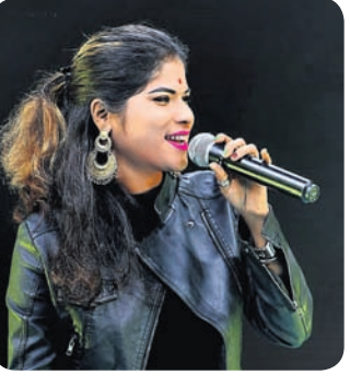
ପ୍ରଭାବିତ କରିଛି । କେବଳ ଓଡ଼ିଆ ରୁହେଁ ସମ୍ବଲପୁରୀ ଗୀତ ପରିବେଷଣ କରି ସେ

ସାଉଁଥ୍‌ଲି ପ୍ରଶଂସା । କଟକରେ ଜନ୍ମିତା ଏହି ଗାୟିକା ଏବଂ ହିନ୍ଦୁସ୍ଥାନ ଭୋକାଲରେ ତୃତୀୟ ବର୍ଷ ଛାତ୍ରୀ । ପ୍ରଥମେ ଅକେଷ୍ଟ୍ରା ଚା'ପରେ ଇଭେଣ୍ଟ ଶୋ' ଏବଂ ଇକନ ସମାରୋହରେ ସଙ୍ଗୀତ ପରିବେଷଣ କରି ଯେଉଁ ଅଭିଜ୍ଞତା ଅର୍ଜନ କରିଥିଲେ ତାହା ତାଙ୍କ ପାଇଁ ବେଶ୍ ପ୍ରେରଣାଦାୟକ ହୋଇଛି । ନିକଟରେ ତାଙ୍କର 'ଦିୟରଫୁଲି' ଆଲବମକୁ ଶ୍ରୋତା ଗ୍ରହଣ କରିଛନ୍ତି । ଭୁବୁ ଏବେ ନବଗଠିତ ଅପେରା ସୂର୍ଯ୍ୟମନ୍ଦିର ମେଲୋଡି ସୁନିଞ୍ଚରେ ଯୋଗ ଦେଇଛନ୍ତି । 'ଶ୍ରୋତାଙ୍କ' ସମ୍ମୁଖରେ ଗୀତ ପରିବେଷଣ କରିବା ଏତେ ସହଜ ନୁହେଁ । ହେଲେ ନିଜର ଆତ୍ମବିଶ୍ଵାସ ବଳରେ ସ୍ତ୍ରୀ ସେମାନଙ୍କୁ ଶତ ପ୍ରତିଶତ ଏଣ୍ଟରଟେନମେଣ୍ଟ ଦେବାକୁ ଚେଷ୍ଟା କରେ । ସଙ୍ଗୀତ ମୋ ଜୀବନ । ଏହାକୁ ଛାଡ଼ି ସ୍ତ୍ରୀ ଦୃଷ୍ଟିପାତ୍ରିକ ନାହିଁ ବୋଲି କହନ୍ତି ମେଲୋଡି କୁଇନ୍ ଭାବରେ ପରିଚିତା ଭୁବୁ ।