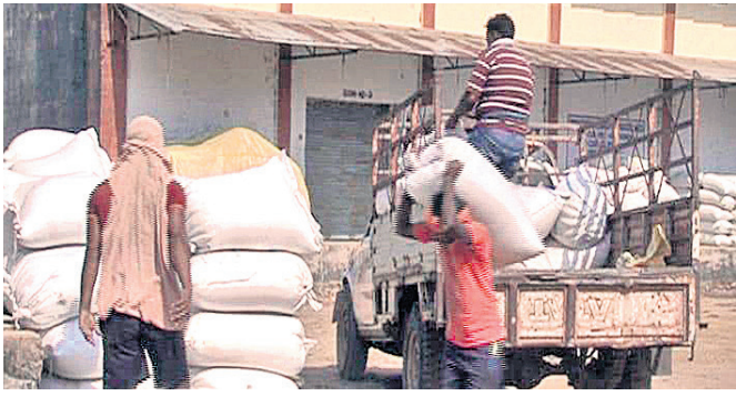
ମଣ୍ଡିରେ ପହଞ୍ଚିଥିବା ଧାନ ।

ମାଲକାନଗିରି ଜିଲ୍ଲାରେ ଗତ ଶୁକ୍ରବାରଠାରୁ ଧାନ ମଣ୍ଡି ଆରମ୍ଭ ହୋଇଛି। ଜିଲ୍ଲାର ୬୨ ମଣ୍ଡିରେ ଏବେ ଚାଷୀଙ୍କ ଭିଡ଼ ଦେଖିବାକୁ ମିଳିଛି।