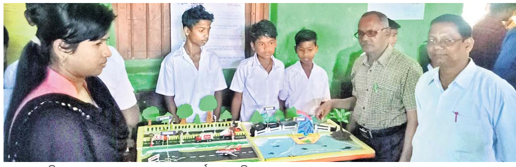
ରୁକ୍ଷସ୍ତରୀୟ ବିଜ୍ଞାନମେଳାରେ ଛାତ୍ରମାନେ ପ୍ରକଳ୍ପ ପ୍ରଦର୍ଶନ କରୁଛନ୍ତି।

କୋରାପୁଟ ଜିଲ୍ଲା ଦଶମହପୁର ବ୍ଲକ ଅନ୍ତର୍ଗତ ଗିଲିଗୁମ୍ମା ପଞ୍ଚାୟତରେ ଥିବା ଗିଲି ଗ୍ରାମରେ ଚାଷୀମାନେ ଗଦା କରିଥିବା ଧାନ, ମାଣ୍ଡିଆ ଓ ସୁଆଁ ପୋଡ଼ିଯାଇଛି।