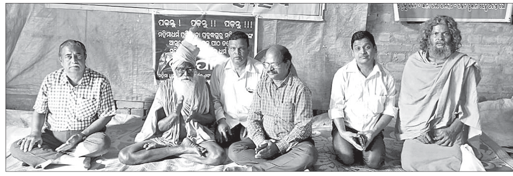
କାର୍ଯ୍ୟକ୍ରମରେ ମହିମା ସାଧୁସନ୍ଧ୍ୟାସାଳ ସମେତ ଅନ୍ୟମାନେ ।

ଢେଙ୍କାନାଳ ଅପସ, ୨୮।୧୧ ମହିମା ଧର୍ମର ଆଦିପାଠ ଚପୋବନରେ ମହିମା ଗୋସାଇଁଙ୍କ ୨୧ ଦିନାତ୍ମକ ଯୋଗନିଦ୍ରା ସମାରୋହ ଗୁରୁବାର (ମାର୍ଗଶିର ଶୁକ୍ଳ ଦ୍ୱିତୀୟା ତିଥି)କୁ ଆରମ୍ଭ ହୋଇଛି ।