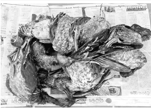
ଖୋର୍ଦ୍ଧା ଅଫିସ/ଗାଙ୍ଗା, ୨୮.୧୧.୧୯(ଡି.ଏଲ୍.ଏ.)

ଖୋର୍ଦ୍ଧା ଜିଲ୍ଲା ଗାଙ୍ଗା ବନ୍ୟପ୍ରାଣୀ ବନାଞ୍ଚଳରେ ୧୧ ମୃତ ବିଦେଶୀ ପକ୍ଷୀ ଜବତ ହୋଇଛି।