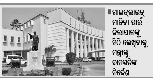
ଗାଉଁଶଭାଇ ନିର୍ଦ୍ଦେଶକ କର୍ମଚାରୀଙ୍କୁ ଡିଏମ୍ଏସ୍ ଅଞ୍ଚଳରେ ଖର୍ଚ୍ଚ ହେଉଛି।

ଡିଏମ୍ଏସ୍ ଅଞ୍ଚଳରେ ଖର୍ଚ୍ଚ ହେଉଛି। ଡିଏମ୍ଏସ୍ ଅଞ୍ଚଳରେ ଖର୍ଚ୍ଚ ହେଉଛି।