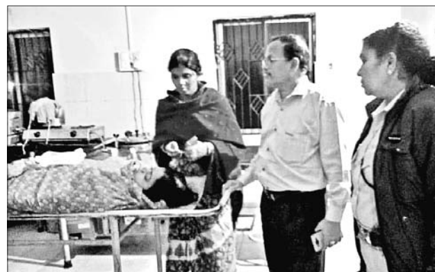
ଡାକ୍ତରଖାନାରେ ପୋଲିସ୍ ତଦନ୍ତ କରୁଛି।

ଅସ୍ତ୍ରୋପଚାର ବେଳେ ମହିଳାଙ୍କ ମୃତ୍ୟୁ। ଅସ୍ତ୍ରୋପଚାର ବେଳେ ମହିଳାଙ୍କ ମୃତ୍ୟୁ।