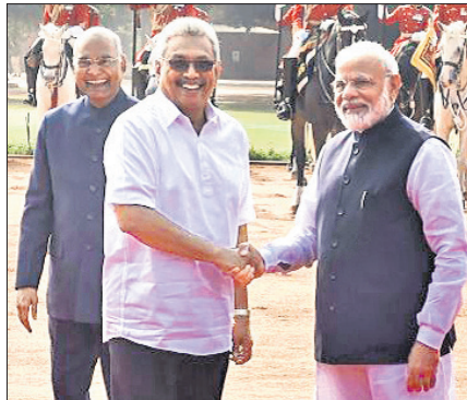
ରାଷ୍ଟ୍ରପତି ଭବନରେ ଶ୍ରୀଲଙ୍କାର ରାଷ୍ଟ୍ରପତି ଗୋଟାବାୟା ରାଜପକ୍ଷଙ୍କ ସହ ରାଷ୍ଟ୍ରପତି ରାମନାଥ କୈରବି ଓ ପ୍ରଧାନମନ୍ତ୍ରୀ ନରେନ୍ଦ୍ର ମୋଦି।

ଶ୍ରୀଲଙ୍କାରେ ଆତଙ୍କବାଦ ଦମନ ଲାଗି ୫୦ ନିୟୁତ ଡଲାର ସମେତ ୪୫୦ ନିୟୁତ ଡଲାର ଆର୍ଥିକ ସହାୟତା ଯୋଗାଇ ଦେବାକୁ ପ୍ରଧାନମନ୍ତ୍ରୀ ନରେନ୍ଦ୍ର ମୋଦି ଶୁକ୍ରବାର ଘୋଷଣା କରିଛନ୍ତି।