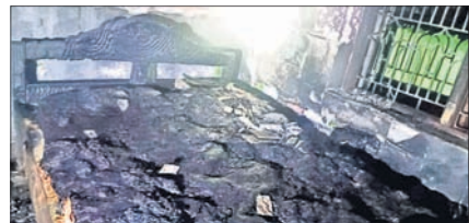
ଅଗ୍ନିକାଣ୍ଡରେ ପୋଡ଼ିଯାଇଥିବା ଖମ୍ବା