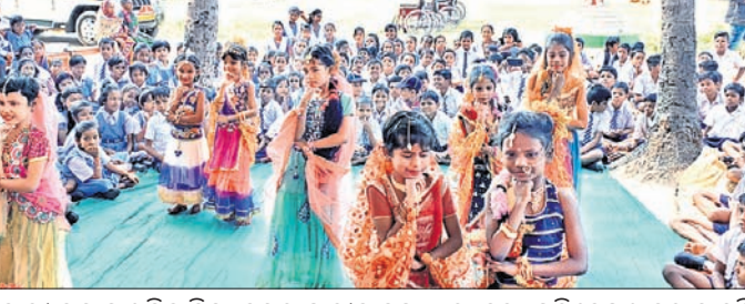
ମାକୋଣା ସରକାରୀ ଉଚ୍ଚ ପ୍ରାଥମିକ ବିଦ୍ୟାଳୟର ଛାତ୍ରଛାତ୍ରୀମାନେ ଦ୍ୱାରା ନୃତ୍ୟ ପରିବେଷଣ କରାଯାଉଛି।

ବିକ୍ଷେପ୍ଟ ସଂଖ୍ୟା.4897 ତାରିଖ: 29.11.2019 ଲଗୁ ଖଣିଜ ସକାଶେ ଲିଫ୍ ଇସ୍ତାହାର No.F-72 :- ଏତଦ୍ୱାରା ସର୍ବସାଧାରଣଙ୍କ ଅବଗତ ନିମନ୍ତେ ଜଣାଇ ଦିଆଯାଉଛି ଯେ, ଅନୁଗୋଳ ଜିଲ୍ଲା ଅଧୀନସ୍ଥ ବଅଁରପାଳ ତହସିଲ ଅନ୍ତର୍ଗତ ୨ଗୋଟି ଲଗୁ ଖଣିଜ ଦ୍ରବ୍ୟର ଉତ୍ପାଦନ ଆକାରରେ ସହୋଦୟ କରିବା ପାଇଁ ଦରଖାସ୍ତ ଗ୍ରହଣ କରାଯାଉଅଛି। 'ଦରଖାସ୍ତ ଗ୍ରହଣର ଶେଷ ତାରିଖ ୧୫/୧୨/୨୦୧୯ ଯାଏଁ ହେଉଥିବ। ସରକାରୀ ଉପସ୍ଥିତିରେ ସମ୍ପୂର୍ଣ୍ଣ ବିବରଣୀ ତଥା ଦରଖାସ୍ତ ସମକ୍ଷୀୟ ସମସ୍ତ ତଥ୍ୟ ଛୁଟିଦିନ ବ୍ୟତୀତ ଅନ୍ୟ ଦିନମାନଙ୍କରେ ତହସିଲ କାର୍ଯ୍ୟାଳୟରେ ଏବଂ ଅନୁଗୁଳ ଜିଲ୍ଲା ଡ୍ରେସ୍‌ହାଉସ୍ (www.angul.nic.in)ରେ ଉପଲବ୍ଧ ହୋଇପାରିବ। 24078/11/0001/1920 ବା./- ତହସିଲଦାର, ବଅଁରପାଳ