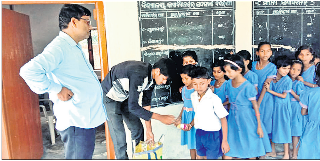
ମଧ୍ୟାହ୍ନଭୋଜନରେ ଛାତ୍ରଛାତ୍ରୀଙ୍କୁ ବିସ୍କୁଟ ଦିଆଯାଉଛି।

ରାଜ୍ୟ ସରକାର ୧୩୮୮ ମ ଶ୍ରେଣୀ ପର୍ଯ୍ୟନ୍ତ ଛାତ୍ରଛାତ୍ରୀମାନଙ୍କ ଲାଗି ମଧ୍ୟାହ୍ନଭୋଜନ ବ୍ୟବସ୍ଥା କରିଛନ୍ତି। ଏପରିକି ବିଦ୍ୟାଳୟର ଉପାଧିକାରୀଙ୍କୁ ଶିକ୍ଷାଦାନରେ ବାଧା ଉପୁଜିବା ଆଶଙ୍କା କରି ଏକ ମାସ ହେବ ବାହାରୁ ରନ୍ଧା ଖାଦ୍ୟ ଯୋଗାଇ ଦିଆଯାଉଛି। ଏହି ପରିପ୍ରେକ୍ଷାରେ ବାଲେଶ୍ୱର ଜିଲ୍ଲା ନାମଗିରି ଏନ୍.ଏସିରେ ୧୮ଗୋଟି ବିଦ୍ୟାଳୟକୁ ସେରଗଡ଼ୁସ୍ଥିତ କିଟେନ ସେଣ୍ଟରରୁ ରନ୍ଧାଖାଦ୍ୟ ଯୋଗାଇ ଦିଆଯାଉଛି। ମାତ୍ର ସରକାରଙ୍କର ଏହି ଯୋଜନା ଦିଗହରା ହେଉଥିବା ଦେଖିବାକୁ ମିଳିଛି। ମଧ୍ୟାହ୍ନ ଭୋଜନରେ ଭାତ ବଦଳରେ ପୂର୍ବରୁ ମୁଢ଼ି ମିଳୁଥିବାର ଅଭିଯୋଗ ହେଉଥିଲା ବେଳେ ମଙ୍ଗଳବାର ଛାତ୍ରଛାତ୍ରୀମାନେ ବିସ୍କୁଟ ଖାଇଥିବା ନଜରକୁ ଆସିଛି।