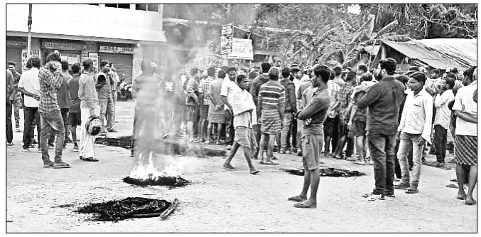
ଲୋକେ ରାସ୍ତା ଅବରୋଧ କରିଛନ୍ତି।

ଏକ ଛାତ୍ରୀ ଅସଦାଚରଣ ମାମଲାର ଅଭିଯୁକ୍ତ ମାସେରୁ ଉର୍ଦ୍ଧ୍ୱ ସମୟ ହେବ ଫେରାର ଥିବା ବେଳେ ତାଙ୍କୁ ଧରିବାକୁ ପୋଲିସ୍ ରୁହେଇ ଦେଇ ନାହିଁ। ଏଭଳି ଅଭିଯୋଗ କରି ମଙ୍ଗଳହାର ବୈଶିଙ୍ଗା ଥାନା ଅଧୀନ ଏକ ସ୍କୁଲ ସମ୍ମୁଖରେ ଲୋକେ ବିକ୍ରୋଧ ପ୍ରଦର୍ଶନ କରିବା ସହିତ ବୈଶିଙ୍ଗା- ରୁପସା ରାସ୍ତାକୁ ଅପରାହ୍ଣ ୩ଟା ବେଳଠାରୁ ଅବରୋଧ କରିଥିଲେ। ଖବରପାଇ ଘଟଣାସ୍ଥଳକୁ ଯାଇଥିବା ପୋଲିସ୍ ଓ ଶିକ୍ଷା ବିଭାଗର ଅଧିକାରୀମାନଙ୍କୁ ଉତ୍ତ୍ୟକ୍ତ ଲୋକେ ଅଟକ ରଖୁଥିଲେ। ପରେ ଜିଲ୍ଲା ଶିକ୍ଷାଧିକାରୀ ଓ ପୋଲିସ୍ ପକ୍ଷରୁ ପ୍ରତିଶ୍ରୁତି ଦିଆଯିବା ପରେ ରାତି ୭ଟା ୩୦ରେ ଆନ୍ଦୋଳନ ପ୍ରତ୍ୟାହତ ହୋଇଥିଲା।