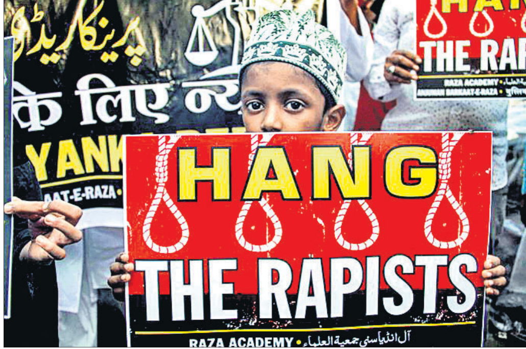
ହାଇଦ୍ରାବାଦ ଗଣବଳାକ୍ତର ଓ ହତ୍ୟାକାଣ୍ଡ ପ୍ରତିବାଦରେ ପୁସ୍ତାକର କଣ୍ଠେ ଶିଶୁ ପୁଲାର୍ଟ ଦେଖାଉଛନ୍ତି।