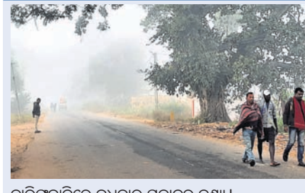
ବାରିଜବାଡ଼ିରେ ରୁଧିରୀର ସମାଜର ଦୃଶ୍ୟ ।