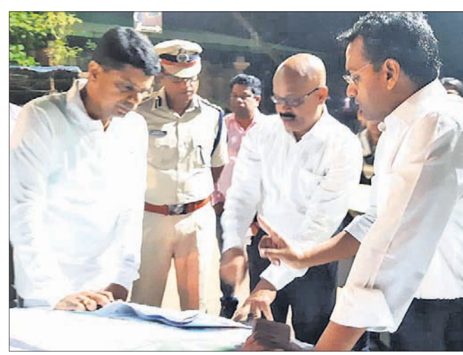
୫-ଟି ସରତି ଭି.କେ ପାଣ୍ଡିଆନ୍ ଉନ୍ନତୀକରଣ କାର୍ଯ୍ୟର ସମୀକ୍ଷା କରୁଛନ୍ତି।

ପୁରୀ, ଭୁବନେଶ୍ୱର (ଡି.ଏନ.ଏ)/ ଭୁବନେଶ୍ୱର, ୪।୧୨ (ବୁଧ୍ୱର) ପୁଖ୍ୟାମନ୍ତ୍ରୀ ନବୀନ ପଟ୍ଟନାୟକଙ୍କ ଦ୍ୱାରା ଚଳାଯାଇଥିବା ଉନ୍ନତୀକରଣ ପାଇଁ ପଦକ୍ଷେପ ଗ୍ରହଣ କରାଯାଇଛି।