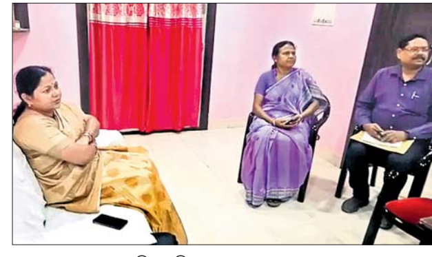
କ୍ଷୟର ପତ୍ନୀ ଆନାରେ ମହିଳା କମିଶନ ଅଧ୍ୟକ୍ଷା ଓ ଅନ୍ୟମାନେ।

ପୋଲିସ କାର୍ତ୍ତବ୍ୟରେ ଗଣବଳାହାର ଶିକାର ହୋଇଥିବା ନାବାଳିକାଙ୍କର ରୁଧିରୀ ସିଆରପିସି ଧାରା ୧୨୧ ଓ ୧୨୪ରେ ପୁରୀ ଏସ୍ପିଜେଏମ୍ କୋର୍ଟରେ ବୟାନ ରେକର୍ଡ କରାଯାଇଛି। ପୂର୍ବରୁ କେଲି ଯାଇଥିବା ବୁକ୍‌କଣ ଆଭିଯୁକ୍ତ ପୋଲିସ ରିମାଣ୍ଡରେ ଆଣିବା ଲାଗି ଆବେଦନ କରିବ। ସେହିପରି ଫେରାର ଥିବା ଅନ୍ୟ ବୁକ୍‌କଣ ଅଭିଯୁକ୍ତ ଧରିବା ଲାଗି ଗଠିତ ବୁକ୍‌କଣ ଚିମ୍ପ ବାହାର ରାଜ୍ୟରେ ଚଢ଼ାଉ ଜାରି ରଖିଛି। ପାଠିତାଙ୍କୁ ୫ଲକ୍ଷ କ୍ଷତିପୂରଣ ଦିଆଯିବା ନେଇ ଜିଲ୍ଲା ଆଇନସେବା ପ୍ରାଧିକରଣ ସହ ଆଲୋଚନା କରାଯାଇଛି। ପୋଲିସ ପକ୍ଷରୁ ମଧ୍ୟ ପ୍ରକ୍ରିୟା ଆରମ୍ଭ କରାଯିବ। ସମ୍ପୂର୍ଣ୍ଣ ତଥ୍ୟ ପ୍ରମାଣ ସହ ୨୦ଦିନ ମଧ୍ୟରେ ଚାର୍ଜସିଟ୍ କରାଯିବ ବୋଲି ରୁଧିରୀ ସିଆରପିସିର ଦାଶ କହିଛନ୍ତି। ପାଠିତାଙ୍କ ସ୍ୱଳ୍ପ ସାମଗ୍ରିକତା ଯାଞ୍ଚକୁ ସେ ନାବାଳିକା ବୋଲି ପ୍ରମାଣ ଦିଲିଛି। ଏହି ଘଟଣାକୁ ରୁଚିତର ସହିତ ନିଆଯାଇଛି। ପାଠିତାଙ୍କୁ ଯେପରି ନ୍ୟାୟ ମିଳିବ ସେଥିଲାଗି ଲିଗାଲ ଆଡଭାଇଜରଙ୍କ ସହ ଆଲୋଚନା କରାଯାଇଛି ବୋଲି ଏସ୍ପି କହିଥିଲେ।