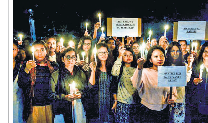
ହାଇଦ୍ରାବାଦ ଗଣବଳାକାର ଓ ହତ୍ୟାକାଣ୍ଡ ପ୍ରତିବାଦରେ ରୁଆହାଟରେ ଛାତ୍ରୀଙ୍କ କ୍ୟାଣ୍ଡେଲ ଶୋଭାଯାତ୍ରା।