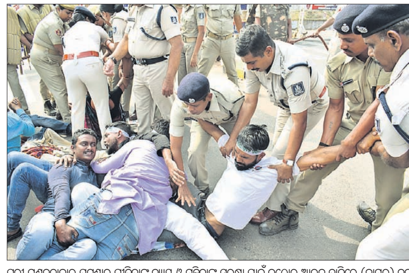
ପୁରୀ ଗଣବଳାକ୍ତାର ଘଟଣାର ପାଠିକାଙ୍କୁ ନ୍ୟାୟ ଓ ମହିଳାଙ୍କ ସୁରକ୍ଷା ପାଇଁ କଠୋର ଆଇନ ଦାବିରେ (ବାମକୁ) ନବନିର୍ବାଣ ସୁରକ୍ଷାପୂର୍ଣ୍ଣ ସଂଗଠନ ଏବଂ ଭାଜପା ମହିଳା ମୋର୍ଚ୍ଚା ପକ୍ଷରୁ ରୁଧିର ନିବାସ ଘେରାଉ ଉଦ୍ୟମ ହୋଇଛି । ବିଶେଷ ଭାବେ ଶିଶୁଭବନ ଛକ ଓ ନିବାସ ନିକଟରେ ପୋଲିସ୍ ସହ ଧସ୍ତାଧସ୍ତି ।