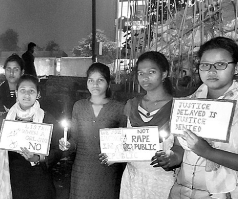
ହାଇଦ୍ରାବାଦ ରାଜସରକାରର ଯତ୍ନରେ ବିରୋଧ କରି ଡ୍ୟୁତୀଙ୍କୁ ସମ୍ମୁଖରେ କଟକର ବିଭିନ୍ନ ଘରୋଇ ମହଲା ହଷ୍ଟେଲ ଅଭିଯୋଗୀଙ୍କ ପକ୍ଷରୁ ସହର ପରିକ୍ରମା ପାଇଁ ବାହାରିଥିବା ମହନକର୍ତ୍ତା ଶୋଭାଯାତ୍ରୀ ।