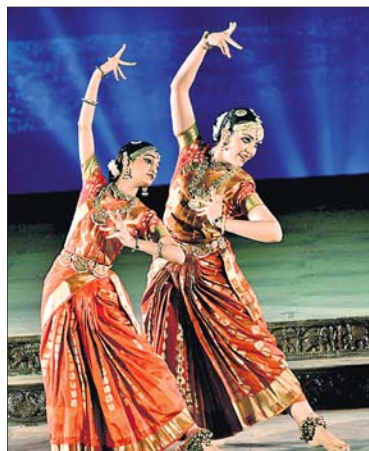
କୋଣାର୍କ ଉତ୍ସବର ଚତୁର୍ଥ ସନ୍ଧ୍ୟାରେ କଳାକାରଙ୍କ ନୃତ୍ୟ ଓ ନାଟକ ପରିବେଷଣ।