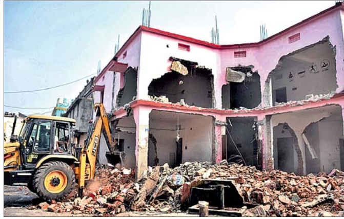
ସହରାଞ୍ଚଳ ପ୍ରାଥମିକ ସ୍ୱାସ୍ଥ୍ୟକେନ୍ଦ୍ରକୁ ଉଦ୍ଧୃତ କରାଯାଇଛି।