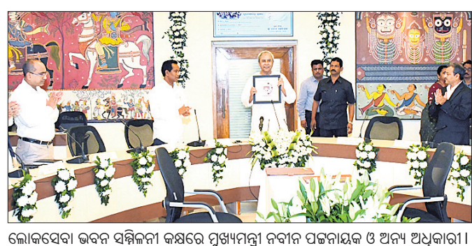
ଲୋକସେବା ଭବନ ସମ୍ମିଳନୀ କକ୍ଷରେ ମୁଖ୍ୟମନ୍ତ୍ରୀ ନବୀନ ପଟ୍ଟନାୟକ ଓ ଅନ୍ୟ ଅଧିକାରୀ।

ଭୁବନେଶ୍ୱର, ୪।୧୨ (ବୁଧବେଳା) ମୁଖ୍ୟମନ୍ତ୍ରୀ ନବୀନ ପଟ୍ଟନାୟକ କୁଳଦେବୀ ଲୋକସେବା ଭବନରୁ ମିଶନ୍ ସୁବିଦ୍ୟା କାର୍ଯ୍ୟକ୍ରମର ଶୁଭାରମ୍ଭ କରିଛନ୍ତି। ରାଜ୍ୟର ଅନୁସୂଚିତ ଜାତି (ଏସ୍‌ସି), ଅନୁସୂଚିତ ଜନଜାତି (ଏସ୍‌ଜି) ହସ୍ତକ୍ଷେପକରେ ସର୍ବନିମ୍ନ ସୁବିଧା ଉପଲବ୍ଧ କରାଇବା ପାଇଁ ଏହା କାର୍ଯ୍ୟ କରିବ। ଏଥିପାଇଁ ସଂପୂର୍ଣ୍ଣ ବିଭାଗ ପକ୍ଷରୁ ଗତି ରୁଚି ସ୍ୱାକ୍ଷର କରାଯାଇଛି। ଏହି ସଂଗ୍ରାହକ ହେଉଛି- କ୍ୱାଲିଟି କାର୍ଯ୍ୟକ୍ରମ ଅର୍ଥ ଲକ୍ଷ୍ୟ, ଅକ୍ଷର ପାଠଶେଖର ଏବଂ ଗ୍ରାହକସେବା। କ୍ୱାଲିଟି କାର୍ଯ୍ୟକ୍ରମ ଅର୍ଥ ଲକ୍ଷ୍ୟ ପକ୍ଷରୁ ବହୁମୁଖୀ ସମାଧାନ କରାଯିବା ସହ ଏସ୍‌ସିଏସ୍‌ସି ହସ୍ତକ୍ଷେପକରେ ରୁଣ୍ଡାମୁକ ଦିଗ ବଜାୟ ରଖିବା ଦିଗରେ ଚେଷ୍ଟା କରିବ। ଏହି ହସ୍ତକ୍ଷେପକରେ ଆଇଏସ୍‌ଏଫ୍:୯୦୦୧ ପ୍ରମାଣପତ୍ର ପାଇବା ଦିଗରେ ଏହା ସହାୟକ ହେବ ବୋଲି କୁହାଯାଇଛି। ସେହିପରି ଅକ୍ଷର ପାଠଶେଖର ରୁଣ୍ଡାମୁକ ଶିକ୍ଷାର ଉପଲବ୍ଧି ସମ୍ପର୍କିତ କାର୍ଯ୍ୟ କରିବ।