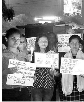
ହାଇଦ୍ରାବାଦ ରାଜସରକାରର ଯତ୍ନରେ ବିରୋଧ କରି ଡ୍ୟୁତୀଙ୍କୁ ସମ୍ମୁଖରେ କଟକର ବିଭିନ୍ନ ଘରୋଇ ମହଲା ହଷ୍ଟେଲ ଅଭିଯୋଗୀଙ୍କ ପକ୍ଷରୁ ସହର ପରିକ୍ରମା ପାଇଁ ବାହାରିଥିବା ମହନକର୍ତ୍ତା ଶୋଭାଯାତ୍ରୀ ।

ବାଦାମବାଡ଼ି ବସଷ୍ଟାଣ୍ଡ ପଛପଟରୁ ବାଦାମବାଡ଼ି ଗ୍ରାମିକ ଛକ ପର୍ଯ୍ୟନ୍ତ ଭିଡ଼ ରହିଛି । ଫଳରେ ଦୂରଦୂରାନ୍ତରୁ ଆସୁଥିବା ଯାତ୍ରୀ ଅସୁବିଧାର ସମ୍ମୁଖୀନ ହେଉଛନ୍ତି ।