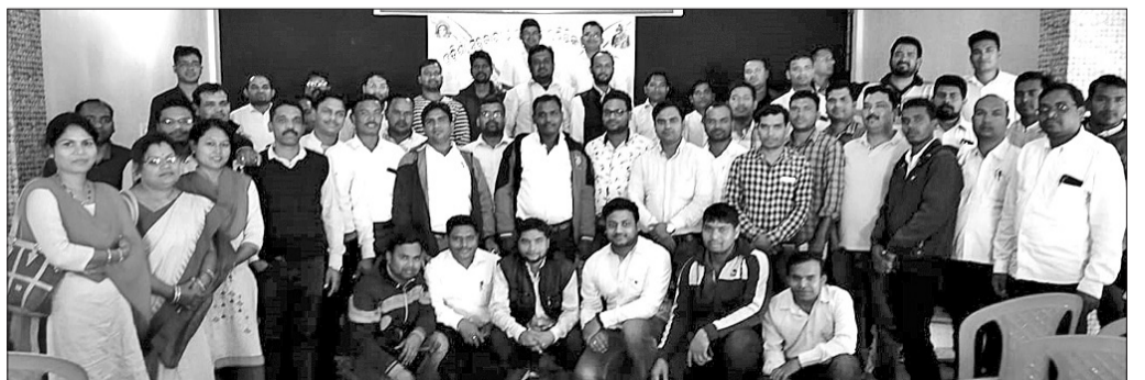
ଭବାନୀପାଟଣାରେ ରୁକ୍ମିଭିତ୍ତିକ ଶିକ୍ଷକ ସଂଘର ବୈଠକରେ ଯୋଗଦେଇଥିବା ଶିକ୍ଷକମାନେ ।