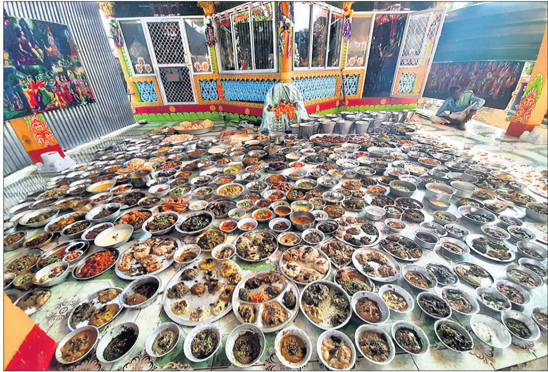
ଗୌରବିହାର ଆଶ୍ରମ (ମାତା ମଠ)ରେ ବ୍ୟଞ୍ଜନ ଦ୍ୱାଦଶୀ ଉତ୍ସବ ଅବସରରେ ଲାଗି କରାଯାଇଥିବା ବ୍ୟଞ୍ଜନ।