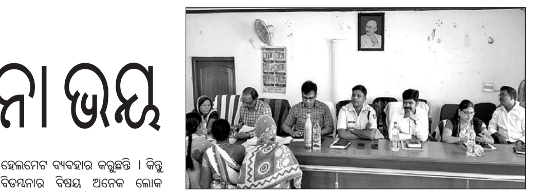
ଜୁନାଗଡ଼ରେ ଅନୁଷ୍ଠିତ ଜିଲାପାଳଙ୍କ ଅଭିଯୋଗ ଶୁଣାଣି ଶିବିର।