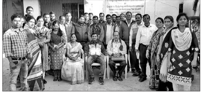
ପ୍ରଶିକ୍ଷଣ ଅଧିକାରୀ ଓ ପ୍ରଶିକ୍ଷାର୍ଥୀମାନେ ।