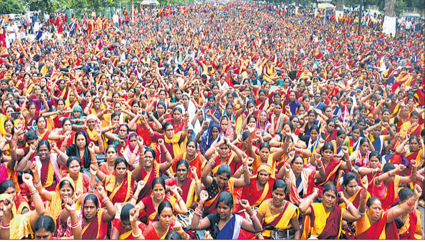
ଲୋୟର ପିଏମ୍‌ଜିରେ ବିପ୍ଳବ ସଂଖ୍ୟାରେ ଅଜ୍ଞାନତ୍ରାଡ଼ି କର୍ମୀଙ୍କ ବିରୋଧ ପ୍ରଦର୍ଶନ।

ଦୀର୍ଘ ଦିନରୁ ଦାବି ପୂରଣ ହେଉ ନ ଥିବାରୁ ଅଲ୍ ଓଡ଼ିଶା ଅଜ୍ଞାନତ୍ରାଡ଼ି କେଡିକୁ ଉଦ୍ଧାର କରି ଆନ୍ଦୋଳନରେ ଯୋଗଦାନ କରିବାକୁ ଲୋୟର ପିଏମ୍‌ଜିରେ ଅଜ୍ଞାନତ୍ରାଡ଼ି କର୍ମୀ ମାଷ୍ଟରକାର୍ଡିଂରେ ଏକତ୍ର ହୋଇ ଏକ ବିଶାଳ ଶୋଭାଯାତ୍ରାରେ ବାହାରିଥିଲେ। ଏହାପରେ ଲୋୟର ପିଏମ୍‌ଜିରେ ଧାରଣା