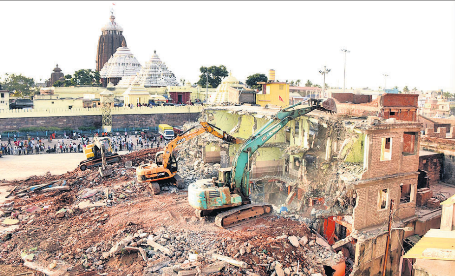
ମଜୁ ମଠର ବ୍ୟବସାୟିକ କୋଠାକୁ ଭଙ୍ଗାଯାଇଛି।

ଶ୍ରୀମନ୍ଦିର ସୁରକ୍ଷା କୋମିଶନର ଥିବା ଲକ୍ଷ୍ମୀକାନ୍ତ ମଠ, ଏମାର ମଠ ଏବଂ ବଡ଼ ଆଖିବା ମଠ ଭଙ୍ଗାଯିବା ପରେ ମଜୁ ମଠ ଉଚ୍ଛ୍ରେୟ ଲାଗି ପ୍ରଶାସନ ପ୍ରସ୍ତୁତ ହୋଇଥିଲା।