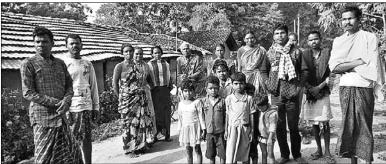
ଅବହେଳିତ ହାତୀକୁଟା ଗ୍ରାମବାସୀ।

ସରକାର ଚରିବ ଲୋକ ତଥା ବୃଦ୍ଧାବସ୍ଥା ମାନଙ୍କୁ ସହାୟତା ଦେବା ପାଇଁ ଭଲ ବ୍ୟବସ୍ଥା କରିଛନ୍ତି। ପରିଶେଷ ବୟସରେ କାମ କାମ କରି ପାରିନଥିବାରୁ ଅନୁମତ ବୁଲ ପୁଠା ଖାଇବା ସହ ନିଜର ସର୍ବନିମ୍ନ ଆବଶ୍ୟକତା ପୂରଣ ପାଇଁ ଏଭଳି ସାମାଜିକ ସୁରକ୍ଷା ଯୋଜନାରେ ଭଲ ବ୍ୟବସ୍ଥା କରିଛନ୍ତି। ତେବେ ବିଭିନ୍ନ କାରଣରୁ ବହୁ ବୃଦ୍ଧାବସ୍ଥା ଏହି ଯୋଜନାରୁ ବଞ୍ଚିତ ରହି ବୃଦ୍ଧାବସ୍ଥାରେ ରହୁଛନ୍ତି। ଅନେକ ଭଲ ଅପେକ୍ଷା କରି ଆଉ ପରିଚ୍ଛା ଚାଲିଯାଇଛି। ଏହା ସତ୍ତ୍ୱେ ମାନବିକ ଦୃଷ୍ଟି କୋଣରୁ ସେମାନଙ୍କୁ ପଞ୍ଚାୟତ କିମ୍ବା ପ୍ରଶାସନ ଠାରୁ ସହାୟତା ମିଳୁ ନାହିଁ।