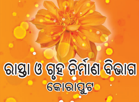
ରାସ୍ତା ଓ ଗୃହ ନିର୍ମାଣ ବିଭାଗ କୋରାପୁଟ

ଅବସରରେ ସମସ୍ତ ପାଠକପାଠିକାଙ୍କୁ ଶୁଭେଚ୍ଛା ଜଣାଇବା ସହ ଧରଣୀର ଉତ୍ତରୋତ୍ତର କାମନା କରୁଛି ।