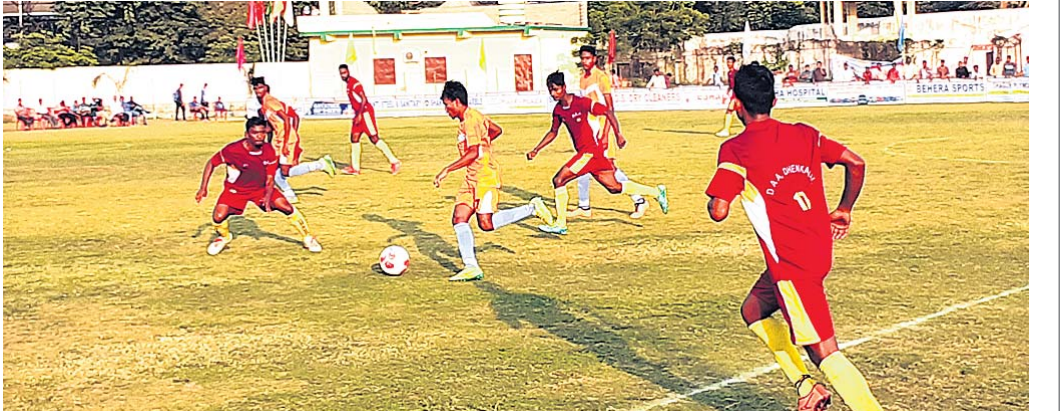
ସାହାଣୀ କପ୍ ଫୁଟ୍‌ବଲ ଚୂର୍ଣ୍ଣମେଣ୍ଡରେ ସୋମବାର ଢେଙ୍କାନାଳ ଓ ବାରଗଡ଼ ମଧ୍ୟରେ ଅନୁଷ୍ଠିତ ମ୍ୟାଚ୍ ।

ମ୍ୟାଚ୍‌କୁ ସୁଗଠବଦ୍ଧ କରିବା ନିମନ୍ତେ ଓସିଏ ବିଭିନ୍ନ କମିଟି ଓ ସବ୍‌କମିଟି ଗଠନ କରିଛି। ସାଙ୍ଗଠନିକ କମିଟିରେ ବିଭିନ୍ନ ବିଧାୟକଙ୍କ ସମେତ ଓସିଏର ପଦାଧିକାରୀ ଅଛନ୍ତି। ଏହାଛଡ଼ା ଅଭ୍ୟର୍ଥନା କମିଟି, ପରାମର୍ଶ କମିଟି, ମିଡ଼ିଆ କମିଟି, ପ୍ରେସ୍ ବକ୍ସ ସଂଯୋଜକ କମିଟି, ବିସିସିଆଇ କମିଟି, ବିସିସିଆଇ ବକ୍ସ ସଂଯୋଜକ, ଫୁଟ୍ ଲାଇଭ୍ ପରିଚାଳନା କମିଟି, ନେଟ୍ ପ୍ରାକ୍ଟିସ୍ ମ୍ୟାନେଜମେଣ୍ଟ, ଟିକେଟ୍ ବଣ୍ଟନ କମିଟି, ଫାଟକ ନିୟନ୍ତ୍ରଣ କମିଟି ଠାରୁ ଆରମ୍ଭ କରି ବିଭିନ୍ନ କମିଟି ଗଠନ କରାଯାଇଛି।