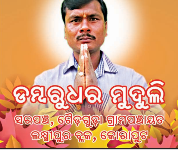
ଡମ୍ବରୁଧର ମୁକୁଳି ସରପଂଚ, ଶୈଳଗୁଡ଼ା ଗ୍ରାମପଞ୍ଚାୟତ ଲକ୍ଷ୍ମୀପୁର ବ୍ଲକ, କୋରାପୁଟ