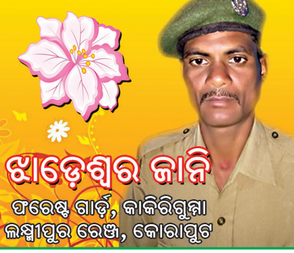
ଝାଡ଼େଶ୍ୱର ଜାନି ଫରେଷ୍ଟ ଗାର୍ଡ୍, କାକିରିଗୁମ୍ଫା ଲକ୍ଷ୍ମୀପୁର ରେଞ୍ଜ, କୋରାପୁଟ

ଡେରାବିଶର ପ୍ରାଚୀନ ଐତିହ୍ୟ ଓ ସଂସ୍କୃତି ମହାନ । ଏହାକୁ ଉଜ୍ଜୀବିତ ରଖିବା ପାଇଁ ଆସନ୍ତୁ ସଂକଳ୍ପ ନେବା । ଧରଣୀର ସ୍ୱନକ୍ଷତ୍ର ଅବସରରେ ଡେରାବିଶ ମହାବିଦ୍ୟାଳୟର ସମସ୍ତ ଅଧ୍ୟାପକ, ଅଧ୍ୟାପିକା, କର୍ମଚାରୀ ଓ ଛାତ୍ରା ଛାତ୍ରୀଙ୍କ ସୁଖ ସମୃଦ୍ଧି କାମନା କରୁଛି ।