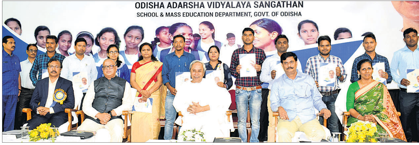
ରବୀନ୍ଦ୍ର ମଣ୍ଡପଠାରେ ଅନୁଷ୍ଠିତ ଓଡ଼ିଶା ଆଦର୍ଶ ବିଦ୍ୟାଳୟର ଅଧ୍ୟକ୍ଷ ଓ ନବନିଯୁକ୍ତ ଶିକ୍ଷକଙ୍କ ପାଇଁ ମାର୍ଗଦର୍ଶନ କାର୍ଯ୍ୟକ୍ରମରେ ମୁଖ୍ୟମନ୍ତ୍ରୀ ନବୀନ ପଟ୍ଟନାୟକ ଓ ଅନ୍ୟମାନେ।

ଗୁଣାତ୍ମକ ଶିକ୍ଷା ପ୍ରତି ଓଡ଼ିଶା ସରକାର ପ୍ରତିବଦ୍ଧ। ରାଜ୍ୟରେ ଗୁଣାତ୍ମକ ଶିକ୍ଷାକୁ ପ୍ରୋତ୍ସାହନ ଦେବାକୁ ସମଗ୍ର ରାଜ୍ୟରେ ନୂତନ ଢାଞ୍ଚାରେ ୨୧୪ ଆଦର୍ଶ ବିଦ୍ୟାଳୟ ଖୋଲାଯାଇଛି।