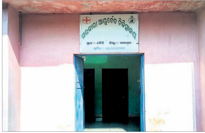
ବୈରୀ ସରକାରୀ ଆୟୁର୍ବେଦିକ ଚିକିତ୍ସାଳୟ ।

ବଡ଼ଚଣା ବ୍ଲକ ଅନ୍ତର୍ଗତ ବୈରୀଠାରେ ରହିଛି ଆୟୁର୍ବେଦିକ ଚିକିତ୍ସା କେନ୍ଦ୍ର । ଏହି ଚିକିତ୍ସା କେନ୍ଦ୍ର ଉପରେ ୫ଗୋଟି ପଞ୍ଚାୟତ ଯଥା ବୈରୀ, ସମିଆ, ପାରିଆ, ବଡ଼କା ଓ ସୋଲର ଆଦି ଜନସାଧାରଣ ନିର୍ଭର କରିଥାନ୍ତି । ସରକାର ୫-ଟି ବ୍ୟବସ୍ଥା ଲାଗୁ କରି ବିଭିନ୍ନ ନେତୃତ୍ୱାଳ ଉପରେ ଯୋଜନା କରୁଥିବାବେଳେ ଏହି ଚିକିତ୍ସା କେନ୍ଦ୍ର ପ୍ରତି କାହାରି ନଜର ପଡ଼ୁନାହିଁ । ଏଠାରେ ଜଣେ ମାତ୍ର ଡାକ୍ତରଙ୍କୁ ନିଯୁକ୍ତି ମିଳିଥିବାବେଳେ ସେ ଆଉ ଏକ ଡାକ୍ତରଖାନାକୁ ଅଧା ସମୟ ଯାଉଛନ୍ତି । ଡାକ୍ତର ଜଣଙ୍କ ପାଳି କରି ୩ଦିନ ବୈରୀଠାରେ ରହୁଥିବାବେଳେ ଅନ୍ୟ ୩ ଦିନ ସିଦ୍ଧାନ୍ତ ଆୟୁର୍ବେଦିକ ଚିକିତ୍ସାଳୟକୁ ଯାଉଛନ୍ତି । ଏଠାରେ ଫାର୍ମାସିଷ୍ଟ ରହିବାର ନିୟମ ଥିଲାବେଳେ ଦୀର୍ଘ ୧୮ବର୍ଷ ହେଲା ଫାର୍ମାସିଷ୍ଟ ପଦ ଖାଲିପଡ଼ିଛି । ୧୯୭୨ ମସିହାକୁ ତିଆରି ହୋଇଥିବା ଏହି ଆୟୁର୍ବେଦିକ ଚିକିତ୍ସା କେନ୍ଦ୍ରଟି ନାନା ଅସୁବିଧା ଦେଇ ଗତି କରୁଛି । ଦୀର୍ଘ ଦିନ ତଳେ ସ୍ୱାସ୍ଥ୍ୟକେନ୍ଦ୍ର ପ୍ରାଚୀରକୁ ବନ୍ଧୁଆ ହାତୀପଲ ପଶି ଭାଙ୍ଗି ଦେଇଥିଲେ, ହେଲେ ତାହା ଅଦ୍ୟାବଧି