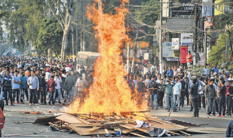
ଗୁଆହାଟୀରେ ବିଶୋଭକାରୀଙ୍କ ପୋଡ଼ାଜଳା।