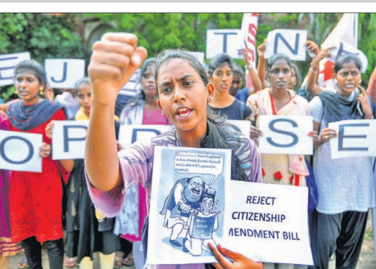
ଚେରାଇରେ ମାଡ଼ାୟୁ ଯୁଦ୍ଧଭିତ୍ତି ଛାତ୍ରଛାତ୍ରୀଙ୍କ ବିଶୋଭ।

ଅନ୍ୟମାନେ ରୋହିଣୀ ସେକ୍ଟର ୯ ଏବଂ ୧୧, ଆଡର୍ଶ ନଗର ଓ ସିବନେଡର ବ୍ରିକ୍ ନିକଟରେ ରହୁଛନ୍ତି। ସେମାନେ ନାଗରିକତ୍ୱ ବିଲ୍ ପାସକୁ ଆଗ୍ରହର ସହ ଅପେକ୍ଷା କରି ରହିଥିବା ଦେଖାଯାଇଥିଲା। ଭୋଟ ଅଧିକାର ନ ଥିବାରୁ ସେମାନଙ୍କ ଅସୁବିଧା ହୋଇଥିଲା। କେତେକ ରେଡିଓ ପାଖରେ ଭିଡ଼ ଜମାଇଥିବାବେଳେ ଅନ୍ୟମାନେ ସେମାନଙ୍କ ଫୋନ୍‌ରେ ବିଲ୍ ଗୂହୀତ ହେବା ସମ୍ପର୍କରେ ଖବର ଜାଣିବା ପାଇଁ ଉଦ୍ୟମ ତଳାଇଥିଲେ। ପାକିସ୍ତାନୀ ଦଳ ଆସିଥିବା ପାଖପାଖି ୭୫୦ ହିନ୍ଦୁ ଦିଲ୍ଲୀ ମଜୁର କା ଚିଲରେ ଅପ୍ଲାଇ ଘରେ ଶରଣାର୍ଥୀ ଭାବେ ରହିଛନ୍ତି।