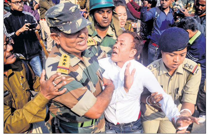
ଅଗରତାଲାରେ ଏନ୍ଫ୍ ଅସ୍‌ଏଫ୍ ବନ୍ଦ ପାକନ ବେଳେ ବିଶୋଭକାରୀ ଅଟକି।