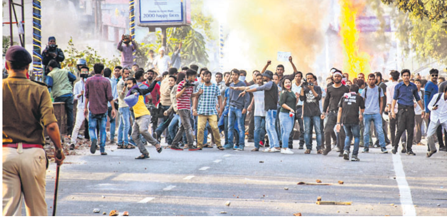
ଗୁଆହାଟୀରେ ପୋଲିସ୍-ବିଶୋଭକାରୀ ଖଣ୍ଡଯୁଦ୍ଧ।