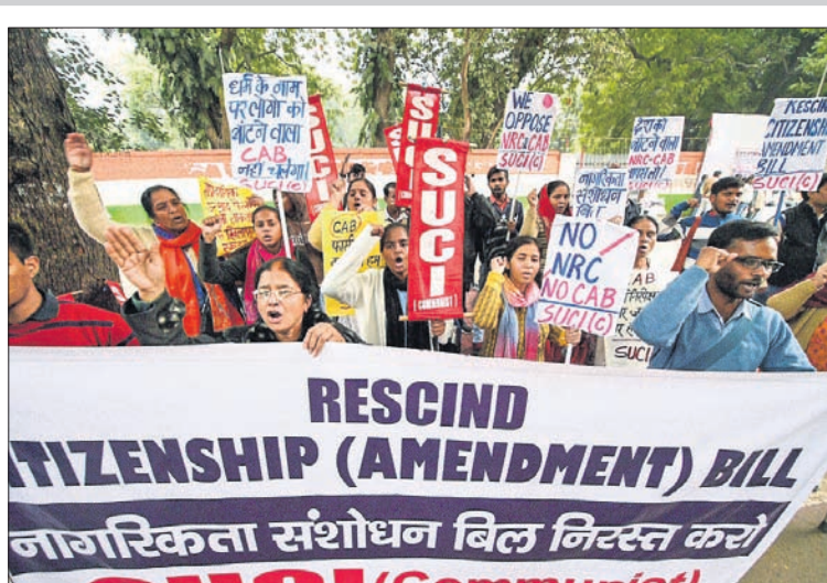
ଦିଲ୍ଲୀ ଯନ୍ତ୍ରମତରେ ଏକପ୍ରକାର କର୍ମୀଙ୍କ ବିଶୋଭ ପ୍ରଦର୍ଶନ।