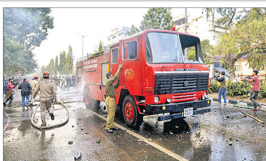
ଗୁଆହାଟୀରେ ଅଗ୍ନିଶମ ବାହିନୀର ଗାଡ଼ିକୁ ଭଙ୍ଗାଟୁଙ୍ଗା କରିଛନ୍ତି ଆନ୍ଦୋଳନକାରୀ।