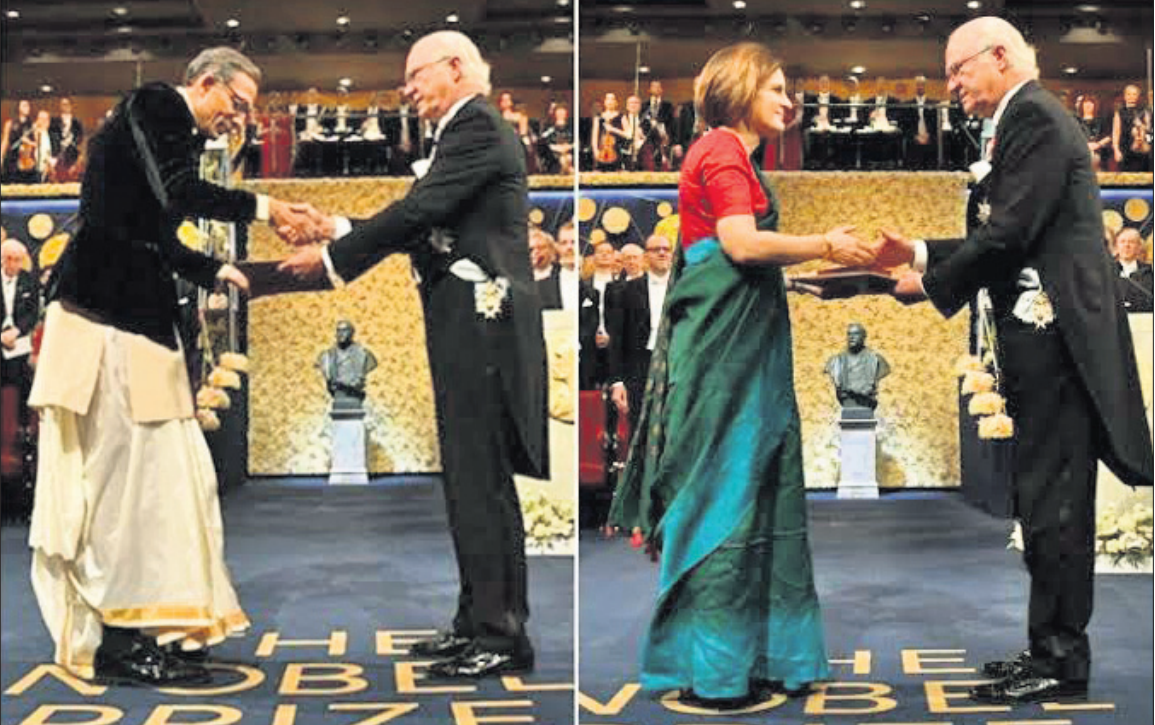
ଭାରତୀୟ-ଆମେରିକୀୟ ଅର୍ଥନୀତିଜ୍ଞ ଅଭିଜିତ ବାନାର୍ଜୀ ଓ ତାଙ୍କ ସ୍ତ୍ରୀ ଲକ୍ଷ୍ମଣା ରୁସ୍ସୋ ସ୍ମିତେନରେ ରୁଧିର ନୋବେଲ ପୁରସ୍କାର ଗ୍ରହଣ କରୁଛନ୍ତି । ଅଭିଜିତ ଯୋଡ଼ି ଓ କୁର୍ତ୍ତା ପିନ୍ଧିଥିବାବେଳେ ଲକ୍ଷ୍ମଣା ନାକ ଶାଢ଼ି ପିନ୍ଧିଛନ୍ତି ।