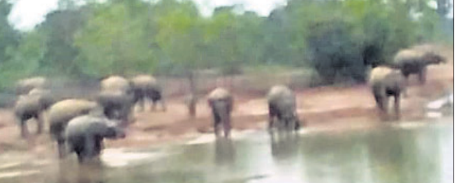
ଜଙ୍ଗଲର ଲଲାକାକୁ ପାଣି ପିଇବାକୁ ଆସିଥିବା ହାତୀ ପଲ।