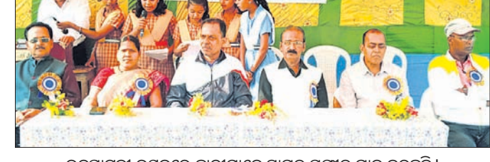
ଉଦ୍‌ଘାଟନା ଉତ୍ସବରେ ଛାତ୍ରାମାନେ ସାଗତ ସଜାତ ଗାନ କରୁଛନ୍ତି।