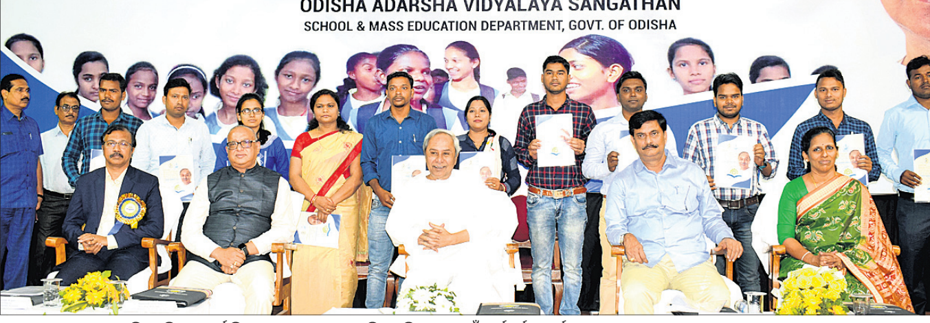
ODISHA ADARSHA VIDYALAYA SANGATHAN SCHOOL & MASS EDUCATION DEPARTMENT, GOVT. OF ODISHA

ରବୀନ୍ଦ୍ର ମଣ୍ଡପଠାରେ ଅନୁଷ୍ଠିତ ଓଡ଼ିଶା ଆଦର୍ଶ ବିଦ୍ୟାଳୟର ଅଧ୍ୟକ୍ଷ ଓ ନବନିଯୁକ୍ତ ଶିକ୍ଷକଙ୍କ ପାଇଁ ମାର୍ଗଦର୍ଶନ କାର୍ଯ୍ୟକ୍ରମରେ ପୁଖ୍ୟମନ୍ତ୍ରୀ ନବୀନ ପଟ୍ଟନାୟକ ଓ ଅନ୍ୟମାନେ ।