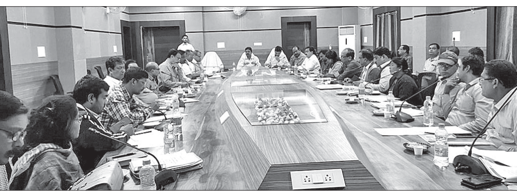
ସମୀକ୍ଷା ବୈଠକରେ ରାଜସ୍ୱ ପରିଷଦର ସଦସ୍ୟଙ୍କ ସହ ଜିଲ୍ଲା ପ୍ରଶାସନିକ ଅଧିକାରୀ ଓ ଅନ୍ୟମାନେ।