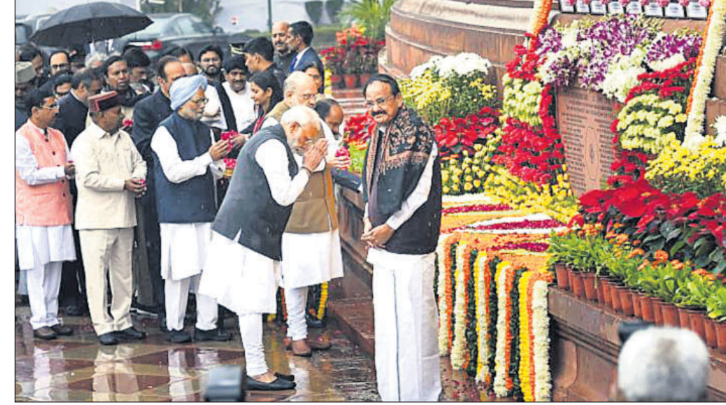
ନୂଆଦିଲ୍ଲୀ, ୧୩୧୨ (ପି.ଟି.): ସଂସଦ ଭବନ ଆକ୍ରମଣକୁ ଶୁକ୍ରବାର ୧୮ ବର୍ଷ ପୂରିଛି। ଏହି ଅବସରରେ ରାଷ୍ଟ୍ରପତି ରାମନାଥ କୋବିନ୍ଦ, ଉପରାଷ୍ଟ୍ରପତି ଏମ୍. ଭେଙ୍କାୟା ନାଇଡୁ, ପ୍ରଧାନମନ୍ତ୍ରୀ ନରେନ୍ଦ୍ର ମୋଦି, କଂଗ୍ରେସ ଅଧ୍ୟକ୍ଷା ସୋନିଆ ରାଷ୍ଟ୍ରୀ ୨୦୦୧ ଆକ୍ରମଣରେ ଶହାଦତ୍ତ ଶ୍ରଦ୍ଧାଞ୍ଜଳି ଜଣାଇଛନ୍ତି। ଅନ୍ୟମାନଙ୍କ