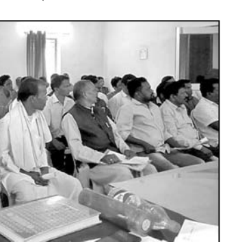
ବୈଠକରେ ଉପସ୍ଥିତ ସରପଞ୍ଚ ଓ ସମିତିସଭ୍ୟମାନେ ।