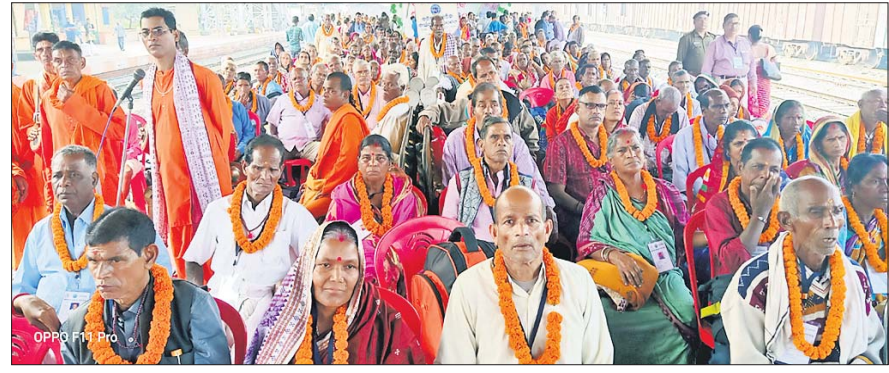
ବାଲେଶ୍ଵର ରେଳ ଷ୍ଟେଶନରେ ତୀର୍ଥଯାତ୍ରାରେ ବାହାରିଥିବା ବରିଷ୍ଠ ନାଗରିକମାନେ।

ଭୁବନେଶ୍ଵର/ ବାଲେଶ୍ଵର ଅଫିସ ୧୩୧୨ (ବ୍ୟୁରୋ) ମୁଖ୍ୟମନ୍ତ୍ରୀ ନବୀନ ପଟ୍ଟନାୟକ ଶୁକ୍ରବାର ଲୋକସେବା ଭବନରୁ ଭିଡ଼ିଓ କନ୍ଫରେନ୍ସିଂ ଜରିଆରେ ବରିଷ୍ଠ ନାଗରିକଙ୍କ ତୀର୍ଥଯାତ୍ରାର ଶୁଭାରମ୍ଭ କରିଛନ୍ତି। ବାଲେଶ୍ଵର ଷ୍ଟେଶନରୁ ତୀର୍ଥଯାତ୍ରା ବନ୍ଦ ହରିଦ୍ଵାର-ରଖିକେଶ ଅଭିଯୁକ୍ତ ଯାତ୍ରା ଆରମ୍ଭ କରିଛନ୍ତି। ଓଡ଼ିଶା ପର୍ଯ୍ୟଟନ ବିଭାଗ ପକ୍ଷରୁ ଆଜିଆରସିସି ସହଯୋଗରେ ୨୦୧୬ରୁ ଏହି କାର୍ଯ୍ୟକ୍ରମ ଆୟୋଜିତ ହେଉଛି। ଏଯାବତ୍ ୧୨ଟି ତୀର୍ଥଯାତ୍ରା ବନ୍ଦ ଦେଶର ବିଭିନ୍ନ ପ୍ରକ୍ଷ ଚାହୁଁଛନ୍ତି। ବାଲେଶ୍ଵର, ଭଦ୍ରକ, ମୟୂରଭଞ୍ଜ, ଯାଜପୁର ଓ କେନ୍ଦୁଝର ଜିଲାର ୧୬୦ ଯାତ୍ରୀ ଚଳିତଥର ଯାତ୍ରା କରିଛନ୍ତି। ସେମାନଙ୍କ