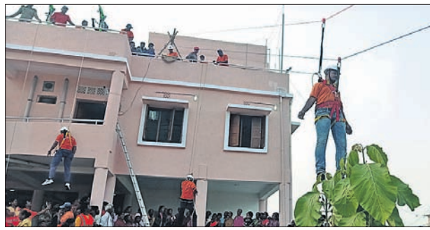
ମକ୍ତବ୍ୱଳ ଚାଲିଛି ।

ଗୋପାଳପୁର, ୧୩୧୨ (ଡି.ଏନ.ଏ.) ରମା ଥାନା ଅଧୀନ କାନ୍ଥାସ ରାଜପଥ ବୁଡୁଡି ନିକଟରେ ଶୁକ୍ରବାର ଏକ କାର୍ ଭାଗସାମ୍ୟ ହୋଇ ଦୁଇ ଜଣଙ୍କୁ ଧକ୍କା ଦେଇଥିଲା । ଆତ୍ମହତ୍ୟା ପ୍ରୟାସ କରି ଛତ୍ରପୁର ଏସଡିପିଓ ଗୋଟିଏ କିଶାନ ଆହତହୁଏଇ ଉଦ୍ଧାର କରି ନିଜ ଘାଟିରେ ଡାକ୍ତରଖାନାକୁ ଆଣିଥିଲେ ।