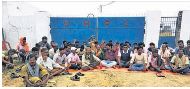
ଗ୍ରାମବାସୀ ଧାରଣାରେ ବସିଛନ୍ତି।

ସାନଖେମୁଣ୍ଡି ବ୍ଲକ୍ ପତିଗୁଡ଼ା ପଞ୍ଚାୟତ ସିନ୍ଦୁପୁର ଗ୍ରାମବାସୀ ରୋଗରୁ ମୁକ୍ତ ପାଇଁ ଗୁରୁବାର ଗାଁରେ ଥିବା ଏକ କୁକୁଡ଼ା ଫାର୍ମ ସମ୍ମୁଖରେ ଧାରଣା ଦେଇଥିଲେ। ଗ୍ରାମରୁ କୁକୁଡ଼ା ଫାର୍ମ ହାଲବାକୁ ସେମାନେ ଦାବି କରିଥିଲେ। କିନ୍ତୁ ଦାବି ପୂରଣ ନ ହେବାରୁ ଶୁଭକାରୀ ସିନ୍ଦୁରପୁରବାସୀଙ୍କ ସମେତ ଆଖପାଖ ଅଞ୍ଚଳବାସୀ ଆନ୍ଦୋଳନକୁ ସମର୍ଥନ ଜଣାଇବା ସହ ସକାଳ ୫ଟାରୁ ଫାର୍ମର ସମସ୍ତ କର୍ମଚାରୀଙ୍କୁ ବାହାରକୁ ଆଣି ଫାଟକରେ ତାଳା ପକାଇ ବିକ୍ଷୋଭ ପ୍ରଦର୍ଶନ କରିଥିଲେ। ଫାଟକ ସମ୍ମୁଖରେ ଧାରଣାକାରୀ ରୋଷେଇ କରି ଖାଇବା ସହ ଦାବି ପୂରଣ ନ ହେଲେ ଧାରଣାକୁ