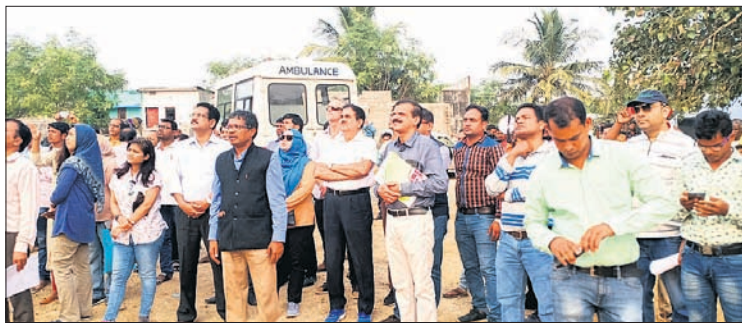
ମକ୍ତବ୍ୱଳ ଦେଖିଛନ୍ତି ପ୍ରତିନିଧି ଦଳ

ଗୋପାଳପୁର, ୧୩୧୨ (ଡି.ଏନ.ଏ.) ରମା ଥାନା ଅଧୀନ କାନ୍ଥାସ ରାଜପଥ ବୁଡୁଡି ନିକଟରେ ଶୁକ୍ରବାର ଏକ କାର୍ ଭାଗସାମ୍ୟ ହୋଇ ଦୁଇ ଜଣଙ୍କୁ ଧକ୍କା ଦେଇଥିଲା । ଆତ୍ମହତ୍ୟା ପ୍ରୟାସ କରି ଛତ୍ରପୁର ଏସଡିପିଓ ଗୋଟିଏ କିଶାନ ଆହତହୁଏଇ ଉଦ୍ଧାର କରି ନିଜ ଘାଟିରେ ଡାକ୍ତରଖାନାକୁ ଆଣିଥିଲେ ।