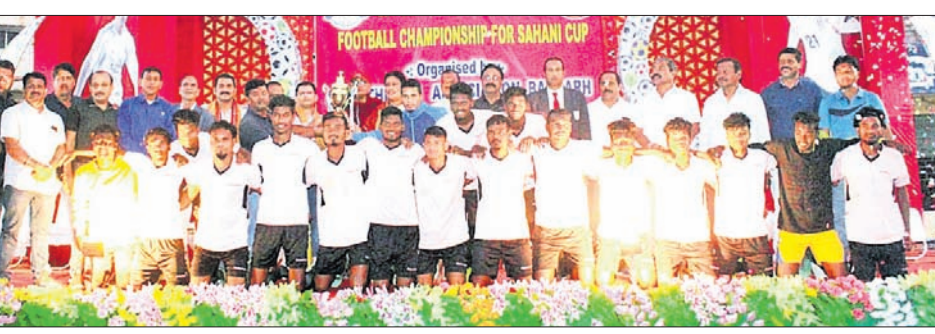
ଚାମ୍ପିୟନ ସୁନ୍ଦରଗଡ଼ ଦଳ ଅତିଥିକ ଗହଣରେ।