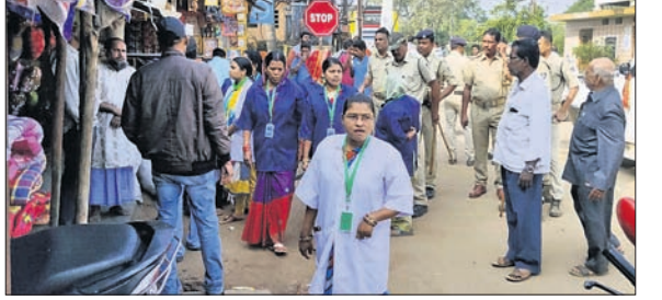
ପରିମଳ ସଚେତନତା କରାଯାଇଛି ।