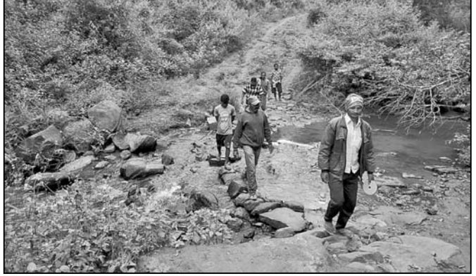
ଗାଁକୁ ରାସ୍ତା ନାହିଁ ।

ସରକାର ଗ୍ରାମାଞ୍ଚଳ ବିକାଶ ପାଇଁ ବିଭିନ୍ନ ଯୋଜନା ପ୍ରଣୟନ କରିଛନ୍ତି । କିନ୍ତୁ ଏବେ ମଧ୍ୟ କେତେକ କ୍ଷେତ୍ରରେ ଏହା କାର୍ଯ୍ୟକାରୀ ହେଉନାହିଁ ।