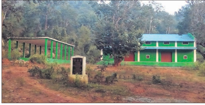
ନିର୍ମାଣାଧୀନ ମକା ମଣ୍ଡି ଗୃହ ।

ଗଜପତି ଜିଲ୍ଲା ଆର.ଉଦୟଗିରି, ନୂଆଗଡ଼ ଓ ମୋହନା ବ୍ଲକ୍ ଅଞ୍ଚଳରେ ବ୍ୟାପକ ମକା ଚାଷ ହେଉଛି । ସରକାର ଚାଷୀମାନଙ୍କଠାରୁ ମକା କ୍ରୟ କରୁ ନ ଥିବାବେଳେ ଏ ନେଇ କୌଣସି ସୁବିଧା ଯୋଗାଇନାହାନ୍ତି । ଫଳରେ ଖଳାରେ କୁଇଖୁଲ କୁଇଖୁଲ ମକା ପଡ଼ିରହିଛି । ଏହାର ସୁଯୋଗ ନେଉଛନ୍ତି ଦଳାଳ । କ୍ରୟ ଆଳରେ ଚାଷୀମାନଙ୍କୁ ଓଜନରେ ଠକୁଛନ୍ତି । ସରକାର ଚାଷୀଙ୍କ ପାଇଁ ବହୁ ଯୋଜନା କରୁଛନ୍ତି, କିନ୍ତୁ ଏହି ଅଞ୍ଚଳର ମକାଚାଷୀ ଏଥିରୁ ବଞ୍ଚିତ ବୋଲି ଅଭିଯୋଗ କରିଛନ୍ତି ।