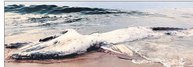
ରଖିଛନ୍ତି ବୋକାଭୂମିରେ ପଡିଥିବା ମାଳା ତିନି ।

ଗଞ୍ଜାମ, ୧୩୧୨ (ଡି.ଏନ.ଏ.) ଅନୁମାନ କରାଯାଇଛି । ଏହାକୁ ଖଣ୍ଡ ଖଣ୍ଡ କରି କାଟି ବୋକାଭୂମିକୁ ପ୍ରାୟ ୨ଶହ ପାଠ ନିକଟସ୍ଥ ରଖିଛନ୍ତି । ପୁରୀରେ ଗାଡ଼ ଖୋଳି ଯୋଗ୍ୟ ବାକି ପାଠ ନିକଟସ୍ଥ ରଖିଛନ୍ତି । ଏହାର ଲାଭ ଆନୁମାନିକ ୩୦ ଫୁଟ ଓ ମୃତ ତିନିକୁ ହତାହତାକୁ ବ୍ୟବସ୍ଥା କରିଥିଲେ ।