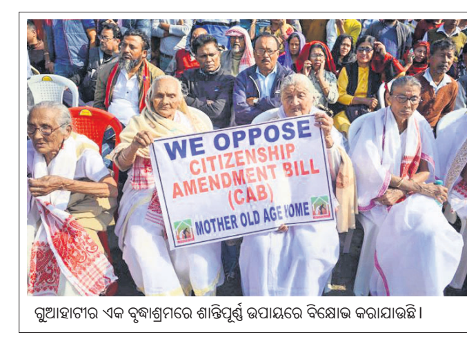
ଗୁଆହାଟୀର ଏକ ବୃଦ୍ଧାଶ୍ରମରେ ଶାନ୍ତିପୂର୍ଣ୍ଣ ଉପାୟରେ ବିରୋଧ କରାଯାଇଛି।

ଏହାକୁ ଅନୁମୋଦନ କରିବା ପରେ ବିଲ ଆଇନରେ ପରିଣତ ହୋଇଛି। କେବଳ ମୁଖ୍ୟମନ୍ତ୍ରୀ ବିଜୟନ୍ ଗୁରୁବାର କହିଥିଲେ, ତାଙ୍କ ରାଜ୍ୟରେ 'ଏକ ସମ୍ଭାଷଣବିରୋଧୀ ଆଇନର କୌଣସି ସ୍ଥାନ ନାହିଁ'। ସେହିପରି ପଶ୍ଚିମବଙ୍ଗ ମୁଖ୍ୟମନ୍ତ୍ରୀ ମମତା ମଧ୍ୟ ଏହାକୁ ଦୃଢ଼ବିରୋଧ କରିଛନ୍ତି। ସେ କହିଛନ୍ତି, ଭାଜପା ଇସ୍ତଫାରେ ବିକାଶ ପ୍ରସଙ୍ଗ ପରିବର୍ତ୍ତେ ଦେଶକୁ ବିଭାଜନ କରିବା ପାଇଁ ପ୍ରତିଷ୍ଠିତ ଦିଆଯାଇଛି। ଧର୍ମ ଆଧାରରେ ନାଗରିକତ୍ୱ କାର୍ଯ୍ୟକାରୀ କରିବା ପାଇଁ ଏହାକୁ ଗ୍ରହଣ କରିବା ନାହିଁ। ସଂଖ୍ୟାଧିକ ଥିବାରୁ ତୁମେ ଲୋକ ସଭା ଓ ରାଜ୍ୟ ସଭାରେ ବଳପୂର୍ବକ ଆଇନ ପ୍ରଣୟନ ରାମନାଥ କୋବିନ୍ଦ ଗୁରୁବାର ମଧ୍ୟରାତ୍ରିରେ