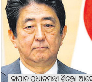
ଜାପାନ ପ୍ରଧାନମନ୍ତ୍ରୀ ଶିଞ୍ଜୋ ଆବେ

ନାଗରିକତ୍ୱ ସଂଶୋଧନ ବିଲ (ସିଏଏ)କୁ ନେଇ ବିବାଦ ପରିପ୍ରେକ୍ଷାରେ ଜାପାନ ପ୍ରଧାନମନ୍ତ୍ରୀ ଶିଞ୍ଜୋ ଆବେଦନ ଭାରତ ଗସ୍ତକୁ ସ୍ମରଣ କରାଯାଇଛି। ପ୍ରଧାନମନ୍ତ୍ରୀ ନରେନ୍ଦ୍ର ମୋଦି ଓ ଜାପାନ ପ୍ରତିଧାନ ଶିଞ୍ଜୋ ଆବେଦନ ମଧ୍ୟରେ ଡିସେମ୍ବର ୧୫ରୁ ୧୭ ପର୍ଯ୍ୟନ୍ତ ଆସାମ ରାଜଧାନୀ ଗୁଆହାଟୀରେ ବାର୍ଷିକ ସମ୍ମିଳନୀ ହେବାର ଥିଲା। ସିଏଏକୁ ନେଇ ଗୁଆହାଟୀରେ ହିଂସାମୁକ୍ତ ଆନ୍ଦୋଳନ ଚାଲିଥିବାରୁ ବର୍ତ୍ତମାନ ପାଇଁ ଆବେଦନ ଗସ୍ତକୁ ସ୍ମରଣ କରାଯାଇଛି। ଦୁଇଦିନିଆ ଗସ୍ତରେ ଗୋଟିଏ ଦିନ ଗସ୍ତ ପାଇଁ ଭବିଷ୍ୟତରେ ନୂଆ ଡିପ୍ଲୋମାଟିକା କାର୍ଯ୍ୟକ୍ରମ ନୂଆଦିଲ୍ଲୀରେ ହେବ ବୋଲି ବିବାଦରେ ମୁକ୍ତ ହେବାର ମୂଳ ଧାରଣା ଉପରେ ଆଜ୍ଞାପଣ। ଏହାର ଭାଗ୍ୟ ସୁପ୍ରିମକୋର୍ଟରେ ନିର୍ଦ୍ଧାରଣ ହେବ।