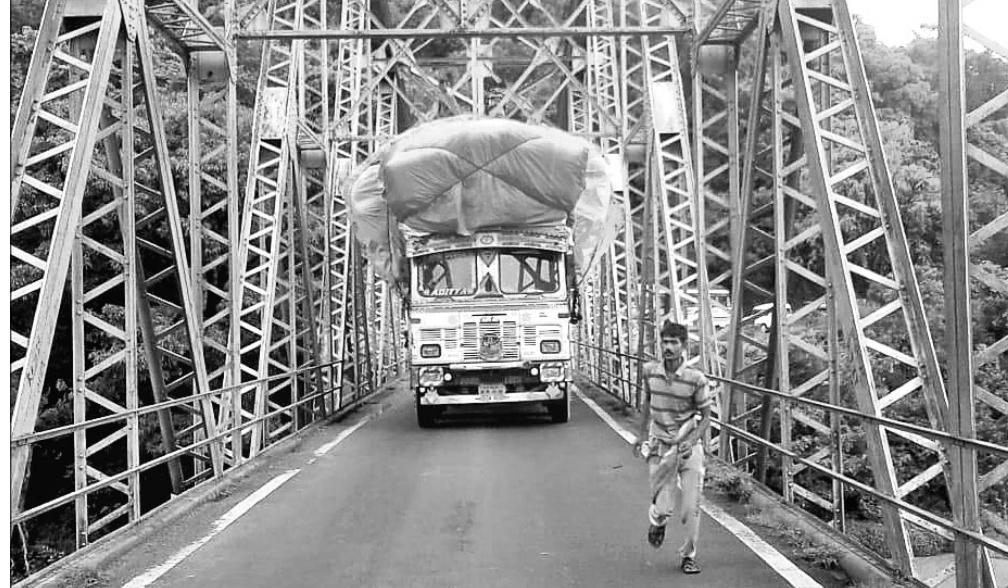
କୋଲାବ ନଦୀ ଉପରେ ଥିବା ୮୮ ବର୍ଷର ପୁରୁଣା ପାତ୍ରପୁଟ ପୋଲ।