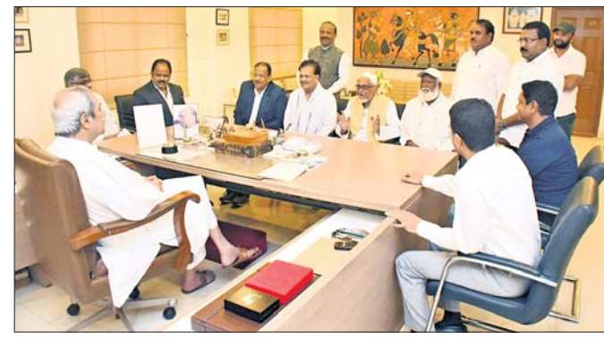
ଭଦ୍ରକରୁ ଆସିଥିବା ସଂଖ୍ୟାଳୟ ସମ୍ପ୍ରଦାୟର ପ୍ରତିନିଧିମାନେ ମୁଖ୍ୟମନ୍ତ୍ରୀ ନବୀନ ପଟ୍ଟନାୟକ ଏବଂ ଅନ୍ୟ ବରିଷ୍ଠ ଅଧିକାରୀଙ୍କ ସହ ଆଲୋଚନା କରୁଛନ୍ତି।

ପାଇଁମେଣ୍ଡରେ ନିକଟରେ ନାଗରିକତ୍ୱ ସଂଗୋଧନ ବିଧେୟକ(ସିଏବି)-୨୦୧୯ ଗୃହୀତ ହୋଇଯାଇଛି। ଏହି ବିଧେୟକକୁ ରାଷ୍ଟ୍ରପତିଙ୍କ ଅନୁମୋଦନ ମଧ୍ୟ ମିଳିଯାଇଛି।