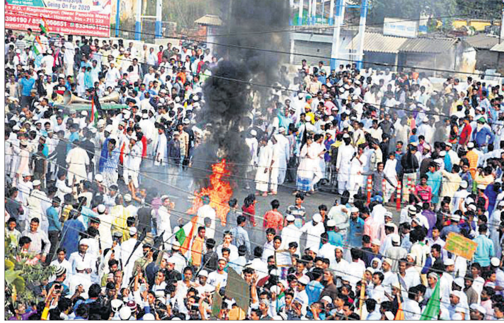
ପଶ୍ଚିମବଙ୍ଗର ହାତଡାରେ ସିଏବି ଏବଂ ଏନ୍ଆରସି ପ୍ରତିବାଦରେ ବିରୋଧ।

ଗୁଆହାଟୀ/ନୂଆଦିଲ୍ଲୀ/କୋଲକାତା, ୧୩୧୨ (ପି.ଟି./ଆଇଏସଏସଏସ) ନୂଆଦିଲ୍ଲୀରୁ ଆଇନଜୀବିତା ଉତ୍ତର-ପୂର୍ବାଞ୍ଚଳରେ ଚାଲିଥିବା ଆନ୍ଦୋଳନର ନିଆଁ ଶୁକ୍ରବାର ପଶ୍ଚିମବଙ୍ଗକୁ ବ୍ୟାପିଛି। ଆସାନ, ତ୍ରିପୁରା, ମଣିପୁର, ସିକିମ, ମେଘାଲୟ ଓ ତ୍ରିପୁରାରେ ସ୍ଥିତି ସାମାନ୍ୟ ସୁଧୁରିଥିବାବେଳେ ପଡ଼ୋଶୀ ପଶ୍ଚିମବଙ୍ଗରେ ବ୍ୟାପକ ହିଂସା ଏବଂ ପୋଡ଼ାକଳା ଦେଖିବାକୁ ମିଳିଛି। ବିରୋଧକାରୀମାନେ କେତେକ ରେଳଷ୍ଟେଶନରେ ଭଙ୍ଗାଗୁଡ଼ା କରିଛନ୍ତି। ସେପଟେ ଏହି ଆଇନକୁ ଚ୍ୟାଲେଞ୍ଜ କରି ଯୁଦ୍ଧମୋର୍ଚ୍ଚାରେ ବିଭିନ୍ନ ରାଜନୈତିକ ଦଳ ଓ ସଙ୍ଗଠନ ପକ୍ଷରୁ ଦାବୀ ପରିଷ୍ଠାନ ସଂଖ୍ୟା ବଢ଼ିବାରେ ଲାଗିଛି। ବିରୋଧକୁ ଦୃଷ୍ଟିରେ ରଖି ସୁରାଷ୍ଟ୍ରମନ୍ତ୍ରୀ ଅମିତ୍ ଶାହା ମୋଦାଲୟ ଓ ଅରୁଣାଚଳ ପ୍ରଦେଶ ଗସ୍ତକୁ ବାଟିଲ କରିଦେଇଛନ୍ତି। ରାଷ୍ଟ୍ରପତି ରାମନାଥ କୋବିନ୍ଦ ନାଗରିକତ୍ୱ ସଂଶୋଧନ ବିଲରେ ସ୍ୱାସ୍ଥ୍ୟ କରିବା ପରେ ଏହା ଆଇନରେ ପରିଣତ ହୋଇଛି। ଉତ୍ତର-ପୂର୍ବାଞ୍ଚଳ ରାଜ୍ୟଗୁଡ଼ିକ ଜଳୁଥିବାବେଳେ ରାଷ୍ଟ୍ରପତି ଉକ୍ତ ବିଲକୁ ଅନୁମୋଦନ ଦେବା ଦୂର୍ଭାଗ୍ୟଜନକ ବୋଲି ଆସାନ ରାଜଧାନୀ ଗୁଆହାଟୀରେ ଗଣବିରୋଧ କରାଯାଇଛି। ଅଲ୍ ଆସାନ ଷ୍ଟୁଡେଣ୍ଟ ୟୁନିୟନ୍ (ଏଏଏସୟୁ) ପକ୍ଷରୁ ଦିଆଯାଇଥିବା ଅନାଚାର ତାକରାରେ