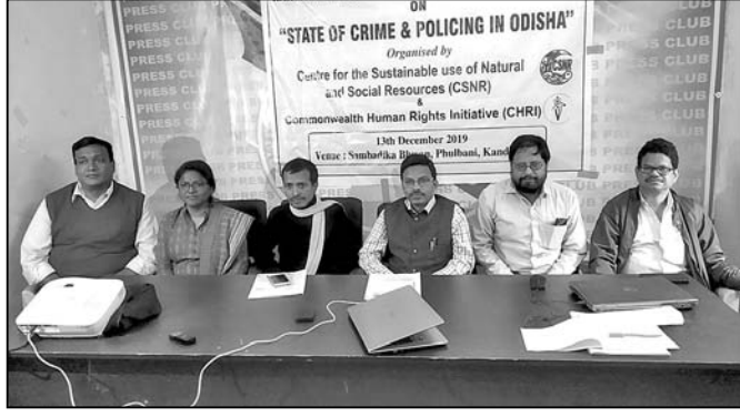
କର୍ମଶାଳାରେ ଉପସ୍ଥିତ କାର୍ଯ୍ୟକର୍ତ୍ତା ।

କନ୍ଧମାଳ ଜିଲ୍ଲାରେ ଅପରାଧର ସ୍ଥିତି ଓ ପୋଲିସ ବ୍ୟବସ୍ଥାକୁ ନେଇ ଏକ କର୍ମଶାଳା ଘୋଷଣା ପ୍ରେସ କ୍ଲବରେ ଶୁକ୍ରବାର ଅନୁଷ୍ଠିତ ହୋଇଯାଇଛି ।