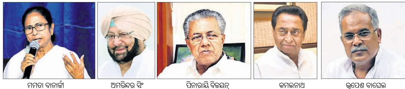
ମମତା ବାନାର୍ଜୀ, ଅମରିନ୍ଦର ସିଂ, ପିନାରାୟି ବିଜୟନ୍, କମଳନାଥ, ଭୂପେଶ ବାଗେଲ

ନାଗରିକତ୍ୱ ସଂଶୋଧନ ଆଇନ (ସିଏଏ), ୨୦୧୯କୁ କାର୍ଯ୍ୟକାରୀ କରିବା ପାଇଁ ରାଜ୍ୟଗୁଡ଼ିକ ବାଧ୍ୟ। ସମ୍ଭାଷଣ ସମ୍ମୁଖ ପରିଚ୍ଛେଦ ଅନୁସାରେ ଏହି ଆଇନ ଅଣାଯାଇଥିବାରୁ ଏହାକୁ ପ୍ରତ୍ୟାଖ୍ୟାନ କରିବା ଅଧିକାର କୌଣସି ରାଜ୍ୟ ସରକାରଙ୍କର ନାହିଁ ବୋଲି ଶୁଣାଇବା ସ୍ୱରାଷ୍ଟ୍ର ମନ୍ତ୍ରଣାଳୟ ପକ୍ଷରୁ ସ୍ପଷ୍ଟ କରାଯାଇଛି। ନବପ୍ରକାଶ ନାଗରିକତ୍ୱ ସଂଶୋଧନ ଆଇନକୁ ଅସାଧାରଣ ଦର୍ଶାଇ କେତେକ ମୁଖ୍ୟମନ୍ତ୍ରୀ ଏହାକୁ ନିଜ ନିଜ ରାଜ୍ୟରେ ଲାଗୁ କରିବାକୁ ମନାକରି ଦେଖିଛନ୍ତି। ସେମାନେ ହେଲେ ମମତା ବାନାର୍ଜୀ (ପଶ୍ଚିମବଙ୍ଗ), ଅମରିନ୍ଦର ସିଂ (ପଞ୍ଜାବ), ପିନାରାୟି ବିଜୟନ୍ (କେରଳ), କମଳନାଥ (ମଧ୍ୟପ୍ରଦେଶ) ଓ ଭୂପେଶ ବାଗେଲ (ଛତିଶଗଡ଼)। ମୁଖ୍ୟମନ୍ତ୍ରୀମାନଙ୍କ ମତରେ ପରିପ୍ରେକ୍ଷାରେ ସ୍ୱରାଷ୍ଟ୍ର ମନ୍ତ୍ରଣାଳୟର ଜଣେ ବରିଷ୍ଠ ଅଧିକାରୀ କହିଛନ୍ତି, କେନ୍ଦ୍ର ତାଲିକାରେ ଥିବା ଏକ କେନ୍ଦ୍ରୀୟ ଆଇନକୁ କାର୍ଯ୍ୟକାରୀ ପାଇଁ ମନାକରିବା ସକାଶେ କ୍ଷମତା କୌଣସି ରାଜ୍ୟ ପାଖରେ ନାହିଁ। ସମ୍ପୂର୍ଣ୍ଣ ପରିଚ୍ଛେଦର କେନ୍ଦ୍ର ତାଲିକାରେ ପ୍ରତିରକ୍ଷା, ବହିର୍ବ୍ୟାପାର, ରେଳଦେଇ, ନାଗରିକତ୍ୱ ଓ ପ୍ରାକୃତିକାବଳୀ ଭଳି ୯୭ଟି ବିଷୟ ରହିଛି। ନାଗରିକତ୍ୱ ସଂଶୋଧନ ଆଇନ ଅନୁସାରେ ପାକିସ୍ତାନ, ବାଂଲାଦେଶ ଓ