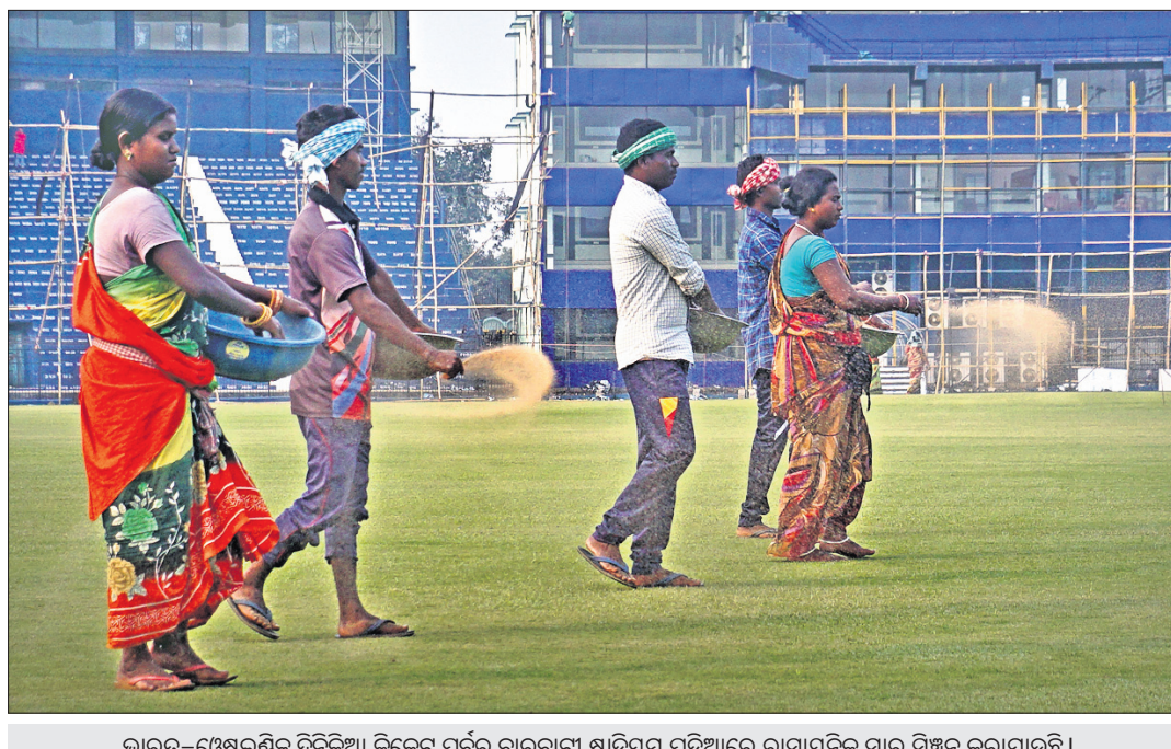
ଭାରତ-ଫ୍ରେସ୍‌କଣ୍ଠିକ ଦିନିକିଆ କ୍ରୀଡ଼ାକର୍ମ ପୂର୍ବରୁ ବାରବାଟୀ ଷ୍ଟାଡ଼ିୟମ ପଡ଼ିଆରେ ରାସାୟନିକ ସାର ସିଞ୍ଚନ କରାଯାଇଛି।

ଅଷ୍ଟ୍ରେଲିଆ ପ୍ରଥମ ଉଦ୍ଦିଷ୍ଟ: ୪୧୬/୪(ଆଉଟ (ଲାବୁସେନ-୧୪୩, ହେଉ-୫୬, ସ୍ଲିଥ-୪୩, ଓର୍ଟଲ-୪୩, ପେନ୍-୩୯, ଷ୍ଟୋର-୩୦, ଓର୍ଟଲ-୪/୯୨, ସୌଦା-୪/୯୩, ଗ୍ରାଭିସ-୧/୩୭, କାଟ ରାଭାଲ-୧/୩୩)। ନ୍ୟୁଜିଲାଣ୍ଡ ପ୍ରଥମ ଉଦ୍ଦିଷ୍ଟ: ୧୦୯/୫ (ଟେଲର-୬୬, ଡ୍ରୁଇୟମ୍‌ସନ-୩୪, ଷ୍ଟୋର-୪/୩୧, ହାକଲେଉଡ଼-୧/୦)।