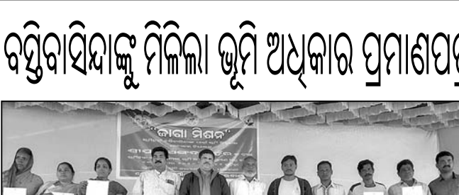
ହିତାଧିକାରୀଙ୍କ ସହ ଅତିଥି ।