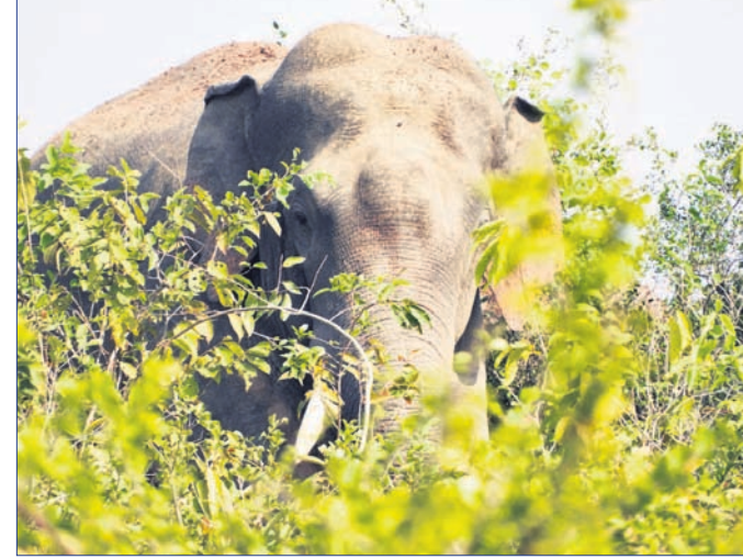
ହାତୀ ପଲରେ ଥିବା ଦର୍ଶନ।