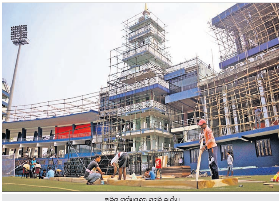
ଅଭିନ ପର୍ଯ୍ୟାୟରେ ପ୍ରସ୍ତୁତି କାର୍ଯ୍ୟ।