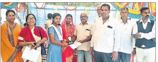
ଜଣେ କୃତୀ ଛାତ୍ରୀଙ୍କୁ ପୁରସ୍କୃତ କରୁଛନ୍ତି ଅତିଥି।

ନୟାଗଡ଼ ଜିଲ୍ଲା ଦୁଆରୀ କୁଳ ବାହାଡ଼ାଖୋଳା ସରକାରୀ ବାଲିକା ହାଇସ୍କୁଲର ବାର୍ଷିକ କ୍ରୀଡ଼ା ଓ ପୁରସ୍କାର ବିତରଣୀ ଉତ୍ସବ ଅନୁଷ୍ଠିତ ହୋଇଯାଇଛି। ଶୁକ୍ରବାର କ୍ରୀଡ଼ା ପ୍ରତିଯୋଗିତା ଓ ଶନିବାର ଉଦ୍‌ଘାଟନା ସଭା ଅନୁଷ୍ଠିତ ହୋଇଥିଲା।