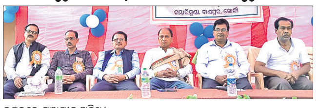
ଉତ୍ସବରେ ମହାସଭା ଅତିଥି।