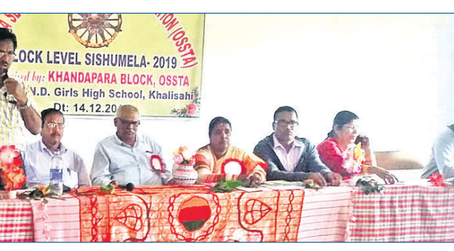
ଉତ୍ସବରେ ଯୋଗଦେଇଥିବା ଅତିଥିମାନେ ।