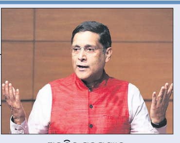
ଅଧିକ ପ୍ରତ୍ୟକ୍ଷ ଭାବରେ ସତର୍କ କରାଇଛନ୍ତି ସିଇଏ ଆଇସିଆର୍କୁ ଯାଉଛି ଅର୍ଥ ବ୍ୟବସ୍ଥା

ଭାରତ ଏବେ ମାନ୍ୟତା ସହ ଯୁକ୍ତମୁଖ୍ୟ ବେଳେ ଦେଶର ଅର୍ଥ ବ୍ୟବସ୍ଥାକୁ ନେଇ ପୂର୍ବତନ ମୁଖ୍ୟ ଅର୍ଥନୈତିକ ପରାମର୍ଶଦାତା (ସିଇଏ) ଅଧିକ ପ୍ରତ୍ୟକ୍ଷ ଭାବରେ ସତର୍କ କରାଇଛନ୍ତି। ବର୍ତ୍ତମାନ ମାନ୍ୟତା ଗ୍ରୋ ଫୋରୱାର୍ଡର ବା ବହୁତ ବଡ଼। ଭାରତୀୟ ଅର୍ଥନୀତି ଆଇସିଆର୍କୁ ଆଡ଼କୁ ବହୁତଦୂର ପ୍ରତ୍ୟାନ୍ତରଣ ହେଉଛି। ଦ୍ଵିତୀୟ ବାଲାଟ୍ ସିଟ୍ ଯୋଗୁ ଦେଶର ଅର୍ଥ ବ୍ୟବସ୍ଥା ପ୍ରଭାବିତ ହେଉଛି ବୋଲି ହାପ୍ପିଟି ଫିକ୍ସିଟିଭିଟିଠାରେ ଏକ ପେପର ପ୍ରେଜେନ୍ଟେସନ ଅବସରରେ ପ୍ରତ୍ୟକ୍ଷ ଭାବରେ କହିଛନ୍ତି।