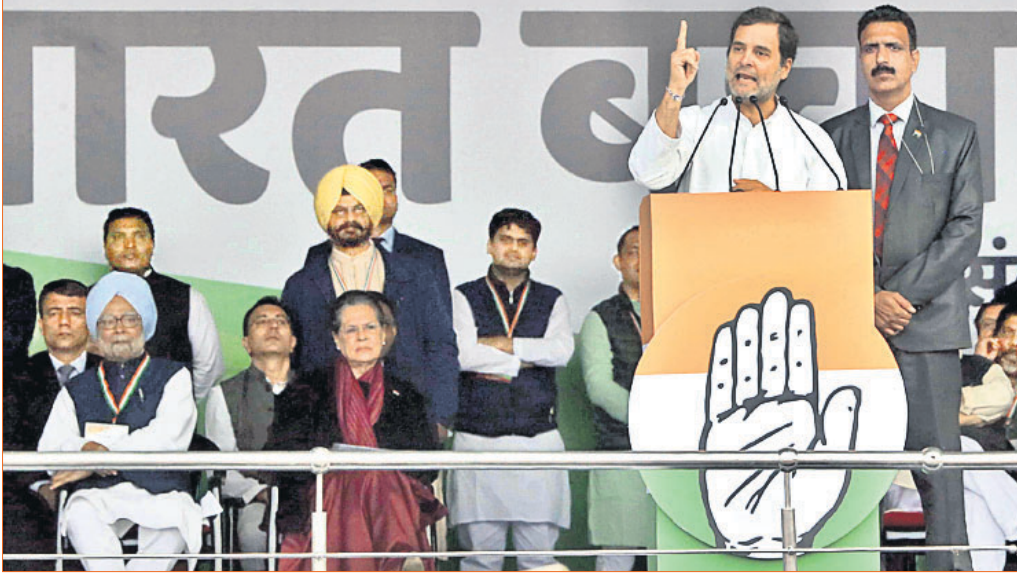
କଂଗ୍ରେସର ଭାରତ ବଚାଓ ରାଲିରେ ଦଳ ଅଧ୍ୟକ୍ଷା ସୋନିଆ ଗାନ୍ଧୀ, ପୂର୍ବତନ ପ୍ରଧାନମନ୍ତ୍ରୀ ମନମୋହନ ସିଂଘ ଓ ରାହୁଲ ଗାନ୍ଧୀ।

ସତ କହି ମରିବିବେ ପଛେ କ୍ଷମା ମାଗିବେ ନାହିଁ ବୋଲି କଂଗ୍ରେସ ନେତା ରାହୁଲ ଗାନ୍ଧୀ ଶନିବାର କହିଛନ୍ତି। ଦେଶର ଅର୍ଥନୀତିକୁ ଧ୍ବଂସ କରିଥିବା ପ୍ରଧାନମନ୍ତ୍ରୀ ନରେନ୍ଦ୍ର ମୋଦି ଓ ତାଙ୍କ ସହଯୋଗୀ ଅଧିକାରୀ ଶାନ୍ତ କ୍ଷମା ମାଗିବାକୁ ଦାବି କରିଛନ୍ତି। ରାମଲୀଳା ମଇଦାନରେ କଂଗ୍ରେସର ବିଶାଳ 'ଭାରତ ବଚାଓ ରାଲି'ରେ ଉଦ୍‌ବୋଧନ ଦେଇ କଂଗ୍ରେସ ନେତା ଭାଇପା ଉପରେ କୋର୍ଟଦ୍ୱାରା ବର୍ଷିଥିଲେ। 'ରେସ୍ ଇନ୍ ଇଣ୍ଡିଆ' ମନ୍ତବ୍ୟ ପାଇଁ ରାହୁଲ କ୍ଷମା ମାଗିବୁ ବୋଲି ଶୁକ୍ରବାର ଲୋକ ସଭାରେ ଭାଇପା ଦାବି କରିଥିଲେ। ସେ ସଭାରେ କୁହୁଥିବା କୌଣସି କଂଗ୍ରେସ ନେତା କ୍ଷମା ମାଗିବା ଆବଶ୍ୟକ ନାହିଁ ବୋଲି ରାହୁଲ ଦୃଢ଼ଭାବେ କହିଛନ୍ତି। ଅର୍ଥନୀତି ହେଉଛି ଭାରତର ଶକ୍ତି। ଏହାକୁ ଧ୍ବଂସ କରିବାକୁ ଭାରତର ଶତ୍ରୁମାନେ ଚାହୁଁଥିଲେ। ତେବେ କୌଣସି ଶତ୍ରୁ ନୁହେଁ, ପ୍ରଧାନମନ୍ତ୍ରୀ ନରେନ୍ଦ୍ର ମୋଦି ଏକାକୀ ଅର୍ଥନୀତିକୁ ଧ୍ବଂସ କରିଛନ୍ତି। ତଥାପି ସେ ନିଜକୁ ଦେଶଭକ୍ତ କହୁଛନ୍ତି। କୌଣସି ପ୍ରକାରେ କ୍ଷମା ମାଗିବେ ବୋଲି କଂଗ୍ରେସର ଏକମାତ୍ର ଉଦ୍ଦେଶ୍ୟ ବୋଲି ରାହୁଲ ସମାଲୋଚନା କରିଛନ୍ତି। ଉତ୍ତରପୂର୍ବୀୟ କଳିଙ୍ଗ, ଏଥିପାଇଁ ଭାଇପା ଓ ପ୍ରଧାନମନ୍ତ୍ରୀ ମୋଦି ଦାୟୀ। ଭାଇପା ସରକାର ଦେଶରେ ଭୟର ବାତାବରଣ ସୃଷ୍ଟି କରୁଛି। ଲୋକଙ୍କ ସ୍ୱରକୁ ଚାପିଦେବାକୁ ଉଦ୍ୟମ ହେଉଛି। ଦେଶକୁ ଦୁର୍ବଳ କରିଦେବାକୁ ପ୍ରଧାନମନ୍ତ୍ରୀ ଯୋଜନା କରୁଛନ୍ତି। ତେବେ କଂଗ୍ରେସ ନେତା ଓ କର୍ମୀମାନେ ଭୟଭୀତ ନ ହେବାକୁ ସେ ପରାମର୍ଶ ଦେଇଛନ୍ତି। କଂଗ୍ରେସ ଦଳ