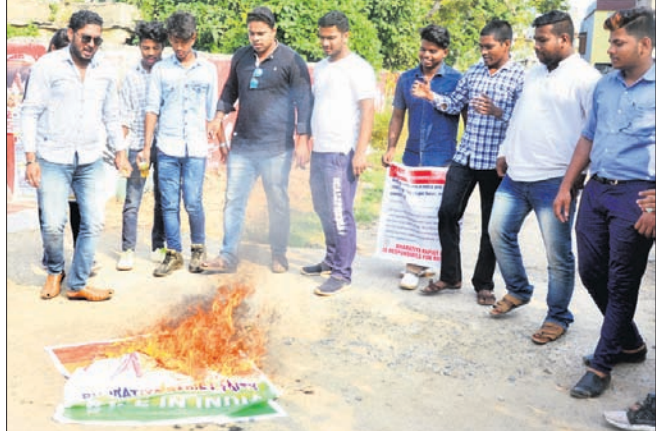
ପ୍ରଧାନମନ୍ତ୍ରୀ ଓ ସ୍ୱରାଷ୍ଟ୍ରମନ୍ତ୍ରୀଙ୍କ ଫଟୋଚିତ୍ର ପୋଡ଼ୁଛନ୍ତି ମୁକ୍ତ ଓ ଛାତ୍ର କଂଗ୍ରେସ କର୍ମକର୍ତ୍ତା।

କଂଗ୍ରେସ ନେତା ରାହୁଲ ଗାନ୍ଧୀଙ୍କ ରେପ୍ ଇଞ୍ଜିଆ ମତବ୍ୟକୁ ନେଇ ଭାବପା ପକ୍ଷରୁ ଯେଉଁ ଆଭିଯୁକ୍ତି ରହିଛି ତାହାକୁ ବିରୋଧ କରି ଏହି ଫଟୋଚିତ୍ର ପୋଡ଼ାଯାଇଛି। ମୁକ୍ତ ଓ ଛାତ୍ର କଂଗ୍ରେସ