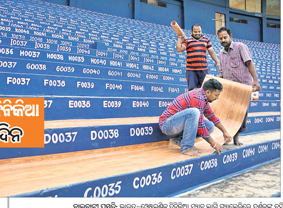
ବାରବାଟୀ ପ୍ରସ୍ତୁତି: ଭାରତ-ଫ୍ରେଣ୍ଡ୍‌ସ୍ ଷ୍ଟାଡ଼ିୟମ୍ ଦିନିକିଆ ମ୍ୟାଚ୍ ଲାଗି ଗ୍ୟାଲେରିରେ ଦର୍ଶକଙ୍କ ବସିବା ପାଇଁ ମ୍ୟାଚ୍ ବିଛାଗାଳିଛି। ସୁରକ୍ଷା ପାଇଁ ଗ୍ୟାଲେରି ସମ୍ମୁଖରେ ନେଟ୍ ବନ୍ଧାଯାଇଛି।

କଟକ ଅପ୍ରିଲ, ୧୪।୧୨: ଆଗାମୀ ଭାରତ-ଫ୍ରେଣ୍ଡ୍‌ସ୍ ଷ୍ଟାଡ଼ିୟମ୍ ଏକଦିବସୀୟ ଅନ୍ତର୍ଜାତୀୟ ମ୍ୟାଚ୍ ଲାଗି ଦର୍ଶକମାନଙ୍କ ନିମନ୍ତେ ଓଡ଼ିଶା କ୍ରିକେଟ୍ ଆସୋସିଏସନ୍ (ଓସିଏ) ବିଶେଷ ସୁବିଧା ସୁଯୋଗ ପ୍ରଦାନ କରିଛି। ଏହି ମ୍ୟାଚ୍ ଲାଗି ଗ୍ୟାଲେରିରେ କାର୍ପେଟ୍ ବିଛାଯାଇଛି। ସିମେଣ୍ଟ ପାହାଚ ସମ୍ମୁଖ ଗ୍ୟାଲେରି ଚୁକ୍ତିକରେ ଦର୍ଶକମାନେ ଦୀର୍ଘ ସମୟ ଧରି ବସିବା ପୁସ୍ତିକ। ଏହାକୁ ଲକ୍ଷ୍ୟ ରଖି ସିମେଣ୍ଟ ପାହାଚରୁ ଚୁକ୍ତିକ ଉପରେ ଶନିବାରଠାରୁ କାର୍ପେଟ୍ ବିଛାଯାଇଥିବା ଦେଖିବାକୁ ମିଳିଛି। ଡିସେମ୍ବର ୨୨ରେ ଭାରତ ଓ ଫ୍ରେଣ୍ଡ୍‌ସ୍ ଷ୍ଟାଡ଼ିୟମ୍ ମଧ୍ୟରେ ଖେଳାଯିବାକୁ ଥିବା ମ୍ୟାଚ୍ ନିମନ୍ତେ ଆସିଥିବା ବିସିଆଲ୍ ପାଖରୁ ଏହା ଖର୍ଚ୍ଚ କରାଯାଇଥିବା ଓସିଏର ଜଣେ ବରିଷ୍ଠ ଅଧିକାରୀ କହିଛନ୍ତି।