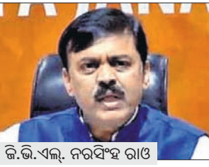
ଜି.ଭି.ଏଲ୍. ନରସିଂହ ରାଓ ପାତ୍ର କହିଛନ୍ତି। ଏପରିକି ମହାରାଷ୍ଟ୍ର ସରକାରରେ କଂଗ୍ରେସର ସହଯୋଗୀ ଥିବା ଶିବସେନା ମଧ୍ୟ ରାହୁଲଙ୍କ ଏଭଳି ନରସିଂହ ରାଓ କହିଛନ୍ତି। ସଭାରେ କଂଗ୍ରେସର ପ୍ରତିକ୍ରିୟା ପ୍ରକାଶ କରିଛନ୍ତି। ପ୍ରଧାନମନ୍ତ୍ରୀ ମୁଖ୍ୟମନ୍ତ୍ରୀଙ୍କୁ ନିଜର ନିଜର କଂଗ୍ରେସ ନେତାଙ୍କ ନାଁ ରାହୁଲ ଜିନ୍ଦା ଅଧିକ ଯୁକ୍ତିଯୁକ୍ତ ହେବ ବୋଲି ଭାଇପା ପୁଖପାତ୍ର ଜି.ଭି.ଏଲ୍. ନରସିଂହ ରାଓ କହିଛନ୍ତି।

ଭାରତ ବଚାଓ ରାଲିରେ କଂଗ୍ରେସ ନେତା ରାହୁଲ ଗାନ୍ଧୀ ନିଜକୁ ସଭାରେ ନୁହେଁ, ଗାନ୍ଧୀ ବୋଲି କହିଥିବାକୁ ଏହାକୁ ନେଇ ଭାଇପା ଓ ଶିବସେନା ତୀବ୍ର ପ୍ରତିକ୍ରିୟା ପ୍ରକାଶ କରିଛନ୍ତି। ପ୍ରଧାନମନ୍ତ୍ରୀ ମୁଖ୍ୟମନ୍ତ୍ରୀଙ୍କୁ ନିଜର ନିଜର କଂଗ୍ରେସ ନେତାଙ୍କ ନାଁ ରାହୁଲ ଜିନ୍ଦା ଅଧିକ ଯୁକ୍ତିଯୁକ୍ତ ହେବ ବୋଲି ଭାଇପା ପୁଖପାତ୍ର ଜି.ଭି.ଏଲ୍. ନରସିଂହ ରାଓ କହିଛନ୍ତି। ସଭାରେ କଂଗ୍ରେସର ପ୍ରତିକ୍ରିୟା ପ୍ରକାଶ କରିଛନ୍ତି। ପ୍ରଧାନମନ୍ତ୍ରୀ ମୁଖ୍ୟମନ୍ତ୍ରୀଙ୍କୁ ନିଜର ନିଜର କଂଗ୍ରେସ ନେତାଙ୍କ ନାଁ ରାହୁଲ ଜିନ୍ଦା ଅଧିକ ଯୁକ୍ତିଯୁକ୍ତ ହେବ ବୋଲି ଭାଇପା ପୁଖପାତ୍ର ଜି.ଭି.ଏଲ୍. ନରସିଂହ ରାଓ କହିଛନ୍ତି। ସଭାରେ କଂଗ୍ରେସର ପ୍ରତିକ୍ରିୟା ପ୍ରକାଶ କରିଛନ୍ତି। ପ୍ରଧାନମନ୍ତ୍ରୀ ମୁଖ୍ୟମନ୍ତ୍ରୀଙ୍କୁ ନିଜର ନିଜର କଂଗ୍ରେସ ନେତାଙ୍କ ନାଁ ରାହୁଲ ଜିନ୍ଦା ଅଧିକ ଯୁକ୍ତିଯୁକ୍ତ ହେବ ବୋଲି ଭାଇପା ପୁଖପାତ୍ର ଜି.ଭି.ଏଲ୍. ନରସିଂହ ରାଓ କହିଛନ୍ତି।