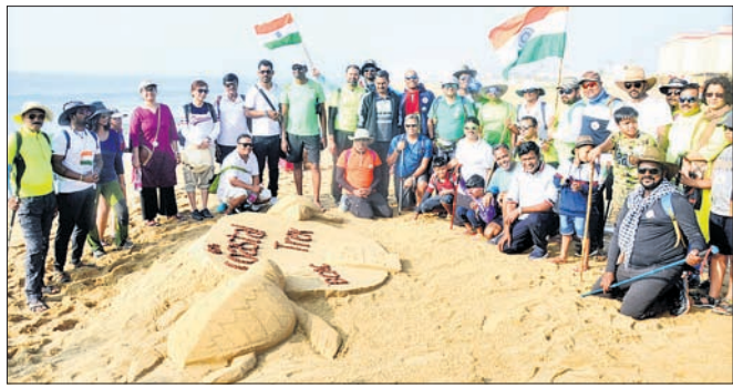
ଅନ୍ତର୍ଜାତୀୟ ବାଲୁକା ଶିଳ୍ପୀ ପଦ୍ମଶ୍ରୀ ସୁଦର୍ଶନ ପଟ୍ଟନାୟକଙ୍କ ବାଲୁକା କଳାକୁ ଦେଖିଛନ୍ତି ସଚେତନତା ପଦଯାତ୍ରାରେ ସାମିଲ ଲୋକେ।

ଅଲିଭ୍ ରିଡ୍ଲେ କଳିଙ୍ଗ ସୁରକ୍ଷା ଏବଂ ଆଗାମୀ ପିଚିକ୍ ପ୍ରକୃତି ସହ ଯୋଡ଼ିବାର ବାର୍ତ୍ତା ନେଇ ଭୁବନେଶ୍ୱର ସାଲକି ଆଣ୍ଡ ଆଡଭୋକେଟ କ୍ଲବ (ବିଏଏସ) ଏବଂ ବେୟାରପୁଟ ପକ୍ଷରୁ ଶନିବାର ଅନୁଷ୍ଠିତ ହୋଇଛି ପୁରୀ-ଚିଲିକା କୋଷ୍ଠାଳ ଟ୍ରେକିଂ।