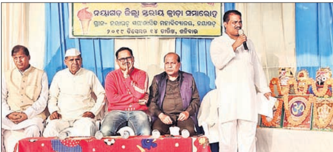
ସମାରୋହରେ ଯୋଗଦେଇଥିବା ଅତିଥିମାନେ।