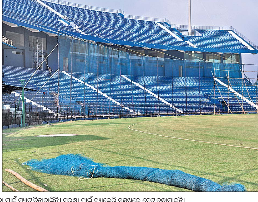
ବାରବାଟୀ ପ୍ରସ୍ତୁତି: ଭାରତ-ଫ୍ରେଣ୍ଡ୍‌ସ୍ ଷ୍ଟାଡ଼ିୟମ୍ ଦିନିକିଆ ମ୍ୟାଚ୍ ଲାଗି ଗ୍ୟାଲେରିରେ ଦର୍ଶକଙ୍କ ବସିବା ପାଇଁ ମ୍ୟାଚ୍ ବିଛାଗାଳିଛି। ସୁରକ୍ଷା ପାଇଁ ଗ୍ୟାଲେରି ସମ୍ମୁଖରେ ନେଟ୍ ବନ୍ଧାଯାଇଛି।