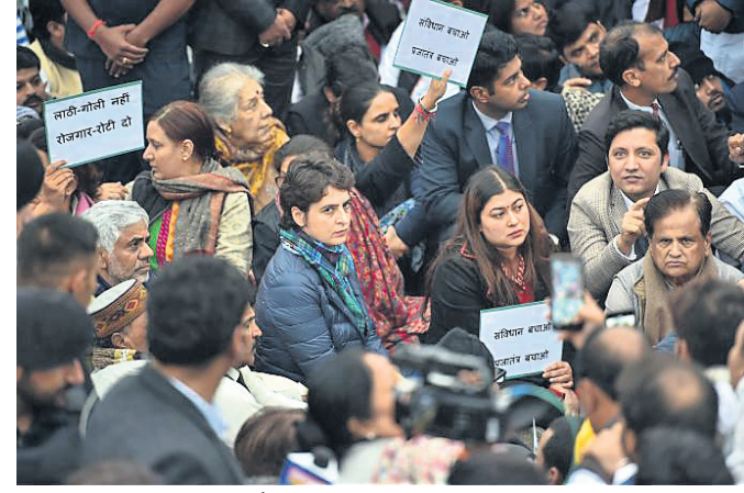
ଛାତ୍ରାଛାତ୍ରୀଙ୍କୁ ସମର୍ଥନ ଜଣାଇ ପ୍ରିୟଙ୍କା ଗାନ୍ଧୀ ଧାରଣାରେ ବସିଛନ୍ତି। ନୂଆଦିଲ୍ଲୀ/କୋଲକାତା, ୧୬.୧୨ (ପି.ଟି.)