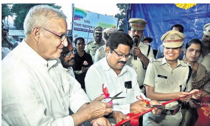
ବ୍ରହ୍ମପୁର ଏମ୍ପି ଏବଂ ପାରଳାଖେମୁଣ୍ଡି ବିଧାୟକ ଏସ୍ପିକ୍ ଉପସ୍ଥିତିରେ ହାପି ଫ୍ରିଜ୍ ଶୁଭାରମ୍ଭ କରୁଛନ୍ତି।

ଗଜପତି ଜିଲ୍ଲା ପୋଲିସ ପକ୍ଷରୁ ପାରଳାଖେମୁଣ୍ଡି ସ୍ଥିତ ଜିଲ୍ଲା ପୁଖ୍ୟ ଚିକିତ୍ସାଳୟ ସମ୍ମୁଖରେ ସୋମବାର ଏକ ଫ୍ରିଜ୍ ପ୍ରତିଷ୍ଠା କରାଯାଇଛି। ଏହାକୁ 'ହାପି ଫ୍ରିଜ୍' ନାମକରଣ କରାଯାଇଛି। ସାଧାରଣ ଲୋକଙ୍କ ଘରେ ଏବଂ ହୋଟେଲ୍ ବୁଡିକରେ ବେକା ଖାଦ୍ୟ ନ ଯୋଗାଡ଼ି ଏହି ଫ୍ରିଜ୍ରେ ରଖିବେ। ଯେହି ଖାଦ୍ୟ ଗରିବ ଲୋକଙ୍କ କାର୍ଯ୍ୟରେ ଲାଗିପାରିବ ବୋଲି କୁହାଯାଇଛି। ଅତିଥିଭାବେ ବ୍ରହ୍ମପୁର ଏମ୍ପି ଚନ୍ଦ୍ରଶେଖର ସାହୁ