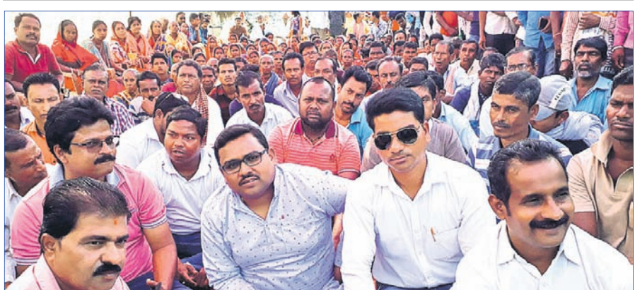
କାଳିନେଳା ବନ୍ଦ ପାଳନ ଅବସରରେ ସାମିଲ ହୋଇଥିବା ଲୋକ ପ୍ରତିନିଧି ଓ କର୍ମସାଧାରଣ ।

ଆପଣଙ୍କ ଫଟୋ ଏଠାରେ ସ୍ଥାନିତ ପାଇଁ ପଠାନ୍ତୁ plasticfreeodishadht@gmail.com