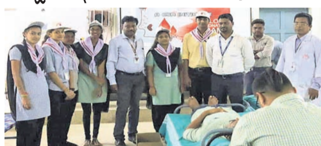
ଶିବିରରେ ଜଣେ ରତ୍ନଦାତା ରତ୍ନଦାନ କରୁଛନ୍ତି।