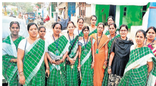
ସ୍ଵଚ୍ଛତା ସାଥୀ ଚିମ୍ ସଚେତନତା ଅଭିଯାନରେ ବାହାରିଛନ୍ତି।