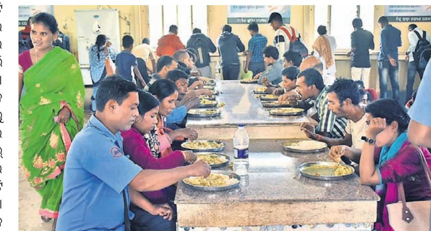
ବର୍ଷ ପ୍ଲାଷ୍ଟିକ ଦେଇ ଆହାର କେନ୍ଦ୍ରରେ ଲୋକମାନେ ଖାଦ୍ୟ ଗ୍ରହଣ କରୁଛନ୍ତି।