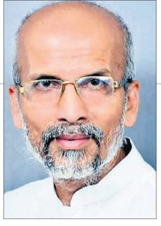
ପ୍ରତାପ ଚନ୍ଦ୍ର ଷଡ଼ଙ୍ଗୀ

ଚନ୍ଦ୍ର ଷଡ଼ଙ୍ଗୀ ତାଙ୍କ ନିକଟତମ ପ୍ରତିଦ୍ୱନ୍ଦ୍ୱୀଙ୍କୁ ୧୨୯୫୬ ଖଣ୍ଡ ଭୋଟରେ ହରାଇ ପ୍ରଥମଥର ଲୋକ ସଭାକୁ ନିର୍ବାଚିତ ହୋଇଥିଲେ। ପରେ ସେ କେନ୍ଦ୍ରରେ ସ୍ୱସ୍ଥ, ଲଘୁ ଓ ମଧ୍ୟ ଉଦ୍ୟୋଗ, ପ୍ରାଣୀ ସମ୍ପଦ, ସ୍ୱସ୍ଥ ଉଦ୍‌ୟାନ ଓ ମହ୍ୟପାଳନ ରାଷ୍ଟ୍ରମନ୍ତ୍ରୀ ପଦ ପାଇପାରିଛନ୍ତି। ନିର୍ବାଚନରେ ବିଜୟ ଓ ମନ୍ତ୍ରୀପଦ ତାଙ୍କୁ ଯେତିକି ଗୌରବ ଦେଇଥିଲା, ତା'ଠାରୁ ଅଧିକ ଚର୍ଚ୍ଚାକୁ ଆସିଥିଲା ତାଙ୍କ ସରଳ ଜୀବନଧାରା। ସେ ରହୁଥିବା ମାଟିକାଳ ତିଆରି ପୁରୁଣା ଘର ଓ ସରଳ ଚଳଣି ରାଜ୍ୟ ଓ ଜାତୀୟ ଗଣମାଧ୍ୟମରେ ପ୍ରଚାରିତ ହେବାରୁ ସେ ଆଲୋଚନାର କେନ୍ଦ୍ରବିନ୍ଦୁ ପାଲଟିଥିଲେ।