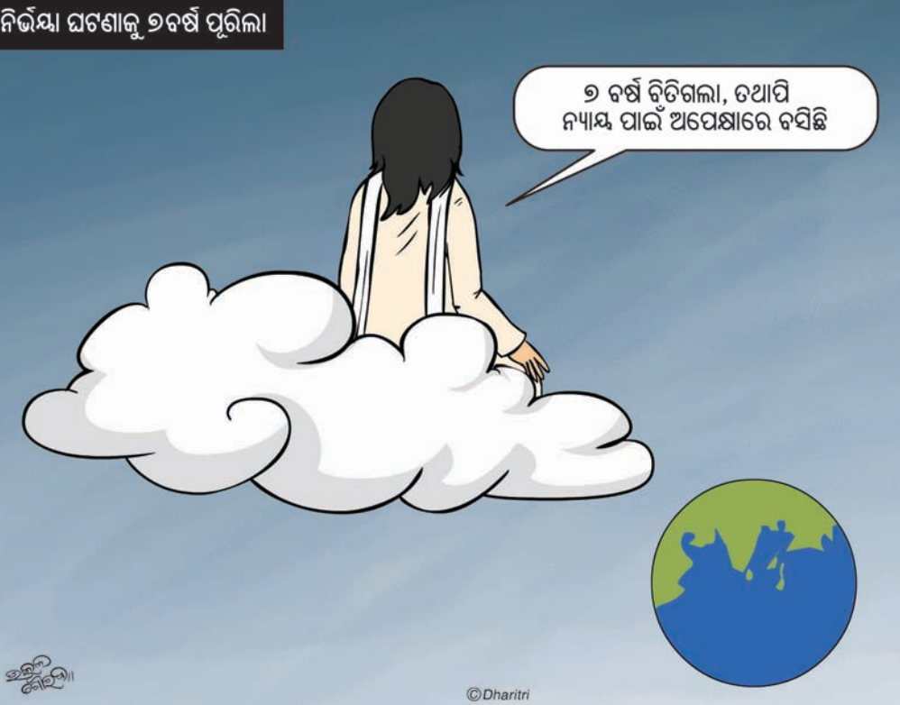
ନିର୍ଦ୍ଦିଷ୍ଟ ଯତ୍ନଶୀଳ ୭ ବର୍ଷ ପୂରିଲା

ବେଳେ ଟଙ୍କା ବଦଳାଇବା ପାଇଁ ଭୋଗିଥିବା ଯନ୍ତ୍ରଣାକୁ ଭୁଲିପାରି ନାହାନ୍ତି। ବର୍ତ୍ତମାନ ଦେଶର ଆର୍ଥିକ ପରିସ୍ଥିତି ଭଲ ନ ଥିବା ବେଳେ ଏଭଳି ବିଷୟ ଯେକେହି ଶୁଣିଲେ ଶଙ୍କା କାତ ହୋଇଯାଉଛି। କେତେକେ କହିଛନ୍ତି ଯେ, ୨୦୦୦ ଟଙ୍କା ନୋଟ୍ ନେଇ ଗୁଜବ ହେଉଥିଲେ ମଧ୍ୟ ଭିତରେ କିଛି କଠୋର ଆର୍ଥିକ ନିଷ୍ପତ୍ତି ନିଆଯାଇପାରେ। ନ ହେଲେ ବାରମ୍ବାର କାହିଁକି ଏପରି ଖବର ଶୁଣିବାକୁ ମିଳୁଛି।