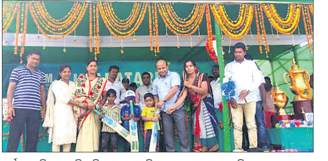
ଧର୍ମଶାଳା ବିଧାୟକ ଶିଶୁ କ୍ରିକେଟ ଖେଳାଳିଙ୍କୁ ବ୍ୟାଚ୍ ପ୍ରଦାନ କରୁଛନ୍ତି।

କଳ୍ପତରୁ ଦାସ ଦ୍ୟାଶନାଳ ଫାଉଣ୍ଡେସନ ପକ୍ଷରୁ ମଧୁପୁରଗଡ଼ ଖେଳ ପଡ଼ିଆରେ ଅନୁଷ୍ଠିତ ୫ମ କେଡିଏମ୍ କ୍ରିକେଟ ଟୁର୍ନାମେଣ୍ଟରେ ସୋମବାର ୨ଟି ମ୍ୟାଚ୍ ଅନୁଷ୍ଠିତ ହୋଇଥିଲା। ସେଥିରେ ଅଞ୍ଜିରା ଓ ରାଇଛନ୍ଦା ପଞ୍ଚାୟତ ଟିମ୍ ବିଜୟୀ ହୋଇ ସୁପର ଟେନ୍‌ରେ ପ୍ରବେଶ କରିଛନ୍ତି। ପ୍ରଥମ ମ୍ୟାଚରେ ସାହାଣ୍ଡାଦିହ ଟିମକୁ ୩୭ ରନରେ ପରାସ୍ତ କରି ଅଞ୍ଜିରା ବିଜୟୀ ହୋଇଛି। ଦ୍ୱିତୀୟ ମ୍ୟାଚରେ ଚାଳକଜ୍ଞ ଟିମକୁ ୯୯ ରନରେ ପରାସ୍ତ କରି ରାଇଛନ୍ଦା ବିଜୟୀ ହୋଇଛି। ପ୍ରଥମ ମ୍ୟାଚରେ ଅଞ୍ଜିରା ଦଳ ବ୍ୟାଟିଙ୍ଗ କରି ନିର୍ଦ୍ଧାରିତ ୧୫ ଓଭରରେ ୮୫ ଓଭରରେ ୬ ଓଭର ହରାଇ ୧୨.୫ ରନ ସଂଗ୍ରହ କରିଥିଲା। ଜବାବରେ ସାହାଣ୍ଡାଦିହ ଦଳ ବ୍ୟାଟିଙ୍ଗ କରି ୧୫ ଓଭରରେ ୯ ଓଭର ହରାଇ ୧୮୮ ରନ କରି ପରାସ୍ତ ହୋଇଥିଲା। ଦ୍ୱିତୀୟ