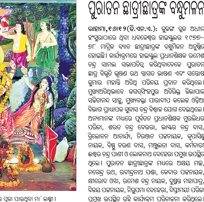
ରଘୁନାଥପୁର ବ୍ଲକ ରାଜ୍ୟର ନାରୀମଣି ମଞ୍ଚପରେ ପୂଜା ପାଉଥିବା ମା' ଲକ୍ଷ୍ମୀ।