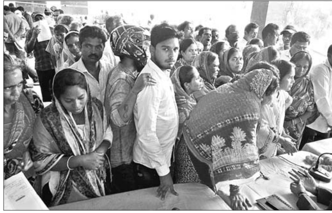
ବିଭିନ୍ନ ସ୍ଥାନରୁ ଆସିଥିବା ଲୋକେ ଅଭିଯୋଗ ଜଣାଉଛନ୍ତି।