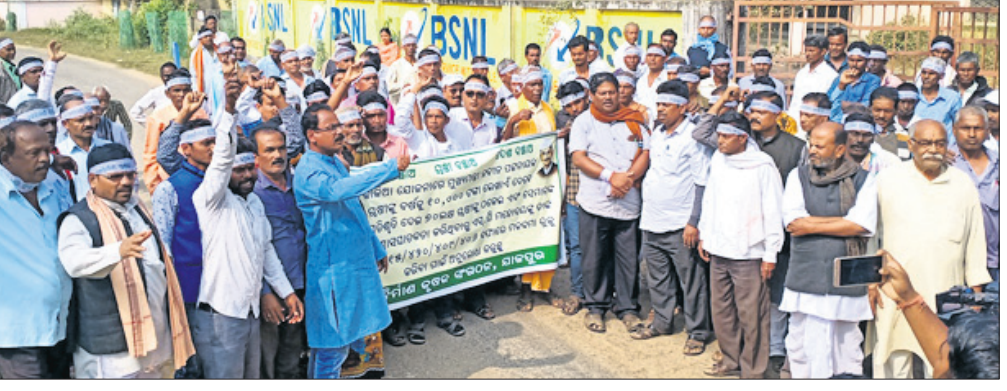
ଚାଷୀମାନେ ଏସ୍‌ପିଙ୍କ କାର୍ଯ୍ୟାଳୟ ସମ୍ମୁଖରେ ବିରୋଧ ପ୍ରଦର୍ଶନ କରୁଛନ୍ତି।