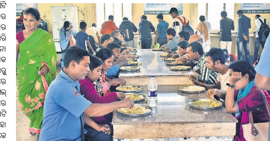
ବର୍ଷ ପ୍ଲାଷ୍ଟିକ ଦେଇ ଆହାର କେନ୍ଦ୍ରରେ ଲୋକମାନେ ଖାଦ୍ୟ ଗ୍ରହଣ କରୁଛନ୍ତି।

ଭୁବନେଶ୍ୱର, ୧୬.୧୨ (ବ୍ୟବହାର)- ସ୍ୱାର୍ଷତି ଭୁବନେଶ୍ୱରକୁ ଦେଶର ସ୍ୱଳ୍ପ ସର୍ବେକ୍ଷଣ ଚାଲିକାର ଶୀର୍ଷରେ ପହଞ୍ଚାଇବା ପାଇଁ ଭୁବନେଶ୍ୱର ମହାନଗର ନିଗମ (ବିଏମ୍‌ସି) ଉଦ୍ୟମ ଜାରି ରଖିଛି। ଭିତ୍ତିଭୂମିରେ ଅନେକ ବୃହତ୍ ଯୋଜନା ହାତକୁ ନିଆଯାଇଥିବାବେଳେ ଏବେ ଆରମ୍ଭକ ଅଭିନବ ପ୍ରୟାସ କରିଛି ବିଏମ୍‌ସି। ସୋମବାରଠାରୁ ବିଏମ୍‌ସି ଅଧୀନରେ ଥିବା ୧୧ ଆହାର କେନ୍ଦ୍ରରେ ଆରମ୍ଭ ହୋଇଛି ବର୍ଷ ପ୍ଲାଷ୍ଟିକ ବଦଳରେ ମିଲ୍ ବ୍ୟବସ୍ଥା। କଳ୍ପନା ଛକସ୍ଥିତ ଆହାର କେନ୍ଦ୍ରରେ ପ୍ରଥମେ ଜଣେ ସାଧାରଣ ନାଗରିକ ଫିଟାକାଟି ଯୋଜନାର ଶୁଭାରମ୍ଭ କରିଥିଲେ। ପରେ ଏହା ଅନ୍ୟସବୁଠି କାର୍ଯ୍ୟକାରୀ କରାଯାଇଥିଲା। ଲୋକେ ଅଧିକେଇ ପ୍ଲାଷ୍ଟିକ ବର୍ଷ ଦେଇ ଗୋଟିଏ 'ଆହାର' ମିଲ୍ ଖାଇଥିଲେ।