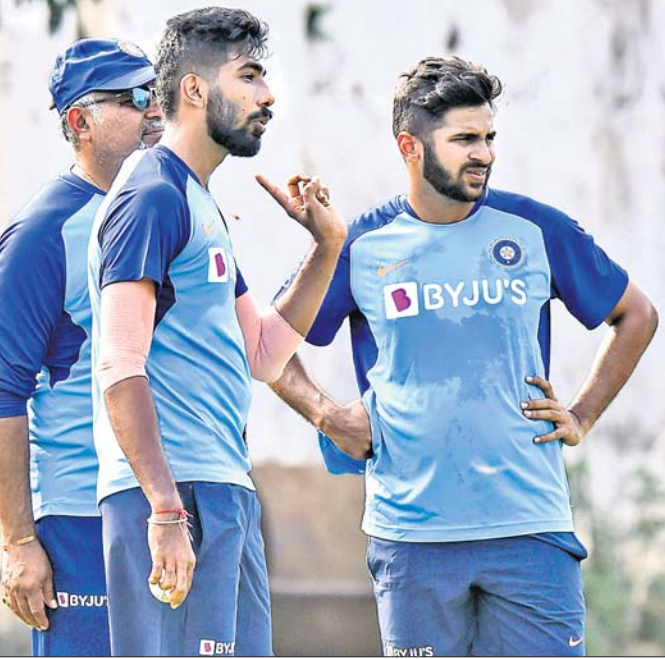
ନେତୃତ୍ୱରେ ଯଶପ୍ରୀତ୍ ବୁମ୍ରା ଓ ଶାର୍ଦ୍ଦୂଳ ଠାକୁର ।

ଭାରତ ଓ ଭ୍ରମଣକାରୀ ଫ୍ରେଣ୍ଡ୍‌ସ୍ ଓପନର ମଧ୍ୟରେ ଚାଲିଥିବା ଦିନିକିଆ ସିରିଜର ୨ୟ ମ୍ୟାଚ୍ ବୁଧବାର ସ୍ଥାନୀୟ ଡ. ଡାକ୍ତର.ଏସ୍. ରାଜଶେଖର ରେଡ୍ଡୀ କ୍ରିକେଟ୍ କ୍ଲବ୍‌ରେ ଅନୁଷ୍ଠିତ ହେବ । ଡେଇଁବାରେ ଖେଳାଯାଉଥିବା ସିରିଜର ପ୍ରଥମ ମ୍ୟାଚ୍‌ରେ ଭାରତ ପକ୍ଷରୁ ଧାର୍ଯ୍ୟ ୨୮୮ ରନର ବଡ଼ ଟାର୍ଗେଟ୍‌କୁ ଫ୍ରେଣ୍ଡ୍‌ସ୍ ଓପନର ୨ ରନରେ ହରାଇ ଅତି ସହଜରେ ହାସଲ କରିନେଇଥିଲା । ଫ୍ରେଣ୍ଡ୍‌ସ୍ ଓପନର ବ୍ୟାଟ୍ସମ୍ୟାନଙ୍କୁ ଏହି ବଡ଼ ଟାର୍ଗେଟ୍ ପଛ କରିବାରେ ରୋକିପାରି ନ ଥିବା ଭାରତୀୟ ଦଳ ସିରିଜକୁ ପ୍ରତ୍ୟାବର୍ତ୍ତନ କରିବାକୁ ହେଲେ ଦ୍ୱିତୀୟ ମ୍ୟାଚ୍‌ରେ ବୋଲିଂ ଉପରେ ବିଶେଷ ଗୁରୁତ୍ୱ ଦେବ ବୋଲି ଆଶା କରାଯାଉଛି । ଏଥିସହ ୧-୦ରେ ପଛୁଆ ରହିଥିବା ବିରାଟ କୋହଲିଙ୍କ ଦଳ ଏଠାରେ ବିଜୟ ହାସଲ କରି ସିରିଜକୁ ଉଜ୍ଜୀବିତ ରଖିବାକୁ ଲକ୍ଷ୍ୟ ରଖିଛି । ଅପରପକ୍ଷରେ କିରନ ପୋଲାଟ୍‌ଙ୍କ ନେତୃତ୍ୱାଧୀନ ଫ୍ରେଣ୍ଡ୍‌ସ୍ ଓପନର ମ୍ୟାଚ୍ ଭଳି ଏଠାରେ ମଧ୍ୟ ପ୍ରଭାବୀ ପ୍ରଦର୍ଶନ କରି ସିରିଜକୁ ଆଗୁଆ ହାତେଇବା ଲକ୍ଷ୍ୟରେ ରହିଛି । ପ୍ରଥମ ମ୍ୟାଚ୍‌ରେ ଶାଇ ହୋପ୍ ଓ ସିମରନ ହେଟ୍‌ମେନଙ୍କ ଶତକ ବଳରେ ଫ୍ରେଣ୍ଡ୍‌ସ୍ ଓପନର ୮ ରନରେ ଭାରତକୁ ପରାସ୍ତ କରିଥିଲା । ଭାରତ ବଡ଼ ଷ୍ଟୋର ହାସଲ କରିଥିଲେ ମଧ୍ୟ ଫ୍ରେଣ୍ଡ୍‌ସ୍ ଓପନର ବ୍ୟାଟ୍ସମ୍ୟାନଙ୍କୁ ରୋକିବାରେ ବିଫଳ ହୋଇ ଥିବାରୁ ଅଧିକାଂଶ କୋହଲି