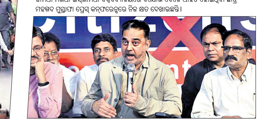
ଚେନ୍ନାଇ: ମୂଲ ନିୟୁ ମୈୟମ୍ ପ୍ରତିଷ୍ଠାତା ତଥା ଅଭିନେତା କମଳ ହାସନ ସିଏଏ ଏବଂ ଏନ୍ଆର୍ସି ବିରୋଧରେ ଖବରଦାତା ସମ୍ମିଳନୀକୁ ସମ୍ବୋଧନ କରୁଛନ୍ତି।