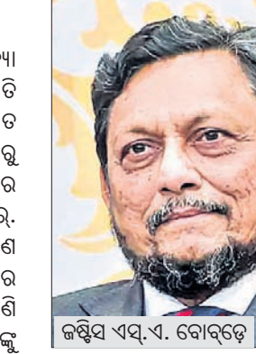
ଜଷ୍ଟିସ୍ ଏସ୍.ଏ. ବୋଷ୍ଟେ