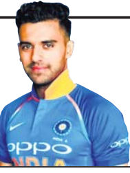
-ଦୀପକ ଚହର, ଭାରତୀୟ କ୍ରିକେଟର

ଆଇପିଏଲ୍‌ରେ ପ୍ରଭାବୀ ପ୍ରଦର୍ଶନ କରିପାରିଲେ ଜଣେ ଖେଳାଳି ସହଜରେ ଜାତୀୟ ଦଳରେ ନିଜ ସ୍ଥାନ ପକ୍ଷା କରିପାରିବ ।