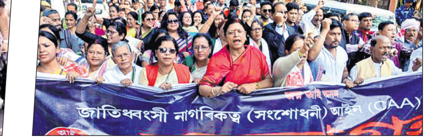
ପୁଣାହାଟୀ: ଅଲ୍ ଆସାମ ଷ୍ଟୁଡେଣ୍ଟସ୍ ୟୁନିୟନ୍ (ଏଏଏସ୍ୟୁ) ଏବଂ ଅନ୍ୟ ସଙ୍ଗଠନଗୁଡ଼ିକର ସଦସ୍ୟମାନେ ସିଏଏ ପ୍ରତ୍ୟାହାର ଦାବିରେ ସତ୍ୟାଗ୍ରହ କରୁଛନ୍ତି।