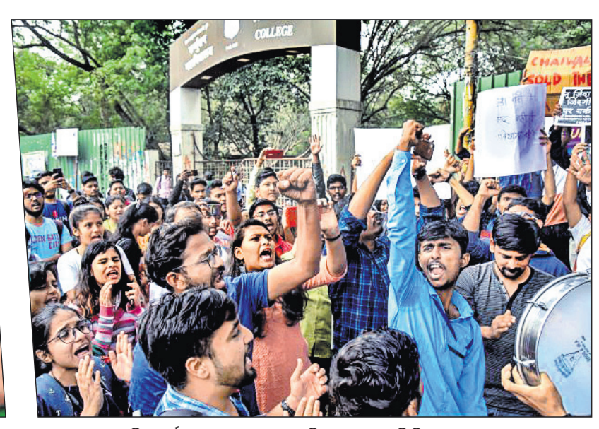
ବେଙ୍ଗାଳୁରୁ: ସିଏଏ ବିରୋଧୀ ଆନ୍ଦୋଳନ ବେଳେ ପୋଲିସର ନିର୍ଯାତନାକୁ ବିରୋଧ କରି ବିଶୋଭ କରୁଛନ୍ତି ଛାତ୍ରଛାତ୍ରୀ।