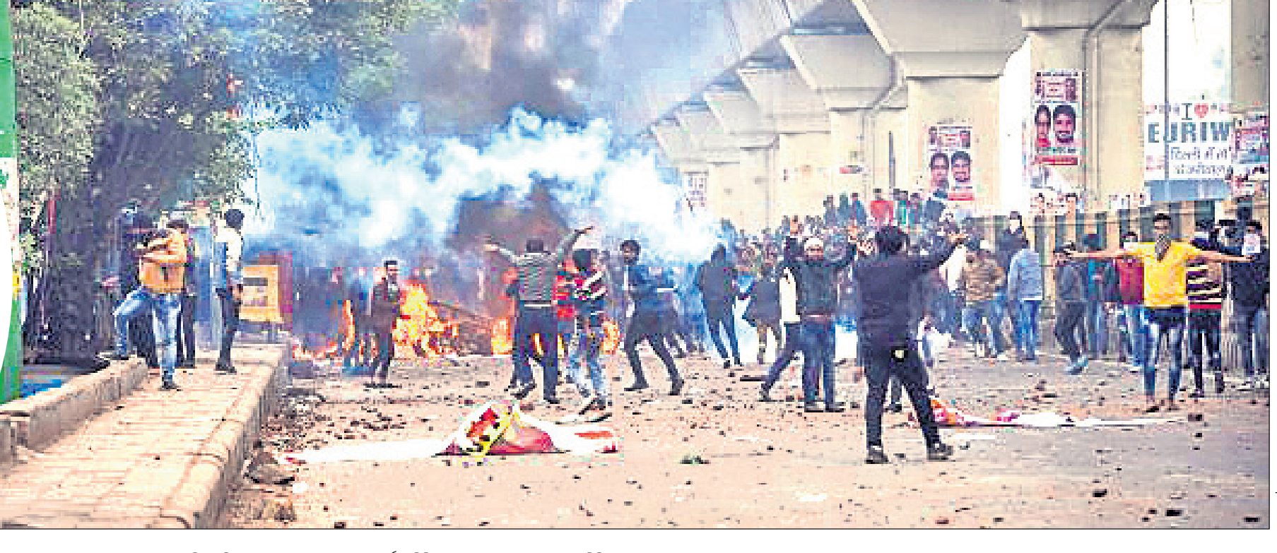
ନୂଆଦିଲ୍ଲୀ: ସିଲ୍ଲୀମପୁରରେ ଆନ୍ଦୋଳନ ବେଳେ ପୋଲିସ-ବିଶୋଭକାରୀଙ୍କ ମଧ୍ୟରେ ସଂଘର୍ଷ ଘଟିଛି। ରାସ୍ତାରେ ଇଟା ଓ ବ୍ୟାସ୍ ପଡ଼ିଛି।

କେନ୍ଦ୍ର ସରକାରଙ୍କ ନବପ୍ରଣୀତ ନାଗରିକତ୍ୱ ସଂଶୋଧନ ଆଇନ (ସିଏଏ)କୁ ବିରୋଧ କରି ଉତ୍ତର-ପୂର୍ବାଞ୍ଚଳରେ ଆରମ୍ଭ ହୋଇଥିବା ବିଶୋଭ ଉଗ୍ରରୂପ ଧାରଣ କରିଛି। ସିଏଏ ପ୍ରତ୍ୟାହାର ଦାବିରେ ବିଶୋଭ ପଶ୍ଚିମବଙ୍ଗ ଓ ଦିଲ୍ଲୀକୁ ବ୍ୟାପିବା ପରେ ଅନେକ ସ୍ଥାନରେ ଭଙ୍ଗାଗୁଜା ଓ ପୋଡ଼ାଜଳା ସହ ବହୁ ଲୋକଙ୍କ ଜୀବନ ମଧ୍ୟ ଗଲାଣି। ଦିଲ୍ଲୀର ଜାମିଆ ମିଲିଆ ଇସଲାମିଆ ବିଶ୍ୱବିଦ୍ୟାଳୟ ଛାତ୍ରଛାତ୍ରୀ ବିଶୋଭ କରୁଥିବାବେଳେ ପୋଲିସ ସେମାନଙ୍କ ଉପରେ ବଳ ପ୍ରୟୋଗ କରିଛି। ପୋଲିସର ଦମନଲାଳା ପରେ ବିଶୋଭର ନିଆଁ ସାରା ଦେଶକୁ ମାଡ଼ିଚାଲିଛି। ଆନ୍ଦୋଳନରତ ଛାତ୍ରଙ୍କୁ ସମର୍ଥନ କରି ଦେଶର ଅନେକ ବିଶ୍ୱବିଦ୍ୟାଳୟ ଛାତ୍ର ସଙ୍ଗଠନ ରାସ୍ତାକୁ ଓହ୍ଲାଇଛନ୍ତି। ଇତିମଧ୍ୟରେ ହାସ୍ପାଟ, ଷ୍ଟାନ୍ଫୋର୍ଡ, ଯେଲ୍ ଓ କଲମ୍ବିଆ ଭଳି ବିଦେଶୀ ସୁନିଉର୍ସିଟି ଛାତ୍ରଛାତ୍ରୀ ମଧ୍ୟ ଭାରତ ସରକାରଙ୍କ ଏହି ଆଇନ ଏବଂ ପୋଲିସ ବର୍ବରତାକୁ କଡ଼ା ନିନ୍ଦା କରିଛନ୍ତି। ଦେଶର ଇତିହାସରେ ଏଭଳି ଆନ୍ଦୋଳନ ଅତ୍ୟୁତପୂର୍ବ ବୋଲି କୁହାଯାଉଛି।