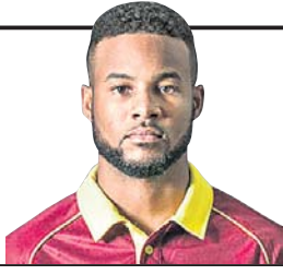
-ଶାଇ ହୋପ୍, ଫ୍ରେଣ୍ଡ୍‌ସ୍ ଓପନର

କୋହଲି ଓ ରୋହିତଙ୍କୁ ପଛରେ ପକାଇ ଚଳିତ ବର୍ଷ ଦିନିକିଆ କ୍ରିକେଟରେ କିପରି ସର୍ବାଧିକ ରନ ହାସଲକାରୀ ବ୍ୟାଟ୍ସମ୍ୟାନ ବିବେଚିତ ହେବ ତା ଉପରେ ମୋର ଲକ୍ଷ୍ୟ ରହିଛି ।