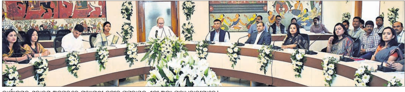
କାର୍ଯ୍ୟକ୍ରମର ଶୁଭାରମ୍ଭ ଅବସରରେ ମୁଖ୍ୟମନ୍ତ୍ରୀ ନବୀନ ପଟ୍ଟନାୟକ ଏବଂ ଅନ୍ୟ ପଦାଧିକାରୀମାନେ।

ମହିଳା, ଶିଶୁ ବିଭାଗ ଓ ମିଶନ ଶକ୍ତି ବିଭାଗ ମଙ୍ଗଳବାର ମୋ ସରକାର କାର୍ଯ୍ୟକ୍ରମରେ ସାମିଲ ହୋଇଛି। ଏ ବିଭାଗ ଦ୍ୱାରା କାର୍ଯ୍ୟକାରୀ ହେଉଥିବା ବିଭିନ୍ନ ଯୋଜନାର ହିତାଧିକାରୀମାନଙ୍କ ସହିତ ସାମାଜିକ ସରକାର କଥା ହେବେ। ଭୁବନେଶ୍ୱର ଲୋକ ସେବା ଭବନରୁ ଭିଡ଼ିଓ କନଫରେନ୍ସ ଜରିଆରେ ମୁଖ୍ୟମନ୍ତ୍ରୀ ନବୀନ ପଟ୍ଟନାୟକ ଏହି କାର୍ଯ୍ୟକ୍ରମର ଶୁଭାରମ୍ଭ କରିଛନ୍ତି। ଏହି ଅବସରରେ ମୁଖ୍ୟମନ୍ତ୍ରୀ କହିଛନ୍ତି, ମହିଳା, ଶିଶୁ ବିଭାଗ ଓ ମିଶନ ଶକ୍ତି ବିଭାଗ ଅଧୀନରେ ମା’ ଓ ଶିଶୁମାନଙ୍କ ପାଇଁ ଅନେକ ଚୁରୁଚୁରୁ କଲ୍ୟାଣ କାର୍ଯ୍ୟକ୍ରମ କାର୍ଯ୍ୟକାରୀ କରାଯାଉଛି। ଏହିସବୁ କାର୍ଯ୍ୟକ୍ରମର ସୁଫଳ ହିତାଧିକାରୀଙ୍କ ପାଖରେ ଠିକ୍‌ଭାବେ ପହଞ୍ଚାଇବା ସବୁଠାରୁ ଗୁରୁତ୍ୱପୂର୍ଣ୍ଣ। ଶିଶୁମାନଙ୍କ ପୁଷ୍ଟି କାର୍ଯ୍ୟକ୍ରମ ସହିତ ମାତୃ ମୃତ୍ୟୁହାର ଓ ଶିଶୁ ମୃତ୍ୟୁ ହାର ହ୍ରାସ ଦିବାରେ ମହିଳା, ଶିଶୁ ବିଭାଗ ଓ ମିଶନ ଶକ୍ତି ବିଭାଗ କର୍ମଚାରୀମାନଙ୍କ ଗୁରୁତ୍ୱପୂର୍ଣ୍ଣ ଭୂମିକା ରହିଛି। ସେମାନଙ୍କ ନିଷ୍ଠାପୂର୍ଣ୍ଣ ଉଦ୍ୟମ ଦ୍ୱାରା ମନାତା କାର୍ଯ୍ୟକ୍ରମ ସାରା ଦେଶରେ ଏକ ମତେଇ