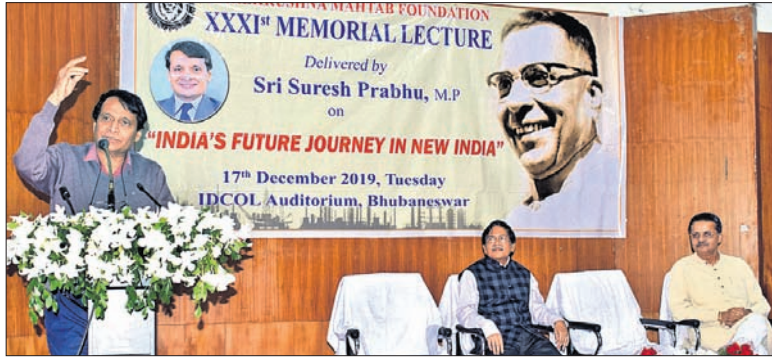
କାର୍ଯ୍ୟକ୍ରମରେ କେନ୍ଦ୍ର ମନ୍ତ୍ରୀ ସୁରେଶ ପ୍ରଭୁ ଉଦ୍‌ବୋଧନ ଦେଉଛନ୍ତି।

ପରିବର୍ତ୍ତନ, ଭିତ୍ତିଭୂମି ଉପରେ ଦୃଷ୍ଟି ଦେବାକୁ ପଡ଼ିବ। ଆମ ପାଖରେ ପ୍ରାକୃତିକ ସମ୍ପଦ ସହିତ ମାନବ ସମ୍ପଦ ଅଧିକ ରହିଛି। ଏହି ଦୁଇଟିଯାକ ଯଦି ମିଶିଯାଏ ତେବେ ନୂତନ ଭାରତର ଲକ୍ଷ୍ୟ ସଫଳ ହୋଇପାରିବ। ପ୍ରତ୍ୟେକ ଜିଲ୍ଲାରେ ଭିତ୍ତିଭୂମିକୁ ବୃଦ୍ଧି କରିବାକୁ ହେବ। ଯଦି ଏହା ସମ୍ଭବ ହୋଇପାରିବ ତେବେ ଭାରତର ସର୍ବାଙ୍ଗୀନ ବୃଦ୍ଧି ସମ୍ଭବ ବୋଲି କେନ୍ଦ୍ରମନ୍ତ୍ରୀ କହିଛନ୍ତି। ଡ. ହରେକୃଷ୍ଣ ମହତାବଙ୍କ ସମ୍ପର୍କରେ ବକ୍ତବ୍ୟ ରଖି ସେ କହିଛନ୍ତି, ହରେକୃଷ୍ଣ ମହତାବ ଜଣେ ଦକ୍ଷ ରାଜନେତା ସହ ପ୍ରଭାବଶାଳୀ ବ୍ୟକ୍ତି ଥିଲେ। ସମାଜର ହିତ ପାଇଁ ସେ ନିଜକୁ ଉତ୍ସର୍ଗ କରିଥିଲେ। ଗରିବ