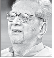
ଅଭିନେତା ଶ୍ରୀରାମ ଲାଗୁଙ୍କ ପରଲୋକ ଘଟଣାରେ ଶ୍ରଦ୍ଧାଞ୍ଜଳି ମରାଠୀ ରଞ୍ଜନଶିଳ୍ପ ଆରମ୍ଭ ନେବାରେ ଭେଦ କରାଯାଇଛି।

ନୂଆଦିଲ୍ଲୀ, ୧୭/୧୨ କଳିଭୈର ପ୍ରଖ୍ୟାତ ଅଭିନେତା ଶ୍ରୀରାମ ଲାଗୁଙ୍କ ମଙ୍ଗଳବାର ସନ୍ଧ୍ୟାରେ ପରଲୋକ ଘଟିଛି। ତାଙ୍କୁ ୯୨ ବର୍ଷ ହୋଇଥିଲା। ସେ ବାର୍ଦ୍ଧକ୍ୟଜନିତ ରୋଗରେ ପୀଡ଼ିତ ଥିଲେ। ପୁନେସ୍ଥିତ ଏକ ଘରୋଇ ହସ୍ପିଟାଲରେ ସେ ଶେଷନିଶ୍ୱାସ ସଂଗ୍ରାମ କରିଛନ୍ତି। ୧୦୦ରୁ ଊର୍ଦ୍ଧ୍ୱ ହିନ୍ଦୀ ଫିଲ୍ମ ଏବଂ ୪୦ରୁ ଊର୍ଦ୍ଧ୍ୱ ମରାଠି ଓ ଗୁଜରାଟୀ ଚଳଚ୍ଚିତ୍ରରେ ସେ ଅଭିନୟ କରିଛନ୍ତି। ୧୯୨୭ ନଭେମ୍ବର ୧୬ରେ ମହାରାଷ୍ଟ୍ରର ସତରାଜରେ ଜନ୍ମଗ୍ରହଣ କରିଥିବା ଏହି କିମ୍ବଦନ୍ତୀ ଅଭିନେତା ପରଲୋକ ଘଟଣାରେ ଶ୍ରଦ୍ଧାଞ୍ଜଳି ମରାଠୀ ରଞ୍ଜନଶିଳ୍ପ ଆରମ୍ଭ ନେବାରେ ଭେଦ କରାଯାଇଛି।