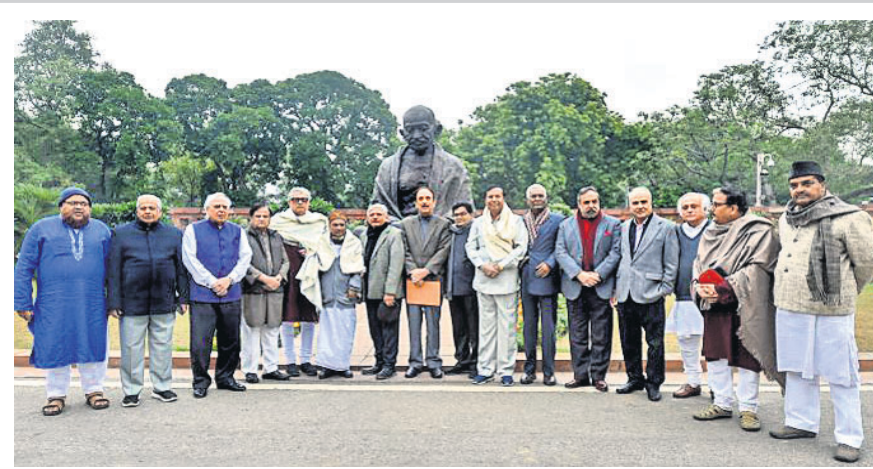
ବିଷୟ କଂଗ୍ରେସ ନେତା ବୁଲାନିଆ ଆଜାଦ, ଉପରାଜ୍ୟ ରମେଶ, କପିଳ ସିଂହ ଓ ଆନନ୍ଦ ଶର୍ମାଙ୍କ ସହ ଅନ୍ୟ ବିରୋଧୀ ଦଳ ନେତାମାନେ ରାଷ୍ଟ୍ରପତିଙ୍କୁ ଭେଟିବାକୁ ଯାଉଛନ୍ତି।

ରେଳପ୍ରେ ସମ୍ପର୍କ ନଷ୍ଟ ନିଷ୍ପତ୍ତି କଡ଼ା ମନ୍ତ୍ରୀ ସେ ଗୁରୁତ୍ୱ ଦେଇଛନ୍ତି। ରେଳପ୍ରେ ସମ୍ପର୍କ ନଷ୍ଟ ହେବାକୁ ଦିଆଯିବ ନାହିଁ ଓ ଆଇନ ଗୁଣ୍ଡାମୁଚ୍ଛିଦନ କଡ଼ା ଦଣ୍ଡ ମିଳିବ ବୋଲି ସେ ଚେତାଇ ଦେଇଛନ୍ତି।