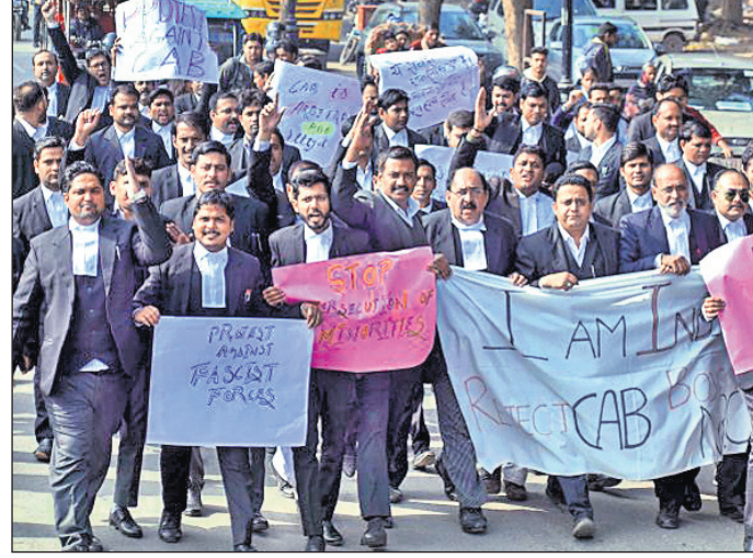
ସୁପିର ପ୍ରୟାଗରାଜରେ ଆଇନକାବାମାନେ ଏନ୍ଆର୍ସି ଏବଂ ସିଏଏ ବିରୋଧୀ ପ୍ଲାକାର୍ଡ ଧରି ସ୍ତୋତ୍ରାଂଗ ଦେଉଛନ୍ତି।