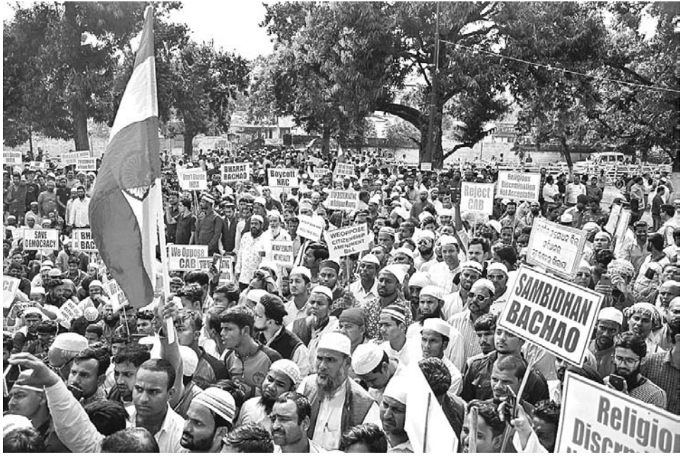
ଭୁବନେଶ୍ୱର ଲୋକସଭା ସଂଖ୍ୟାଳୟ ସମ୍ମୁଖରେ ବିରୋଧ କରୁଛନ୍ତି।

ନାଗରିକତା ସଂଶୋଧନ ଆଇନ (ସିଏଏ)କୁ ବିରୋଧ କରିବାକୁ ବିରୋଧ କାରି ରହିଛନ୍ତି। ଏହାକୁ ଓଡ଼ିଶା ସରକାର ସମର୍ଥନ ଦେଇଥିବାବେଳେ ଏବେ ରାଜ୍ୟର ବିଭିନ୍ନ ସଂଖ୍ୟାଳୟ ସଂଗଠନ ବିରୋଧ ଆରମ୍ଭ କରିଛନ୍ତି।