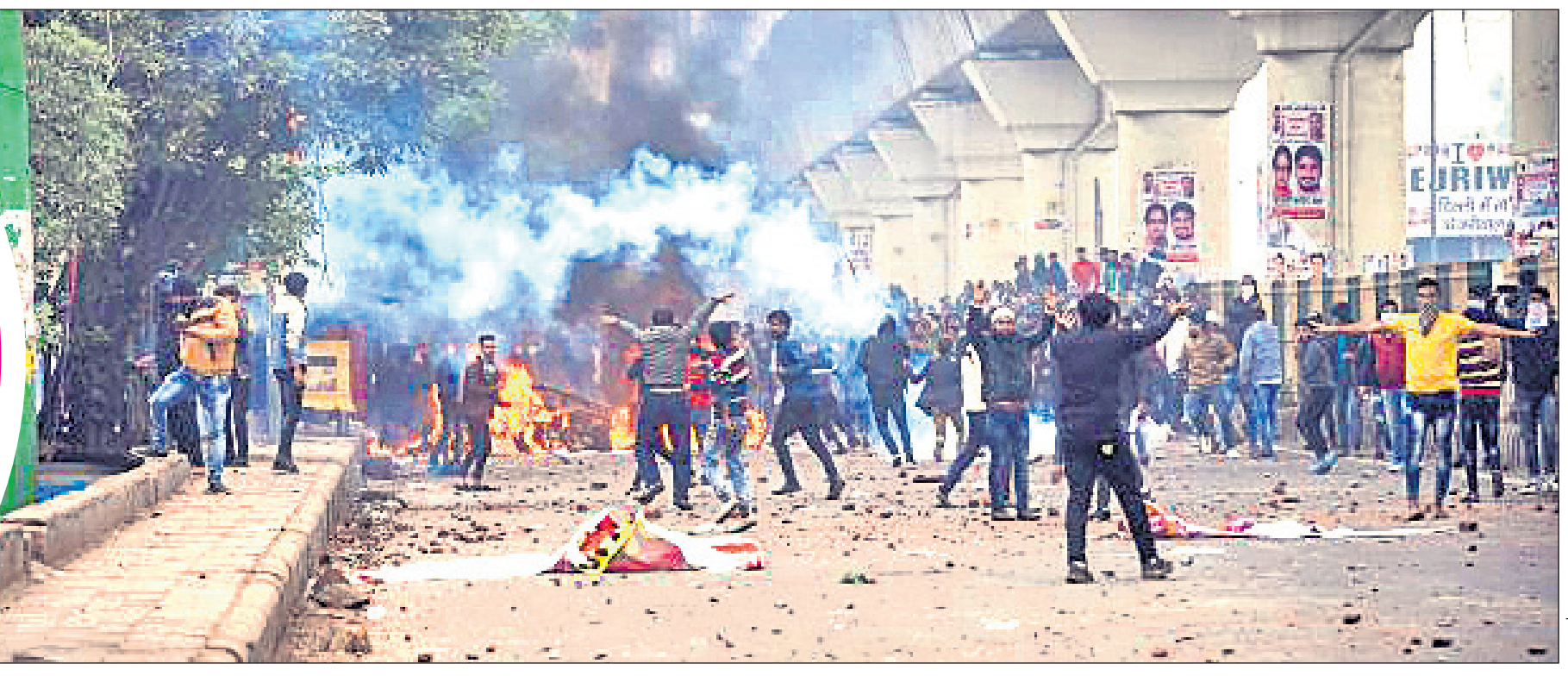
ନୂଆଦିଲ୍ଲୀ: ସିଲ୍ଲୀମ୍ପୁରରେ ଆନ୍ଦୋଳନ ବେଳେ ପୋଲିସ-ବିଶୋଭକାରୀଙ୍କ ମଧ୍ୟରେ ସଂଘର୍ଷ ଘଟିଛି। ରାସ୍ତାରେ ଲତା ଓ ବ୍ୟାଞ୍ ପଡ଼ିଛି।

କେନ୍ଦ୍ର ସରକାରଙ୍କ ନବପ୍ରଣୀତ ନାଗରିକତ୍ୱ ସଂଶୋଧନ ଆଇନ (ସିଏଏ)କୁ ବିରୋଧ କରି ଉତ୍ତର-ପୂର୍ବାଞ୍ଚଳରେ ଆରମ୍ଭ ହୋଇଥିବା ବିଶୋଭ ଉଗ୍ରରୂପ ଧାରଣ କରିଛି। ସିଏଏ ପ୍ରତ୍ୟାହାର ଦାବିରେ ବିଶୋଭ ପଶ୍ଚିମବଙ୍ଗ ଓ ଦିଲ୍ଲୀକୁ ବ୍ୟାପିବା ପରେ ଅନେକ ସ୍ଥାନରେ ଭଙ୍ଗାଗୁଜା ଓ ପୋଡ଼ାଜଳା ସହ ବହୁ ଲୋକଙ୍କ ଜୀବନ ମଧ୍ୟ ଗଲାଣି। ଦିଲ୍ଲୀର ଜାମିଆ ମିଲିଆ ଇସଲାମିଆ ବିଶ୍ୱବିଦ୍ୟାଳୟ ଛାତ୍ରାଛାତ୍ର ବିଶୋଭ କରୁଥିବାବେଳେ ପୋଲିସ ସେମାନଙ୍କ ଉପରେ ବଳ ପ୍ରୟୋଗ କରିଛି। ପୋଲିସର ଦମନକାଳୀ ପରେ ବିଶୋଭର ନିଆଁ ସାରା ଦେଶକୁ ମାଡ଼ିଚାଲିଛି। ଆନ୍ଦୋଳନରତ ଛାତ୍ରଙ୍କୁ ସମର୍ଥନ କରି ଦେଶର ଅନେକ ବିଶ୍ୱବିଦ୍ୟାଳୟ ଛାତ୍ର ସଙ୍ଗଠନ ରାସ୍ତାକୁ ଓହ୍ଲାଇଛନ୍ତି। ଇତିମଧ୍ୟରେ ହାସ୍ତୀ, ଷ୍ଟାଣ୍ଡଫୋର୍ଟ, ଯେଲ୍ ଓ କଲମ୍ବିଆ ଭଳି ବିଦେଶୀ ସୁନିଉର୍ସିଟି ଛାତ୍ରାଛାତ୍ର ମଧ୍ୟ ଭାରତ ସରକାରଙ୍କ ଏହି ଆଇନ ଏବଂ ପୋଲିସ ବର୍ବରତାକୁ କଡ଼ା ନିନ୍ଦା କରିଛନ୍ତି। ଦେଶର ଇତିହାସରେ ଏଭଳି ଆନ୍ଦୋଳନ ଅତ୍ୟୁତପୂର୍ବ ବୋଲି କୁହାଯାଉଛି।