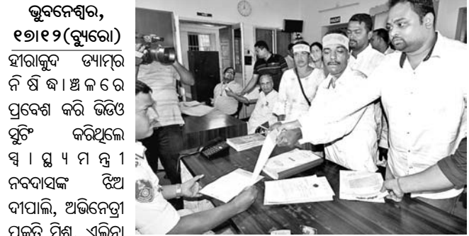
ଭୁବନେଶ୍ୱର, ୧୭।୧୨ (ଭୁବନେ) ହାରାକୁଳ ଡାମ୍ପର ନିର୍ଦ୍ଧାରିତ କାମରେ ପ୍ରବେଶ କରି ଛିଡ଼ି ପୂର୍ଣ୍ଣ କରିଥିଲେ।

ଭୁବନେଶ୍ୱର, ୧୭।୧୨ (ଭୁବନେ): ନାଗରିକତା ସଂଶୋଧନ ଆଇନ (ସିଏଏ)କୁ ମଙ୍ଗଳବାର ରାଜଧାନୀରେ ସଂଖ୍ୟାଳୟ ସମ୍ମୁଖରେ ପକ୍ଷରୁ ବିରୋଧ କରାଯାଇଥିବାବେଳେ ଅଷ୍ଟଳ ଭାରତୀୟ ବିଦ୍ୟାର୍ଥୀ ପରିଷଦ (ଏବିଜିପି) ସମର୍ଥନ ଜଣାଇଛି।