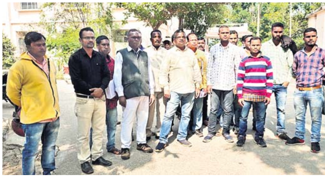
ଜିଲ୍ଲାପାଳଙ୍କୁ ଭେଟିବାକୁ ଆସିଥିବା ଗ୍ରାମବାସୀ ।

ରାୟଗଡ଼ା ଜିଲ୍ଲା କାଶୀପୁର ବ୍ଲକ୍ କଂସାରିଗୁଡ଼ା ଗ୍ରାମଠାରେ ଆଦିତ୍ୟ ଆଲୁମିନା ପ୍ରକଳ୍ପ ନିର୍ମାଣ ହେବ । ଏନେଇ ଗ୍ରାମୀୟ ଲୋକେ ଖୁସିହେଲେ । ନିଜ ଅଞ୍ଚଳରେ କମ୍ପାନୀ ନିର୍ମାଣ ହେଲେ ଅନେକ ଲୋକ ଉପକୃତ ହେବେ ବୋଲି ଆଶା ବାନ୍ଧିଥିଲେ । ତେଣୁ ନିଜ ଜମିକୁ କମ୍ପାନୀକୁ ଚେକ ଦେଇଥିଲେ । ୨୦୦୬ରୁ ଆଦିତ୍ୟ ଆଲୁମିନା କଂସାରିଗୁଡ଼ାରେ ଜମି ଅଧିଗ୍ରହଣ କରି କ୍ଷତିପୂରଣ ବାବଦକୁ ଲୋକଙ୍କୁ ୩ ଲକ୍ଷ ୪୦ ହଜାର ପ୍ରଦାନ କରିଥିଲା । କିନ୍ତୁ ଇତିମଧ୍ୟରେ ୧୩ ବର୍ଷ