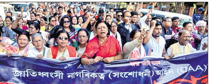
ଗୁଆହାଟି: ଅଲ୍ ଆସାମ ଷ୍ଟୁଡେଣ୍ଟସ୍ ୟୁନିୟନ୍ (ଏଏଏସ୍) ଏବଂ ଅନ୍ୟ ସଙ୍ଗଠନଗୁଡ଼ିକର ସଦସ୍ୟମାନେ ସିଏଏ ପ୍ରତ୍ୟାହାର ଦାବିରେ ସତ୍ୟାଗ୍ରହ କରୁଛନ୍ତି।