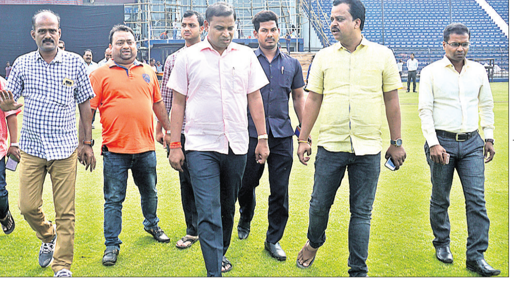
ବାରବାଟୀ ଷ୍ଟାଡ଼ିୟମ୍ ପରିବର୍ତ୍ତନ ଅବସରରେ ଜାତୀୟ ସ୍ତରୀୟ ବ୍ୟାଡ୍‌ମିଣ୍ଟନ ଉତ୍ସାହୀତ ଏବଂ ଅନ୍ୟମାନେ।

କଟକ ଅଫିସ୍, ୧୬ ଡିସେମ୍ବର: ଡିସେମ୍ବର ୧୬ରେ କାଉଣ୍ଟରକୁ ଗଲା ୧୦,୦୫୦ଟିକେଟ୍। ଡିସେମ୍ବର ୧୬ରେ କାଉଣ୍ଟରକୁ ଗଲା ୧୦,୦୫୦ଟିକେଟ୍।