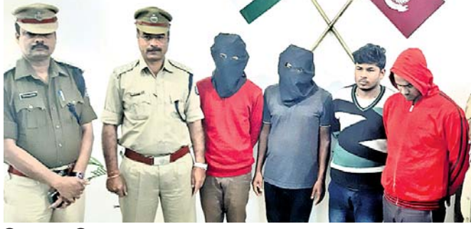
ଗିରଫ ୪ ଅଭିଯୁକ୍ତ ।

ବ୍ୟକ୍ତିଙ୍କ ସ୍ମୃତି ଉଦ୍ଦେଶ୍ୟରେ ପ୍ରତିବର୍ଷ ମୃତକ ପରିବାର ଲୋକେ ଏବଂ ସଂଗ୍ରାମୀ ଏକତ୍ରିତ ହୋଇ ଶହାଦ ଦିବସ ପାଳନ କରି ଆସୁଛନ୍ତି । ସୋମବାର ପରିବାର ଲୋକେ ଓ ଗ୍ରାମବାସୀ ଶହାଦ ଯୁଦ୍ଧ ନିକଟକୁ ଯାଇ ପୂଜାର୍ଚ୍ଚନା କରିବା ସହ ଶହାଦ ଦିବସ ପାଳିତ କରିଛନ୍ତି । ସେହିପରି ବାଗ୍ରୀଝୋଡ଼ିଆ ଥିବା ଶହାଦ ଯୁଦ୍ଧରେ ମଧ୍ୟ ପୂଜାର୍ଚ୍ଚନା କରାଯାଇଛି ।