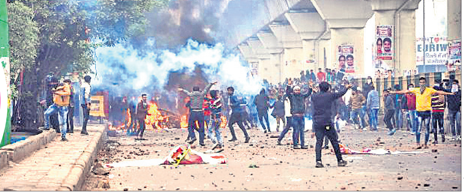
ନୂଆଦିଲ୍ଲୀ: ସିଲ୍ଲୀମ୍ପୁରରେ ଆନ୍ଦୋଳନ ବେଳେ ପୋଲିସ-ବିକ୍ଷୋଭକାରୀଙ୍କ ମଧ୍ୟରେ ସଂଘର୍ଷ ଘଟିଛି। ରାସ୍ତାରେ ଇଟା ଓ ବ୍ୟାଙ୍ଗ ପଡ଼ିଛି।

କେନ୍ଦ୍ର ସରକାରଙ୍କ ନବପ୍ରଣୀତ ନାଗରିକତ୍ୱ ସଂଶୋଧନ ଆଇନ (ସିଏଏ)କୁ ବିରୋଧ କରି ଉତ୍ତର-ପୂର୍ବାଞ୍ଚଳରେ ଆରମ୍ଭ ହୋଇଥିବା ବିକ୍ଷୋଭ ଉଗ୍ରରୂପ ଧାରଣ କରିଛି। ସିଏଏ ପ୍ରତ୍ୟାହାର ଦାବିରେ ବିକ୍ଷୋଭ ପଶ୍ଚିମବଙ୍ଗ ଓ ଦିଲ୍ଲୀକୁ ବ୍ୟାପିବା ପରେ ଅନେକ ସ୍ଥାନରେ ଭଙ୍ଗାଗୁଜା ଓ ପୋଡ଼ାଜଳା ସହ ବହୁ ଲୋକଙ୍କ ଜୀବନ ମଧ୍ୟ ଗଲାଣି। ଦିଲ୍ଲୀର ଜାମିଆ ମିଲିଆ ଇସଲାମିଆ ବିଶ୍ୱବିଦ୍ୟାଳୟ ଛାତ୍ରଛାତ୍ରୀ ବିକ୍ଷୋଭ କରୁଥିବାବେଳେ ପୋଲିସ ସେମାନଙ୍କ ଉପରେ ବଳ ପ୍ରୟୋଗ କରିଛି। ପୋଲିସର ଦମନଲାଳା ପରେ ବିକ୍ଷୋଭର ନିଆଁ ସାରା ଦେଶକୁ ମାଡ଼ିଚାଲିଛି। ଆନ୍ଦୋଳନରତ ଛାତ୍ରଙ୍କୁ ସମର୍ଥନ କରି ଦେଶର ଅନେକ ବିଶ୍ୱବିଦ୍ୟାଳୟ ଛାତ୍ର ସଙ୍ଗଠନ ରାସ୍ତାକୁ ଓହ୍ଲାଇଛନ୍ତି। ଇତିମଧ୍ୟରେ ହାସ୍ତୀ, ଷ୍ଟାଣ୍ଡଫୋର୍ଟ, ଯେଲ୍ ଓ କଲମ୍ବିଆ ଭଳି ବିଦେଶୀ ସୂନିଭର୍ତ୍ତୀ ଛାତ୍ରଛାତ୍ରୀ ମଧ୍ୟ ଭାରତ ସରକାରଙ୍କ ଏହି ଆଇନ ଏବଂ ପୋଲିସ ବର୍ବରତାକୁ କଡ଼ା ନିନ୍ଦା କରିଛନ୍ତି। ଦେଶର ଇତିହାସରେ ଏଭଳି ଆନ୍ଦୋଳନ ଅତୁଟପୂର୍ବ ବୋଲି କୁହାଯାଉଛି।