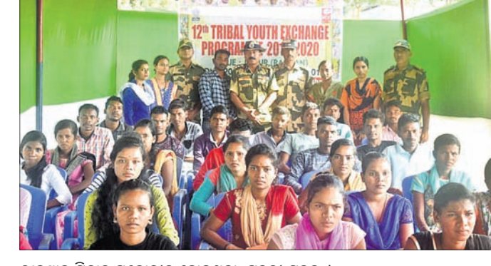
ରାଜସ୍ଥାନ ଯାତ୍ରାକୁ ମନୋନୀତ ହୋଇଥିବା ଯୁବକ ଯୁବିକା।

ମାଲକାନଗିରି, ୧୭।୧୨ (ଡି.ଏନ.ଏ.) ମାଲକାନଗିରି ଜିଲ୍ଲାର ୩୦ ଜଣ ଯୁବକ ଯୁବିକା ଭାରତ ସରକାରଙ୍କ ସହଯୋଗରେ ନେହେରୁ ଯୁବକେନ୍ଦ୍ର ପକ୍ଷରୁ ରାଜସ୍ଥାନରେ ଆୟୋଜିତ ହେଉଥିବା ୧୨ତମ ଆଦିବାସୀ ଯୁବ ମତ ବିନିମୟ କାର୍ଯ୍ୟକ୍ରମରେ ଯୋଗ ଦେବାକୁ ମନୋନୀତ ହୋଇଛନ୍ତି। ଜିଲ୍ଲାର ମେମ୍ବରପାଳ, କୁଡୁପୁରୁରୁଆ, ଚିତ୍ରକୋଣ୍ଡା, କୋଇକୋଣ୍ଡା, ପାଣ୍ଡାପୁରୀ, ଦୋରାଗୁଡ଼ା, ବଡ଼ପଦର ଆଦି ଗ୍ରାମରୁ ୧୭ ଯୁବକ ଓ ୧୩ ଜଣ ଯୁବିକା କାର୍ଯ୍ୟକ୍ରମରେ ଯୋଗ ଦେବେ। ମାଲକାନଗିରି ଜିଲ୍ଲା ସଦର ମହକୁମା ଏନ.ଭି-୦୩ ଗ୍ରାମସ୍ଥିତ ବିଏସଏଫରେ ୧୬୦ ବାଗାଲିୟନ କମ୍ୟୁନିଟି କେମ୍ପରେ ୨୨ ଜଣ ମହିଳା କନଷ୍ଟେବଲ ରାଜସ୍ଥାନ ଯାତ୍ରା କରିବେ।