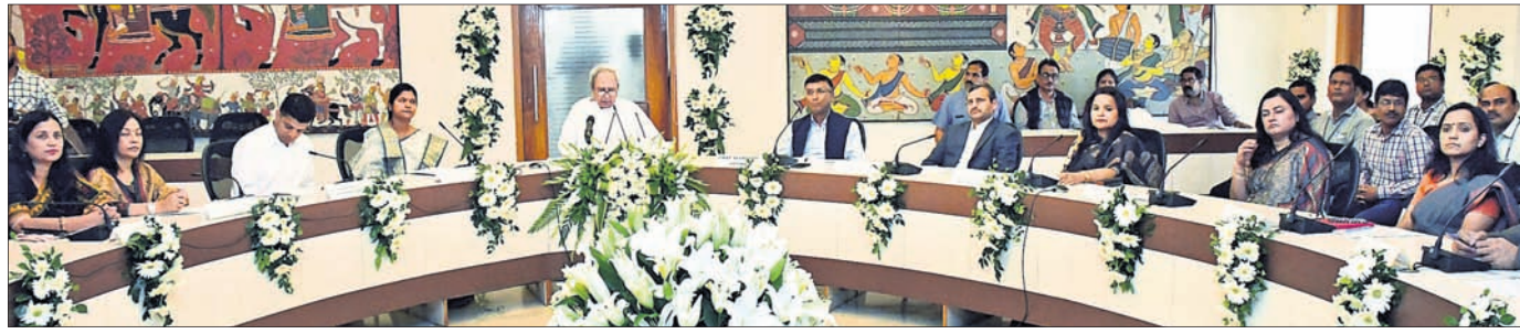
ଭିତ୍ତି କମିଟିରେ ଉପସ୍ଥାପନ କରାଯାଇଥିବା ମହିଳା, ଶିଶୁ ବିଭାଗ ଓ ମିଶନ ଶକ୍ତି କର୍ମୀମାନଙ୍କର ସାମିଲ ହେବା ପାଇଁ ପ୍ରସ୍ତାବ ଦିଆଯାଇଥିଲା।

■ ହିତାଧିକାରୀଙ୍କ ସହଯୋଗ ଯୋଜନାର ସଫଳତା: ମୁଖ୍ୟମନ୍ତ୍ରୀ ■ ଛତୁଆ କାର୍ଯ୍ୟକ୍ରମରେ ସାମିଲ ହେବେ ମହିଳା ସ୍ୱୟଂ ସହାୟକ ଗୋଷ୍ଠୀ: ପାଣିପାଗ