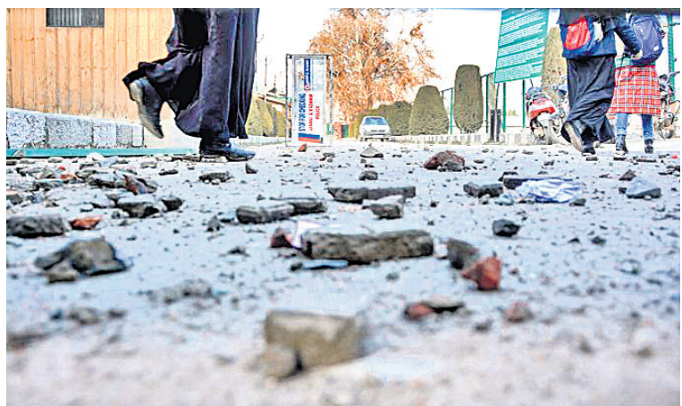
ଶ୍ରୀନଗର: ଇସ୍କାମିଆ କଲେଜ ଅଫ୍ ସାଇନ୍ସ ଆଣ୍ଡ କମ୍ପ୍ୟୁଟର ଓ ପୋଲିସ ମଧ୍ୟରେ ସଂଘର୍ଷ ବେଳେ ମରାଯାଇଥିବା ଟେକା।