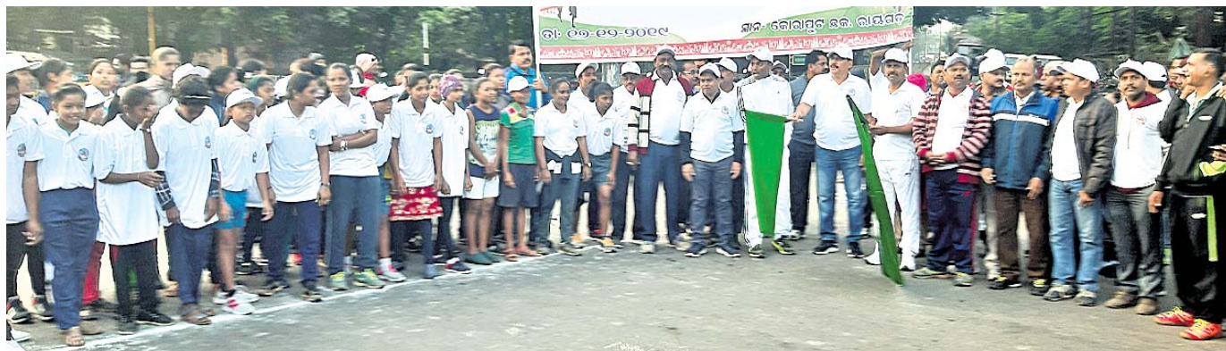
ମାରାଥନକୁ ଜିଲ୍ଲାପାଳ ଓ ଏସ୍ପି ପତାକା ଦେଖାଇ ଶୁଭାରମ୍ଭ କରୁଛନ୍ତି ।