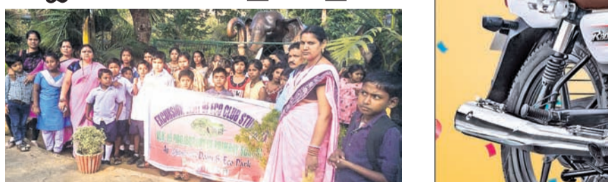
ସବୁଜବାହିନୀ ପକ୍ଷରୁ ବାହାନଗା ଶୋଭାଯାତ୍ରା ।