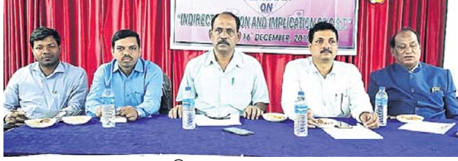
ଆଲୋଚନାଚକ୍ରରେ ମହାସଭା ଅତିଥି ।