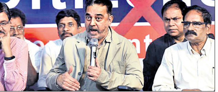
ଚେନ୍ନାଇ: ମୂଳ ନିୟମ ପ୍ରତିଷ୍ଠାତା ତଥା ଅଭିନେତା କମଳ ହାସନ ସିଏଏ ଏବଂ ଏନ୍ଆର୍ସି ବିରୋଧରେ ଖବରଦାତା ସମ୍ମିଳନୀକୁ ସମ୍ବୋଧନ କରୁଛନ୍ତି।