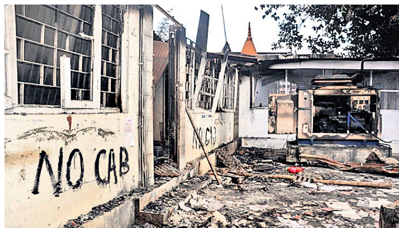
ଆସାମର ବିଭୁବନ ଜିଲ୍ଲା ଚାନ୍ଦୁଆରେ ପୋଷ୍ଟ ଅଫିସକୁ ଭାଙ୍ଗିଦେଇଛି ସିଏସ ବିରୋଧୀ ବିଶୋଭକାରୀ।