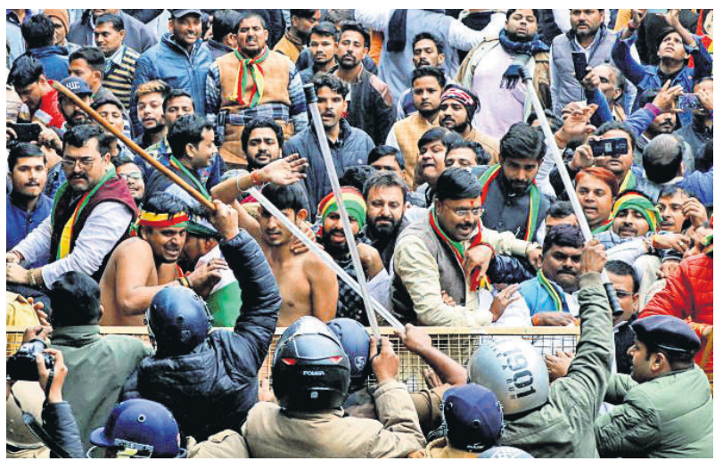
ଲକ୍ଷ୍ନୋରୁ ଯୁଦ୍ଧ ବିଧାନସଭା ନିକଟରେ ସିଏଏ ବିରୋଧୀ ବିଶୋଭ କରୁଥିବା ପ୍ରଗତିଶୀଳ ସମାଜବାଦୀ ପାର୍ଟି (ଲୋହିଆ) କର୍ମୀଙ୍କୁ ପୋଲିସ୍ ଅଟକାଇଛି।