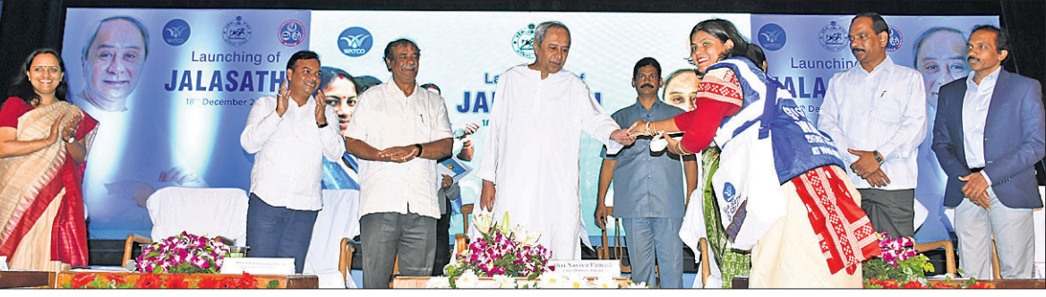
ମୁଖ୍ୟମନ୍ତ୍ରୀ ନବୀନ ପଟ୍ଟନାୟକ ଜଣେ କଳସାଥୀକୁ ଚାକ ପ୍ରଥମ ପ୍ରାପ୍ୟ ପ୍ରଦାନ କରୁଛନ୍ତି ।