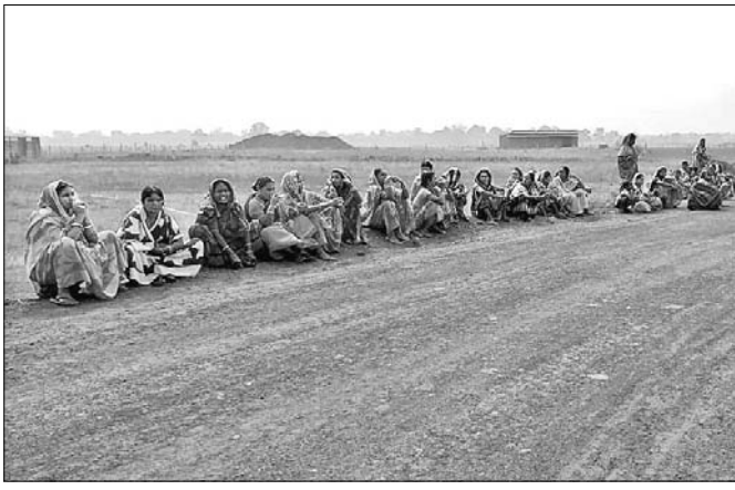
କାମ ବନ୍ଦ ଦାବିରେ ମହିଳାମାନେ ରାସ୍ତା ଉପରେ ବସିଛନ୍ତି।

ରେଳଝେଡ଼ି କର୍ତ୍ତୃପକ୍ଷ ଲୋକଙ୍କ ପାଇଁ ଡାଇଭର୍ସନ ରାସ୍ତା ନିର୍ମାଣ ନ କରି ରେଳପଥ କାମ କରିବାକୁ ଉଦ୍ୟମ କରିବାବେଳେ ବୁଧବାର ଦାନଗଦା ଚନ୍ଦ୍ରପଲ ବାଲିଆପାଳ ଗାଁ ଲୋକେ ଡାକ୍ତର ବିରୋଧ କରିଛନ୍ତି। ଏହାକୁ ନେଇ ଘଟଣାସ୍ଥଳରେ ଉଭେଜନା ପ୍ରକାଶ ପାଇଛି। ଉଭୟ ଲୋକେ ପୁକିୟା-ଅନୁଗୋଳ-ଢୁକୁରା ରେଳ ପ୍ରକଳ୍ପ ନିର୍ମାଣ କାର୍ଯ୍ୟକୁ ବନ୍ଦ କରିଦେଇଛନ୍ତି। ଅଧିକ ଉଭେଜନା ଆଶଙ୍କାରେ ଘଟଣାସ୍ଥଳରେ କଳିଙ୍ଗନଗର ଥାନା ପୋଲିସକୁ ପୂରଣ କରାଯାଇଛି।