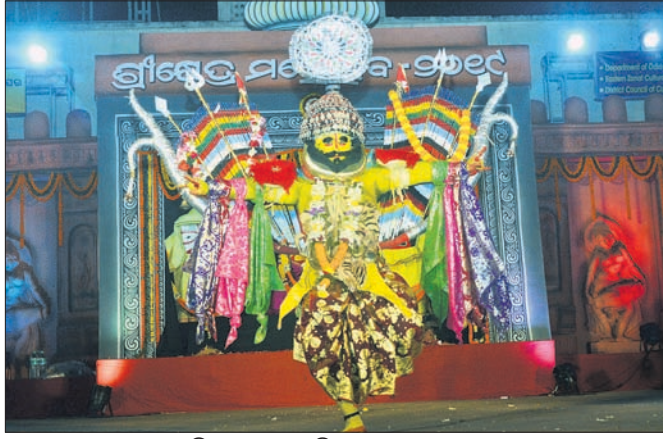
ଜଣେ କଳାକାର ନୃତ୍ୟ ପରିବେଷଣ କରୁଛନ୍ତି।