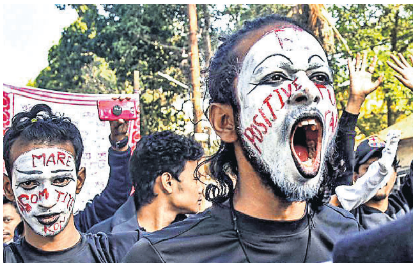
ଗୁଆହାଟୀରେ ମୂକ ଓ ବଧୂର ଛାତ୍ରୀଛାତ୍ରଙ୍କ ବିଶୋଭ।