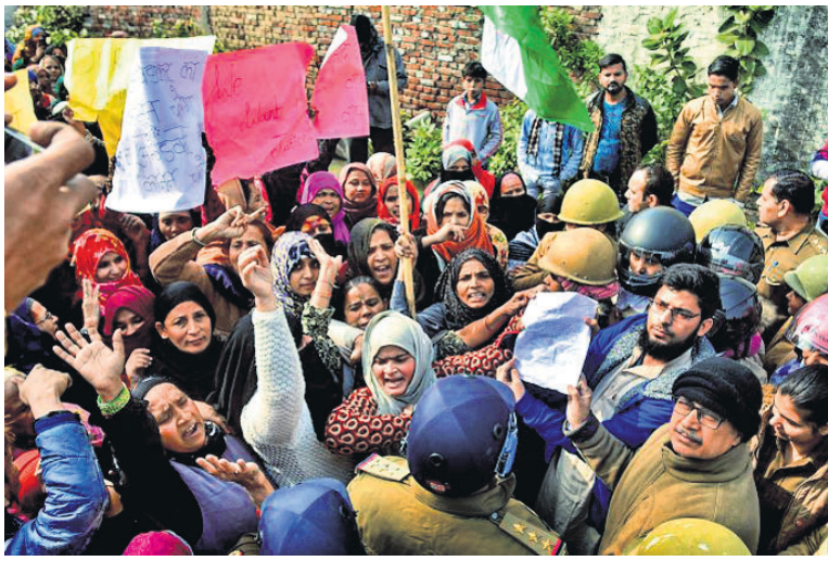
ସିଏଏ-ଏନ୍‌ଆର୍‌ସି ବିରୋଧରେ ଆଲିଗଡ଼ର ସରାଇ ହାକିମ୍‌ରେ ବିଶୋଭ ଦେଖାଇ ଗୁମାସ୍ତା ଲୋକଙ୍କୁ ଅଟକାଇଛି ପୋଲିସ୍।