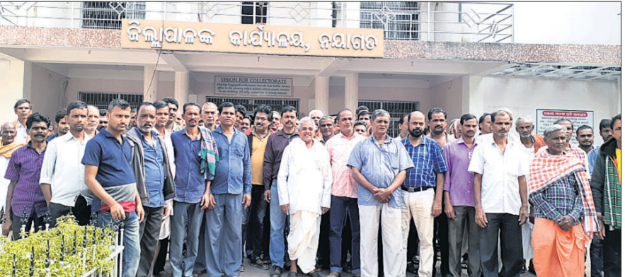
ଜିଲାପାଳଙ୍କ ଦ୍ୱାରସ୍ଥ ହୋଇଥିବା ବିରକ୍ତି ଗ୍ରାମବାସୀ।

ନନ୍ଦାକାନ୍ତ ଅଫିସ, ୧୮୧୨ ନନ୍ଦାକାନ୍ତ ଜିଲ୍ଲା ଖଣ୍ଡପଡ଼ା ବ୍ଲକ୍ ରାଣୀପଡ଼ା ପଞ୍ଚାୟତ ବିରକ୍ତି ଗ୍ରାମରୁ ରାଜସ୍ୱ ଗ୍ରାମ ପ୍ରଦାନ ଦାବି କରାଯାଇଛି। ଏ ନେଇ ଗ୍ରାମବାସୀ ବୁଧବାର ଜିଲାପାଳଙ୍କ ଦ୍ୱାରସ୍ଥ ହୋଇଛନ୍ତି।