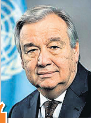
ଅଭିବ୍ୟକ୍ତି ଓ ମତାମତ ପ୍ରଦାନର ଅଧିକାରକୁ ସମ୍ମାନ ଦେଇ ଭାରତ। -ଆଣ୍ଡୋନିଓ ଗୁଟେରେସ୍, ଜାତିସଂଘ ମହାସଚିବ

ସଂଶୋଧନ ନାଗରିକତ୍ୱ ଆଇନ (ସିଏଏ)କୁ ବିରୋଧ କରି ଭାରତରେ ଆନ୍ଦୋଳନ ହିଂସାକୁ ରୁଦ୍ଧ ନେଇଥିବାକୁ ଜାତିସଂଘ ଉଦ୍‌ବେଗ ପ୍ରକାଶ କରିଛି। ଏହାକୁ ନେଇ ଜାତିସଂଘ ମହାସଚିବ ଆଣ୍ଡୋନିଓ ଗୁଟେରେସ୍ ତିକ୍ତା ପ୍ରକଟ କରିବା ସହ ମତାମତ ଦେବାର ଅଧିକାରକୁ ସମ୍ମାନ ଜଣାଇବା ଲାଗି ଆହ୍ୱାନ ଦେଇଛନ୍ତି। ସିଏଏ ଅନୁଯାୟୀ ପାକିସ୍ତାନ, ବାଂଲାଦେଶ ଓ ଆଫଗାନିସ୍ତାନରେ ଧର୍ମୀୟ ବିବେଚନା ଶିକାର ହୋଇ ୨୦୧୪ ଡିସେମ୍ବର ପୂର୍ବରୁ ଭାରତରେ ଆସି ରହିଥିବା ହିନ୍ଦୁ, ଶିଖ୍, ବୌଦ୍ଧ, ଜୈନ, ପାର୍ସୀ ଓ ଖ୍ରୀଷ୍ଟିୟାନମାନଙ୍କୁ ଭାରତୀୟ