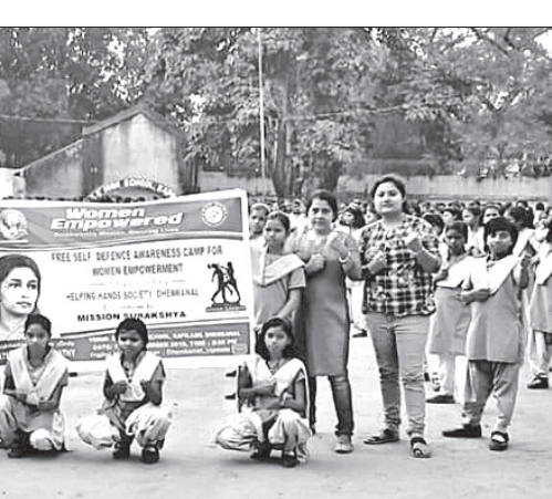
ଗଞ୍ଜାମ ସରକାରୀ ବାଳିକା ଉଚ୍ଚ ବିଦ୍ୟାଳୟ ପରିସରରେ ଆତ୍ମରକ୍ଷା କୌଶଳ ଅଭିଯାନ।

ଦେଶାନ୍ତର ଅଫିସ, ୧୮୧୨ ଓଡ଼ିଶାର ପୂର୍ବତନ ମୁଖ୍ୟମନ୍ତ୍ରୀ ନନ୍ଦିନୀ ଶତପଥୀଙ୍କ ସାହାଯ୍ୟରେ ପ୍ରାୟ ୪୫୫ରୁ ଊର୍ଦ୍ଧ୍ୱ ଛାତ୍ରୀମାନଙ୍କୁ ଆତ୍ମରକ୍ଷା କୌଶଳ ପ୍ରଦାନ କରାଯାଇଥିବା ଆୟୋଜକଙ୍କ କଥାକୁ କୁଳୁକ୍ ସୋସାଇଟି ଓ ଗୁରୁଦେବକା ମିଶନ ସୁରକ୍ଷା ମିଳିତ ଆନୁକୂଲ୍ୟରେ ଆୟୋଜନ କରାଯାଇଥିଲା।