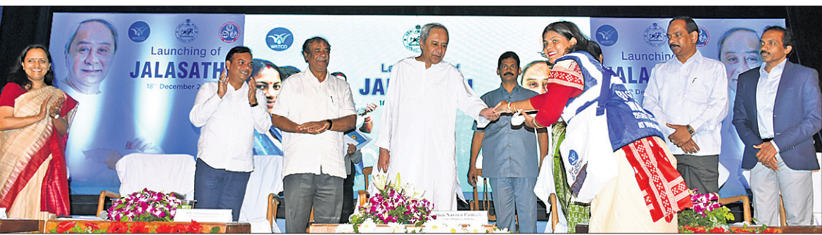
ମୁଖ୍ୟମନ୍ତ୍ରୀ ନବୀନ ପଟ୍ଟନାୟକ ଜଣେ ଜଳସାଥୀଙ୍କୁ ତାଙ୍କ ପ୍ରଥମ ପ୍ରାପ୍ୟ ପ୍ରଦାନ କରୁଛନ୍ତି।