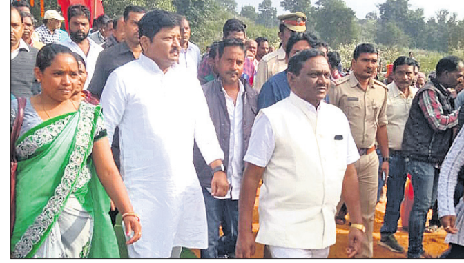
ଉଦ୍‌ଘାଟନା କାର୍ଯ୍ୟକ୍ରମରେ ମନ୍ତ୍ରୀ ଓ ବିଧାୟକ