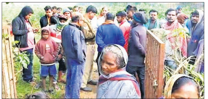
ଗୁଡ଼ିପଦା ଗ୍ରାମରେ ଗଣସଭା ଚଳିଥିଲା

ବାଲେଶ୍ୱର ଜିଲ୍ଲା ସହଦେବଖୁଣ୍ଟା ମତେଇ ଥାନା ଅଧୀନ ଗୁଡ଼ିପଦା ଗ୍ରାମରେ ବୃଦ୍ଧାଙ୍କୁ ହତ୍ୟା କରାଯାଇଥିଲା।