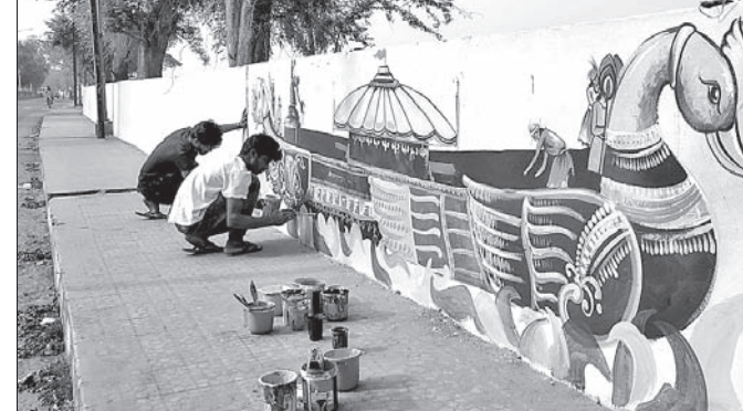
କଟକ ମାତାମଠାଠାରୁ ବାଲିଯାତ୍ରା ପଡ଼ିଆ ପର୍ଯ୍ୟନ୍ତ ମହାନଦୀ ରିଙ୍ଗ ବନ୍ଧ ରାସ୍ତାର ସୌନ୍ଦର୍ଯ୍ୟକରଣ ପାଇଁ ସୁସ୍ଥ ପାଟେରରେ କଳାକାରମାନେ ଚିତ୍ର ଆଙ୍କୁଛନ୍ତି।