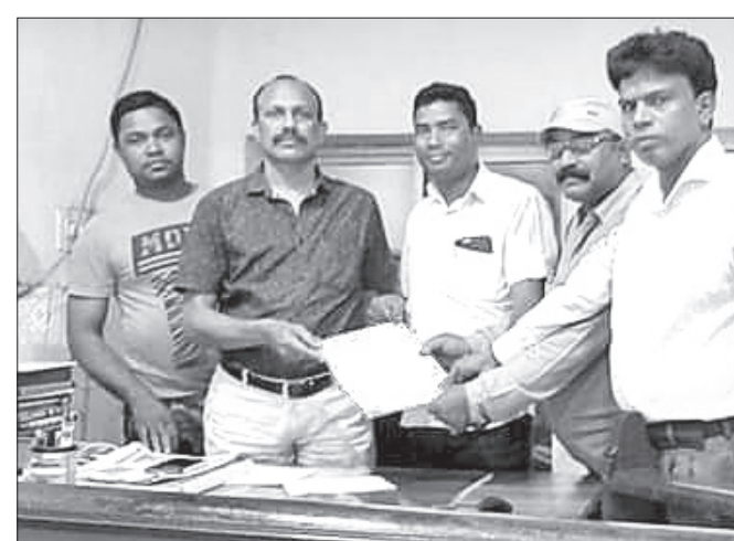
ସହକାରୀ ଜିଲାପାଳଙ୍କୁ ଦାବିପତ୍ର ପ୍ରଦାନ କରାଯାଇଛି।