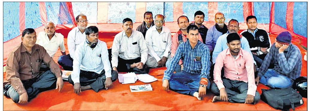
ସହଦେବଖୁଣ୍ଟା ତାଳ ଅଧୀକାରୀଙ୍କୁ ଉଦ୍ଘାଟନ କରିବା ପାଇଁ ଉଦ୍ଘାଟନ କରାଯାଇଛି।