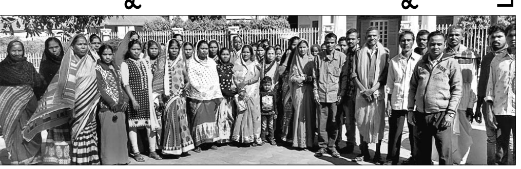
ବନ୍ଧକୁ ବିରୋଧ କରି ଜିଲ୍ଲାପାଳଙ୍କୁ ଦାବିପତ୍ର ଦେଖାଇବା ପାଇଁ ଲୋକମାନେ ଯାତ୍ରା କରୁଛନ୍ତି।

କେନ୍ଦୁଝର, ୧୯୧୨ (ସ.ପ୍ର.)- ଗ୍ରାମର ଲୋକମାନେ ନିର୍ମାଣ ନ ହେଲେ ହରିତମୟୀ ନଦୀରୁ ଜଳ ଗ୍ରାହଣ କରିବାକୁ ଉପାୟ ନାହିଁ ବୋଲି କହିବାକୁ ଦେଖାଦେଇଛନ୍ତି।