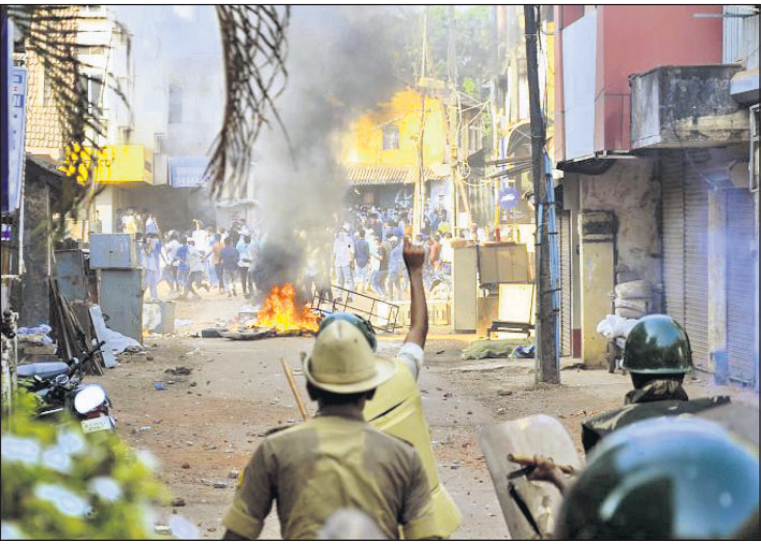
ମାଜାଲୁରୁରେ ବିଶୋଭକାରୀଙ୍କ ସହ ପୋଲିସର ସଂଘର୍ଷ।