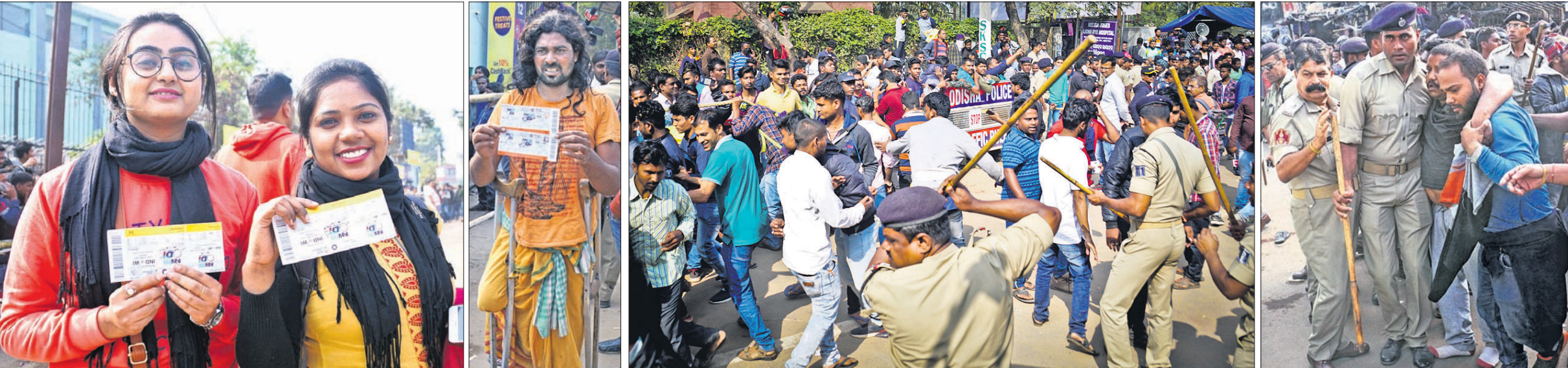
ଟିକେଟ୍ ପାଇବା ପରେ ଦୁଇ ମୁବତା ଖୁସି ଜାହିର କରୁଛନ୍ତି । ଜଣେ ଭିକ୍ଷକ ଟିକେଟ୍ ବେଞ୍ଚାଉଛନ୍ତି । ପୋଲିସ୍ ପକ୍ଷରୁ ଲାଠି ଚାଳନା । ଧାଡ଼ିରେ ଠିଆ ହୋଇ ଅସୁସ୍ଥ ହୋଇପଡ଼ିଥିବା ଜଣେ ମୁବକଙ୍କୁ ପୋଲିସ୍ ବିକିଆ ପାଇଁ ନେଉଛନ୍ତି ।

ଭାରତୀୟ ଦଳର ମହମ୍ମଦ ଶାମି ଦୁର୍ଭିଳାଷ୍ଟ ପେସର ଟ୍ରେସ୍ ବୋଲ୍‌କୁ ଅତିକ୍ରମ କରି ଚଳିତବର୍ଷ ଦିନିକିଆରେ ସର୍ବାଧିକ ଉଇକେଟ୍ ନେଇଥିବା ବୋଲର ହୋଇପାରିଛନ୍ତି । ଏ ବର୍ଷ ୨୦ ମ୍ୟାଚ୍ ଖେଳି ଶାମି ହାତେଇଛନ୍ତି ୪୧ ଉଇକେଟ୍ । ତାଙ୍କ ପଛରୁ ରହିଥିବା ବୋଲ୍ ସମାନ ସଂଖ୍ୟକ ମ୍ୟାଚ୍‌ରେ ୩୮ ଉଇକେଟ୍ ହାସଲ କରି ଦ୍ୱିତୀୟ ସ୍ଥାନରେ ରହିଛନ୍ତି । ଷ୍ଟେସ୍ଡାଇଲିକ ଅଧିନାୟକ କିରନ ପୋଲାଟ୍ ୨୯ ବର୍ଷୀୟ ଶାମିଙ୍କ ୪୦ଟି ଶିକାର ପାଲଟି ଥିଲେ । ଉଲ୍ଲେଖଯାଉ କି, ଦ୍ୱିତୀୟ ଦିନିକିଆକୁ ଭାରତ ୧୦୭ ରନ୍‌ରେ ଛିଟି ସିରିଜ ବରାଦ କରିଥିଲା ।