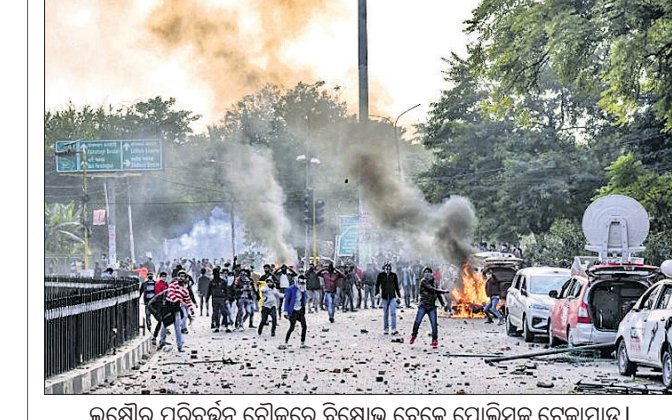
ଲକ୍ଷ୍ନୌର ପରିବର୍ତ୍ତନ ଚଳାଚଳରେ ବିଶୋଭକେବେଳେ ପୋଲିସକୁ ଚେକାମାଡ଼।

କାଟିବଂସ ଚତ୍ୱାବଧାନରେ ଗଣଭୋଟ ପାଇଁ ଆଗେଇ ଆସୁ। ଯଦି ଏଥିରେ ଏକ ବିଶାଳ ରାଲିକୁ ସମ୍ବୋଧିତ କରି ତୃଣମୂଳ କଂଗ୍ରେସ ନେତ୍ରୀ କହିଛନ୍ତି, ଯଦି ଭାଜପାର ସତ୍ତ୍ୱାହସ ଥାଏ, ତେବେ ସଂଶୋଧିତ ନାଗରିକଙ୍କୁ ଆଇନ ଏବଂ ଏନ୍ଆର୍ସି ଉପରେ