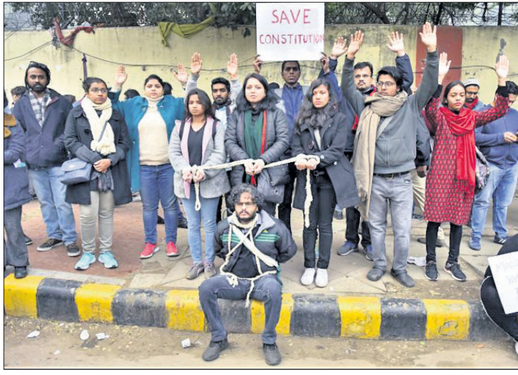
ଦିଲ୍ଲୀର ମଣ୍ଡିହାରସ୍ୱରେ ବିଶୋଭକେବେଳେ ନିଜ ହାତକୁ ଦଉଡ଼ିରେ ବାନ୍ଧିଛନ୍ତି ଆନ୍ଦୋଳନକାରୀ।