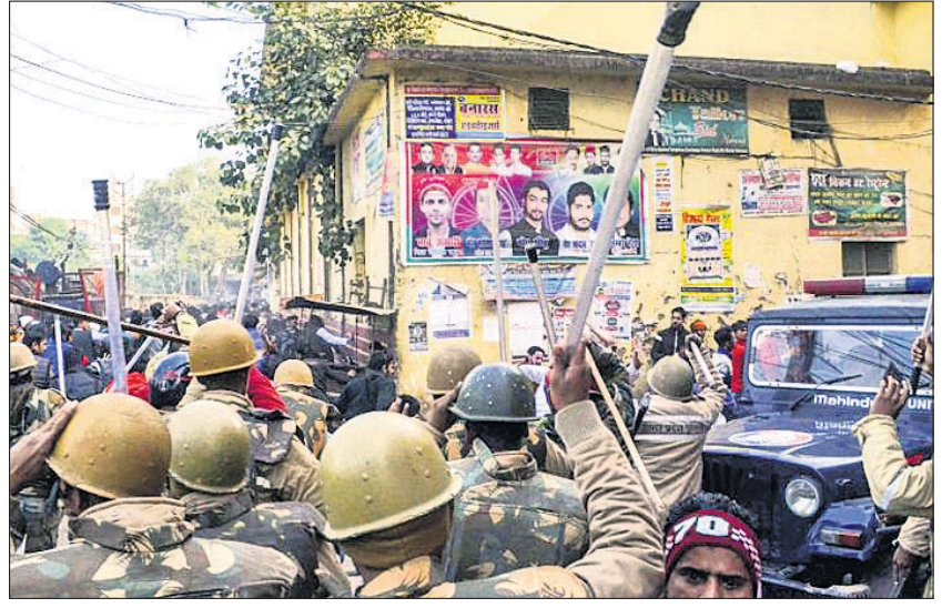
ବାରାଣସୀରେ ବିଶୋଭକାରୀଙ୍କୁ ପୋଲିସର ଲାଠିମାଡ଼।