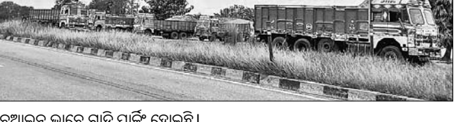
ବେଆଇନ ଭାବେ ଗାଡ଼ି ପାର୍କିଂ ହୋଇଛି।

ଝୁମୁରା ମୁଖ୍ୟ ବଜାର ରାସ୍ତା ପାର୍ଶ୍ଵ ଜବରଦଖଲ। ଉପରେ ଦେଖିଲେ ନିର୍ମାଣ କାମ ଚାଲିଛି।