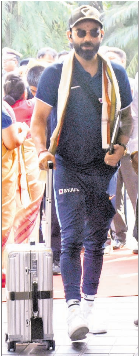
ବାରବାଟୀ ସ୍ତୁତିମଣ୍ଡଳରେ ରବିବାର ଦୁର୍ଗାୟ ଅନ୍ତର୍ଜାତୀୟ ଦିନିକିଆ କ୍ରିକେଟ ମ୍ୟାଚ ଖେଳିବା ପାଇଁ ଗୁରୁବାର ଭୁବନେଶ୍ୱରରେ ପହଞ୍ଚିବା ପରେ ଦୁଇ ଦିନର ଅଧିନାୟକ ଭାରତର ବିରାଟ କୋହଲି ଏବଂ ଡେଷ୍ଟଲଭିଜନ କିରନ ପୋଲାର୍ଡ। (ବିପୋର୍ଟ ଖେଳ ପୃଷ୍ଠାରେ)