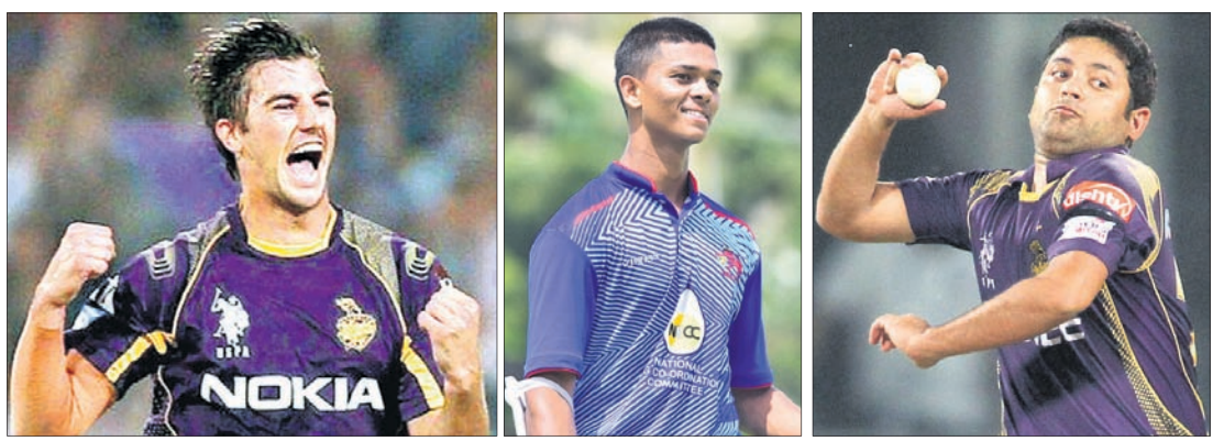
ପ୍ୟାଟ୍ କୁନିନ୍ସ, ମିଚେଲ୍ ମାର୍ଶ୍ ଓ ମିଚେଲ୍ ଷ୍ଟାର୍କ

ରୁକୁବାର ଏଠାରେ ଅନୁଷ୍ଠିତ ଇଣ୍ଡିଆନ୍ ପ୍ରିମିୟର ଲିଗ୍ (ଆଇପିଏଲ୍) ଖେଳାଳି ନିର୍ଦ୍ଦାୟକ ଅଧିକାରୀ ଖେଳାଳିଙ୍କ ଅଧିକ ଚାହିଦା ପରିଲକ୍ଷିତ ହୋଇଛି। ଅଷ୍ଟ୍ରେଲିଆର ପ୍ୟାଟ୍ କୁନିନ୍ସ ସବୁଠାରୁ ଦୀର୍ଘ ବିଦେଶୀ ଖେଳାଳି ବିବେଚିତ ହୋଇଛନ୍ତି। ଦୁଇ ଥର ଚାମ୍ପିୟନ କୋଲକାତା ନାଇଟ୍ ରାଇଡର୍ସ (କେକେଆର) ତାଙ୍କୁ ୧୫.୫୦ କୋଟି ଟଙ୍କାରେ କ୍ରୟ କରିଛି, ଯାହା ବିଦେଶୀ ଖେଳାଳିଙ୍କ କ୍ଷେତ୍ରରେ ଲିଗ୍ ଇତିହାସରେ ସର୍ବାଧିକ। କୁନିନ୍ସ ଏବେ ଭଲ ଫର୍ମରେ ଅଛନ୍ତି। ବୋଲି ବ୍ୟତୀତ ସେ ଭଲ ବ୍ୟାଟିଂ ମଧ୍ୟ କରିପାରନ୍ତି। କୋଚୁହଳର ବିଷୟ ଯେ, ଲାହୋରରେ ଭାରତ ବିପକ୍ଷରେ ଖେଳାଳିଙ୍କୁ ଥିବା ଅନ୍ତର୍ଦ୍ଧାତ୍ମକ ଦିନିକିଆ ସିରିଜ ପାଇଁ ଅଷ୍ଟ୍ରେଲିଆ ଦଳରେ ସ୍ଥାନ ପାଇ ନ ଥିବା ଅନୁରୋଧକୁ ମାକୁଡ଼େଲକୁ କିଛି ଇଲେଭେନ ପଞ୍ଜୀବ ୧୦. ୨୫ କୋଟି ଟଙ୍କାରେ କ୍ରୟ କରିଛି। ମାକୁଡ଼େଲକୁ ନେବାଲାଗି ଏହି ପ୍ରାଞ୍ଚିକ୍ରମକୁ ନିର୍ଦ୍ଦାୟକ ସହିତ ପ୍ରତିଯୋଗିତାରେ ଅବତୀର୍ଣ୍ଣ ହେବାକୁ ପଡ଼ିଥିଲା। ଏଥର ଖେଳାଳି କ୍ରୟ କରିବା କ୍ଷେତ୍ରରେ ଅନ୍ୟ