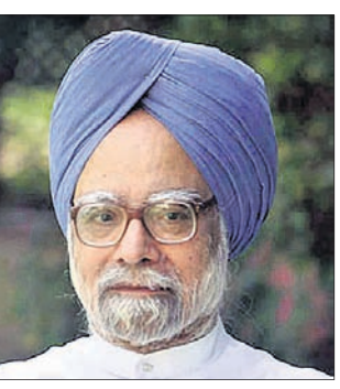
ଦେଶରେ ସଂଖ୍ୟାଲଘୁ ଧର୍ମୀୟ ଉପାଦାନର ଶିକାର ହୋଇଥିଲେ। ଭାରତର ଶରଣ ନେଇଥିବା ସେହି ଲୋକଙ୍କ ପ୍ରତି ନୈତିକ

ନୂଆଦିଲ୍ଲୀ, ୧୯/୧୨ (ପି.ଟି.) ସିଏଏକୁ କେଉଁ କେନ୍ଦ୍ର ସରକାର ବିରୋଧୀ ଦଳଗୁଡ଼ିକ ପକ୍ଷରୁ ଜୋରଦାର ବିରୋଧର ସମ୍ମୁଖୀନ ହେବା ପରେ ଭାଜପା ଗୁରୁତାର ବରିଷ୍ଠ କଂଗ୍ରେସ ନେତା ମନମୋହନ ସିଂହ ୨୦୦୩ ବକ୍ତବ୍ୟର ଏକ ଭିଡିଓ ପୋଷ୍ଟ କରିଛନ୍ତି। ବାଂଲାଦେଶ ଭଳି ପଡୋଶୀ ଦେଶରୁ ଆସି ଭାରତରେ ରହୁଥିବା ସଂଖ୍ୟାଲଘୁମାନଙ୍କୁ ନାଗରିକଙ୍କୁ ପ୍ରଦାନରେ ଉଦ୍‌ବେଗ ପୋଷ୍ଟ କରିବା ସପକ୍ଷରେ ମନମୋହନ ସେତେବେଳେ ରାଜ୍ୟ ସଭାରେ ଉଦ୍‌ବେଗ ପଦ କହିଥିଲେ। ଦେଶ ବିଭାଜନ ପରେ ପଡୋଶୀ