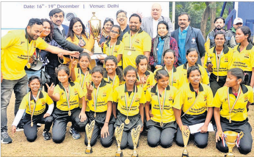
ନୂଆଦିଲ୍ଲୀରେ ଅନୁଷ୍ଠିତ ଜାତୀୟ ଦୃଷ୍ଟିହୀନ ମହିଳା ଟି୨୦ କ୍ରିକେଟ୍ ଚୁନିମେଣ୍ଟର ଫାଇନାଲ୍‌ରେ ରୁକୁବାର କର୍ମଚକ୍ର ୮୭ ରନରେ ହରାଇ ଚାମ୍ପିୟନ ହୋଇଥିବା ଓଡ଼ିଶା ଦଳ।

ଦ୍ୱିତୀୟ ରଣଜୀ ମ୍ୟାଚ୍ ଖେଳିଛି। ୪୧ ବର୍ଷୀୟ ଦକ୍ଷ ବ୍ୟାଟ୍‌ସମ୍ୟାନ କେବଳ ୨୦୦୮ ଆଇପିଏଲ୍‌ରେ ଖେଳିଥିଲେ। ଏହାପରେ ତାଙ୍କୁ କ୍ୟାପି ସୁଯୋଗ ମିଳି ନ ଥିଲା। ସେ ରୟାଲ ଚ୍ୟାଲେଞ୍ଜର୍ସ ବାଙ୍ଗାଲୋର (ଆରଭିଭି) ପାଇଁ ୬ ମ୍ୟାଚ୍ ଖେଳି ୧୧୦.୫୭ ଷ୍ଟ୍ରାଇକ୍ ରେଟ୍‌ରେ ୧୧୫ ରନ୍ କରିଛନ୍ତି।