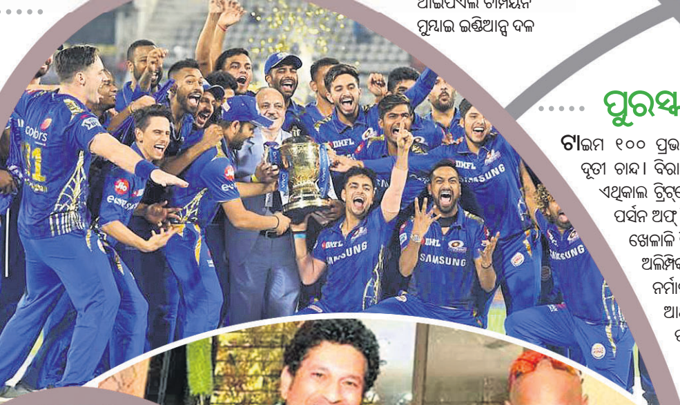
ଆଇସିସି ଚାମ୍ପିୟନ ମୁମ୍ବାଇ ଇଣ୍ଡିଆନ୍ ଦଳ