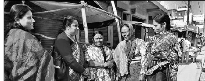
ସ୍ଵଳ୍ପଭାଷୀ ମହିଳାମାନେ ସଫେଇ ପାଇଁ ଅଣ୍ଟା ଭିଡ଼ିଛନ୍ତି।

କେନ୍ଦୁଝର, ୧୯୧୨ (ସ.ପ୍ର.)- ଏବେ ମଇଳା ଆବର୍ଜନା ଏଣେ ତେଣେ ମଇଳା ଆବର୍ଜନାକୁ ନିର୍ଦ୍ଦିଷ୍ଟ ସ୍ଥାନ ବା ଡଷ୍ଟିନରେ ନ ପକାଇ ଏଣେ ତେଣେ ଫିଙ୍ଗିଲେ ଫାଇନ ହେବ।