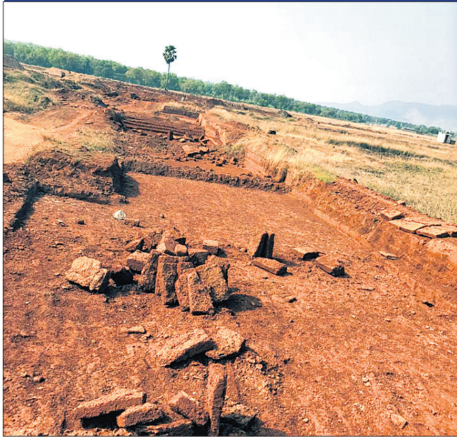
କୁପାରୀ ରାଜ୍ୟ ଶେତ୍ରକୁ ମାଙ୍କଡ଼ା ପଥର ଉତ୍ତୋଳନ କରାଯାଇଛି ।

ବାଲେଶ୍ୱର ଜିଲ୍ଲା ଖଇରା ବ୍ଲକ ଅଧୀନ କୁପାରୀ ସାଂସ୍କୃତିକ ପୀଠ ପୁଣ୍ୟଭୂମି ଭାବେ ସାରା ଓଡ଼ିଶାରେ ଏକ ସ୍ୱତନ୍ତ୍ର ପରିଚୟ ସୃଷ୍ଟି କରିଛି । ଶୂନ୍ୟ ମଣ୍ଡଳ, ନୃସିଂହ ମଠ, ଅମିଳା ମନ୍ଦିର, ଶୋକ ଓ ଜୈନ କୀର୍ତ୍ତି ପାଇଁ ୧୯୯୯ ମସିହାରେ ଏହା ପର୍ଯ୍ୟଟନ କ୍ଷେତ୍ରର ମାନ୍ୟତା ଲାଭ କରିଛି । ହେଲେ କୁପାରୀର ଉନ୍ନତି ପାଇଁ ଯେତେ ଧ୍ୟାନ ଦିଆଯାଇଛି, ତା'ଠାରୁ ଅଧିକ ଏ ଅଞ୍ଚଳକୁ ମିଳୁଥିବା ମାଙ୍କଡ଼ା ପଥରକୁ ବିକି ପୁନଃପାଖୋରମାନେ ପୁଣ୍ୟଭୂମିକୁ ଶୂନ୍ୟ କରିବାରେ ଲାଗିଛନ୍ତି । ଭୁବନେଶ୍ୱର ଯିବା ପୁଣ୍ୟମନ୍ଦିର, ପରିବେଶ ବିଭାଗ କି ଜିଲ୍ଲାପାଳ ଏଥିପ୍ରତି ଦୃଷ୍ଟି ନ ଦିଅନ୍ତି ତେବେ ଏହି ତୀର୍ଥସ୍ଥାନ କେବଳ କୃତ୍ରିମ ପୋଖରୀ ଭିତରେ ଲୁଚିଯିବ ଏଥିରେ ସନ୍ଦେହ ନାହିଁ ।