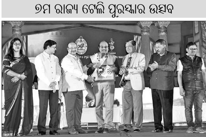
୭ମ ରାଜ୍ୟ ଚଳିତ ପୁରସ୍କାର ଉତ୍ସବ

ଓଡ଼ିଆ ଭାଷା, ସାହିତ୍ୟ ଓ ସଂସ୍କୃତି ବିଭାଗ ପକ୍ଷରୁ ଶୁକ୍ରବାର ଉତ୍କଳ ମଣ୍ଡଳରେ ୭ମ ରାଜ୍ୟ ଚଳିତ ପୁରସ୍କାର ଉତ୍ସବ-୨୦୧୮ ଅନୁଷ୍ଠିତ ହୋଇଯାଇଛି।