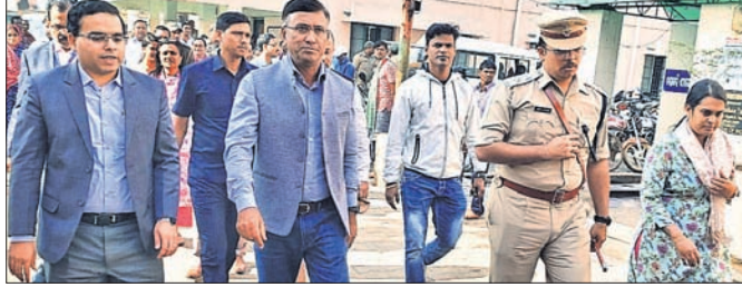
ମେଡିକାଲ କଲେଜରେ ମୁଖ୍ୟ ଶାସନ ସଚିବ, ଜିଲାପାଳ, ଏସ୍ପି ଓ ଅନ୍ୟମାନେ।