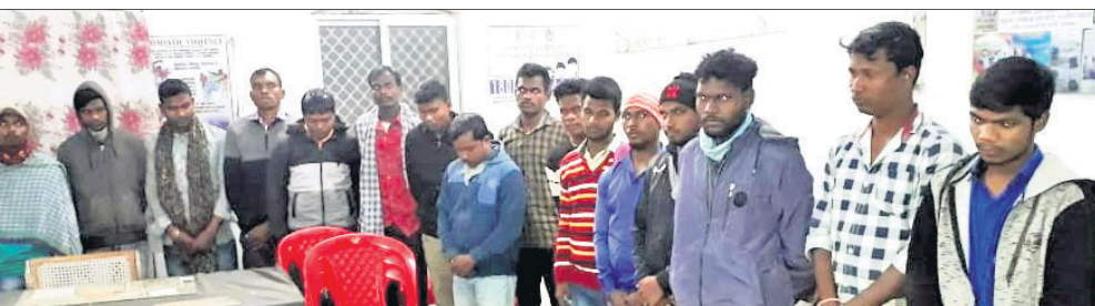
ଗିରଫ ୩ ଲକ୍ଷର ମ୍ୟାନେଜର ଓ ମୁଦ୍ରକମାନେ।

ବାରମ୍ବାର ଅଧିକ, ୨୧.୧୨ ମୟୂରଭଞ୍ଜ ଜିଲ୍ଲା ବାରିପଦା ସହର ଜନଗହଳପୂର୍ଣ୍ଣ ବଜୁଲି ମାର୍କେଟରେ ଥିବା ୩ଟି ଲକ୍ଷରେ ଦେହ ବେପାର ଭଳି ଅନୈତିକ କାର୍ଯ୍ୟ ଚାଲିଥିବା ସନ୍ଦେହରେ ସ୍ଥାନୀୟ ଟାଉନ ଥାନା ପୋଲିସ୍ ଶନିବାର ଚଢ଼ାଉ କରିଥିଲା। ସେଠାରୁ ଧରାପଡ଼ିଥିବା ୩୨ ମୁଦ୍ରକମୁଦ୍ରକ ସମେତ ହୋଟେଲ ମ୍ୟାନେଜର ଓ କର୍ମଚାରୀଙ୍କୁ ପଚରାଉଚୁରା ପରେ ଏକ ବଡ଼ଧରଣ ଅନୈତିକ କାର୍ଯ୍ୟର ପର୍ଯ୍ୟାପ୍ତ ହୋଇଛି। ଏହି ଘଟଣାରେ ପୋଲିସ୍ ଇମୋରାଲ ଗ୍ରାମିକ ପ୍ରିଭେଟସନ