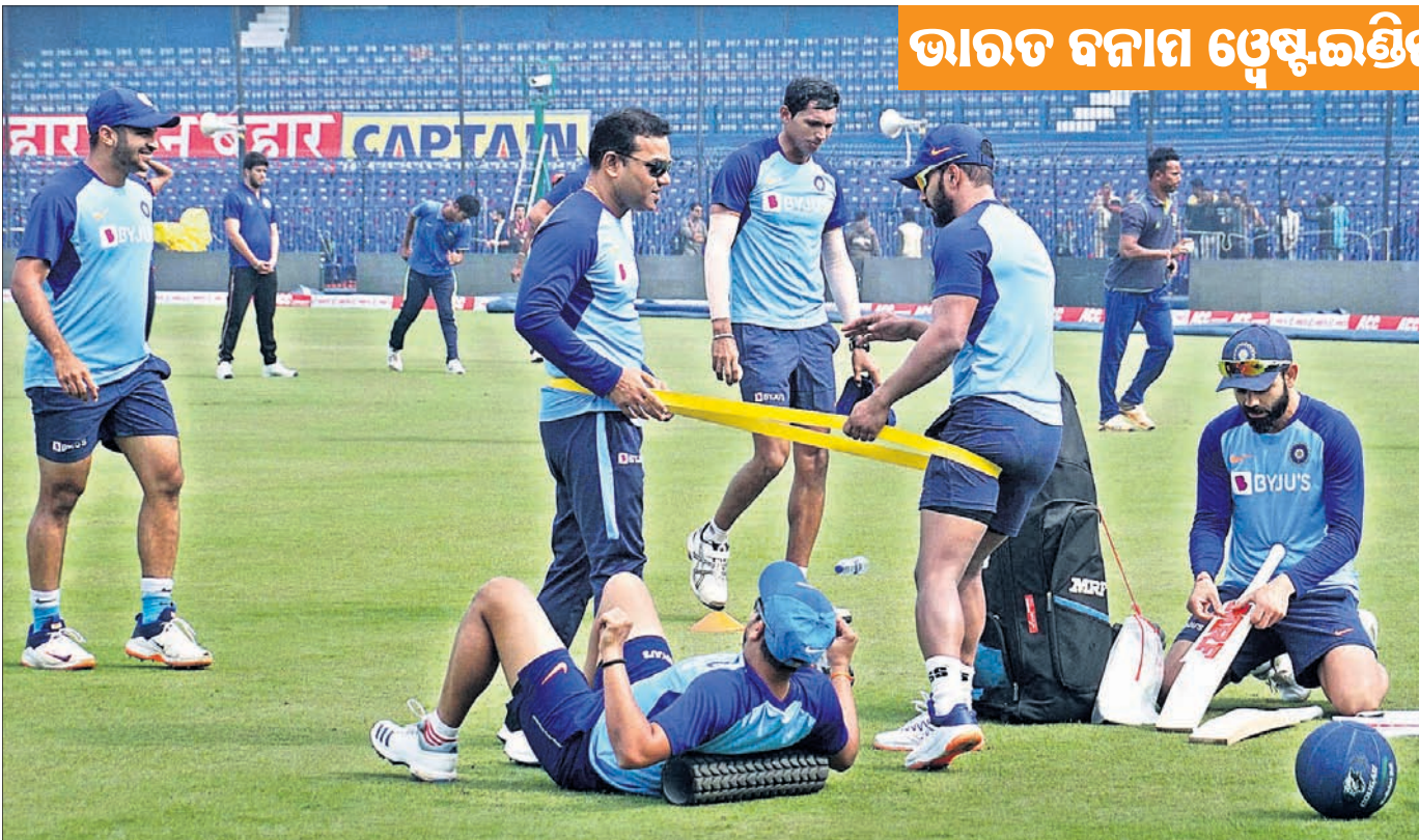
ଭାରତ ବନାମ ଫ୍ରେଣ୍ଡ୍‌ଲିକ୍

ଐତିହାସିକ ବାରବାଟୀ ଏବେ ଚଳଚ୍ଚଳ। ସମ୍ପୂର୍ଣ୍ଣ ନୂଆ ରୂପରେ ସଜେଇ ହୋଇଛି ଏହି ସ୍ଥଳୀ। ବୁଲ୍ ବର୍ଷ ବ୍ୟବଧାନରେ ଏଠାରେ ଆୟୋଜିତ ହେବାକୁ ଯାଉଛି ଏକ ଅନ୍ତର୍ଜାତୀୟ ଏକଦିବସୀୟ କ୍ରିକେଟ ମ୍ୟାଚ୍। ରବିବାର ଏଠାରେ ଅନୁଷ୍ଠିତ ହେବ ଭାରତ-ଫ୍ରେଣ୍ଡ୍‌ଲିକ୍ ଟୁରାମ୍, ଦିନିକିଆ। ଚଳିତ ସିରିଜର ଏହା ନିର୍ଣ୍ଣାୟକ ମ୍ୟାଚ୍ ହୋଇଥିବାରୁ ଦର୍ଶକଙ୍କ ମଧ୍ୟରେ ନାହିଁ ନଥିବା ଉତ୍ସାହ। ଅନ୍ତର୍ଜାତୀୟ ମ୍ୟାଚ୍ ପାଇଁ ଏବେ ଏଠାରେ ନାମା ଖେଳାଳି, ଅଧିକାରୀ ଓ ଦେଶ ବିଦେଶର ଖବରଦାତାଙ୍କ ସମାଗମ। ଭାରତୀୟ କ୍ରିକେଟ କର୍ମାଳୟ ବୋର୍ଡ ସଭାପତି ସୌରଭ ଗାଙ୍ଗୁଲି ମଧ୍ୟ ମ୍ୟାଚ୍ ସମୟରେ ଉପସ୍ଥିତ ରହିବେ ବୋଲି ଓଡ଼ିଶା କ୍ରିକେଟ ଆସୋସିଏଶନ ପକ୍ଷରୁ ସୂଚନା ଦିଆଯାଇଛି। କ୍ରିକେଟର ଏହି ମହାମେଳାକୁ ଉପଭୋଗ କରିବାକୁ ଉତ୍ସାହ ସହ ଗର୍ହି ରହିଛନ୍ତି ବାରବାଟୀ ଦର୍ଶକ। ଅନୁଭବ ଚିକେଟ ୨ ଘଣ୍ଟାରେ ଏବଂ କାଉଣ୍ଟର ଚିକେଟ ଗୋଟିଏ ଦିନରେ ଶେଷ ହୋଇଛି। ତେଣୁ ମ୍ୟାଚ ପ୍ରତି ଦର୍ଶକଙ୍କର ଆଗ୍ରହ ଏଥିରୁ ସ୍ପଷ୍ଟ ହୋଇ ଯାଉଛି। ମ୍ୟାଚକୁ ଶୁଣାଳିତ ଏବଂ ସ୍ମରଣୀୟ କରିବା ପାଇଁ ଓଡ଼ିଶା କ୍ରିକେଟ ଆସୋସିଏଶନ ପକ୍ଷରୁ ସମସ୍ତ