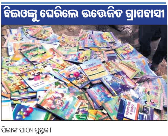
ପିଲାଙ୍କ ପାଠ୍ୟ ପୁସ୍ତକ ।