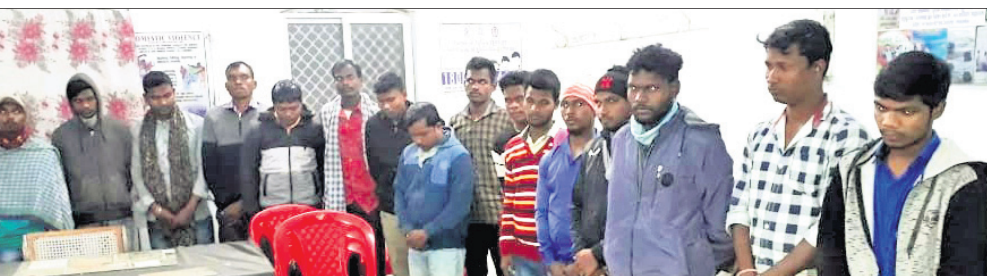
ଗିରଫ ୩ ଲକ୍ଷ ମ୍ୟାନେଜର ଓ ମୁଦ୍ରକମାନେ।