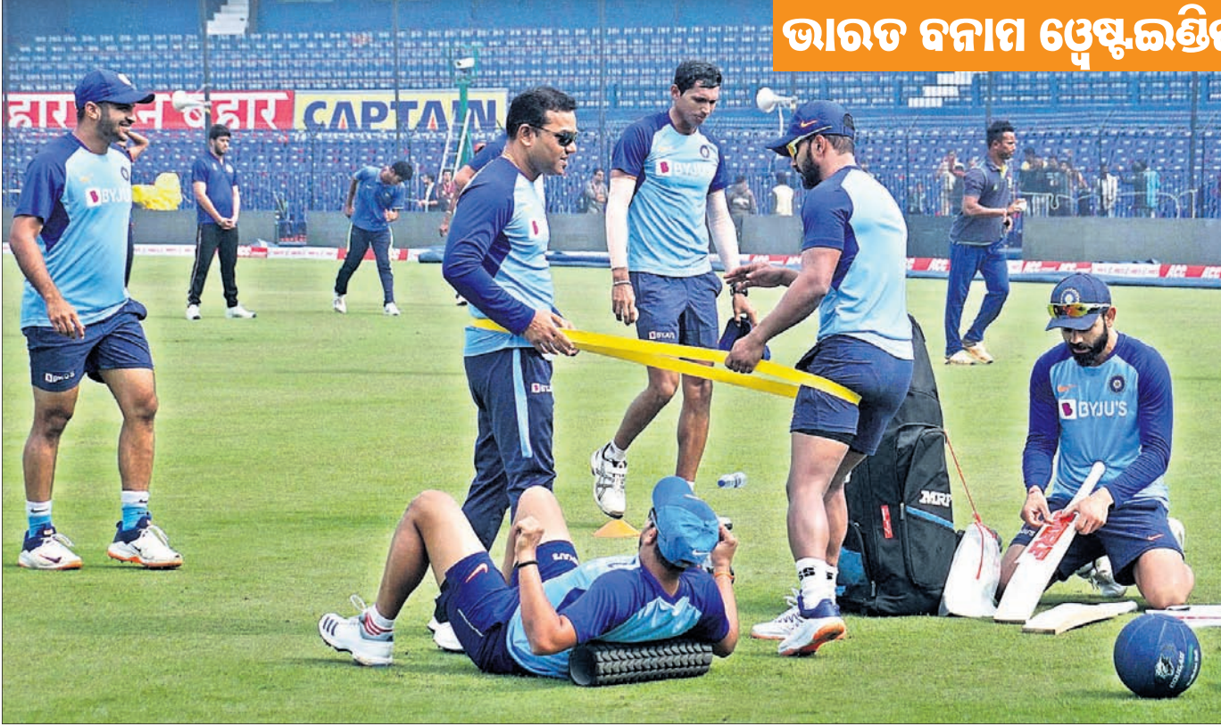
ଭାରତ ବନାମ ଫ୍ରେଣ୍ଡ୍‌ସ୍ ଟୁରାମ୍

ଐତିହାସିକ ବାରବାଟୀ ଏବେ ଚଳଚ୍ଚିତ୍ର। ସମସ୍ତଙ୍କୁ ନୂଆ ରୂପରେ ସଜେଇ ହୋଇଛି ଏହି ସ୍ଥଳୀରେ। ବୁଦ୍ଧବର୍ଷ ବ୍ୟବଧାନରେ ଏଠାରେ ଆୟୋଜିତ ହେବାକୁ ଯାଉଛି ଏକ ଅନ୍ତର୍ଜାତୀୟ ଏକଦିନିଆ ଟିକେଟ ମ୍ୟାଚ। ରବିବାର ଏଠାରେ ଅନୁଷ୍ଠିତ ହେବ ଭାରତ-ଫ୍ରେଣ୍ଡ୍‌ସ୍ ଟୁରାମ୍, ଦିନିକିଆ। ଚଳିତ ସିରିଜର ଏହା ନିର୍ଣ୍ଣାୟକ ମ୍ୟାଚ ହୋଇଥିବାରୁ ଦର୍ଶକଙ୍କ ମଧ୍ୟରେ ନାହିଁ ନଥିବା ଉତ୍ସାହ। ଅନ୍ତର୍ଜାତୀୟ ମ୍ୟାଚ ପାଇଁ ଏବେ ଏଠାରେ ନାମା ଖେଳାଳି, ଅଧିକାରୀ ଓ ଦେଶ ବିଦେଶର ଖବରଦାତାଙ୍କ ସମାଗମ। ଭାରତୀୟ ଟିକେଟ କର୍ମଚାରୀ ବୋର୍ଡ ସଭାପତି ସୌରଭ ଗାଙ୍ଗୁଲି ମଧ୍ୟ ମ୍ୟାଚ ସମୟରେ ଉପସ୍ଥିତ ରହିବେ ବୋଲି ଓଡ଼ିଶା ଟିକେଟ ଆୟୋଜିତ ମ୍ୟାଚ ପ୍ରସ୍ତୁତ ହେବାକୁ ସୂଚନା ଦିଆଯାଇଛି। ଟିକେଟର ଏହି ମହାମେଳାକୁ ଉପଭୋଗ କରିବାକୁ ଉତ୍ସାହର ସହ ଗର୍ଭି ରହିଛନ୍ତି ବାରବାଟୀ ଦର୍ଶକ। ଅନୁଲୋକନ ଟିକେଟ ୨ ଘଣ୍ଟାରେ ଏବଂ କାଉଣ୍ଟର ଟିକେଟ ଗୋଟିଏ ଦିନରେ ଶେଷ ହୋଇଛି। ତେଣୁ ମ୍ୟାଚ ପ୍ରତିଦର୍ଶକଙ୍କର ଆଗ୍ରହ ଏଥିରୁ ସ୍ପଷ୍ଟ ହୋଇ ଯାଉଛି। ମ୍ୟାଚକୁ ଶୁଣାକିତ ଏବଂ ସ୍ମରଣୀୟ କରିବା ପାଇଁ ଓଡ଼ିଶା ଟିକେଟ ଆୟୋଜିତ ମ୍ୟାଚ ପ୍ରସ୍ତୁତ ହେବ।