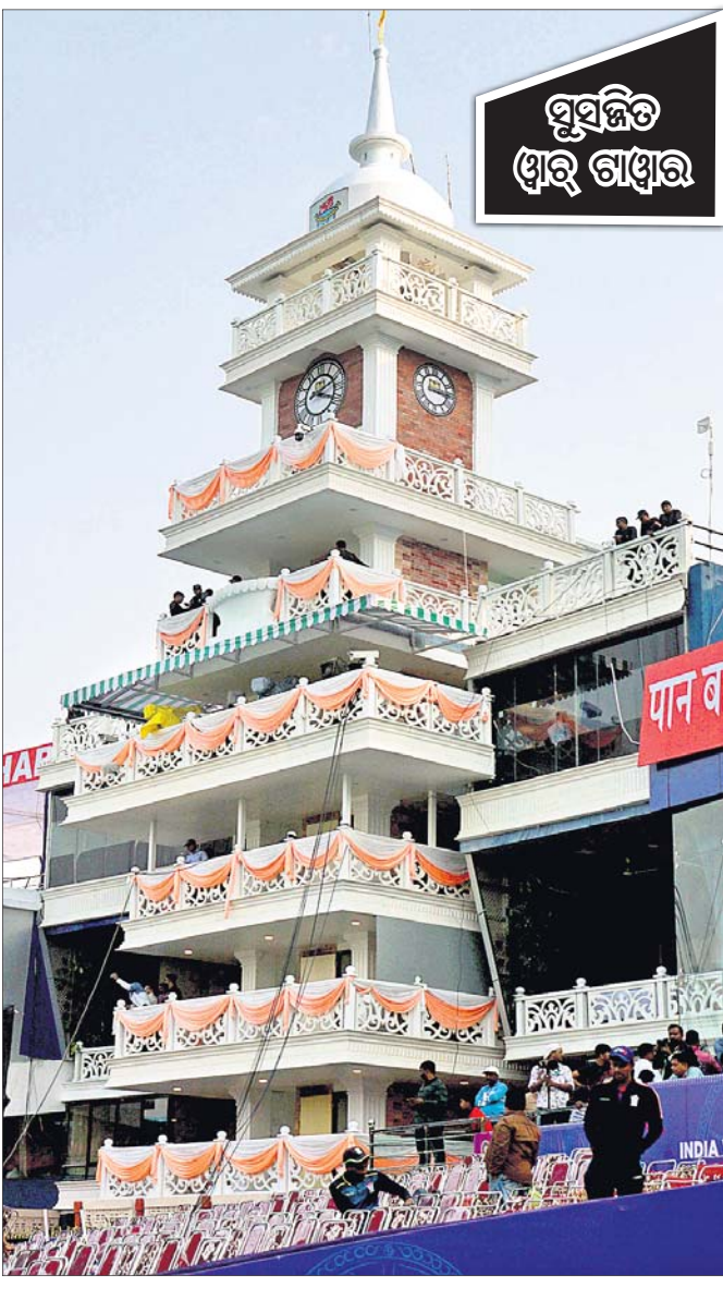
ସୁସଜ୍ଜିତ ଓଡ଼ିଶା ଷ୍ଟାଡିୟମ

ଫ୍ରେଣ୍ଡ୍‌ସ୍ ଓଷ୍ଟ୍ରେଲିଆ ଗତ ୧୩ ବର୍ଷ ଧରି ଭାରତ ବିପକ୍ଷରେ ଦ୍ଵିଦିନୀ ଦିନିକିଆ କ୍ରିକେଟ୍ ବିଜୟ ଜିତି ପାରିନାହିଁ । ଏବେ ଦଳ ପାଇଁ ସୁବର୍ଣ୍ଣ ସୁଯୋଗ ଆସିଛି । ଏହାର ସପ୍ତପଯୋଗ କରି ଦଳ ଏହି ଧାରା ଭାଙ୍ଗିବା ଲକ୍ଷ୍ୟରେ ରହିଛି । ବାରବାଟୀରେ ୨ ବର୍ଷ ପୂର୍ବରୁ ଏକ ଦିନିକିଆ ଅନ୍ତର୍ଜାତୀୟ ମ୍ୟାଚ ଅନୁଷ୍ଠିତ ହୋଇଥିଲା । ସେଥିରେ ଭାରତ ଇଂଲଣ୍ଡକୁ ୧୫୫ ରନରେ ଭାରତ ପରାସ୍ତ କରିଥିଲା ।