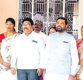
ବୈଠକ ବର୍ତ୍ତନ କରିବାହାରକୁ ଚାଲିଥିବା ବିଧାୟକ ଓ ଅନ୍ୟମାନେ ।

ମନ୍ତ୍ରୀ ଜଗନ୍ନାଥ ସାରକାଙ୍କ ଉପସ୍ଥିତିରେ ଏହି ବୈଠକ ହୋଇଥିଲା । ଏଥିରେ କୁହାଯାଇ ନାହିଁ । ଜିଲ୍ଲା ପ୍ରାସାଶନ ଶାସକ ଦଳର ଉଚ୍ଚତର କାର୍ଯ୍ୟକ୍ରମକୁ ଭାଙ୍ଗିବା ଓ କଂଗ୍ରେସର ନିର୍ବାଚିତ ପ୍ରତିନିଧିଙ୍କୁ କୌଣସି ଉନ୍ନତ କାର୍ଯ୍ୟ କରିବା ପାଇଁ ସୁଯୋଗ ମିଳୁନାହିଁ ବୋଲି ସେ ଅଭିଯୋଗ କରିଥିଲେ । ପ୍ରତିନିଧିମାନେ କ୍ଷମ ଚାହା କରିବା ପରେ ଯୋଜନା କମିଟି ବୈଠକ ଚାଲିଥିଲା । ଗଜପତି ଜିଲ୍ଲା ଯୋଜନା ବୋର୍ଡ ଅଧ୍ୟକ୍ଷ ତଥା ଜନକାଠି ବିଭାଗ