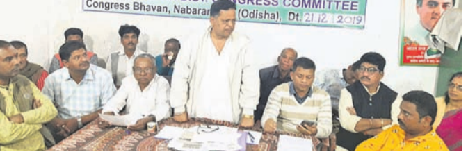
ଖବରଦାତା ସମ୍ମିଳନୀରେ କଂଗ୍ରେସ ନେତାମାନେ ।