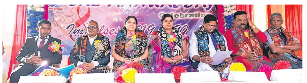
ମାଷାସାନ ଅତିଥିମାନେ ।