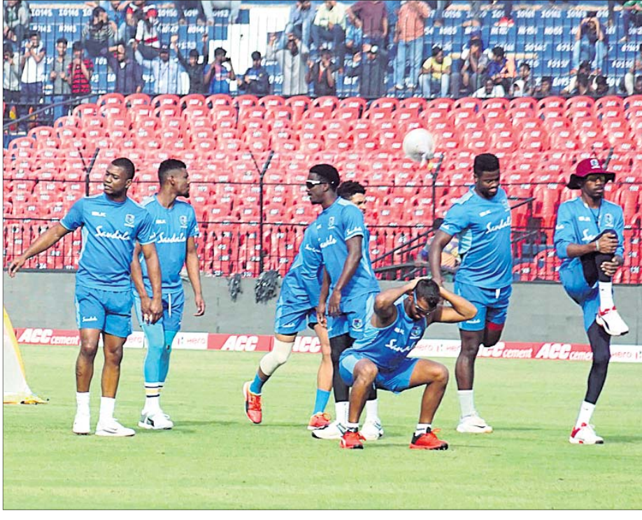
ଅଭ୍ୟାସ ସେସନ ଅବସରରେ ଫ୍ରେଣ୍ଡ୍‌ସ୍ ଓଷ୍ଟ୍ରେଲିଆରେ ।