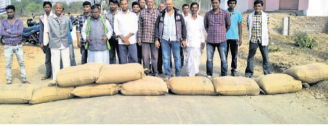
ଚାଷୀମାନେ ଧାନ ବସ୍ତ୍ରା ରଖି ରାସ୍ତା ଅବରୋଧ କରିଛନ୍ତି ।

ନବରଙ୍ଗପୁର ଜିଲ୍ଲା ଚନ୍ଦ୍ରାହାଣ୍ଡି ଧାନପର୍ଲିରେ ଚାଷୀ ଧାନ ଆଣି ୩ ଦିନ ହେଲା ଓଜନ କରାଯାଇ ନ ଥିବାରୁ ଏଥିପାଇଁ ବହୁ ଚାଷୀ ଚନ୍ଦ୍ରାହାଣ୍ଡି-ଉତ୍ତରକୋଟି ରାସ୍ତା ଉପରେ ଧାନ ବସ୍ତ୍ରା ରଖି ଅବରୋଧ କରିଥିଲେ । କିଛି ଚାଷୀ ସେମାନଙ୍କ ଧାନ ଠିକ ସମୟରେ ଓଜନ ହୋଇ ନ ପାରିବାରୁ କିଛି ଧାନବସ୍ତ୍ରା ଗୋଡ଼ି ହୋଇଯାଇଥିବାରୁ ଅଭିଯୋଗ କରିଥିଲେ । ମୁଖ୍ୟ ରାସ୍ତା ଅବରୋଧ ପରେ କିଛି ଘଣ୍ଟା ରାସ୍ତା ଉଭୟ ଦାକ୍ଷିଣ୍ୟରେ ଗାଡ଼ି ଚଳାଚଳ ହୋଇ ନ ପାରି ଅତି ରହିଥିବା