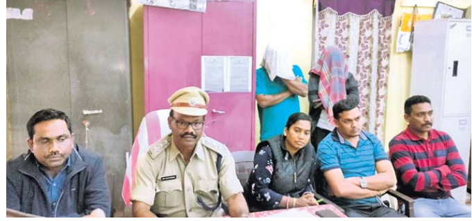
ପୋଲିସର ଖବରଦାତା ସମ୍ମିଳନୀରେ ଗିରଫ ହୁଏ ଅଭିଯୁକ୍ତ ।