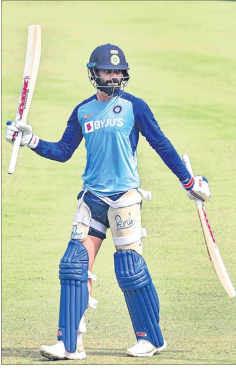
ନେଟ୍‌ସ୍‌କୁ ବ୍ୟାଟିଂ କରିବାକୁ ଯାଉଛନ୍ତି ଭାରତୀୟ ଅଧିନାୟକ ବିରାଟ କୋହଲି ।