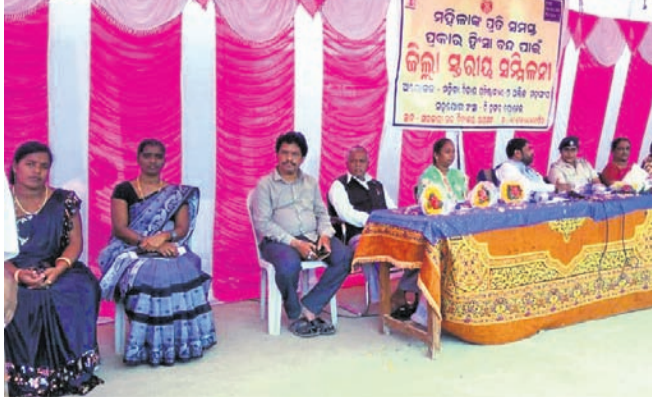
ସମ୍ମିଳନୀରେ ଉପସ୍ଥିତ ଅତିଥିମାନେ ।

ପରୁ ବିଧାୟକ ଏବଂ ଜିଲ୍ଲା ପରିଷଦ ସଭ୍ୟ ମାନଙ୍କୁ ଅଣଦେଖା କରାଯିବା ସହ ସେମାନଙ୍କୁ କୌଣସି ପ୍ରକୃତ ବିଷୟରେ କୁହାଯାଇ ନାହିଁ । ପ୍ରାସାଶନ ଶାସକ ଦଳର ଉଚ୍ଚତର କାର୍ଯ୍ୟକ୍ରମକୁ ଭାଙ୍ଗିବା ଓ କଂଗ୍ରେସର ନିର୍ବାଚିତ ପ୍ରତିନିଧିଙ୍କୁ କୌଣସି ଉନ୍ନତ କାର୍ଯ୍ୟ କରିବା ପାଇଁ ସୁଯୋଗ ମିଳୁନାହିଁ ବୋଲି ସେ ଅଭିଯୋଗ କରିଥିଲେ । ପ୍ରତିନିଧିମାନେ କ୍ଷମ ଚାହା କରିବା ପରେ ଯୋଜନା କମିଟି ବୈଠକ ଚାଲିଥିଲା । ଗଜପତି ଜିଲ୍ଲା ଯୋଜନା ବୋର୍ଡ ଅଧ୍ୟକ୍ଷ ତଥା ଜନକାଠି ବିଭାଗ