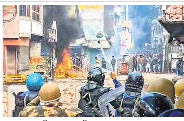
ମୁସିର ରାମପୁରରେ ବିଶୋଭାବେଳେ ଯୋଡ଼ାଜଳା।

ଲାଠିଚାରୀ କରୁଥିଲା। ଫକରେ ଦଳାତକଟାରେ ଗୁରୁତର ଆହତ ସାଗିରଙ୍କୁ ହସ୍ପିଟାଲରେ ଭର୍ତ୍ତି କରାଯାଇଥିବାବେଳେ ଶନିବାର ତାଙ୍କର ମୃତ୍ୟୁ ଘଟିଛି।