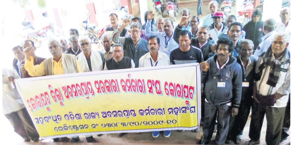
ଜିଲ୍ଲାପାଳଙ୍କୁ ଦାବିପତ୍ର ଦେବାକୁ ଆସିଥିବା ଅବସରପ୍ରାପ୍ତ ସରକାରୀ କର୍ମଚାରୀ ।