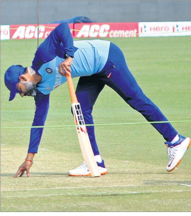
ଭାରତୀୟ ଦଳର ଜଣେ ସପୋର୍ଟିଂ ଷ୍ଟାଫ୍ ପିଟ୍ ନିରାକ୍ଷଣ କରୁଛନ୍ତି ।