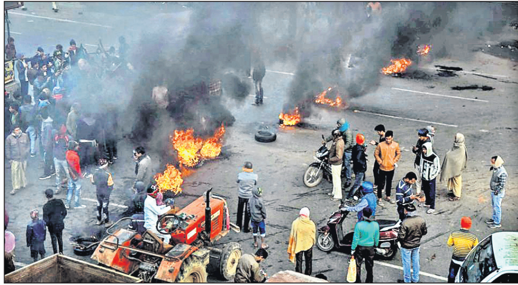
କାନପୁରରେ ବିଶୋଭାବେଳେ ଯୋଡ଼ାଜଳା।

ସଂଖ୍ୟାଧିକ ନାଗରିକଙ୍କ ଆଇନ (ସିଏଏ) ବିରୋଧୀ ଆନ୍ଦୋଳନ ହିଂସ୍ର ହେବାରେ ଲାଗିଛି। ଉତ୍ତରପ୍ରଦେଶରେ ବିଶୋଭା ହିଂସାରେ ୩ ଦିନରେ ୧୬ ଜଣଙ୍କ ଜୀବନ ଗଲାଣି।