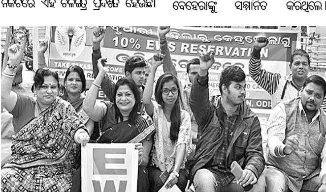
୧୦% ଗରିବ ଆଧାରିତ ଆରକ୍ଷଣ ରାଜ୍ୟରେ ତୁରନ୍ତ ଲାଗୁ ଦାବିରେ ରବିବାର ଗ୍ରାନ୍ତିଦାତା ସମ୍ମାନ ପକ୍ଷରୁ ଲୋଭରେ ପିଏମ୍‌କିରେ ବିକ୍ଷୋଭ କରାଯାଇଛି ।