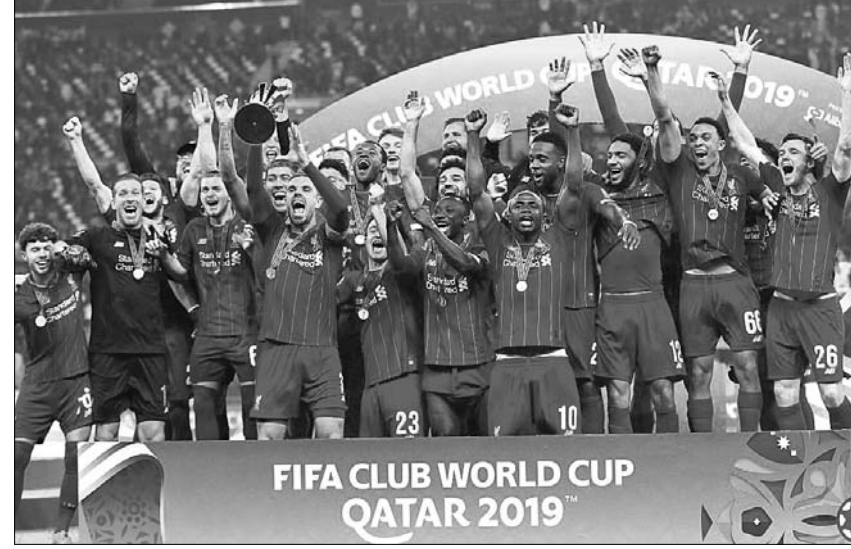
ଫିଫା କ୍ଲବ୍ ବିଶ୍ୱକପ୍ ଚାମ୍ପିୟନ ଲିଭରପୁଲ୍ ଦଳ

କରିଛନ୍ତି। ଅସମାପ୍ତ ଦ୍ୱିତୀୟ ଟେଷ୍ଟ ମ୍ୟାଚରେ ଓଡ଼ିଶା ଏଫ୍ ସି ପରାସ୍ତ ହୋଇଛି।