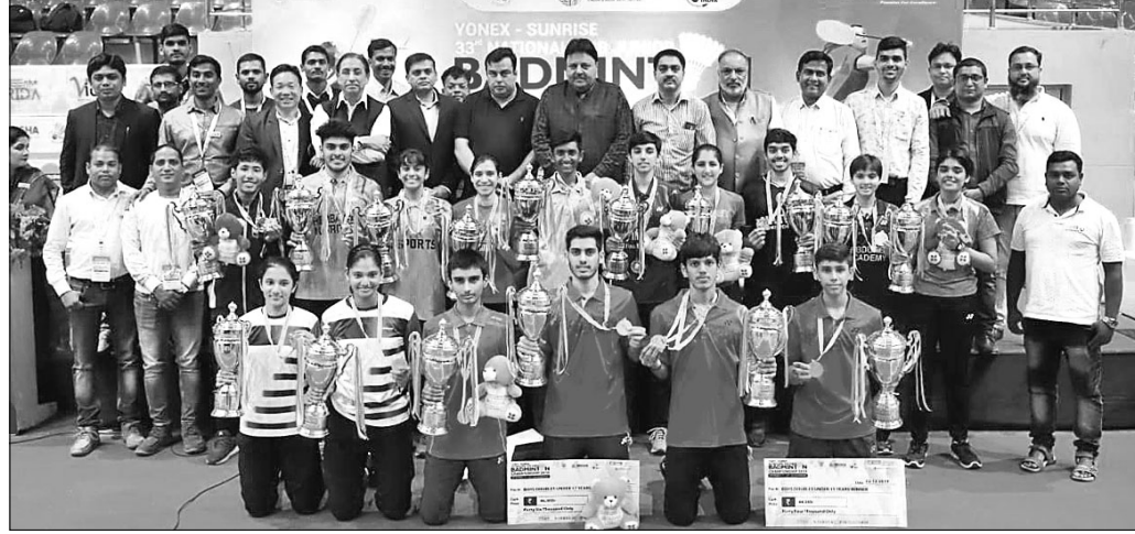
ତ୍ରୁଟି ସହ ଅତିଥିକ ଗହଣରେ କୃତା ପ୍ରତିଯୋଗୀ

ଗ୍ଲାନାୟ ଲକ୍ଷ୍ମୀନଗର ରେଲୱେ ଇନ୍‌ଡୋର ଷ୍ଟାଡ଼ିୟମରେ ଯୋଜନା କରାଯାଇଥିବା ଏହି ମ୍ୟାଚରେ ଓଡ଼ିଶା ଏଫ୍ ସି ପରାସ୍ତ ହୋଇଛି।