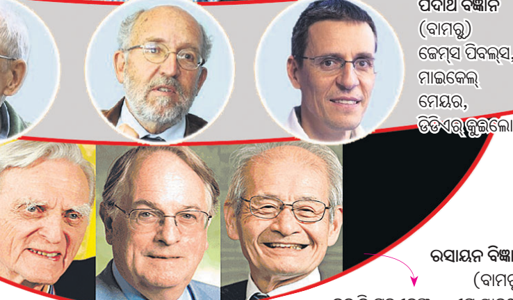
ପଦାର୍ଥ ବିଜ୍ଞାନ (ବାମକୁ) କେମ୍‌ସ୍ ପିବଲ୍‌ସ୍, ମାଇକେଲ୍ ମେୟର, ଡିଭିଏଲ୍‌ଜୁଜିଲୋର୍

ନିକଟରେ ଅଷ୍ଟ୍ରେଲିଆସ୍ଥିତ ମେଲବୋର୍ନ ମୁନିକର୍ସ୍‌ଟିର ବିଶେଷଜ୍ଞଙ୍କ ଦ୍ୱାରା ହୋଇଥିବା ସର୍ବେକ୍ଷଣ କରାଯାଇଛି ଯେ, ରୋଟାଭାଇରସ୍ ଇନ୍‌ଫେକ୍ସନ ମଧ୍ୟ ଟାଇପ-୧ ଡାଇବେଟିସ୍ ପାଇଁ ଦାୟୀ।