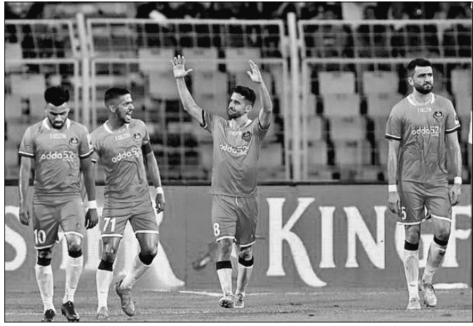
ଗୋଲ ପରେ ଉଲ୍ଲାସରେ ଖେଳା ଖେଳାଳି

ମାରଗାଓ, ୨୨।୧୨(ପି.ଟି.) ଚଳିତ ଲକ୍ଷ୍ମୀନଗର ଫୁଟବଲ ଲିଗ୍ (ଆଇଏସଏଲ)ର ଏକ ଗୁରୁତ୍ୱପୂର୍ଣ୍ଣ ମ୍ୟାଚରେ ଓଡ଼ିଶା ଏଫ୍ ସି ପରାସ୍ତ ହୋଇଛି।