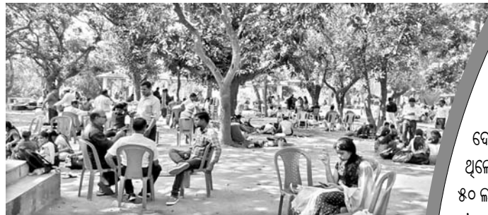
ପର୍ଯ୍ୟଟକମାନଙ୍କୁ ଉପଯୁକ୍ତ ସୁବିଧା ପ୍ରଦାନ କରିବା ପାଇଁ ପ୍ରଶାସନ ଚେଷ୍ଟା କରୁଛି ।