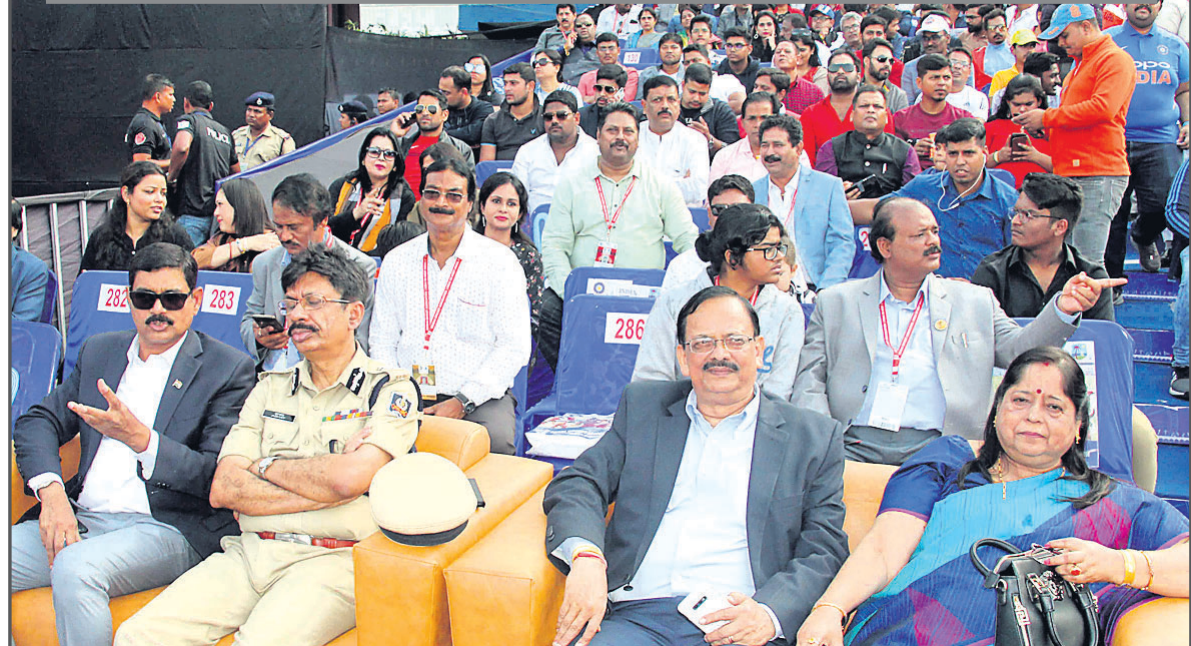
ମ୍ୟାର ଅବସରରେ ଉପସ୍ଥିତ ବିଶିଷ୍ଟ ବ୍ୟକ୍ତିମାନେ।

ଆତସବାଜିରେ ଜର୍ସିଲା କଟକ ବାରବାଟୀ ଷ୍ଟାଡ଼ିୟମରେ ରବିବାର ଭାରତ ବିଜୟଲାଭ କରିବା ପରେ କଟକ ଆତସବାଜିରେ କମ୍ପିଥିଲା। ଲୋକେ ବାଣୀ ପୁରୀରୁ ଭାରତର ବିଜୟକୁ ପାଳନ କରିଥିଲେ। ତେବେ ଏହି ମ୍ୟାର ପାଇଁ କଟକ ସହର ରାସ୍ତା ଶୁନ୍ୟରେ ହୋଇପଡ଼ିଥିଲା। ବିଶେଷକରି କଟକରେ ଖେଳ ଚାଲିଥିବାକୁ କଟିକିଆ ଏହି ମ୍ୟାରକୁ ମନଭରି ଉପଭୋଗ କରିଥିଲେ। ଯେଉଁଠି ଚିଲି ଲାଗିଥିଲା ସେଠି ଭିଡ଼ ପରିଲକ୍ଷିତ ହେଉଥିଲା।