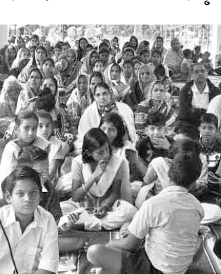
ଉତ୍ସବରେ ଯୋଗଦେଇଥିବା ଭକ୍ତମାନେ ।

ବୋଲଗଡ଼ ବ୍ଲକ୍ ଚିକିତ୍ସାଳୟରେ ଶ୍ରୀରାମକୃଷ୍ଣ ସେବାଶ୍ରମରେ ଉଦ୍‌ଯାପିତ ମା' ସାରଦାଦେବୀଙ୍କ ୧୫୦ତମ ଜନ୍ମଦିନ ଉତ୍ସବ ପାଳିତ ହୋଇଯାଇଛି ।