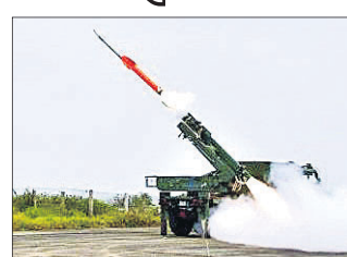
ବାଲେଶ୍ୱର ଅଫିସ୍, ୨୩।୧୨

ବାଲେଶ୍ୱର ଜିଲ୍ଲା ଚାନ୍ଦିପୁରସ୍ଥିତ ଆଇଟିଆର(ସମ୍ବନ୍ଧିତ ପରୀକ୍ଷଣ କେନ୍ଦ୍ର) ପରିସର ୩ ନମ୍ବର ଲକ୍ଷ୍ୟପାତ୍ରକୁ ପୂର୍ବଦି ୧୧ଟି ୪୫ ମିନିଟରେ ସ୍ୱଳ୍ପ ଦୂରତାମାନ କୁମ୍ଭୀର-ଏସ୍ଏମ୍ ସେପଟାସ୍ତର ପରୀକ୍ଷଣ କରାଯାଇଛି। ଏକ ଟ୍ରକରେ ଲାଗିଥିବା କାନିଷ୍ଠରୁ ଏହି ସେପଟାସ୍ତରକୁ ଭୁସ୍ତରୁ ଆକାଶମାର୍ଗକୁ ନିକ୍ଷେପ କରାଯାଇଥିଲା। ଏହାର ଲକ୍ଷ୍ୟଭେଦ କ୍ଷମତା ୩୦ କି.ମି. ବୋଲି ତିଆରିତ (ପ୍ରତିରକ୍ଷା ବରଷଣା ଉତ୍ତରଣ ସଂପ୍ଳା)ପକ୍ଷରୁ କୁହାଯାଇଛି। ଏହା ଭାରତର ଆକାଶ ସାମାନ୍ୟତା ସେବା ଭାରତୀୟ ଆକାଶରେ ବିନା ଅନୁମତିରେ ପ୍ରବେଶ କରୁଥିବା ଶତ୍ରୁପକ୍ଷର ବିମାନ ଓ ସେପଟାସ୍ତର ଏହା ଅବିକଳ ଧ୍ୟାନ କରିଦେବ। ଏହି ସେପଟାସ୍ତର ଶତ୍ରୁପକ୍ଷର ରାଡାର, ଟ୍ୟାକ, ବକ୍ସର ଆଦିକୁ ଧ୍ୟାନ କରିବାର କ୍ଷମତା ରହିଛି ବୋଲି ତିଆରିତ ପକ୍ଷରୁ କୁହାଯାଇଛି।