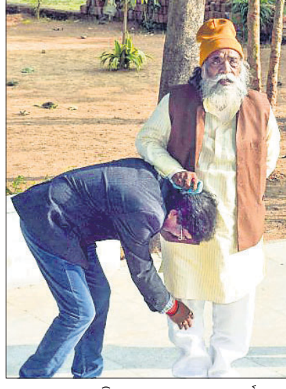
ରାଷ୍ଟ୍ରରେ ବାପା ଶିବୁ ସୋରେନଙ୍କଠାରୁ ଆଶୀର୍ବାଦ ନେଉଛନ୍ତି ଭାବେ ପୁଖ୍ୟମନ୍ତ୍ରୀ ହେମନ୍ତ ସୋରେନ।