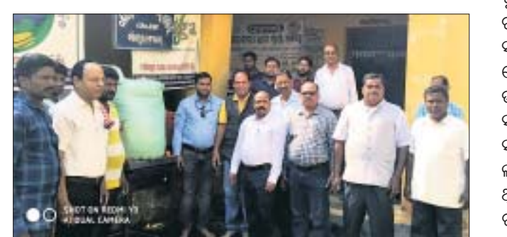
ଧାନମଣ୍ଡି ଉଦ୍ଘାଟନ ସମୟରେ ଉପସ୍ଥିତ ଅତିଥି।

କୃଷ୍ଣଚାଖଣ୍ଡି ବ୍ଲକ ଦକ୍ଷିଣପୁର ସେବା ସମବାୟ ସମିତି ଏବଂ ଜଗଦଳପୁର ସଂଗ୍ରାମ ଆର୍ମ୍ ସହାୟିକା ସଂଘ ଚାଷୀଙ୍କଠାରୁ ଗୋକେନ ମାଧ୍ୟମରେ ଧାନ ଜିଣିବା ପାଇଁ ମଣ୍ଡି ଉଦ୍ଘାଟନ କରିଛନ୍ତି। ଉଦ୍ଘାଟନ ଦିନରେ ଜଗଦଳପୁର ସ୍ଵୟଂ ସହାୟିକା ଗୋଷ୍ଠୀ ୭ ଜଣ ଚାଷୀଙ୍କଠାରୁ ପାଖାପାଖି ୨୫୦ କୁଇଣ୍ଟାଲ ଅମଳ ଧାନ ସଂଗ୍ରହ କରିଥିବା ବେଳେ