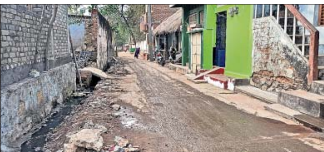
ନଷ୍ଟ ହୋଇଯାଇଥିବା କେନ୍ଦ୍ରୀୟ ବିଦ୍ୟାଳୟ ରାସ୍ତା।

ଦିଗପହଣ୍ଡି, ୨୩।୧୨ (ଡି.ଏନ.ଏ.): ଦିଗପହଣ୍ଡି ଏନ୍.ଏସି ୨ ନଂ. ଖର୍ଚ୍ଚ ଅଧୀନ କରଣ ସାହିତ୍ୟ କେନ୍ଦ୍ରୀୟ ବିଦ୍ୟାଳୟ ମୁଖ୍ୟରାସ୍ତା ବିପର୍ଯ୍ୟୟ ହୋଇପଡିଛି। ସବ ରେଜିଷ୍ଟ୍ରି କାର୍ଯ୍ୟାଳୟ, ବଡ଼ ଖେମୁଣ୍ଡି ହାଇସ୍କୁଲ, ଗୋପବନ୍ଧୁ ପ୍ରାଥମିକ ବିଦ୍ୟାଳୟକୁ ଏହି ରାସ୍ତା ଦେଇ ବହୁ