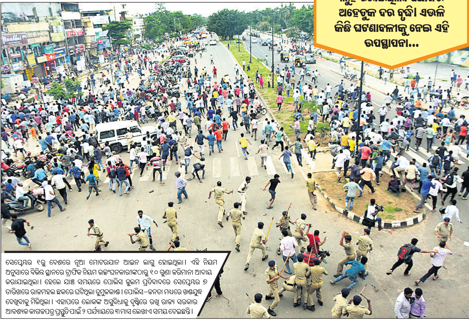
ସେପ୍ଟେମ୍ବର ୧୨ରୁ ଦେଶରେ ନୂଆ ମୋଟରଯାନ ଆଇନ ଲାଗୁ ହୋଇଥିଲା । ଏହି ନିୟମ ଅନୁସାରେ ବିଭିନ୍ନ ସ୍ଥାନରେ ଗ୍ରାମିକ ନିୟମ ଉଲ୍ଲଙ୍ଘନକାରୀଙ୍କଠାରୁ ୧୦ ଗୁଣା ଜରିମାନା ଆଦାୟ କରାଯାଇଥିଲା । ହେଲେ ଯାହା ସମୟରେ ପୋଲିସ କୁଳମ ପ୍ରତିବାଦରେ ସେପ୍ଟେମ୍ବର ୭ ତାରିଖରେ ରାଜମହଲ ଛକରେ ଘଟିଥିଲା ଚୁପ୍‌କାଣ୍ଡ । ପୋଲିସ-ଜନତା ମଧ୍ୟରେ ଖଣ୍ଡଯୁଦ୍ଧ ଦେଖିବାକୁ ମିଳିଥିଲା । ଏହାପରେ ଲୋକଙ୍କ ଅସୁବିଧାକୁ ଦୃଷ୍ଟିରେ ରଖି ରାଜ୍ୟ ସରକାର ଆବଶ୍ୟକ କାରକପତ୍ର ପ୍ରସ୍ତୁତିପାଇଁ ୨ ପର୍ଯ୍ୟାୟରେ ୩ ମାସ ଲେଖାଏ ସମୟ ଦେଇଛନ୍ତି ।