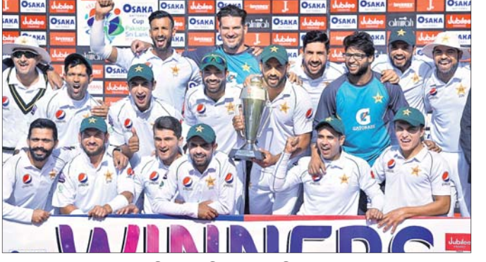
ଟ୍ରଫି ସହ ପାକିସ୍ତାନ ଖେଳାଳିମାନେ।

କରାଚୀରେ ଚାଲିଥିବା ଶ୍ରୀଲଙ୍କା ବିପକ୍ଷ ଦ୍ୱିତୀୟ କ୍ରିକେଟ ଟେଷ୍ଟ ମ୍ୟାଚରେ ପାକିସ୍ତାନ ୨୬୩ ରନରେ ସହଜ ବିଜୟ ହାସଲ କରିଛି। ଏଥିସହ ଦଳ ଦୁଇ ମ୍ୟାଚ ବିଶିଷ୍ଟ ସିରିଜ ୧-୦ରେ ଜିତିନେଇଛି।