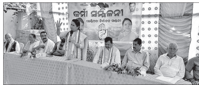
ସମ୍ମିଳନୀରେ ଉପସ୍ଥିତ ଦଳୀୟ ନେତାମାନେ।