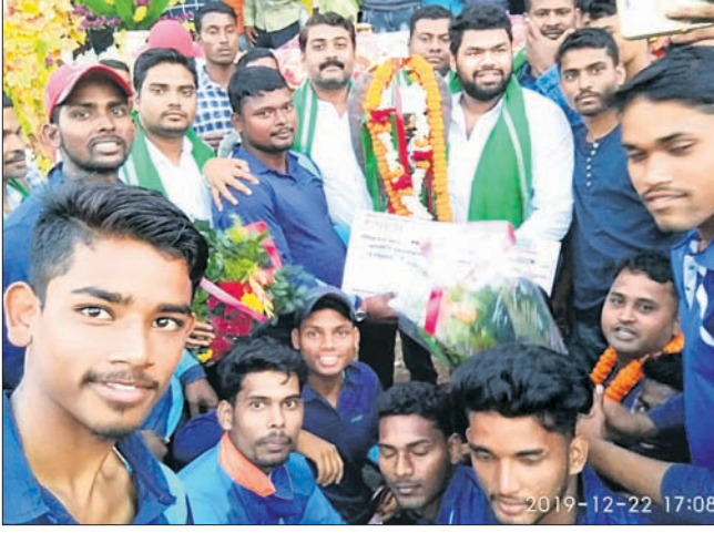
ଅତିଥିକ ସହ ଚାମ୍ପିୟନ ଦଳର ଖେଳାଳିମାନେ।