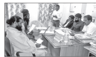
ଦେଶାତ୍ମକ ଅଫିସ, ୨୩।୧୨