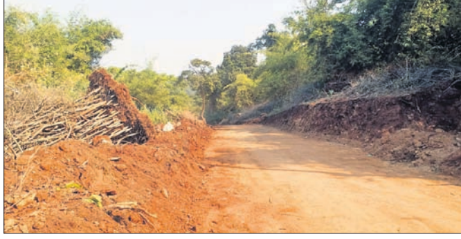
ଅଭୟାରଣ୍ୟ ମଧ୍ୟରେ ନିର୍ମାଣ କରାଯାଇଥିବା ପାର୍ଶ୍ଵ ରାସ୍ତା।

ଅନୁଗୋଳ ଜିଲ୍ଲା ସାତକୋଶିଆ ଅଭୟାରଣ୍ୟର ପୁରୁଣାକୋଟ ଥାନା ଚିକରପଡ଼ା ରେଞ୍ଜ ଅଧୀନରେ ଥିବା କୁସଖଳିଠାରୁ ଚିକରପଡ଼ା ପର୍ଯ୍ୟନ୍ତ ପୂର୍ବ ବିଭାଗ ରାସ୍ତା ପ୍ରଶସ୍ତାକରଣ କାର୍ଯ୍ୟ ବେଳେ ପାର୍ଶ୍ଵ ରାସ୍ତା ନିର୍ମାଣ ପାଇଁ ଅଭୟାରଣ୍ୟ ଆଇନ ଉଲ୍ଲଙ୍ଘନ କରାଯାଇ ଜଙ୍ଗଲରୁ ଗଛ କଟାଯାଇଥିବା ଅଭିଯୋଗ ହେଉଛି। ଏହାକୁ ନେଇ ବୁଦ୍ଧିଜୀବୀ ମହଲରେ ଅସନ୍ତୋଷ ଦେଖା ଦେଇଥିବା ବେଳେ ଠିକା ସଂସ୍ଥା କିନ୍ତୁ ବନ ବିଭାଗ ଉପରକୁ ଦୋଷ ଠେଲିଛି। ଲିଖିତ ଅନୁମତି ନ ଥିଲେ ବି ବନ ବିଭାଗ ଏଥିପାଇଁ କହିଥିବା ଠିକାସଂସ୍ଥା ପକ୍ଷରୁ କୁହାଯାଇଛି।