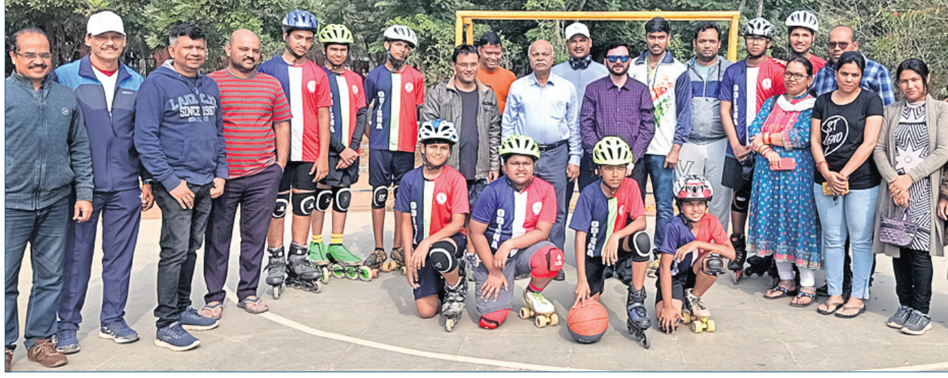
ସମ୍ବନ୍ଧିତ ହେବା ଅବସରରେ ଅତିଥି ଓ କର୍ମକର୍ତ୍ତାଙ୍କ ଗହଣରେ ଓଡ଼ିଶା ଭୂମିଧର ରୋଲ୍‌ବଲ୍ ଦଳର ଖେଳାଳିମାନେ।

ଏବଂ ୫୦ ଓଭର ଫର୍ମାଟ ପାଇଁ ଅଧିନାୟକ ମନୋନୀତ କରାଯାଇଛି। ଭାରତ ସିରିଜର ଦଳ ନ୍ୟୁଜିଲାଣ୍ଡରେ ଦୁଇ ମ୍ୟାଚ ବିଶିଷ୍ଟ ଟେଷ୍ଟ ସିରିଜ ଖେଳିବାର କାର୍ଯ୍ୟକ୍ରମ ରହିଛି।