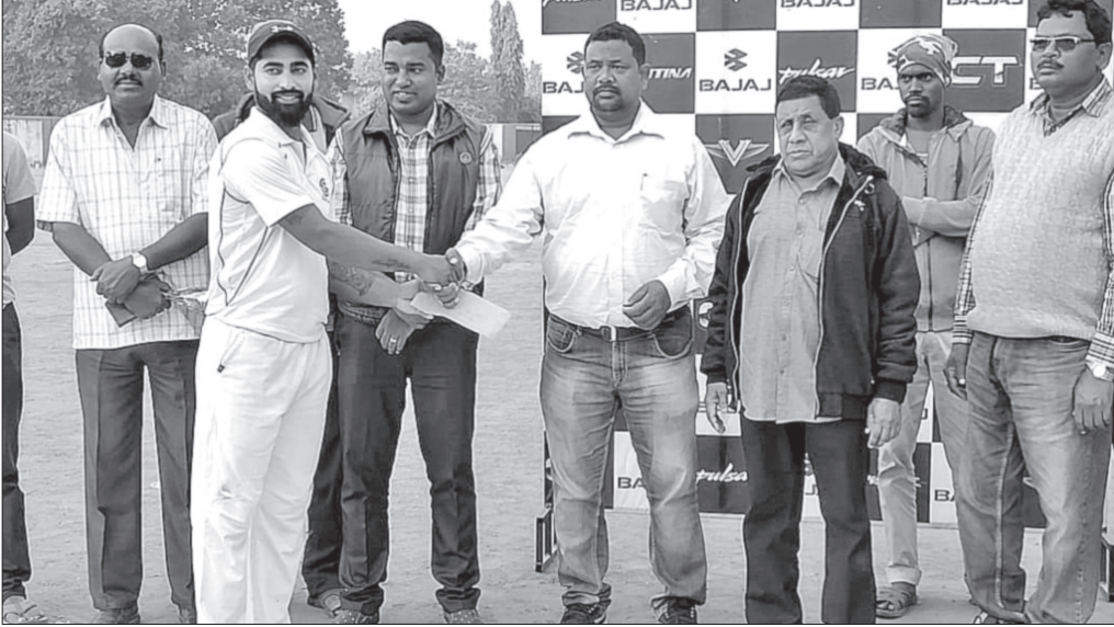
ଅତିଥି ଜଣେ ଖେଳାଳିଙ୍କୁ ପୁରସ୍କୃତ କରୁଛନ୍ତି।