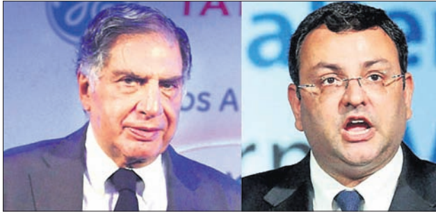
ରତନ ଟାଟା (ବାମ) ଏବଂ ସାକରସ୍ ମିସ୍ତ୍ରୀ (ଡାହାଣ)

ନ୍ୟାଶନାଲ କମ୍ପାନୀ ଲି ଆପିଲେଟ ଟ୍ରିବ୍ୟୁନାଲ୍ (ଏନ୍.ଏ.ଏ.ଟି.ଏ.ସି.) ଟାଟା ସହ ଏକ ବାଦର ସମ୍ପର୍କରେ ମାମଲା ରାୟ ପ୍ରକାଶ କରିଛନ୍ତି।