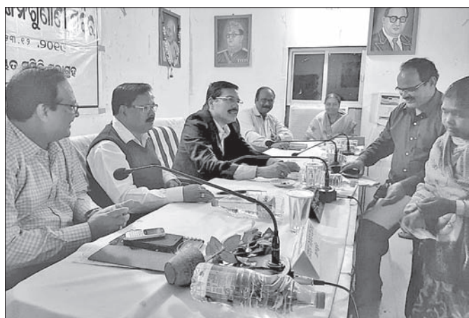
ଜନଶୁଣାଣି ଶିବିରରେ ପ୍ରଶ୍ନାତ୍ମକ ଅଧିକାରୀମାନେ।