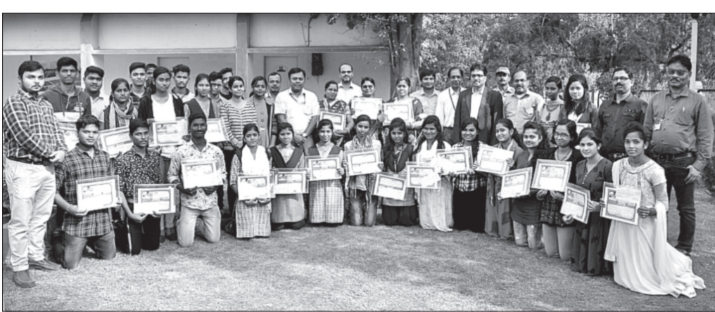
ଅତିଥିଙ୍କ ସହ ଛାତ୍ରବୃତ୍ତି ପାଇଥିବା ଛାତ୍ରାଛାତ୍ରୀମାନେ।