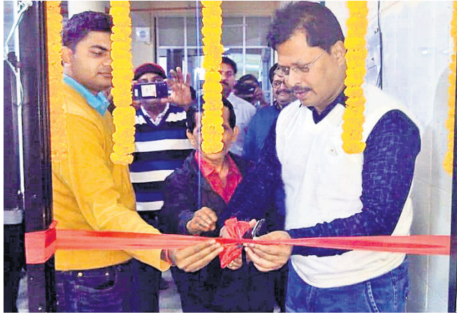
ଜିଲ୍ଲାପାଳ ଉଦ୍‌ଘାଟନ କରୁଛନ୍ତି।

ନବରଙ୍ଗପୁର ଜିଲ୍ଲା ସଦର ମହକୁମା ଡାକ୍ତରଖାନା ପରିସର ମାତୃ ଓ ଶିଶୁ ଚିକିତ୍ସା କେନ୍ଦ୍ର (ଏମସିଏଚ) କୋଠାରେ ରୋଗୀ ଓ ତାଙ୍କ ସମ୍ପର୍କୀୟଙ୍କ ପାଇଁ ବିଭିନ୍ନ ବ୍ୟବସ୍ଥା କରାଯାଇଛି।