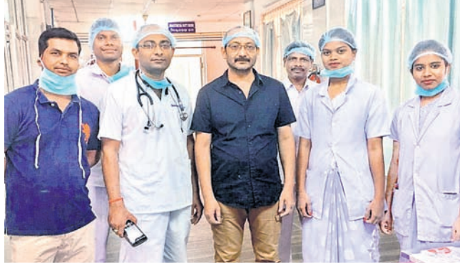
ସଫଳ ଅସ୍ତ୍ରୋପଚାର କରି ଡାକ୍ତରମାନେ ବାହାର କରିଥିବା ପଥୁରି ।