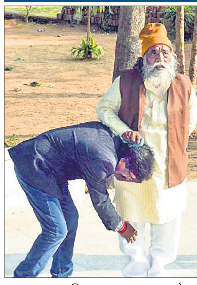
ରାଷ୍ଟ୍ରରେ ବାପା ଶିବୁ ଘୋଷେଇଙ୍କଠାରୁ ଆଶୀର୍ବାଦ ନେଉଛନ୍ତି ଭାବେ ପୁଖ୍ୟମନ୍ତ୍ରୀ ହେମନ୍ତ ଘୋଷେଇ।