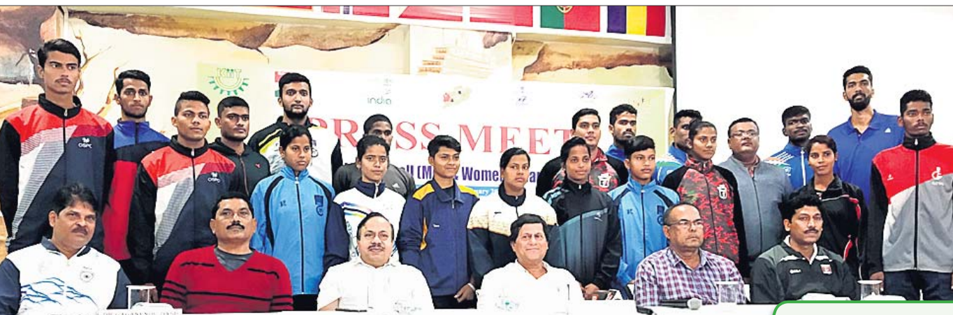
ଖବରଦାତା ସମ୍ମିଳନୀରେ ଆୟୋଜକ କମିଟି କର୍ମକର୍ତ୍ତାଙ୍କ ଗହଣରେ ଓଡ଼ିଶା ଭଲିବଲ ଦଳର ଖୋଜାଯିମାନେ।

ଓଡ଼ିଶାରେ ପ୍ରଥମଥର ପାଇଁ ଆୟୋଜନ ହେବାକୁ ଯାଉଛି ଜାତୀୟ ସିନିୟର ଭଲିବଲ (ମହିଳା, ପୁରୁଷ) ପ୍ରତିଯୋଗିତା। ପ୍ରତିଯୋଗିତାର ଏହି ୬୮ତମ ସଂସ୍କରଣ କିଏ ଇନ୍‌ଡୋର ଷ୍ଟାଡ଼ିୟମରେ ଅନୁଷ୍ଠିତ ହେବ।