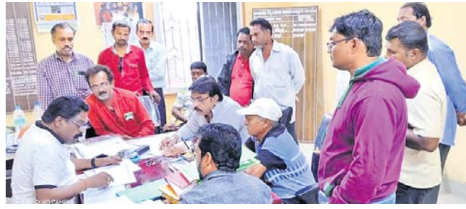
ଯୋଗାଣ ଅଧିକାରୀଙ୍କ ସହ ଆଲୋଚନା କରୁଛନ୍ତି ଚାଷୀ ।

କୋରାପୁଟ ଜିଲ୍ଲାରେ ବିହନ ନିଗମରେ ପଞ୍ଜିକୃତ ଚାଷୀଙ୍କ ମଧ୍ୟରୁ ୫୭ ଜଣଙ୍କ ନାମ ସରକାରଙ୍କ ଧାନ ବିକ୍ରୟ କେନ୍ଦ୍ର ପଞ୍ଜିକାରୁ ବାଦ୍ ପଡ଼ିଛି। ଏକଲିଅଭିଯୋଗ ନେଇ ୩୦ରୁ ଉର୍ଦ୍ଧ୍ୱ ଚାଷୀ ଯୋଗାଣ ଜିଲ୍ଲା ଯୋଗାଣ ଅଧିକାରୀଙ୍କୁ ଚାକ କାର୍ଯ୍ୟାଳୟରେ ଘେରିଛନ୍ତି।