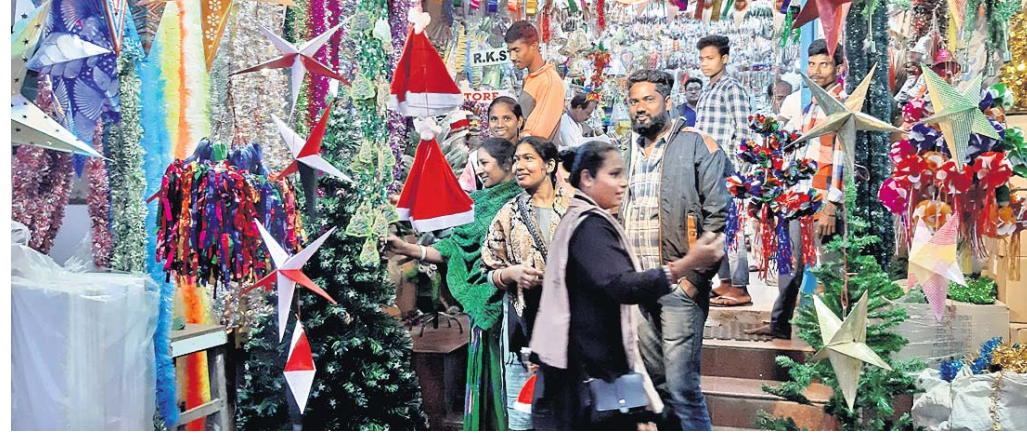
ବଡ଼ଦିନ ପାଇଁ ଦୋକାନରେ ଲୋକଙ୍କ ଭିଡ଼ ।

କ୍ରିସ୍ମାସକୁ ଆଉ ମାତ୍ର ଦୁଇ ଦିନ ବାକି । ଏଥିପାଇଁ ବଜାର ଏବେ ଚଳଚଞ୍ଚଳ । ସହର ଗଲିକନ୍ଦି ମଧ୍ୟ ଆଲୋକମାଳାରେ ସଜା ହୋଇଛି । ଖ୍ରୀଷ୍ଟ ଧର୍ମାବଲମ୍ବୀମାନଙ୍କ ଘର ରଙ୍ଗୀନ ଆଲୁଅରେ ଝଲୁଝଲି ସୋମାନଙ୍କ ଘର ସହ ଚର୍ଚ୍ଚରେ ବିଭିନ୍ନ ଆକାରର ତାରକା ଦେଖିବାକୁ ମିଳୁଛି । କ୍ରିସ୍ମାସ ସାଜସଜ୍ଜା ସାମଗ୍ରୀ ମିଳୁଥିବା ଦୋକାନରେ ଏବେ ଯଥେଷ୍ଟ ଭିଡ଼ ଜମୁଛି । କ୍ରିସ୍ମାସ ଟ୍ରି (ଗଛ), ବେଲ୍ ସହ ସାତାକୂଳ ପୋଷାକ ଜିଣିବାକୁ ଲୋକଙ୍କ ଭିଡ଼ ଜମୁଛି । ଖ୍ରୀଷ୍ଟ ଧର୍ମ ବିଶ୍ୱାସୀଙ୍କ ଘରେ ଘରେ ଏବେ କେନ୍ଦ୍ର ଆସି ଚାଲିଛି । କ୍ରିସ୍ମାସ ପାଇଁ ସନ୍ଧ୍ୟା ବଜାରରେ ବେଶ୍ ଭିଡ଼ ଜମୁଛି । ଚ ପାଇଁ ନୂତନ ପୋଷାକ କିଣା ଚାଲିଛି । ବିଗତ ବର୍ଷଠାରୁ ଚଳିତ ବର୍ଷ ଭଲ ବ୍ୟବସାୟ ହେଉଛି ବୋଲି ଜଣେ ବ୍ୟବସାୟ