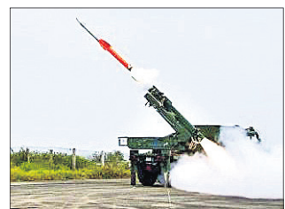
ବାଲେଶ୍ୱର ଅଫିସ, ୨୩।୧୨

ବାଲେଶ୍ୱର ଜିଲ୍ଲା ଚାନ୍ଦିପୁରସ୍ଥିତ ଆଇଟିଆର(ସମ୍ବନ୍ଧିତ ପରୀକ୍ଷଣ କେନ୍ଦ୍ର) ପରିସର ୩ ନମ୍ବର ଲକ୍ଷ୍ୟପାତ୍ରକୁ ପୂର୍ବାହ୍ନ ୧୧ଟା ୪୫ ମିନିଟରେ ସ୍ୱଳ୍ପ ଦୂରତାମାନ କୁମ୍ଭୀର-ଏସ୍ଏମ୍ ସେପାଟାସ୍ତର ପରୀକ୍ଷଣ କରାଯାଇଛି। ଏକ ଟ୍ରକରେ ଲାଗିଥିବା କାନିଷ୍ଠରୁ ଏହି ସେପାଟାସ୍ତରକୁ ଭୁସ୍ତରୁ ଆକାଶମାର୍ଗକୁ ନିକ୍ଷେପ କରାଯାଇଥିଲା। ଏହାର ଲକ୍ଷ୍ୟଭେଦ କ୍ଷମତା ୩୦ କି.ମି. ବୋଲି ତିଆରିତ (ପ୍ରତିରକ୍ଷା ବରଷଣା ଉତ୍ତରଣ ସଂପ୍ଳା)ପକ୍ଷରୁ କୁହାଯାଇଛି। ଏହା ଭାରତର ଆକାଶ ସାମାନ୍ୟତାପରୀକ୍ଷଣ କେନ୍ଦ୍ର। ଭାରତୀୟ ଆକାଶରେ ବିନା ଅନୁମତିରେ ପ୍ରବେଶ କରୁଥିବା ଶତ୍ରୁପକ୍ଷର ବିମାନ ଓ ସେପାଟାସ୍ତରକୁ ଏହା ଅବିକଳେ ଧ୍ୱଂସ କରିଦେବ। ଏହି ସେପାଟାସ୍ତର ଶତ୍ରୁପକ୍ଷର ରାଡାର, ଟ୍ୟାକ, ବକ୍ସର ଆଦିକୁ ଧ୍ୱଂସ କରିବାର କ୍ଷମତା ରଖିଛି ବୋଲି ତିଆରିତ ପକ୍ଷରୁ ସୂଚନା ମିଳିଛି।