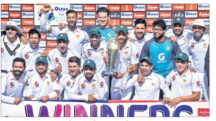
ଗ୍ରୁପ୍ ସହ ପାକିସ୍ତାନ ଖୋଜାଯିମାନେ।

କରାଚୀରେ ଚାଲିଥିବା ଶ୍ରୀଲଙ୍କା ବିପକ୍ଷ ଦ୍ୱିତୀୟ କ୍ରିକେଟ ଟେଷ୍ଟ ମ୍ୟାଚରେ ପାକିସ୍ତାନ ୨୬୩ ରନରେ ସହଜ ବିଜୟ ହାସଲ କରିଛି। ଏଥିସହ ଦଳ ଦୁଇ ମ୍ୟାଚ ବିଶିଷ୍ଟ ସିରିଜ ୧-୦ରେ ଜିତିନେଇଛି। ଘୋଷଣା ଅନୁସାରେ ୫ମ ଦିନର ଟେଷ୍ଟରେ ପାକିସ୍ତାନ ମାତ୍ର ୧୪ ମିନିଟ୍ ଓ ୧୬ ବଲ୍ ବିନିମୟରେ ମ୍ୟାଚ ଜିତି ନେଇଥିଲା। ଭ୍ରମଣକାରୀ ଦଳ ପୂର୍ବଦିନର ଅସମାପ୍ତ ସେରୀ ୨୧୨ରେ ଗୋଟିଏ ହେଲେ ରନ ଯୋଗ କରି ପାରି ନ ଥିବାବେଳେ ଏହାର ଅବଶିଷ୍ଟ ୩ ଉଇକେଟ