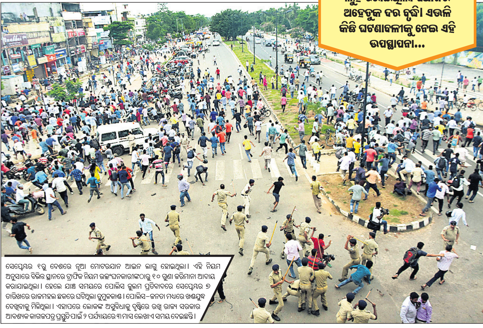
ସେପ୍ଟେମ୍ବର ୧୨ରୁ ଦେଶରେ ନୂଆ ମୋଟରଯାନ ଆଇନ ଲାଗୁ ହୋଇଥିଲା । ଏହି ନିୟମ ଅନୁସାରେ ବିଭିନ୍ନ ସ୍ଥାନରେ ଗ୍ରାମିକ ନିୟମ ଉଲ୍ଲଙ୍ଘନକାରୀଙ୍କଠାରୁ ୧୦ ଗୁଣା ଜରିମାନା ଆଦାୟ କରାଯାଇଥିଲା । ହେଲେ ଯାହା ସମୟରେ ପୋଲିସ କୁଳମ ପ୍ରତିବାଦରେ ସେପ୍ଟେମ୍ବର ୭ ତାରିଖରେ ରାଜମହଲ ଛକରେ ଘଟିଥିଲା ଚୁପୁଳକାଣ୍ଡ । ପୋଲିସ-ଜନତା ମଧ୍ୟରେ ଖଣ୍ଡଯୁଦ୍ଧ ଦେଖିବାକୁ ମିଳିଥିଲା । ଏହାପରେ ଲୋକଙ୍କ ଅସୁବିଧାକୁ ଦୃଷ୍ଟିରେ ରଖି ରାଜ୍ୟ ସରକାର ଆବଶ୍ୟକ କାରକପତ୍ର ପ୍ରସ୍ତୁତିପାଇଁ ୨ ପର୍ଯ୍ୟାୟରେ ୩ ମାସ ଲେଖାଏ ସମୟ ଦେଇଛନ୍ତି ।