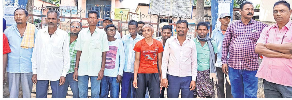
ପଞ୍ଚାୟତ କାର୍ଯ୍ୟାଳୟ ସମ୍ମୁଖରେ ଗ୍ରାମବାସୀ ଏକତ୍ର ହୋଇଛନ୍ତି ।

ରାୟଗଡ଼ା ଜିଲା ବିଷମ କଟକ ବ୍ଲକର ଚାଟିକୋଣା ସରପଞ୍ଚ ମନମୁଖୀ କାମ କରୁଥିବା ଅଭିଯୋଗରେ ସ୍ଥାନୀୟ ଲୋକେ ପଞ୍ଚାୟତ କାର୍ଯ୍ୟାଳୟରେ ତାଲା ପକାଇଛନ୍ତି । ପୋଲିସ ଉତ୍ତ୍ୟକ୍ତ ଲୋକଙ୍କୁ ବୁଝାଶୁଝା କରିଥିଲେ ସୁଦ୍ଧା କୌଣସି ସୁଫଳ ମିଳି ନ ଥିଲା । ମଙ୍ଗଳବାର ଏହାର ସମାଧାନ କରାଯିବ ।