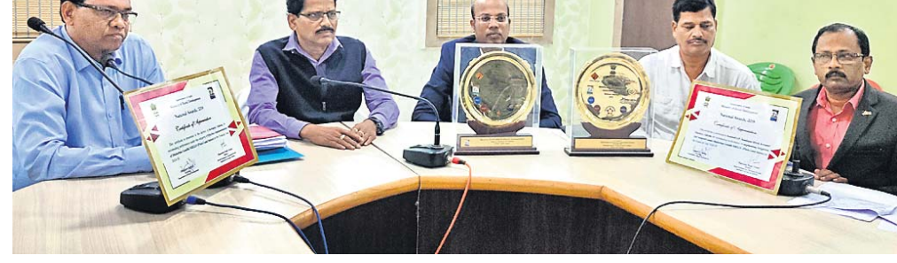
ଖବରଦାତା ସମ୍ମିଳନୀରେ ଜିଲାପାଳ ଓ ଅନ୍ୟମାନେ ।