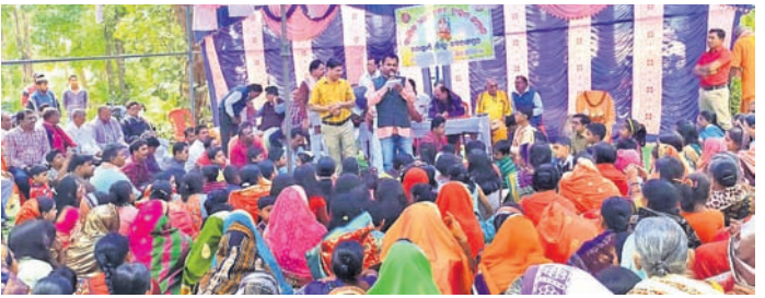
ଉପସ୍ଥିତ ବ୍ରାହ୍ମଣ ସମାଜର ସଦସ୍ୟା, ସଦସ୍ୟ।

ନବରଙ୍ଗପୁର ଜିଲ୍ଲା ଚନ୍ଦ୍ରାହାଣ୍ଡି ବ୍ଲକ ବ୍ରାହ୍ମଣ ସମାଜର ବନବିହାର କାର୍ଯ୍ୟକ୍ରମ ସୋମବାର ଅନୁଷ୍ଠିତ ହୋଇଯାଇଛି।