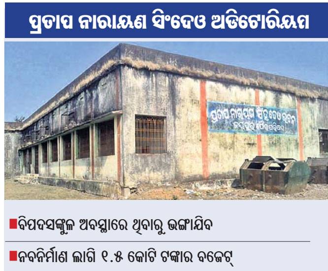
■ ବିପଦସଙ୍କୁଳ ଅବସ୍ଥାରେ ଥିବାରୁ ଉଦ୍‌ଘାଟିତ ■ ନବନିର୍ମାଣ ଲାଗି ୧.୫ କୋଟି ଟଙ୍କାର ବଜେଟ୍

କନ୍ୟପୁର ସହରରେ ଥିବା ପ୍ରତାପ ନାରାୟଣ ସିଂଦେଓ ଅତିଗୋରିୟମ ବିପଦସଙ୍କୁଳ ଅବସ୍ଥାରେ ରହିଛି। ପୌରପରିଷଦ ଏହାକୁ ଭାଙ୍ଗି ନୂତନ ତଥା ଅତ୍ୟାଧୁନିକ ଅତିଗୋରିୟମ ତିଆରି କରିବ। ଏଥିପାଇଁ ପ୍ରାୟ ୧ କୋଟି ୫୦ ଲକ୍ଷ ଟଙ୍କା ଖର୍ଚ୍ଚ କରାଯାଇ ଏହାକୁ ରାଜ୍ୟପ୍ରସାର ଅତିଗୋରିୟମରେ ପରିଣତ କରାଯିବ। ଏସି, ଉନ୍ନତ ସାଉଣ୍ଡ ସିଷ୍ଟମ, ଆକର୍ଷଣୀୟ ଚେୟାର ସହ ଅତିଗୋରିୟମ ସମ୍ମୁଖରେ ପାର୍କ ବ୍ୟବସ୍ଥା ପାଇଁ ପରିଷଦ ନିଷ୍ପତ୍ତି ନେଇଛି। ପୁରୁଣା ଅତିଗୋରିୟମ ରକ୍ଷଣାବେକ୍ଷଣ ଅଭାବରୁ ଦୟନୀୟ ହୋଇପଡ଼ିଛି। ପୁରୁଣା ଅଭାବରୁ ଏଠାକୁ