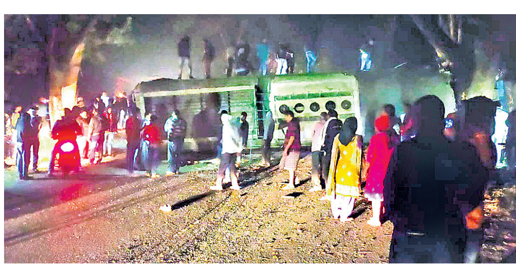
ଦୂର୍ଘଟଣାଗ୍ରସ୍ତ ବସ୍ତୁ ଛାତ୍ରାଛାତ୍ରୀମାନଙ୍କୁ ଉଦ୍ଧାର କରାଯାଇଛି।

ବିଗପହଣ୍ଡି, (ଡି.ଏ.ଏ.ଏ./) ପାଟ୍ଟପୁର, ୨୩।୧୨ ଗଞ୍ଜାମ-ଗଜପତି ଜିଲ୍ଲା ସୀମାନ୍ତ ପର୍ଯ୍ୟଟନ କ୍ଷେତ୍ର ତପ୍ତପାଣି ଘାଟିରେ ସୋମବାର ରାତି ପ୍ରାୟ ୮ଟାରେ ଏକ ପିକ୍ନିକ୍ ବସ୍ ଓଲଟି ପଡ଼ିବାକୁ ୩୫ରୁ ଊର୍ଦ୍ଧ୍ୱ ଛାତ୍ରାଛାତ୍ରୀ ଆହତ ହୋଇଛନ୍ତି। ସେମାନଙ୍କ ମଧ୍ୟରୁ ୧୯ ଜଣ ଗୁରୁତର ଅଛନ୍ତି। ପ୍ରକାଶ ଯେ, କଟକ ରେଭେନ୍ସା ବିଶ୍ୱବିଦ୍ୟାଳୟର ଏମ୍ସିଏ ବିଭାଗ ଛାତ୍ରାଛାତ୍ରୀମାନେ ପିକ୍ନିକ୍ କରିବା ପାଇଁ ଏକ ଘରୋଇ ବସ୍ (ନଂ.୦ ଆ ୦ ୨ ୧ ୩ ୧ ୩ ୧ ୩ ୧ ୩ ୧) ରେ ତପ୍ତପାଣିକୁ ଆସିଥିଲେ। ପିକ୍ନିକ୍ ସାରି ସମସ୍ତେ ବସ୍ରେ ବୁଲୁଥିବା ବେଳେ କଟକ ଅଭିଯୁକ୍ତ ଫୋର୍ସ୍‌ସ୍ତ୍ରୀ ବେଳେ ତପ୍ତପାଣି ଘାଟିରେ ବସ୍ଟି ନିୟନ୍ତ୍ରଣ ହରାଇ ରାସ୍ତାକଡ଼କୁ ଓଲଟି ପଡ଼ିଥିଲା।