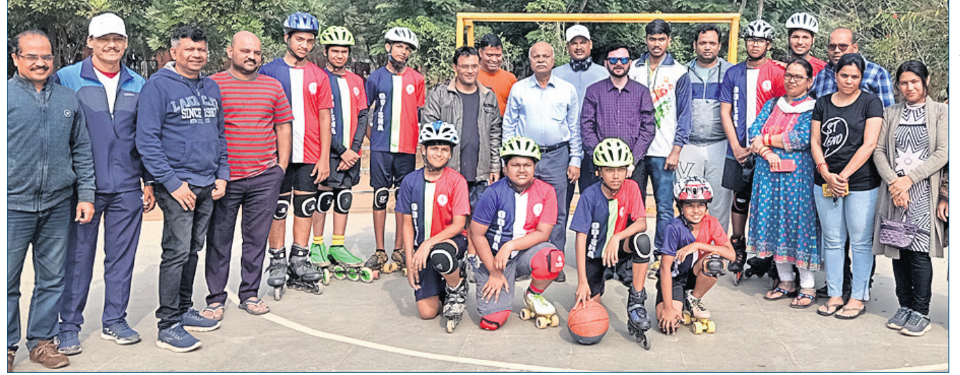
ସମ୍ବନ୍ଧିତ ହେବା ଅବସରରେ ଅତିଥି ଓ କର୍ମଚାରୀଙ୍କ ଗହଣରେ ଓଡ଼ିଶା କ୍ରିକେଟ୍ ଆସୋସିଏସନ୍ ଦଳର ଖେଳାଳିମାନେ ।

ଏବଂ ୫୦ ଓଭର ଫର୍ମାଟ ପାଇଁ ଅଧିନାୟକ ମନୋଜିତ କରାଯାଇଛି। ଭାରତ ଦିନିକିଆ ଦଳ ନ୍ୟୁଜିଲାଣ୍ଡରେ ଦୁଇ ମ୍ୟାଚ ବିପକ୍ଷରେ ଖେଳିବାର କାର୍ଯ୍ୟକ୍ରମ ରହିଛି।