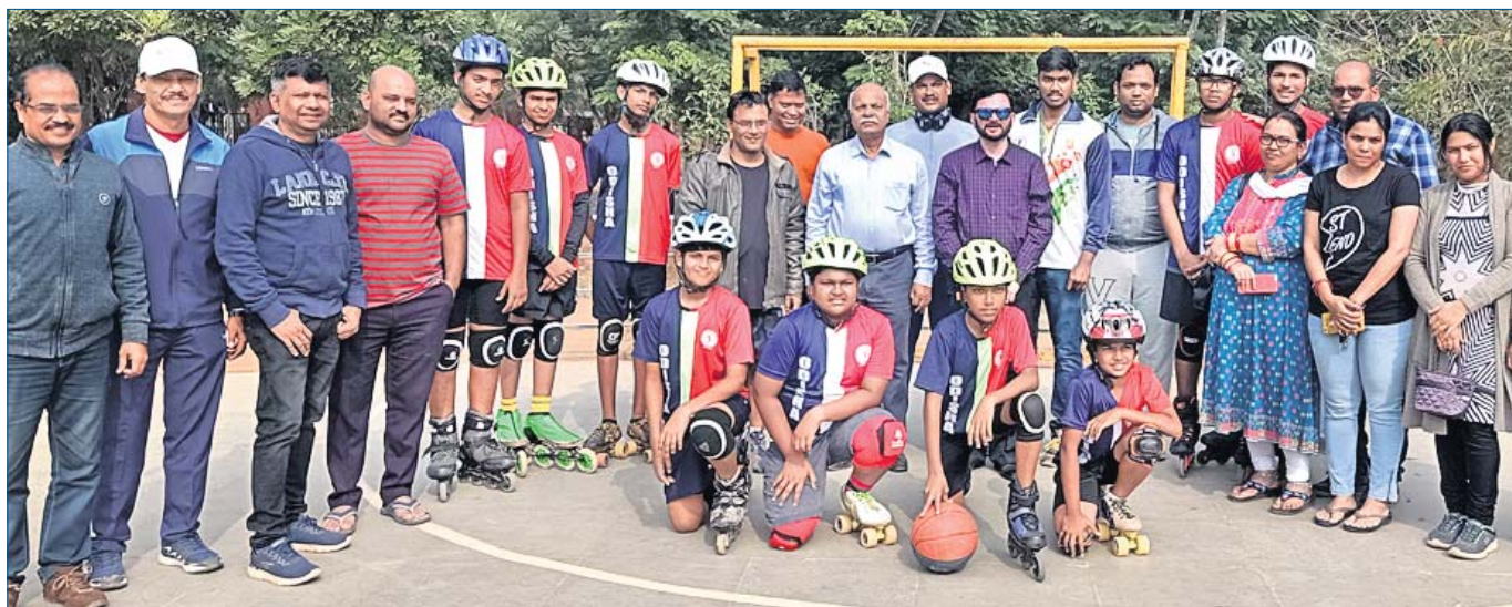
ସମର୍ଥନ ହେବା ଅବସରରେ ଅତିଥି ଓ କର୍ମକର୍ତ୍ତାଙ୍କ ସହ ଉଡ଼ିଶା ଛୁନିୟର ରୋଲ୍‌ବଲ୍ ଦଳର ଖେଳାଳିମାନେ ।

ଫ୍ରେଜିଂ‌ସନଠାରେ ଫେବୃୟାରୀ ୨ରୁ ଏବଂ ବିତାୟ ନ୍ୟାଟ କ୍ରିକେଟ୍‌ଠାରେ ଫେବୃୟାରୀ ୨୯ରୁ ଖେଳାଯିବାର କାର୍ଯ୍ୟକ୍ରମ ରହିଛି ।