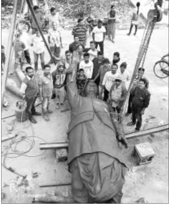
ନିର୍ମାଣ ହୋଇଥିବା ବାଜପେୟାଙ୍କ କାଂସ୍ୟମୂର୍ତ୍ତି।

ନୟାଗଡ଼ ଜିଲ୍ଲା ଖଣ୍ଡପଡ଼ା ବ୍ଲକ ଅନ୍ତର୍ଗତ କଣ୍ଡଲୋ ଅଞ୍ଚଳର ଏକ କାରିଗର ସଂଘା ଭାରତର ପୂର୍ବତନ ପ୍ରଧାନମନ୍ତ୍ରୀ ଅଟଳ ବିହାରୀ ବାଜପେୟାଙ୍କ ୧୪ ଫୁଟ ଉଚ୍ଚତା ବିଶିଷ୍ଟ ଏକ କାଂସ୍ୟ ପ୍ରତିମୂର୍ତ୍ତି ନିର୍ମାଣ କରିଛନ୍ତି।