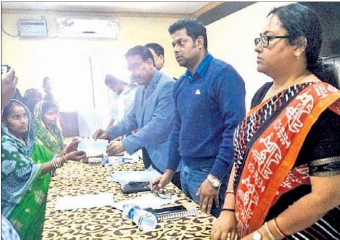
ଜିଲାପାଳ ଜଣେ ମହିଳାଙ୍କୁ ସହାୟତା ରାଶିର ଚେକ ପ୍ରଦାନ କରୁଛନ୍ତି।