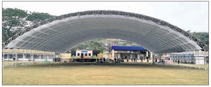
ଜିଲା ମହୋତ୍ସବ ପାଇଁ ପ୍ରସ୍ତୁତ ରହିଥିବା ପଡ଼ିଆ।