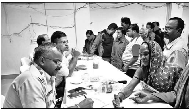
ଶିବିରରେ ପ୍ରଶାସନିକ ଅଧିକାରୀମାନେ ଅଭିଯୋଗ ଶୁଣାଣି କରୁଛନ୍ତି।

ମହାକାଳପଡ଼ା ବ୍ଲକ୍ ସଭାଗୃହରେ ଜିଲାପାଳ ଓ ଏସ୍‌ପିଙ୍କ ମିଳିତ ଜନଶୁଣାଣି ଯୋଗଦାନ ଅନୁଷ୍ଠିତ ହୋଇଯାଇଛି।