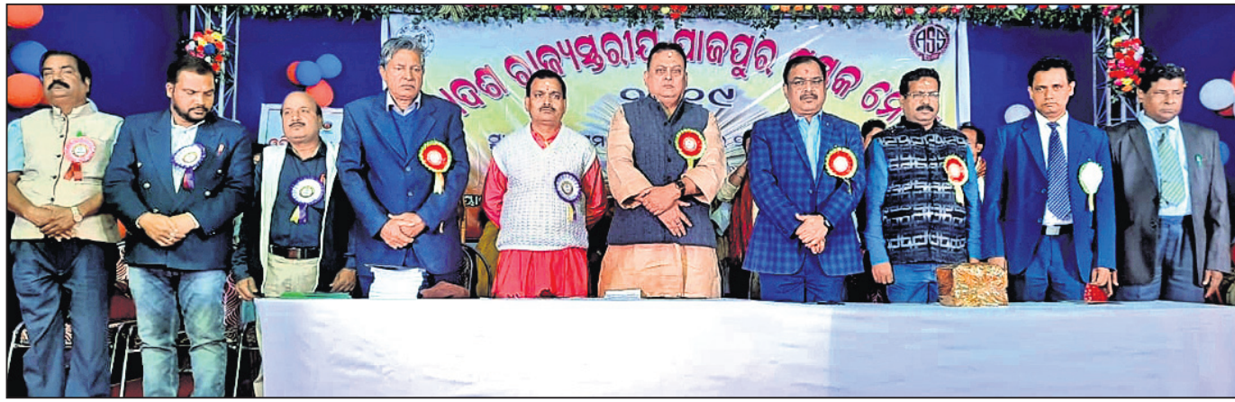
ପୁସ୍ତକ ମେଳା ଉଦ୍‌ଘାଟନ ଉତ୍ସବରେ ଉପସ୍ଥିତ ଅତିଥିମାନେ