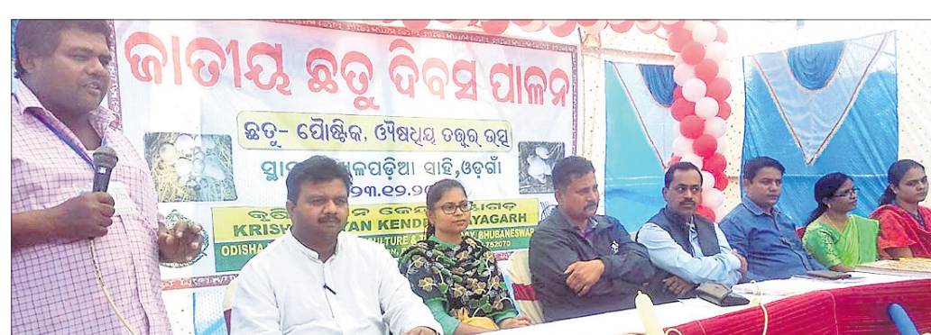
ଜିଲାପ୍ରଧାନୀ ଛତୁଚାଷୀ ସମ୍ମିଳନୀ

ଓଡ଼ିଶା, ୨୩.୧୨ (ସ୍ୱ.ପ୍ର.): ସମ୍ପ୍ରତି ଛତୁ ଏକ ପ୍ରମୁଖ ଖାଦ୍ୟ ସାମଗ୍ରୀ ହିସାବରେ ସମଗ୍ର ଗ୍ରହଣୀୟ ହୋଇପାରିଛି। ଦିନ ଥିଲା ଏହା କେବଳ ରତ୍ନ ଅନୁସାରେ ଉପଲବ୍ଧ ହେଉଥିଲା।