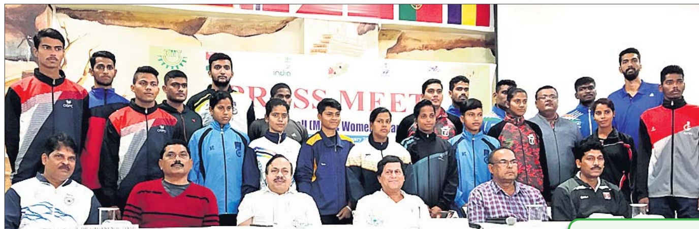
ଖବରଦାତା ସମ୍ମିଳନୀରେ ଆୟୋଜକ କମିଟି କର୍ମକର୍ତ୍ତାଙ୍କ ଗହଣରେ ଓଡ଼ିଶା ଭଲିବଲ ଦଳର ଖେଳାଳିମାନେ।

ଓଡ଼ିଶାରେ ପ୍ରଥମଥର ପାଇଁ ଆୟୋଜନ ହେବାକୁ ଯାଉଛି ଜାତୀୟ ସିନିୟର ଭଲିବଲ (ମହିଳା, ପୁରୁଷ) ପ୍ରତିଯୋଗିତା। ପ୍ରତିଯୋଗିତାର ଏହି ୬୮ତମ ସଂସ୍କରଣ କିଏ ଇନ୍ଡୋର ଷ୍ଟାଡ଼ିୟମରେ ଅନୁଷ୍ଠିତ ହେବ।