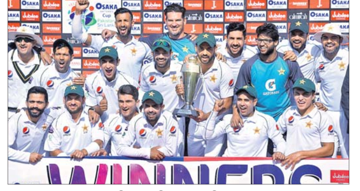
ଟ୍ରଫି ସହ ପାକିସ୍ତାନ ଖେଳାଳିମାନେ।

କରାଚୀରେ ଚାଲିଥିବା ଶ୍ରୀଲଙ୍କା ବିପକ୍ଷ ଦ୍ୱିତୀୟ କ୍ରିକେଟ ଟେଷ୍ଟ ମ୍ୟାଚରେ ପାକିସ୍ତାନ ୨୬୩ ରନରେ ସହଜ ବିଜୟ ହାସଲ କରିଛି।