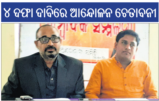
୪ ଦିନ ଧରି ଆନ୍ଦୋଳନ ଚେତାବନୀ

ନୟାଗଡ଼ ଭାଷା ଆନ୍ଦୋଳନ ସମିତି ପକ୍ଷରୁ ଯୋଗଦାନ ଗ୍ରହଣ କରିବା ପାଇଁ ପ୍ରକାଶ ପାଇଥିଲା। ଆଗାମୀ ଦିନରେ ସେମାନେ ଏଥିରୁ ବିରତ ନ ହେଲେ ଆନ୍ଦୋଳନ ଜୋରଦାର କରିବେ ବୋଲି ସମିତି ଚେତାବନୀ ଦେଇଛି।