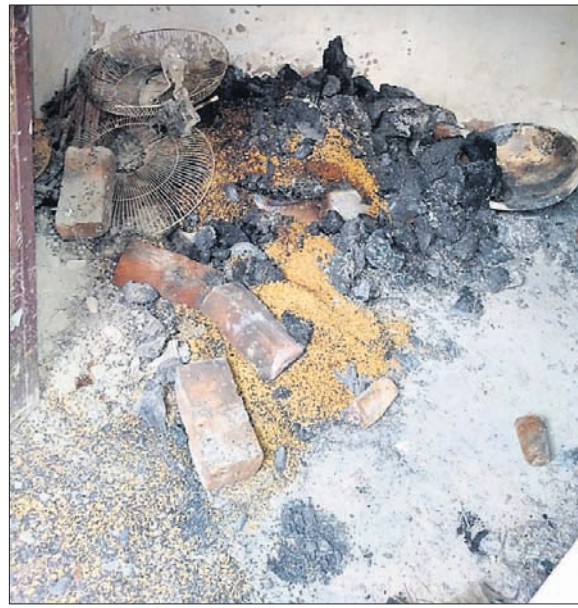
ଅଗ୍ନିକାଣ୍ଡରେ ପୋଡ଼ିଯାଇଥିବା ସାମଗ୍ରୀ।

ଗଣିଆ, ୨୩।୧୨(ଡି.ଏନ.ଏ.) ସାମଗ୍ରୀ ଥିବାବେଳେ ଷ୍ଟୋରରୁ ଲୁହା ଗ୍ରାହକର ତାଲା ପଡ଼ିଥିଲା । ଷ୍ଟୋର ରୁମ ନିକଟରେ କୌଣସି ରୋଷେଇ ଘର ନ ଥିବାବେଳେ ଶର୍ଦ୍ଦୂଳରୁ ମଧ୍ୟ କୌଣସି ଅଗ୍ନିକାଣ୍ଡ ଘଟି ନ ଥିବା ଜଣାପଡ଼ିଛି ।