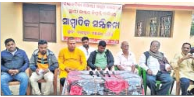
ଖବରଦାତା ସମ୍ମିଳନୀରେ ବିଭିନ୍ନ ସଂଗଠନର କର୍ମକର୍ମୀମାନେ ।