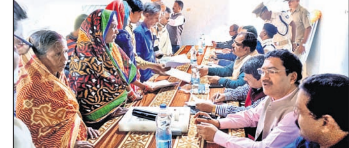
ଶିବିରରେ ଅଧିକାରୀମାନେ ଅଭିଯୋଗର ଶୃଙ୍ଖଳା କରୁଛନ୍ତି ।

କୋରେଇ ବୁକ୍ ସଭାଗୃହରେ ଯୋଗାବାର ଯାଜପୁର ଜିଲ୍ଲାପାଳ ଓ ଏସପିଏ ମିଳିତ ଜନଶୃଙ୍ଖଳା ଶିବିର ଅନୁଷ୍ଠିତ ହୋଇଯାଇଛି । ଏହି ଶିବିରରେ ମୋଟ ୩୫୮ଟି ଅଭିଯୋଗ ପଞ୍ଜୀକୃତ କରାଯାଇଥିଲା ।