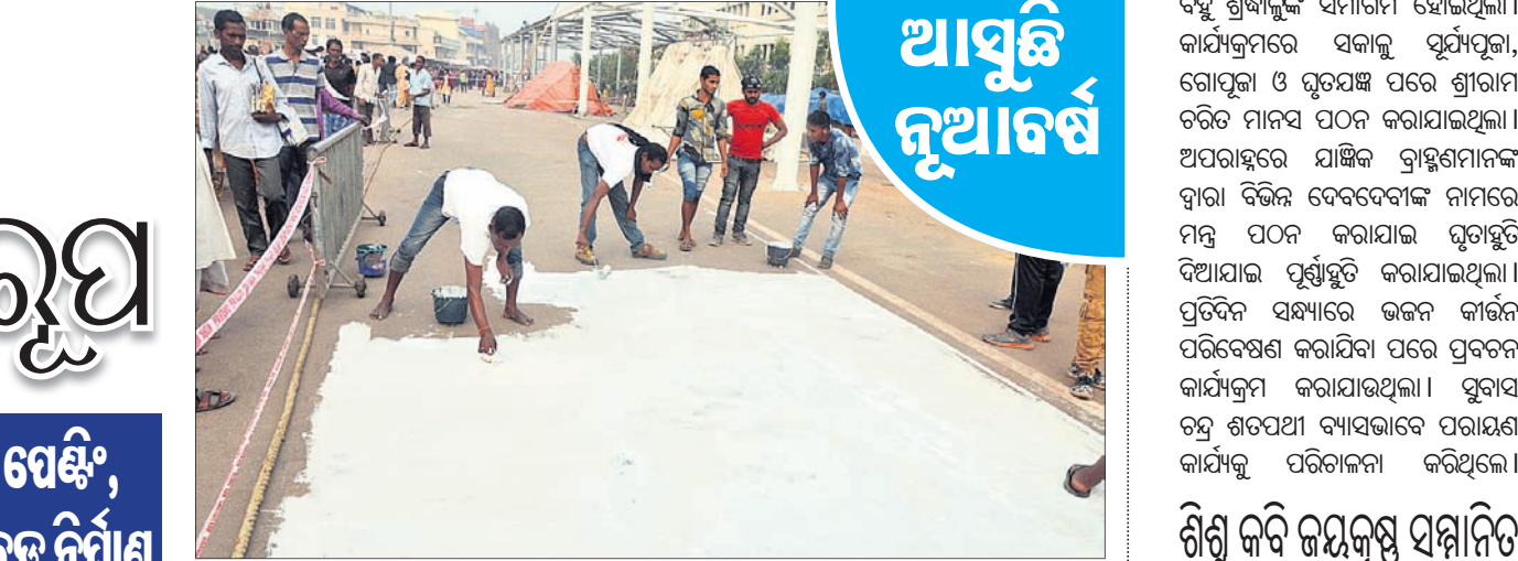
ଶ୍ରୀମନ୍ଦିର ସମ୍ମୁଖ ବଡ଼ଦାଣ୍ଡ ରଙ୍ଗ କରାଯାଉଛି।

ପୁରୀ ଅଫିସ, ୨୩.୧୨ ଆରମ୍ଭ ହେଲା ପେଣ୍ଟିଂ, ଟାଲିକି ବ୍ୟାରିକେଡ ନିର୍ମାଣ ବଦଳୁଛି ଶ୍ରୀକ୍ଷେତ୍ରୀ ବଡ଼ଦାଣ୍ଡ ହେଉ ଅବା ସିଂହଦ୍ୱାର କିମ୍ବା ବେଳାଭୂମି ସବୁକୁ ଧାରେ ଧାରେ ସଜାଇ ଦିଆଯାଉଛି।