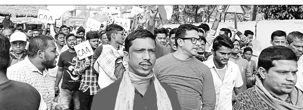
ରାଜନଗର ସୁରକ୍ଷା ମଞ୍ଚ ସଦସ୍ୟ ଶୋଭାଯାତ୍ରାରେ ଯାଉଛନ୍ତି।